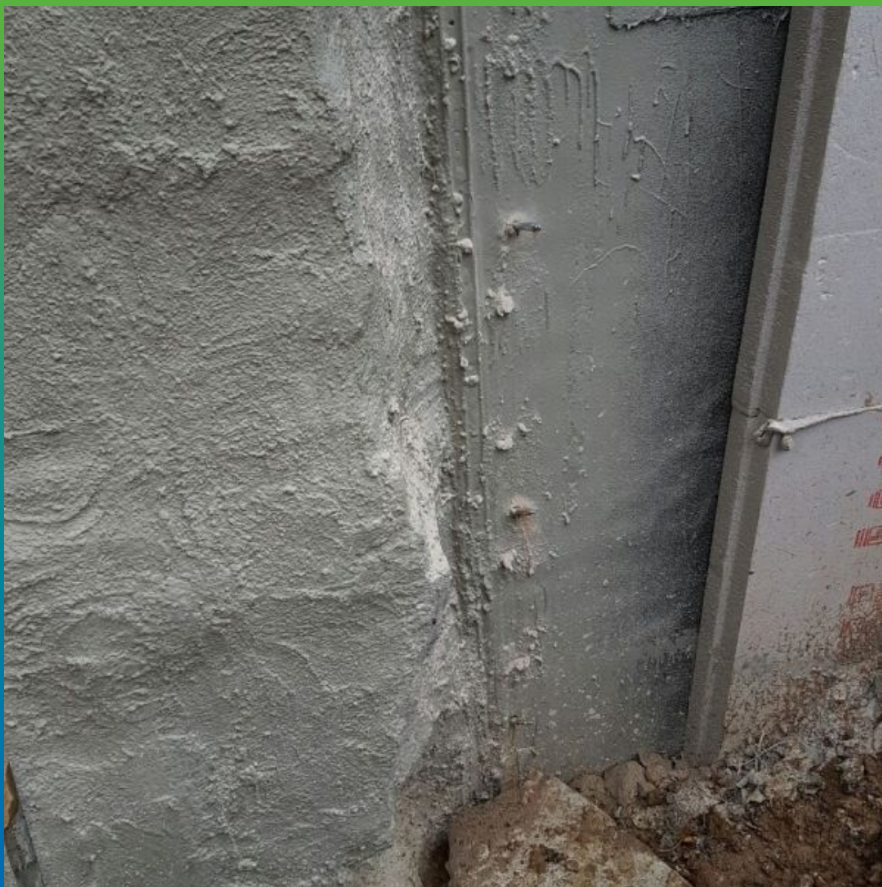
Гидроизоляция стен фундамента с локальным инъектированием