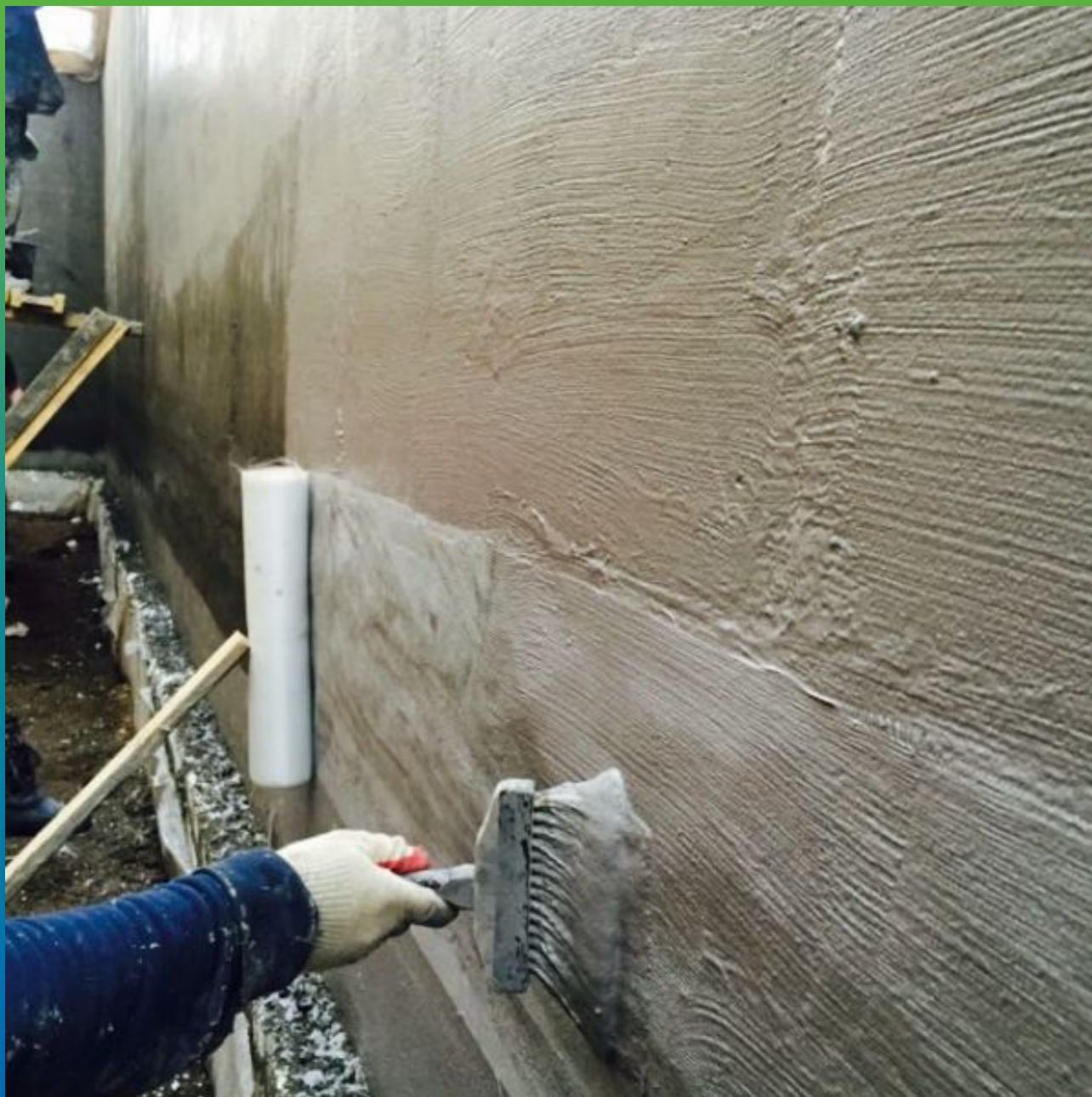
Нанесение Максил Флекс