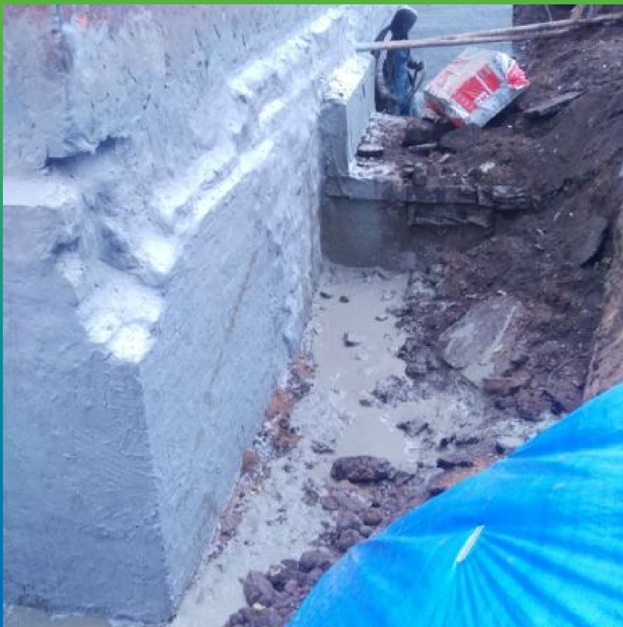
Вид фундамента после нанесения Максил Флекс