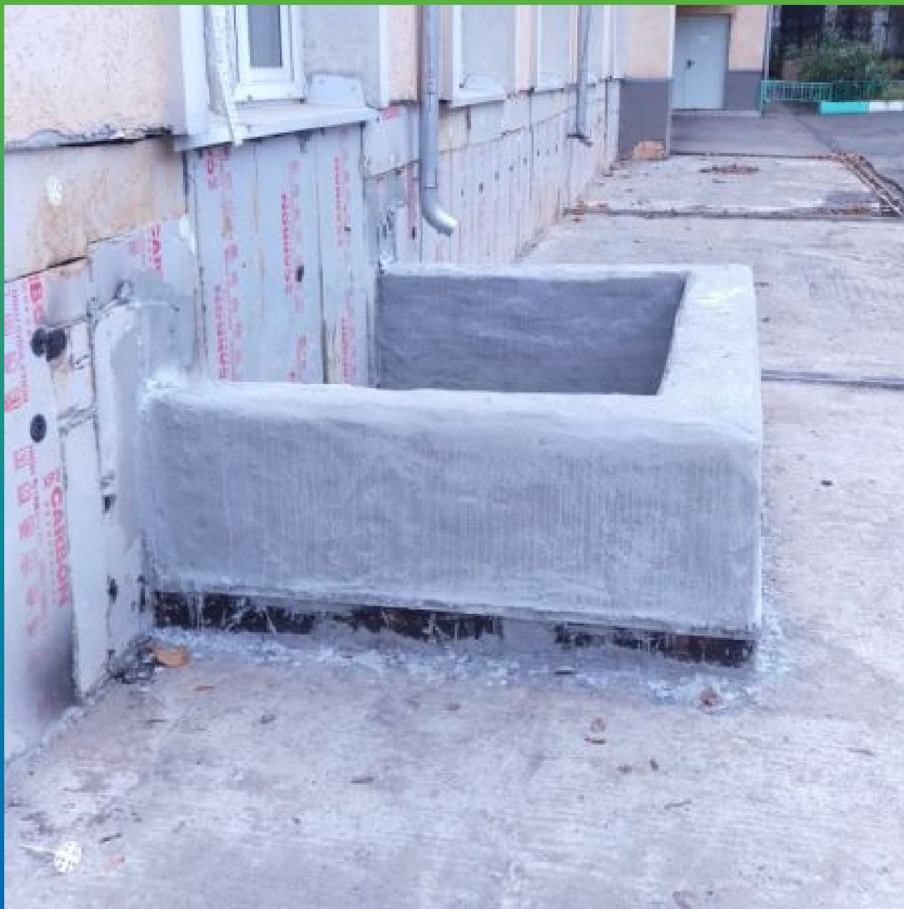
Гидроизоляция стен прямка окна цокольного этажа