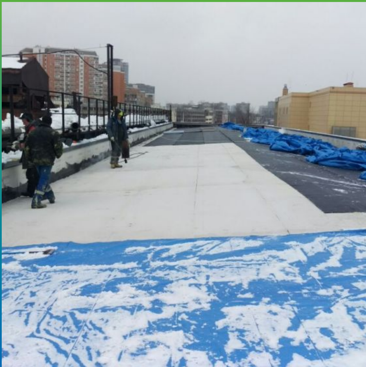
Уборка снега перед монтажом мембраны