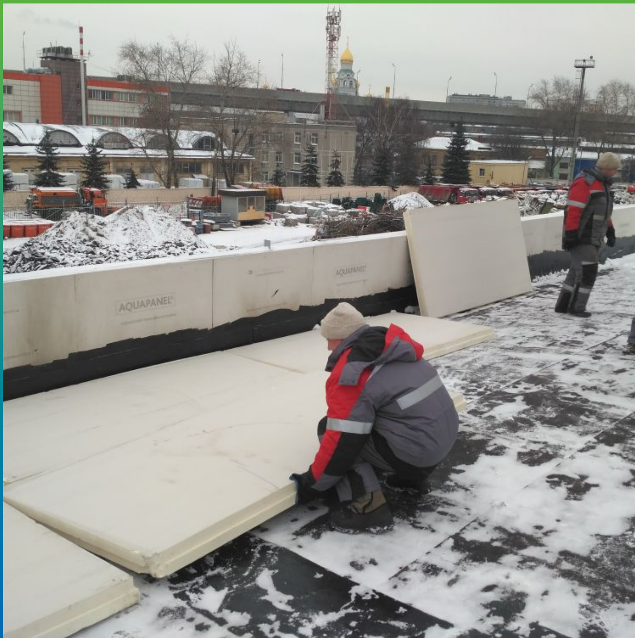
Уборка снега и монтаж теплоизоляционного слоя