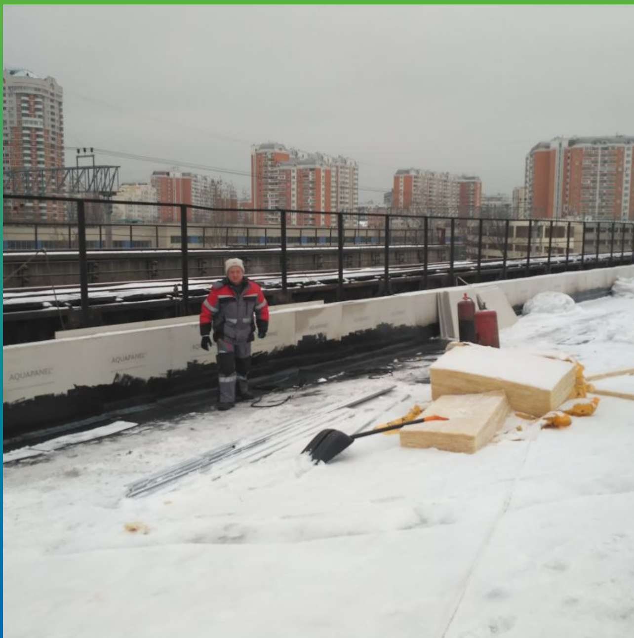
Уборка снега и монтаж теплоизоляционного слоя