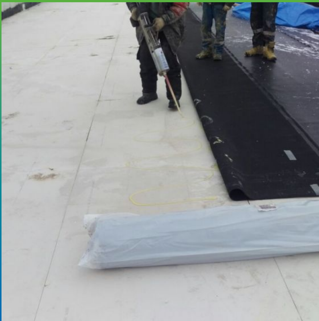
Монтаж мембраны Суперсил клеевым методом