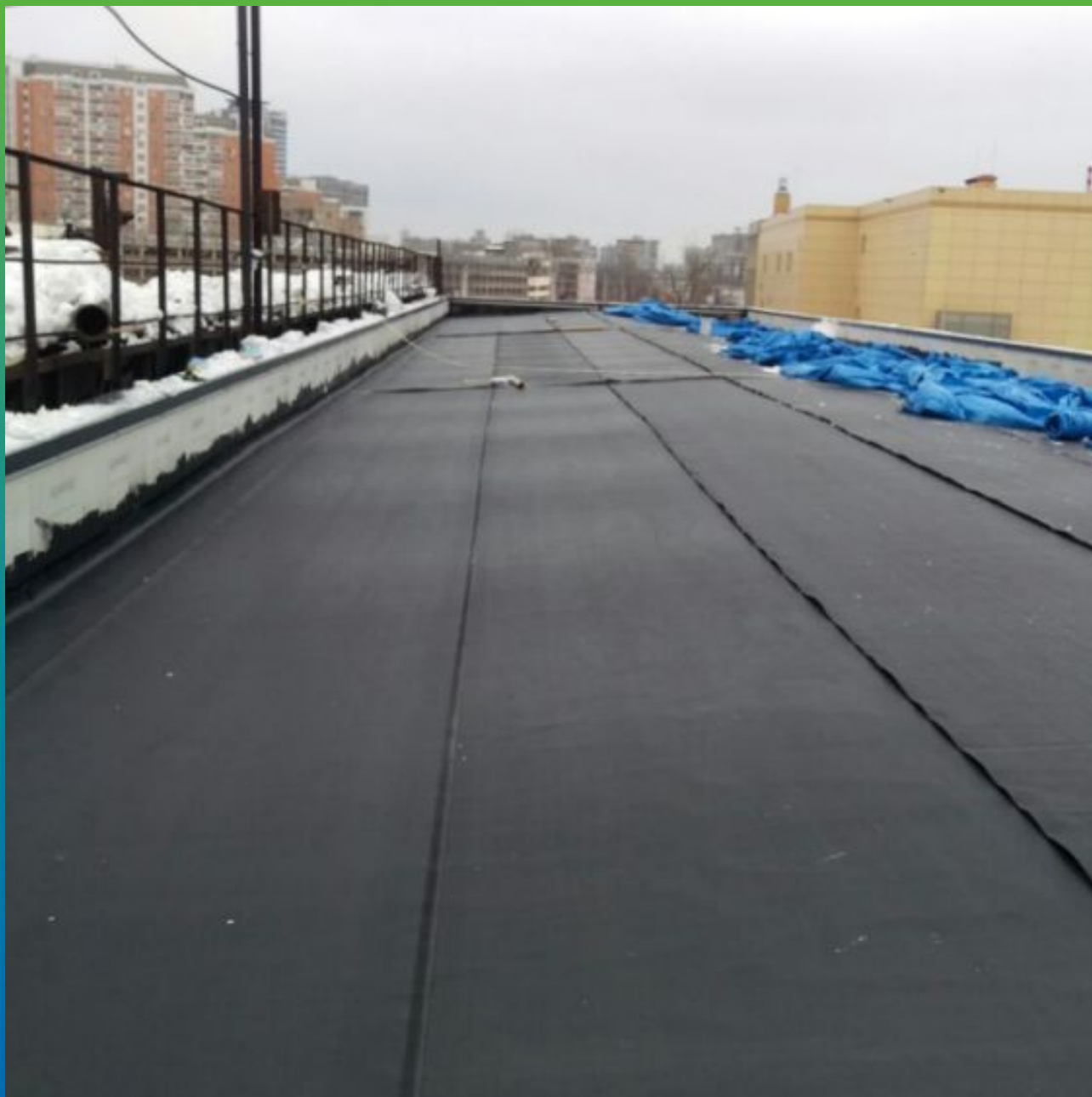
Монтаж мембраны Суперсил