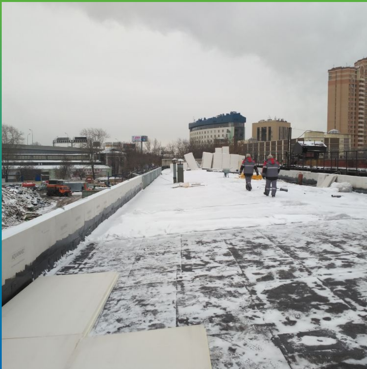
Уборка снега и монтаж теплоизоляционного слоя