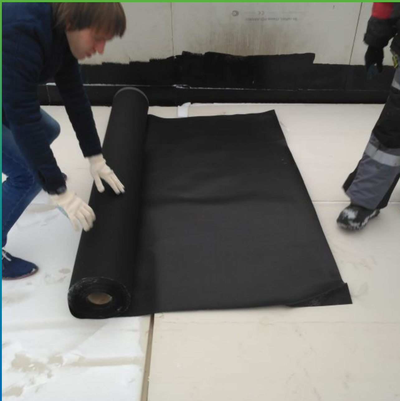
Монтаж мембраны Суперсил