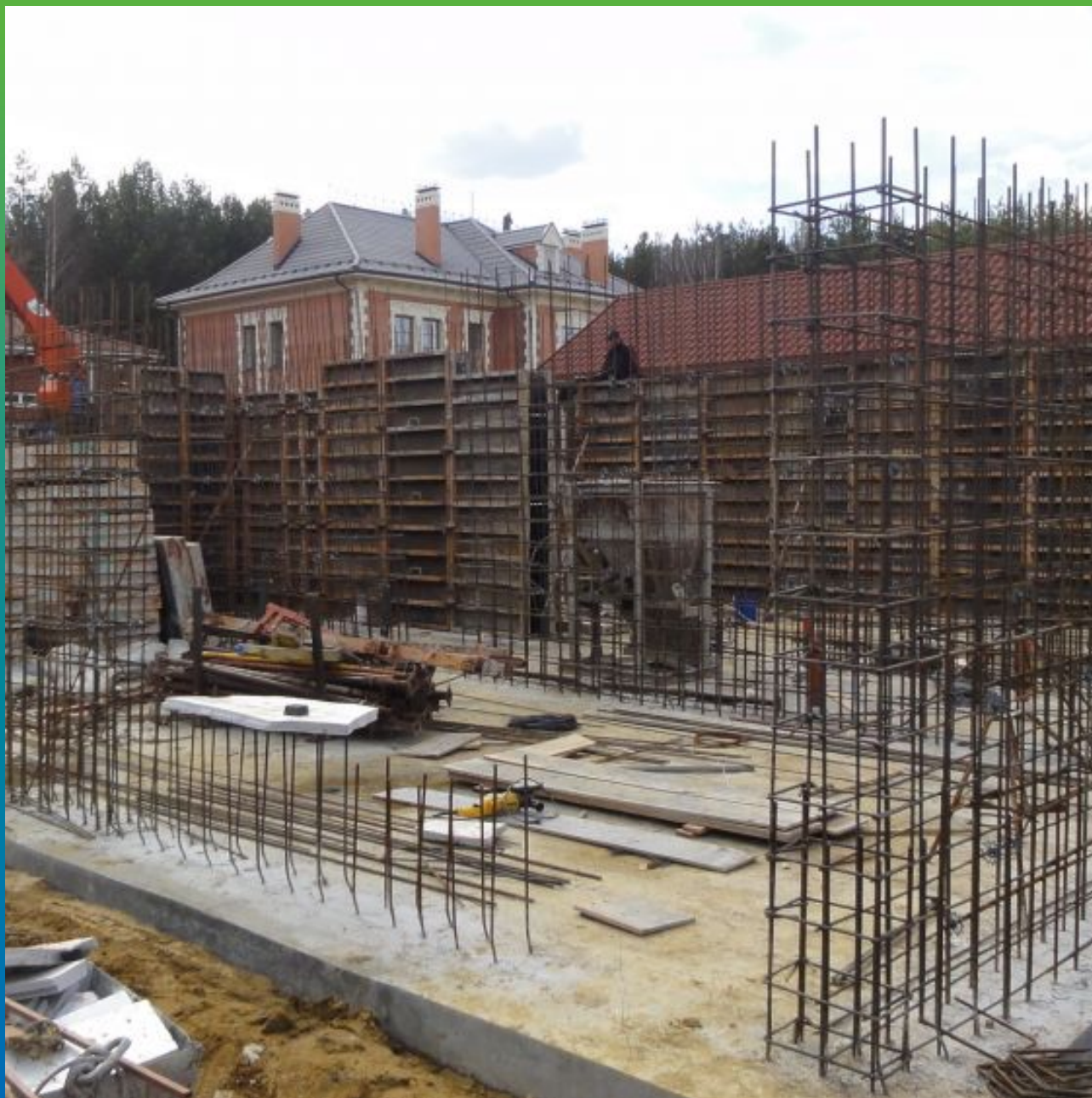
Первоначальный вид рабочего шва