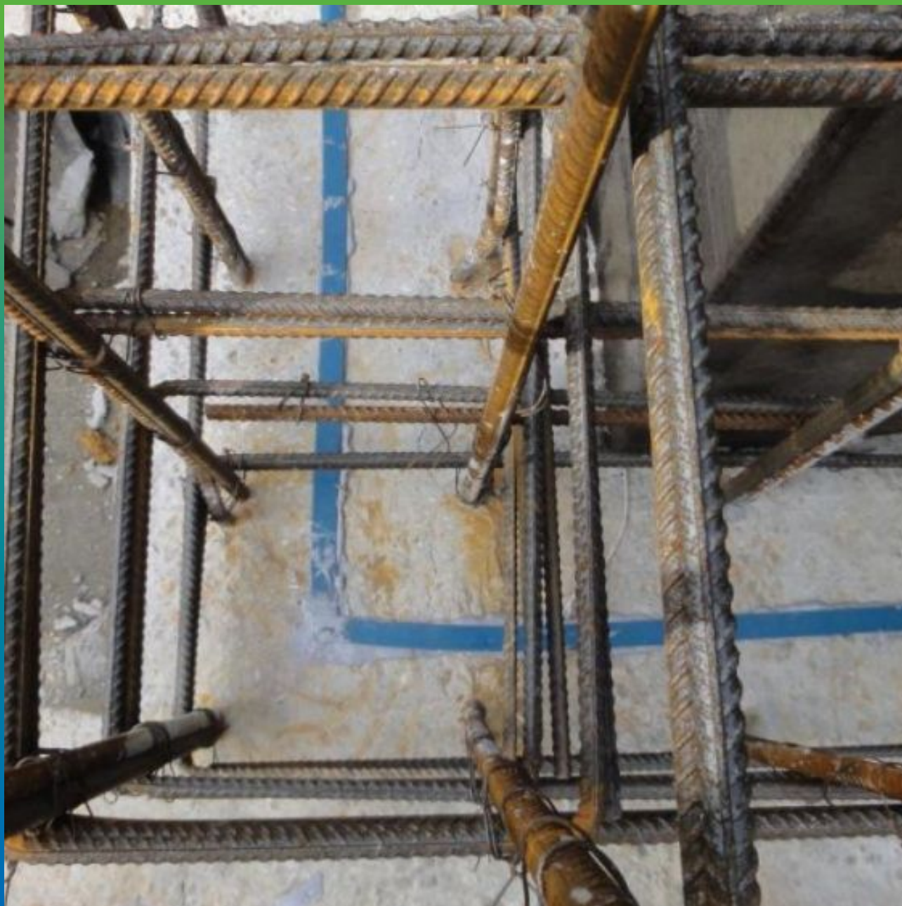
Вид стыковки профиля Манодил Свелл при помощи расширяющегося герметика Манодил Свеллмастер