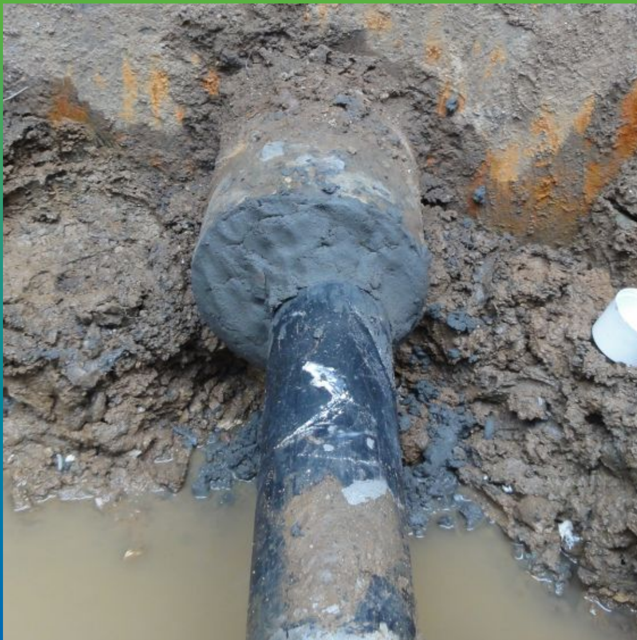
Финальный вид ввода коммуникаций