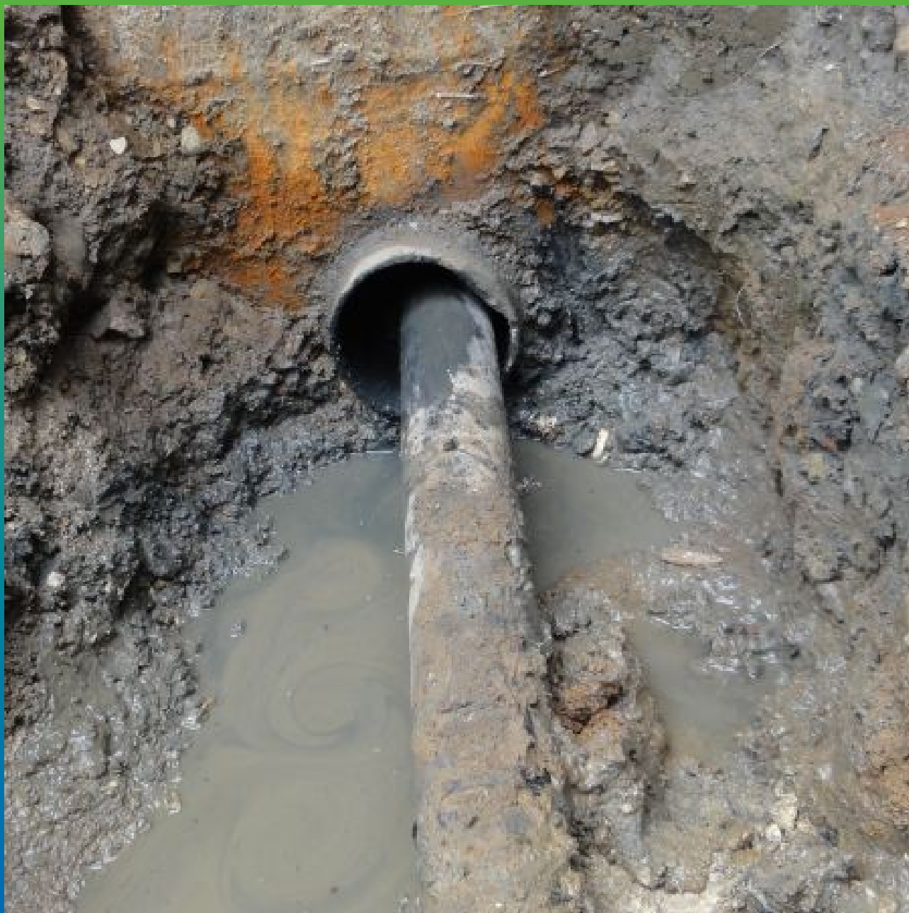
Первоначальный вид ввода