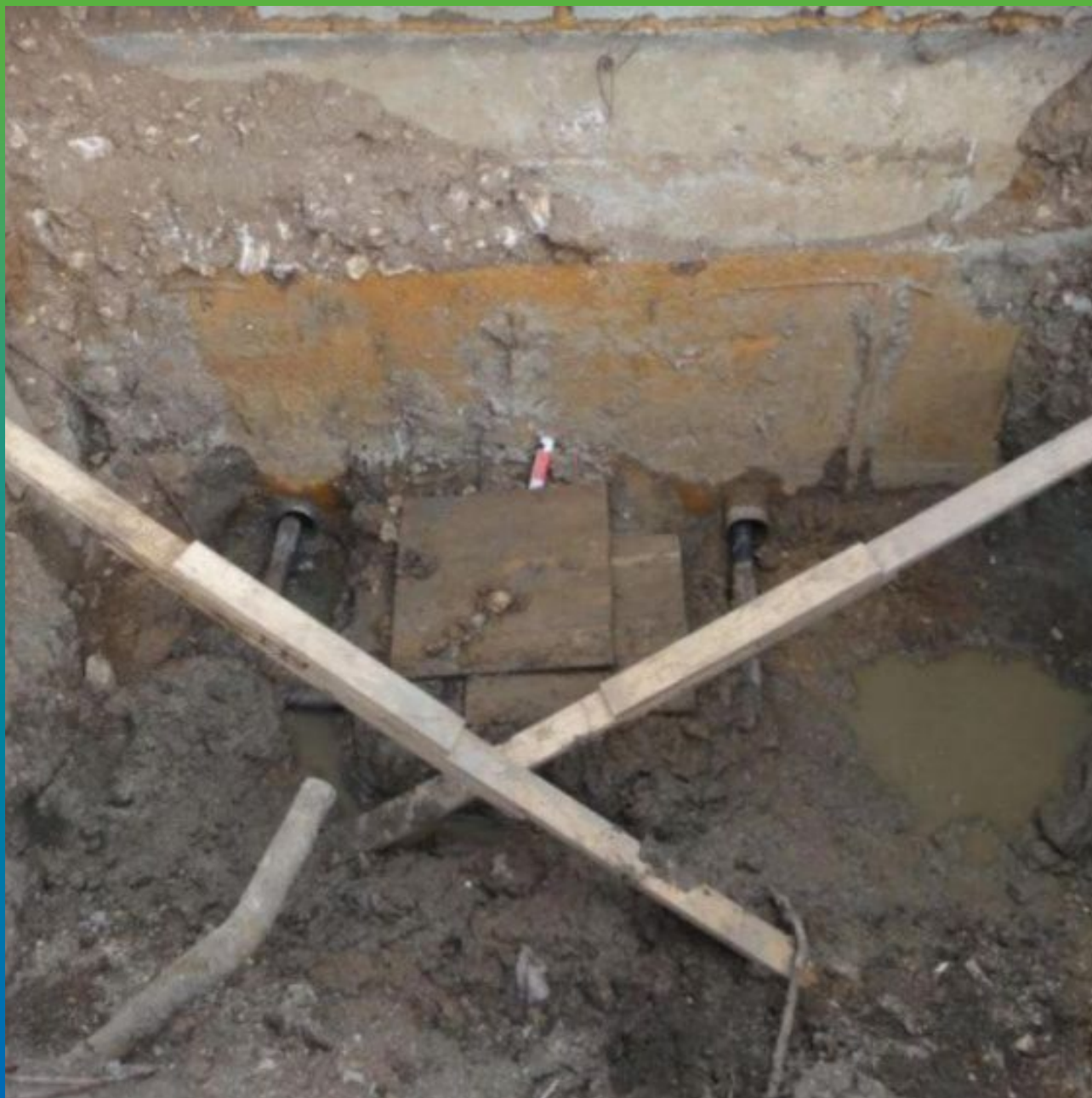
Первоначальный вид площадки