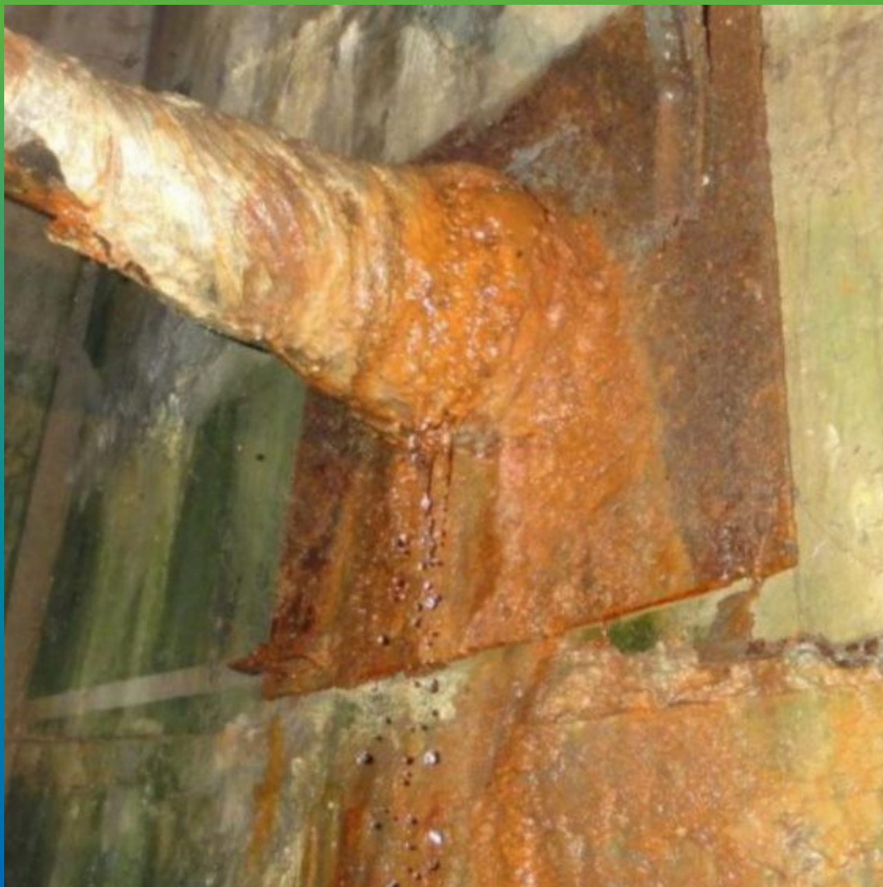
Вид протечек через ввод коммуникаций