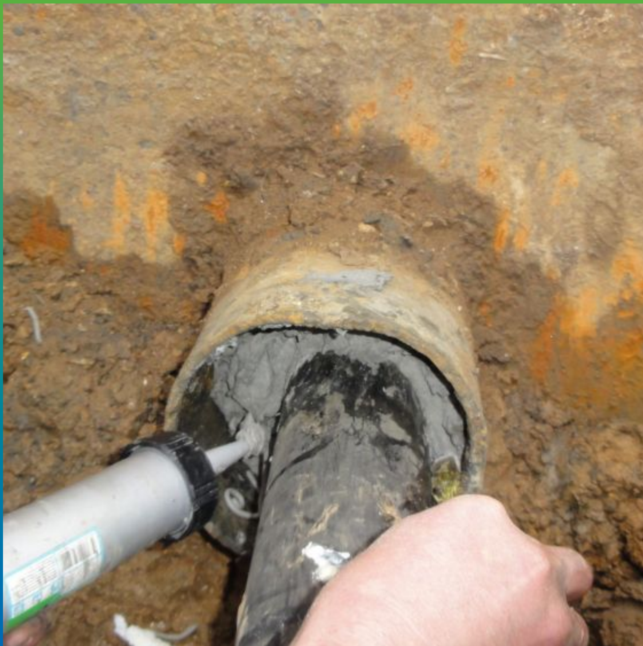
Нанесение герметика Витрафин Флекс