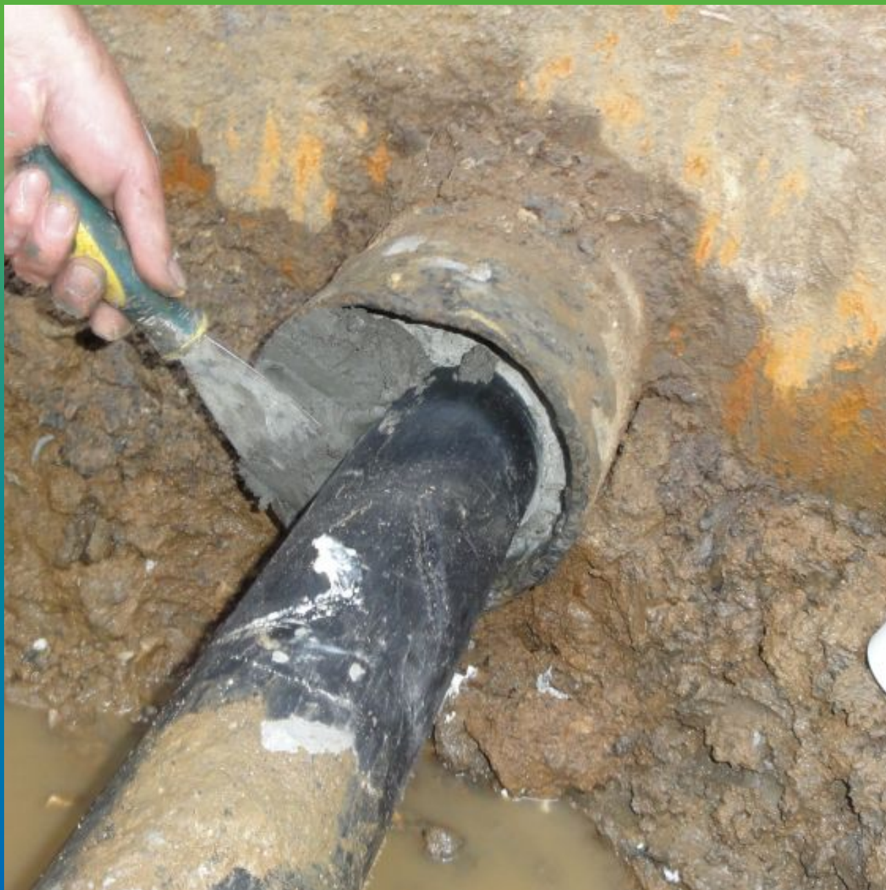
Зачеканка ремонтным составом Стармекс РМЗ