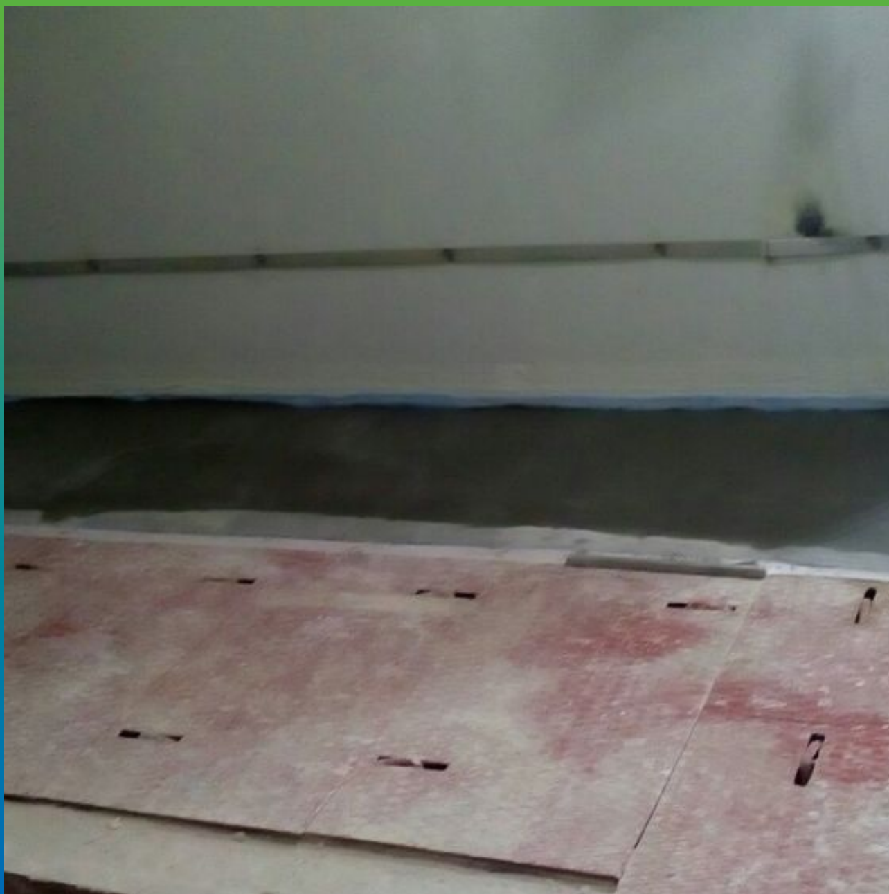
Готовый вид объекта после монтажа высокопрочной стяжки Стармекс Флоу