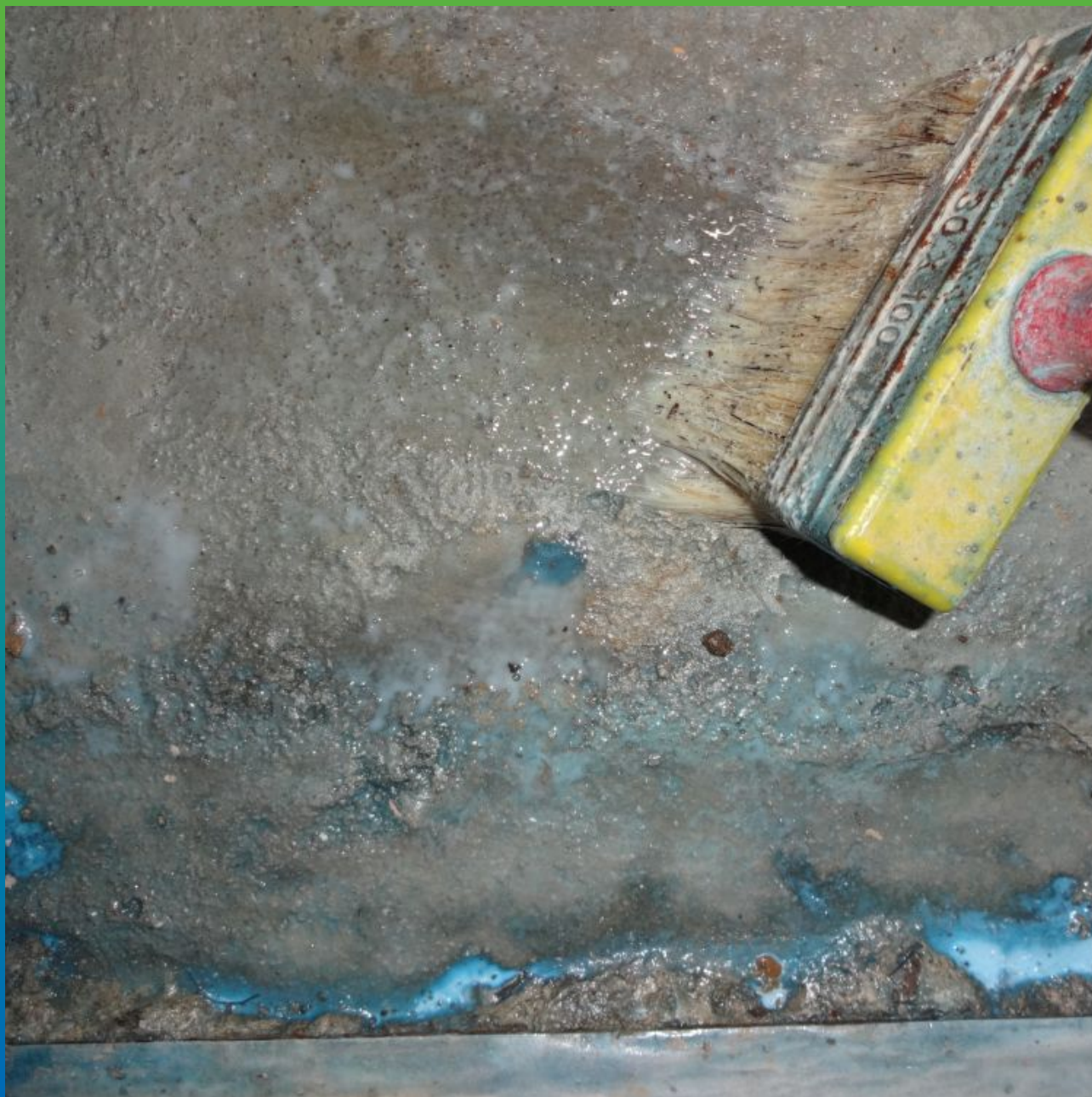
Нанесение на подготовленное основание грунтовки Манокрил Бонд