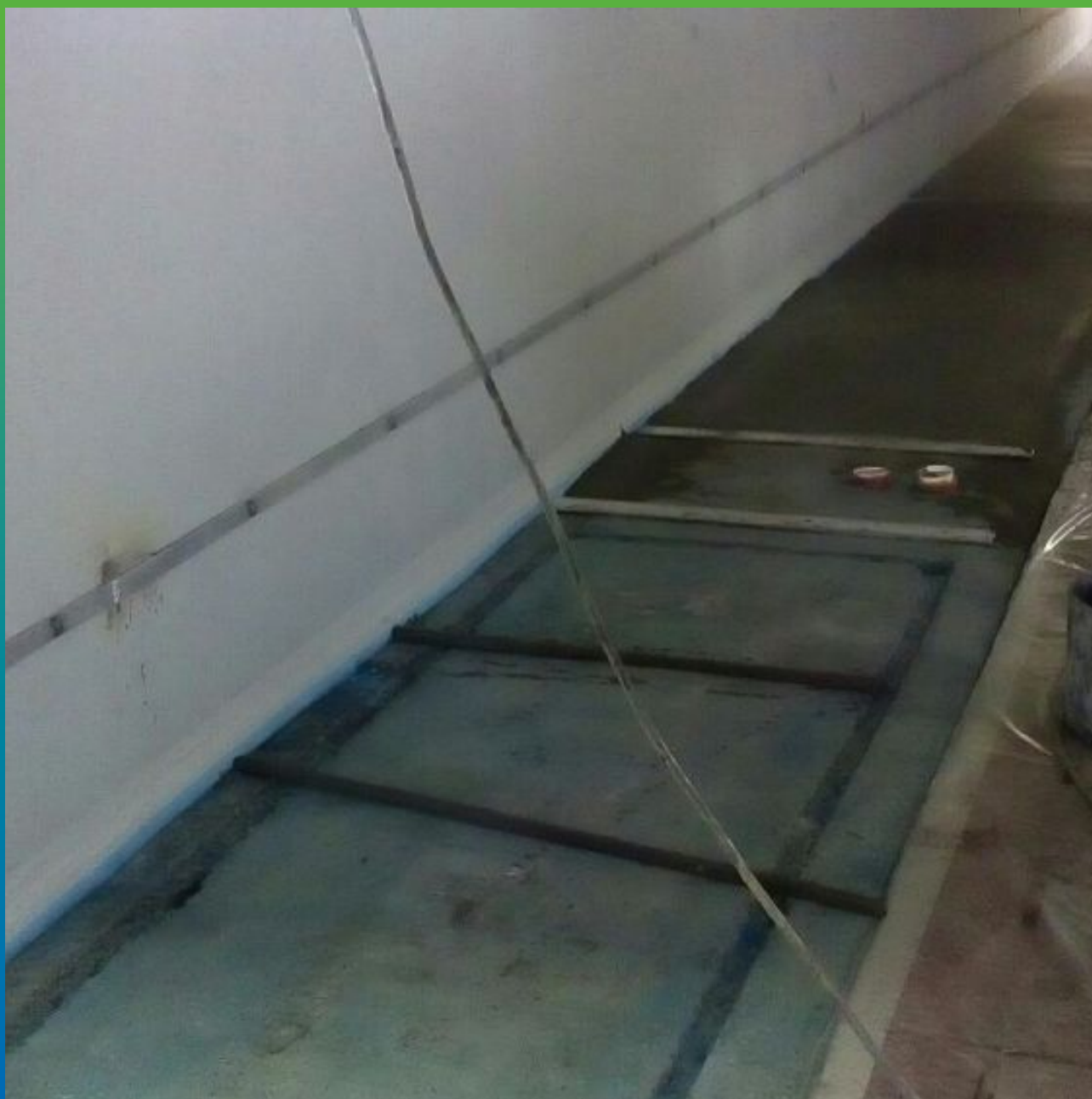
Загрунтованное основание Манокрил Бонд под высокопрочную стяжку Стармекс Флоу