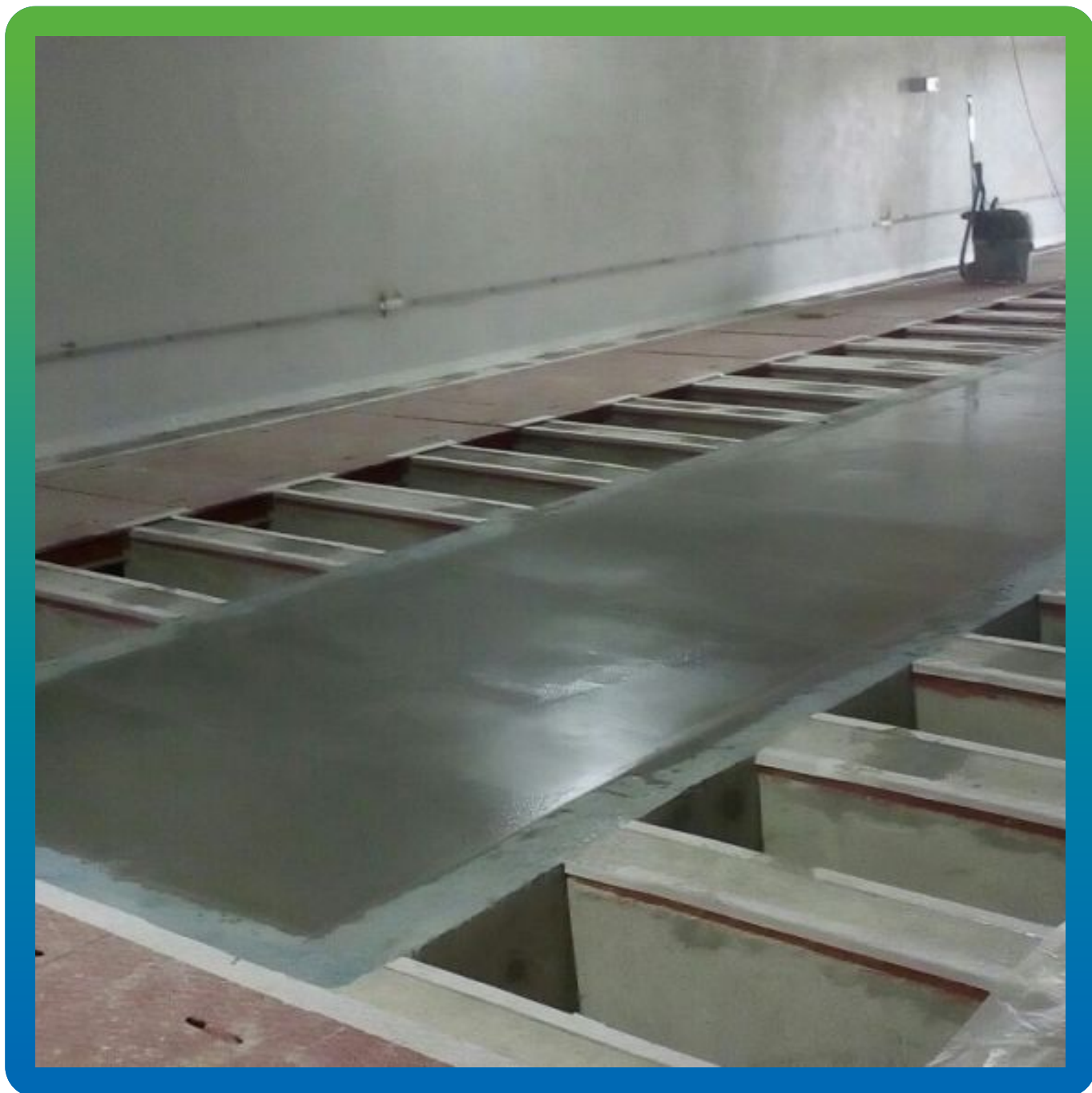
Готовый вид объекта после монтажа высокопрочной стяжки Стармекс Флоу