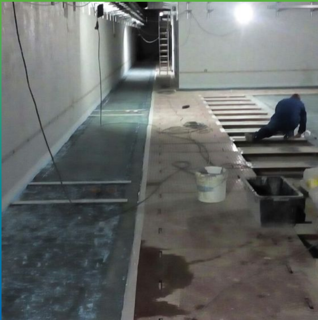
Загрунтованное основание Манокрил Бонд под высокопрочную стяжку Стармекс Флоу