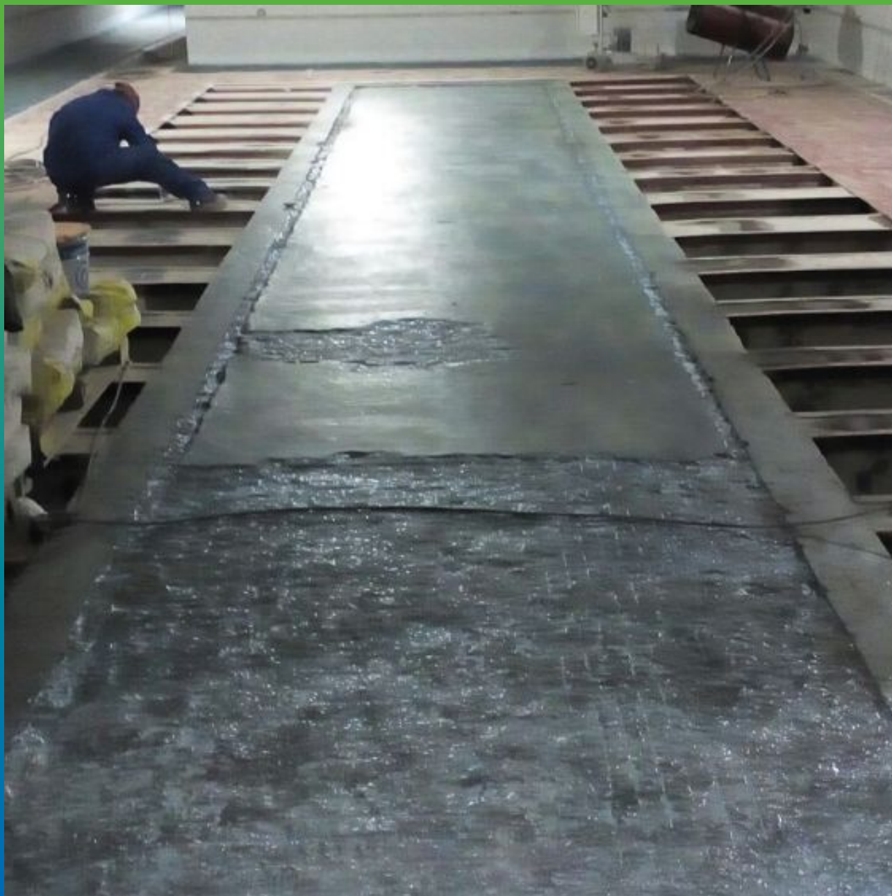
Загрунтованное основание Манокрил Бонд под высокопрочную стяжку Стармекс Флоу