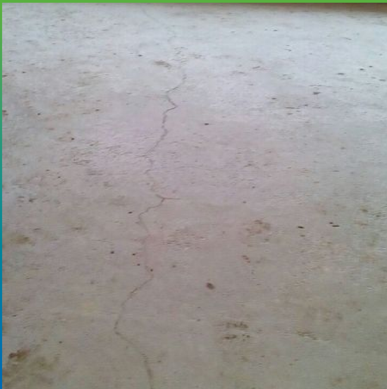
Трещина в основании плиты фундамента