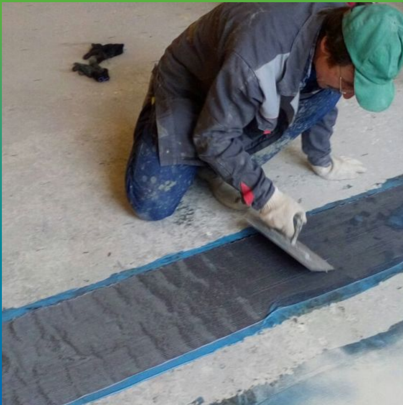
Разглаживание углеродного холста Армошел KB 200