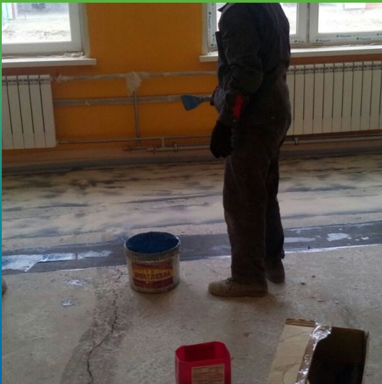
Пропитка эпоксидным клеем Манопокс 183 углеродного холста Армошел КВ 200