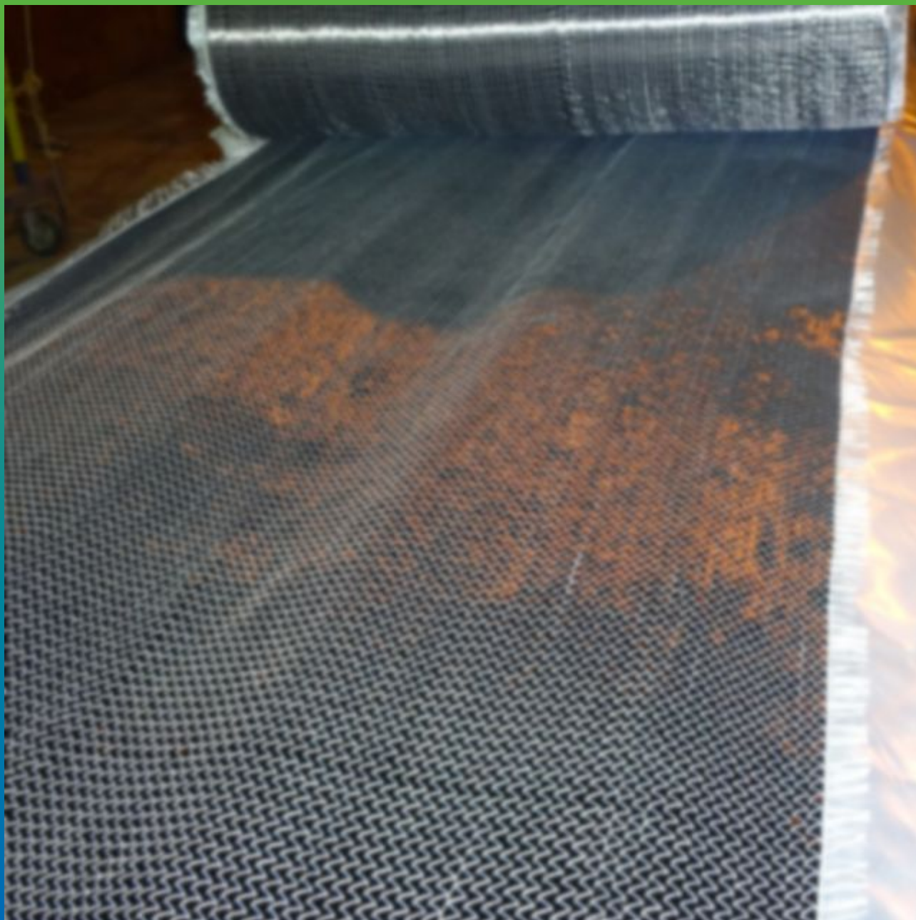
Раскрой под размеры углеродного холста Армошел KB 200