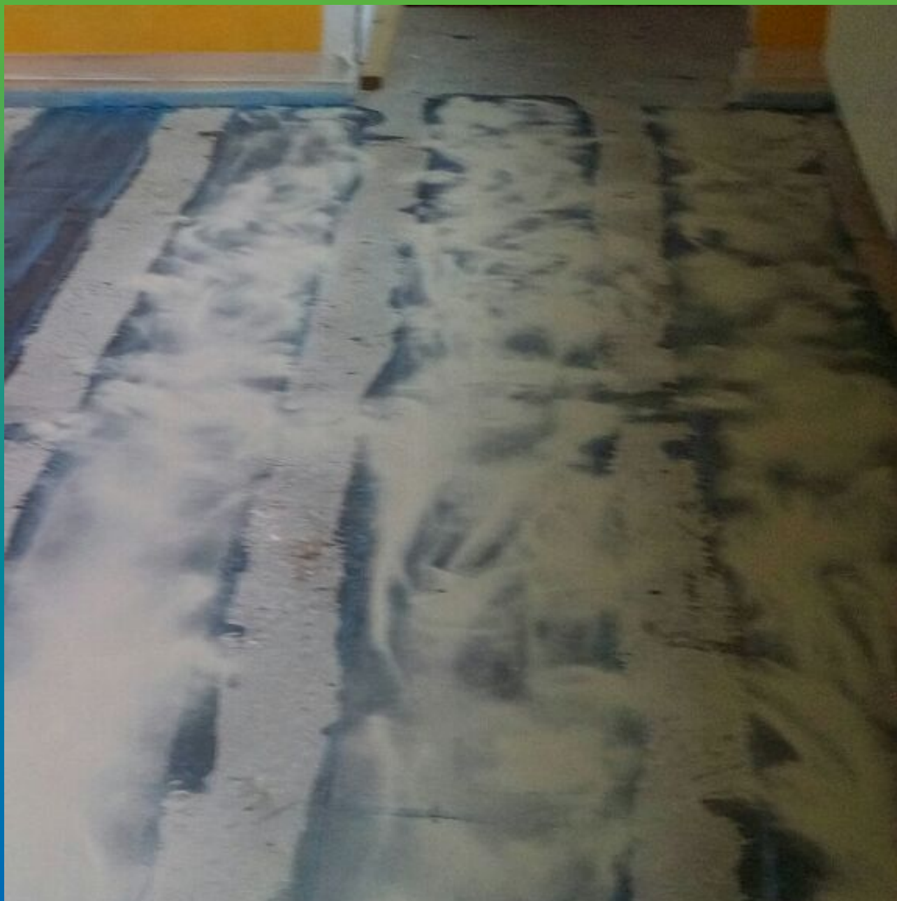
Нанесение укрывающего слоя ДенсТоп Филлер