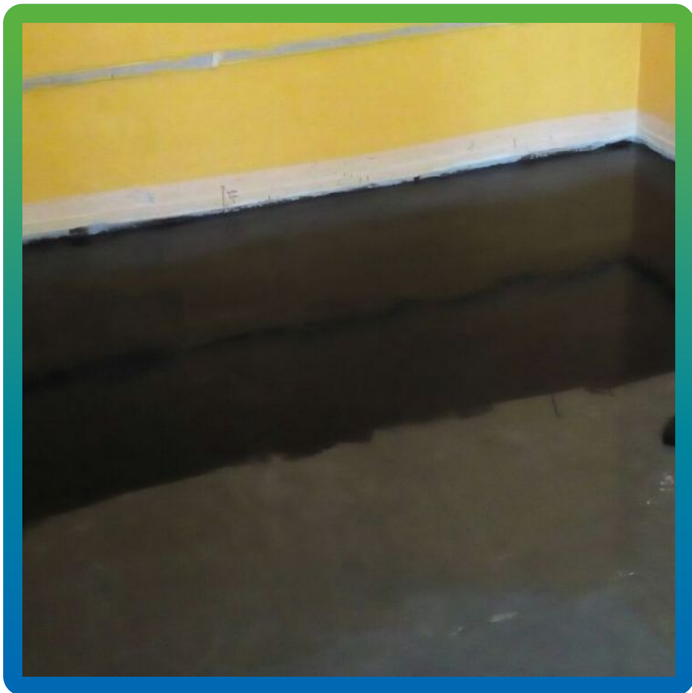
Нанесение токопроводящего грунта ДенсТоп ЭП 105 АС