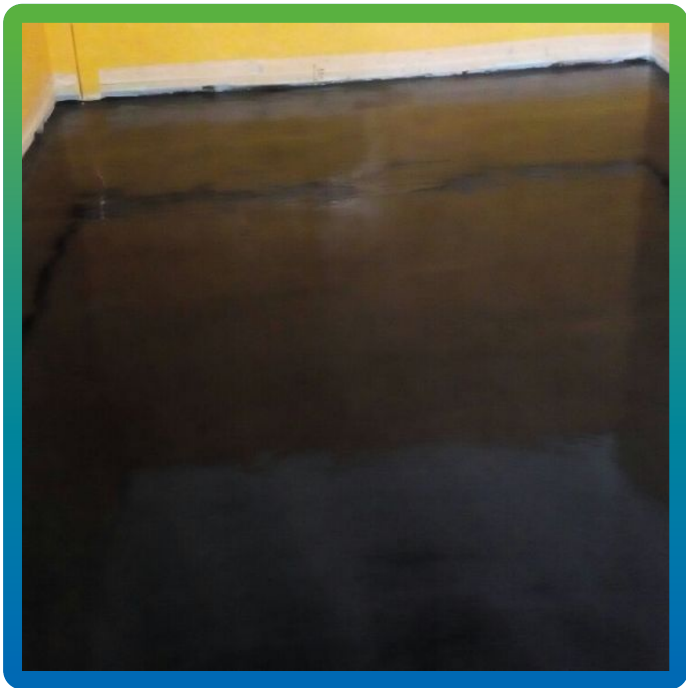
Нанесение токопроводящего грунта ДенсТоп ЭП 105 АС