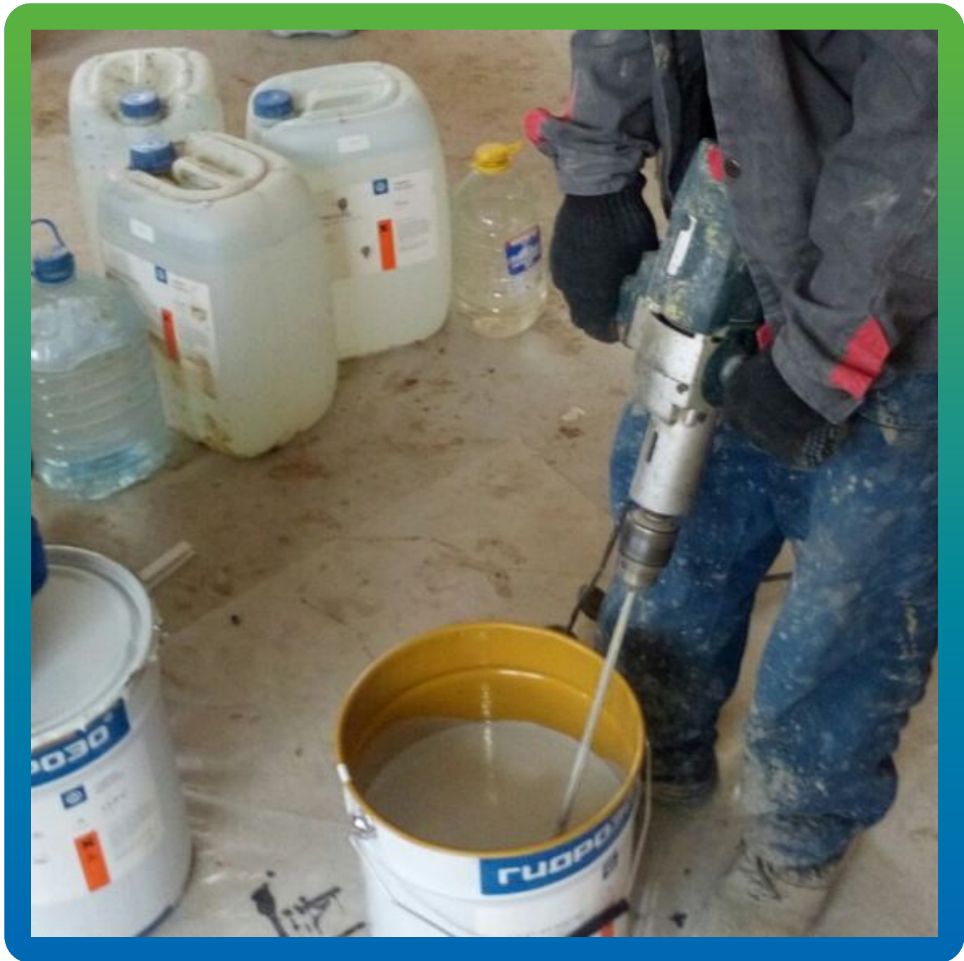
Приготовление финишного покрытия ДенсТоп ЭП 500 АС