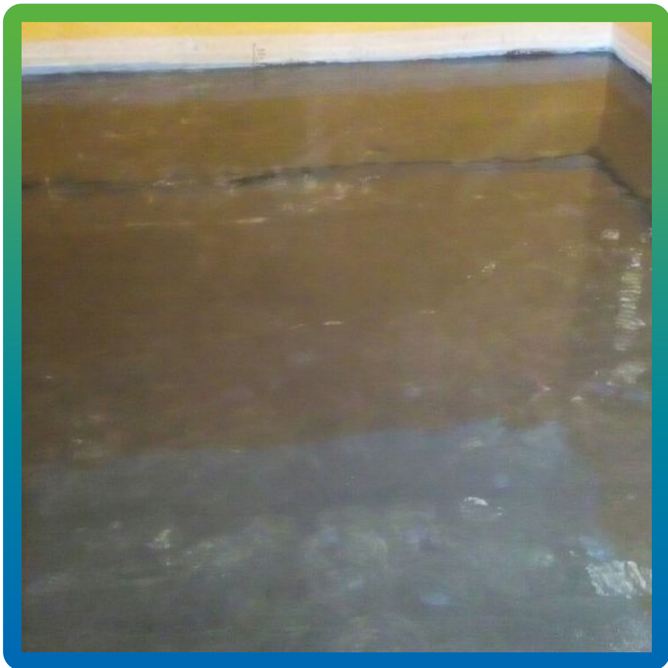
Загрунтованное основание под полы составом для влажных поверхностей ДенсТоп ЭП 106