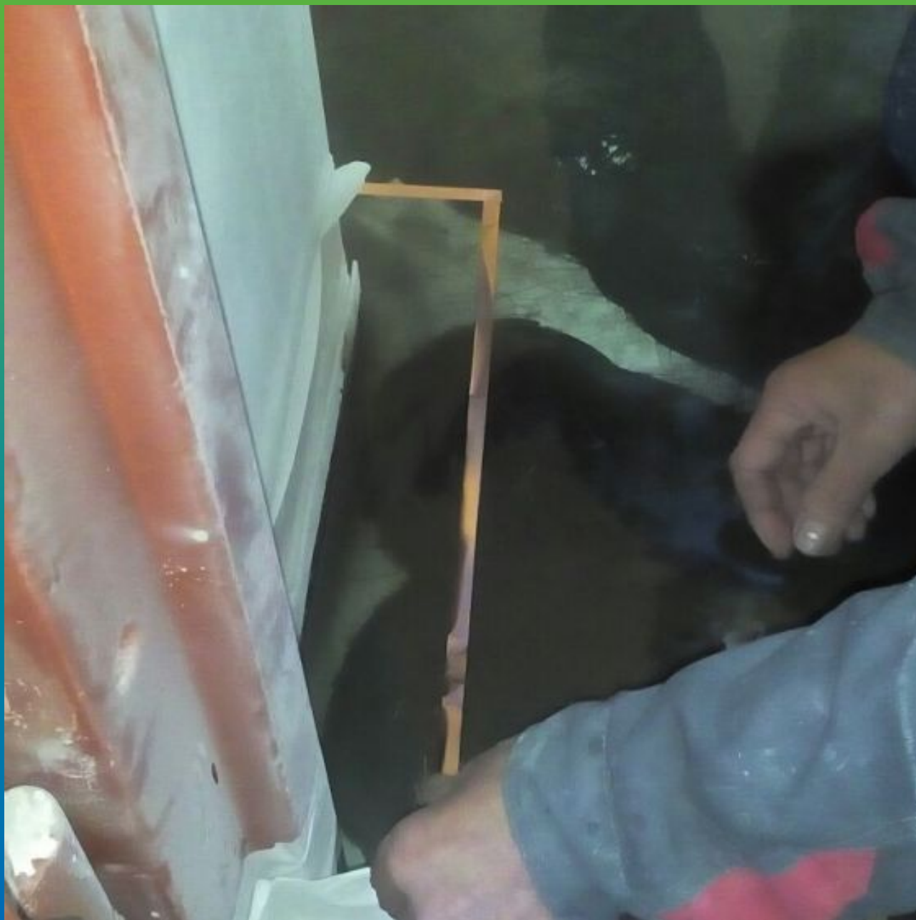
Монтаж медной ленты ДенТоп Купрум