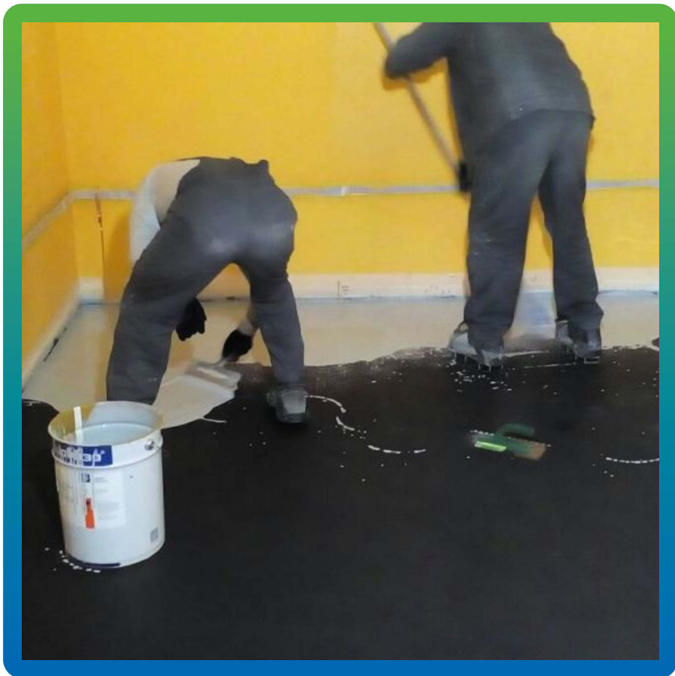
Устройство финишного слоя составом ДенТоп ЭП 500 АС