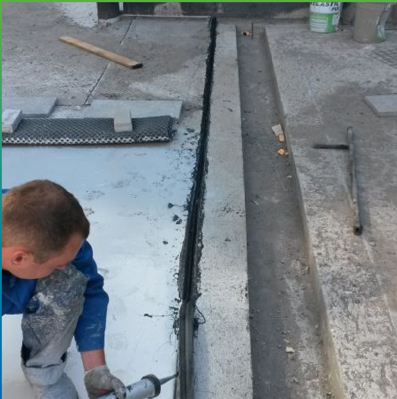
Гидроизоляция деформационного шва профилем Витраджоинтн Деф и герметиком Витрафин Бонд Ф