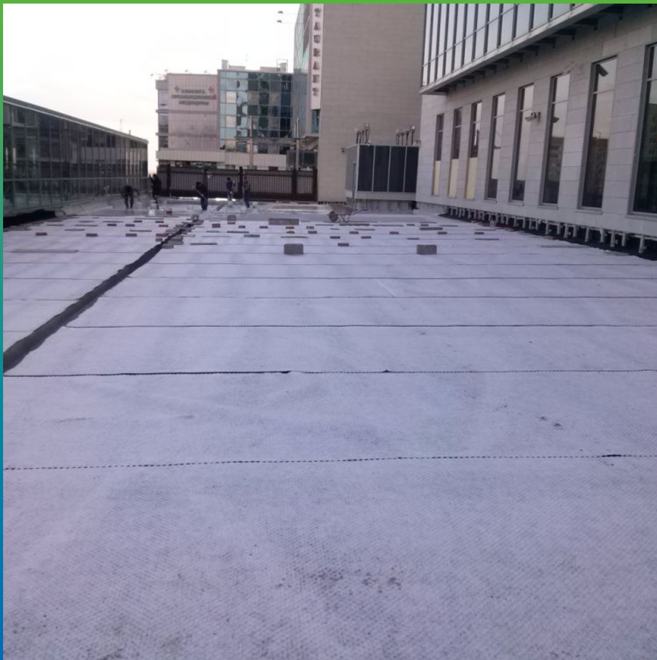
Укладка защитной мембраны Максдрейн 8 ГТ