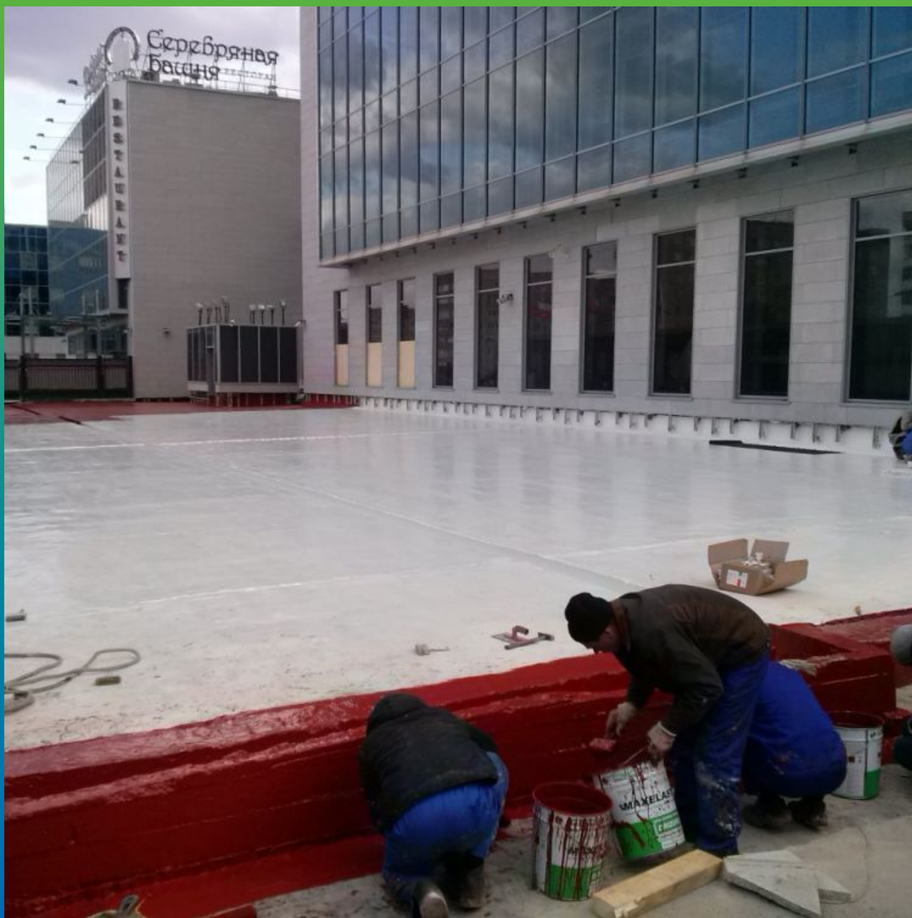
Нанесение первого слоя гидроизоляции Максэластик Пур