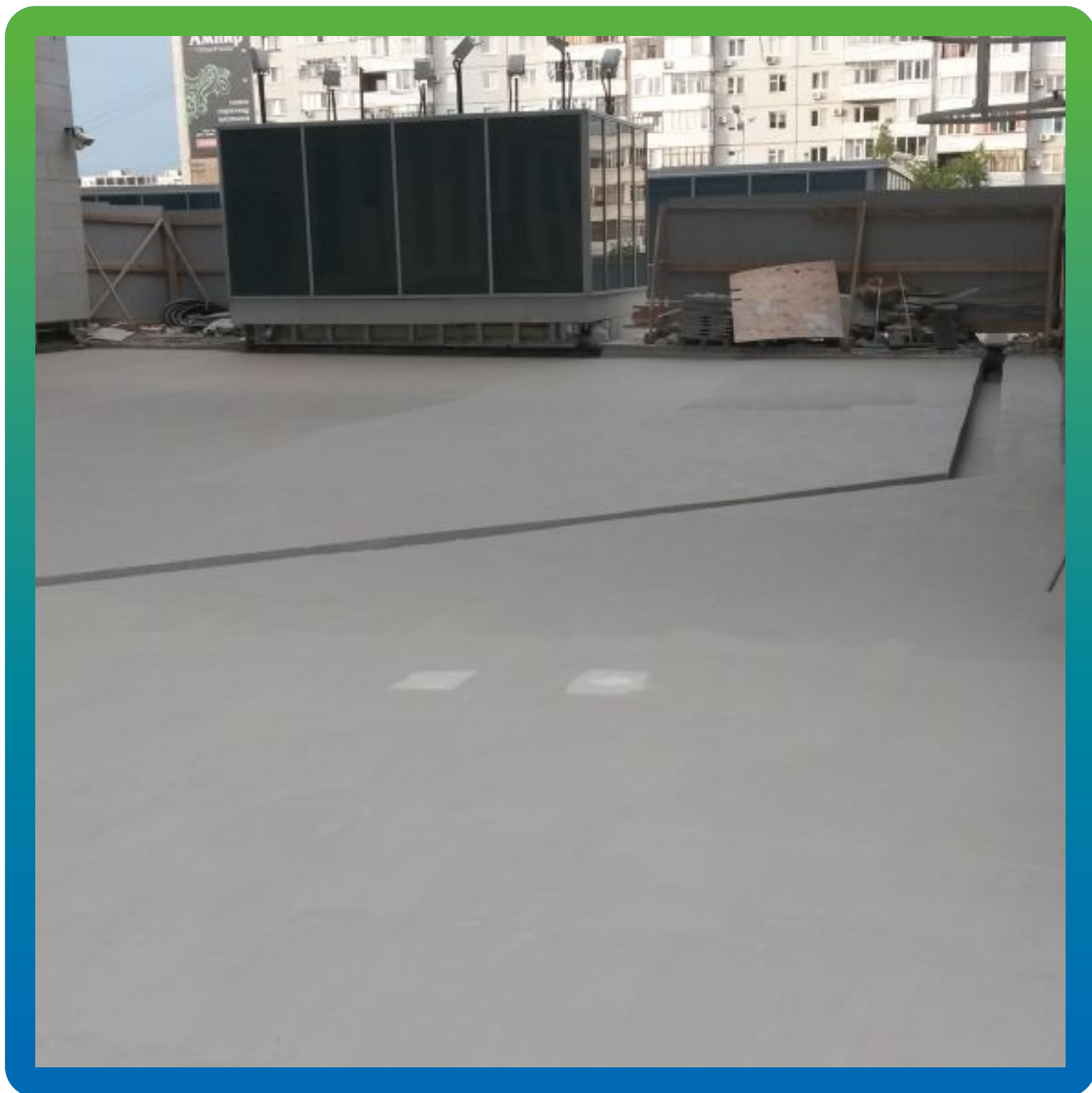
Финальный вид эксплуатируемой кровли