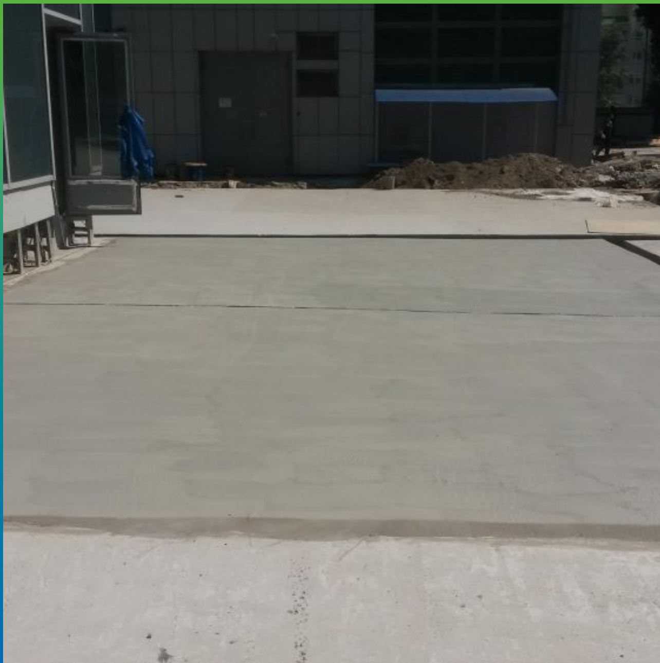
Общий вид эксплуатируемой кровли перед нанесением гидроизоляции