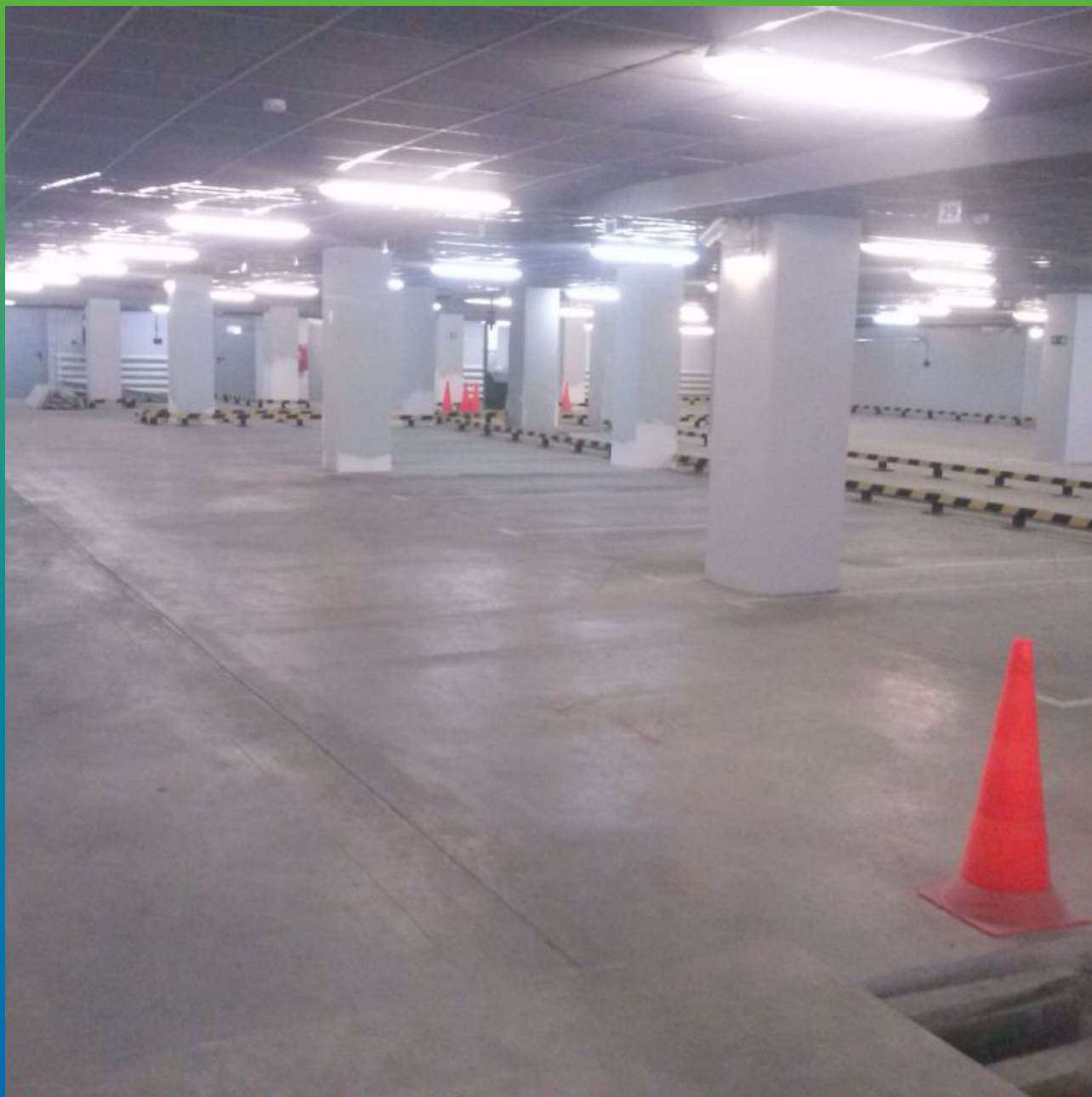
Общий вид парковки