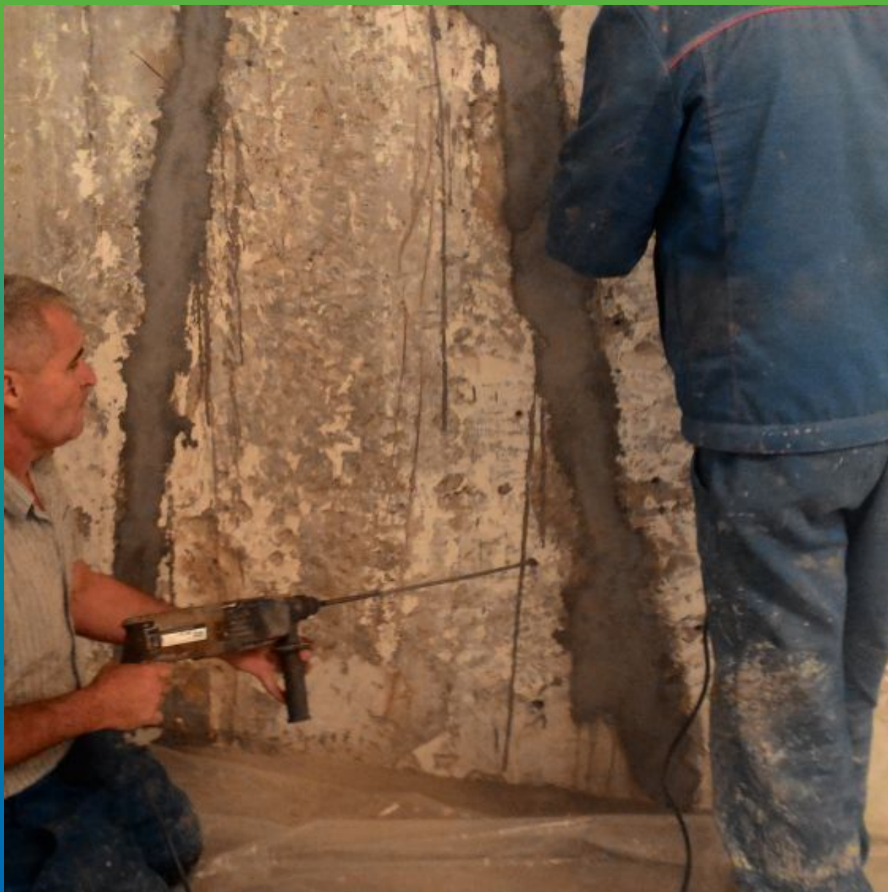
Бурение шпуров для установки пакеров