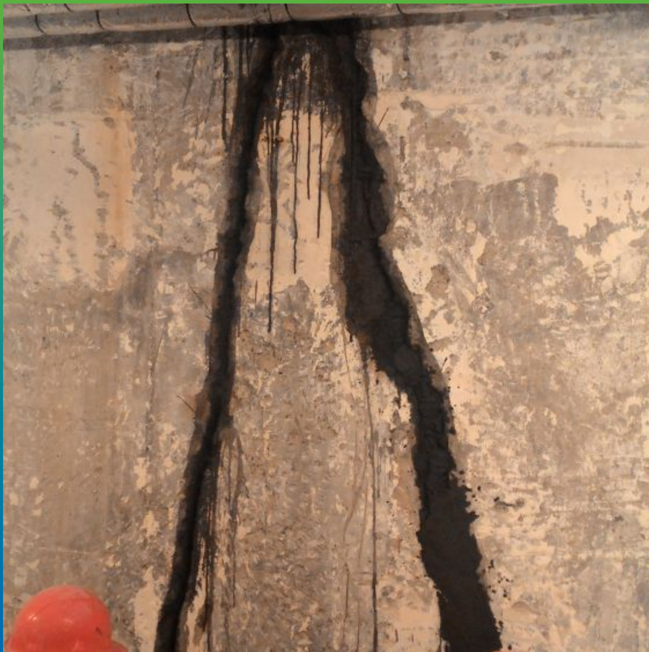
Подготовка к инъектированию, зачеканка Стармекс РМЗ