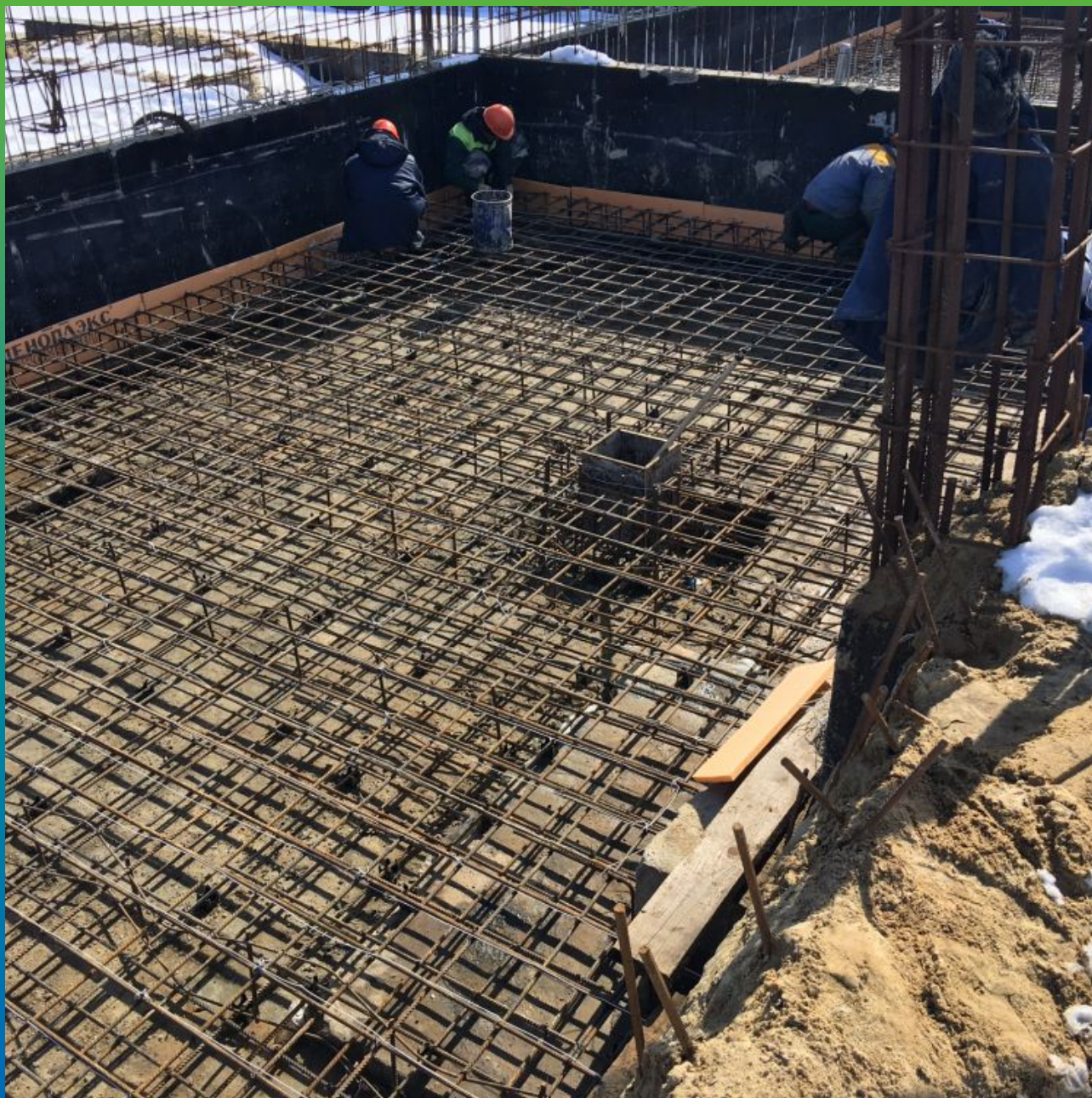
Очистка бетонной подготовки перед гидроизоляцией