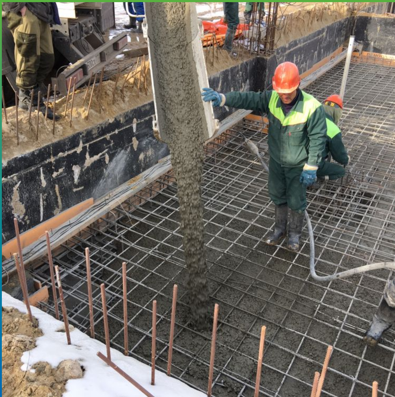
Подача бетона, отливка фундаментной плиты