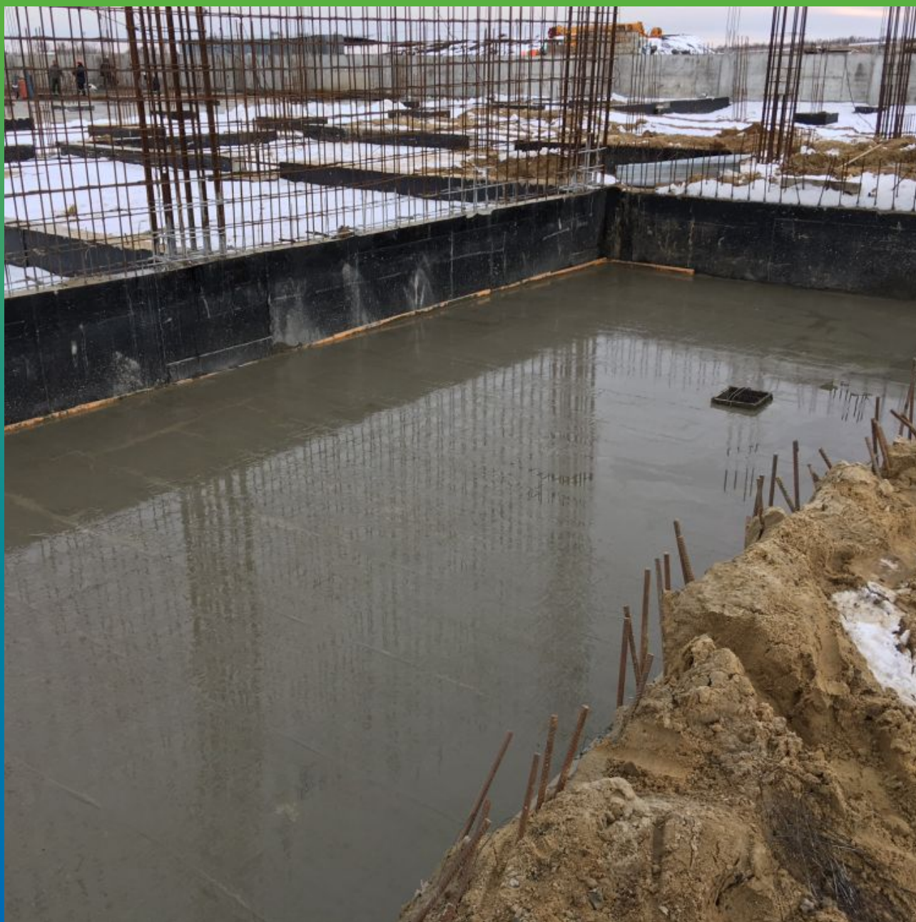
Финальный вид гидроизолированной фундаментной плиты