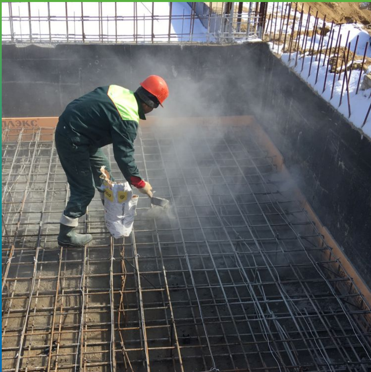
Просыпка гидроизоляции Стармекс Сил по бетонной подготовке