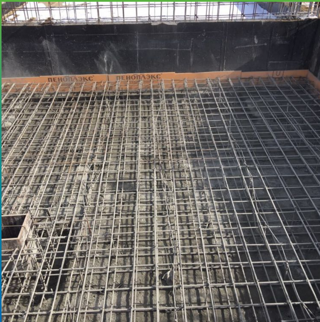
Вид после применения гидроизоляции Стармекс Сил