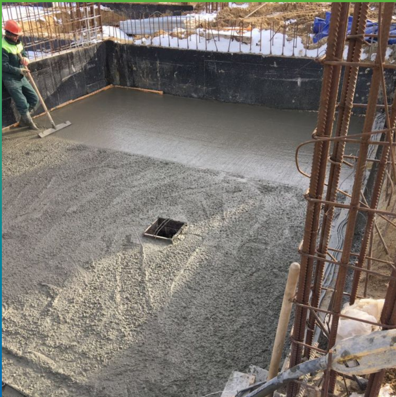
Выравнивание поверхности свежеложенного бетона