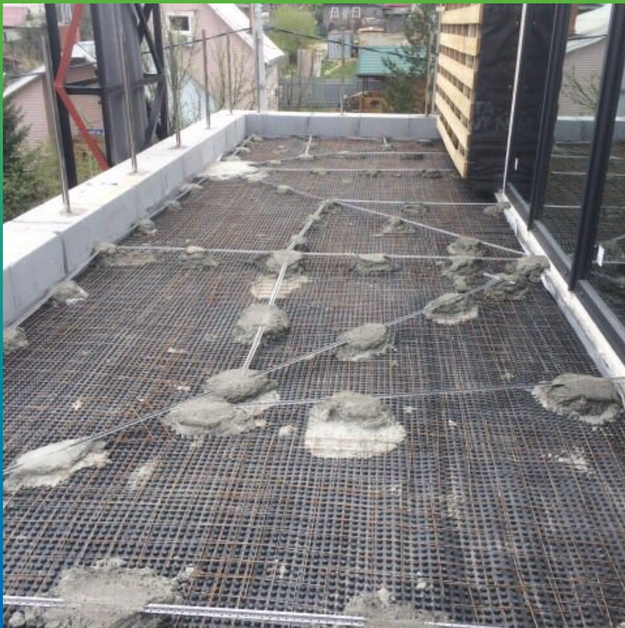
Установка маяков для устройства уклонообразующего слоя