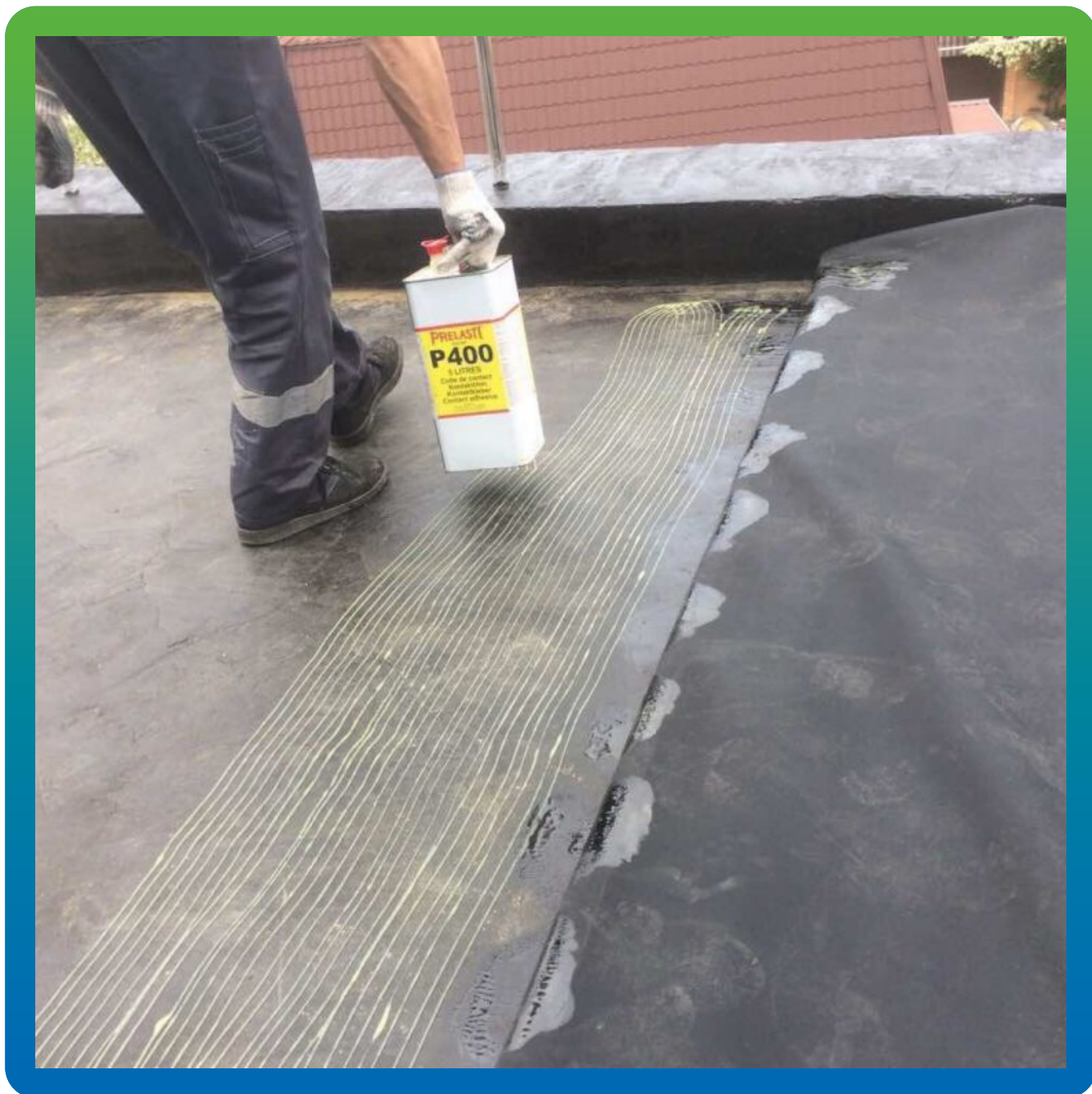
Крепление ЭПДМ мембраны Преласты СТ 1.2 мм с помощью Адгезива П400