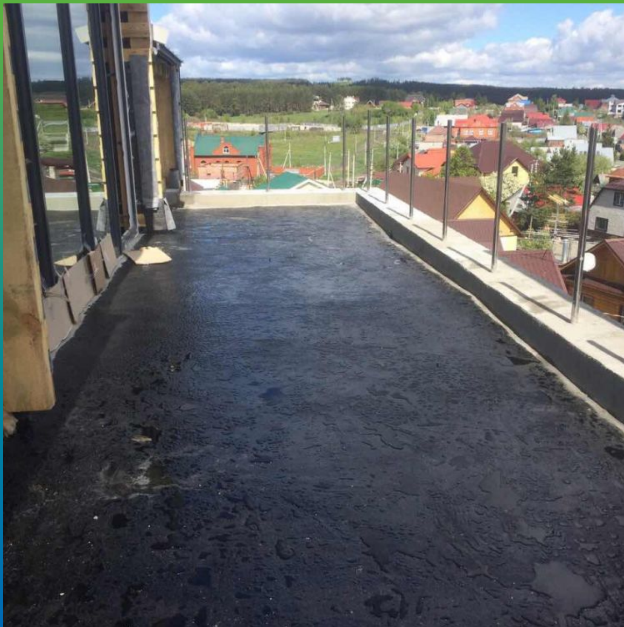
Вид готовой стяжки