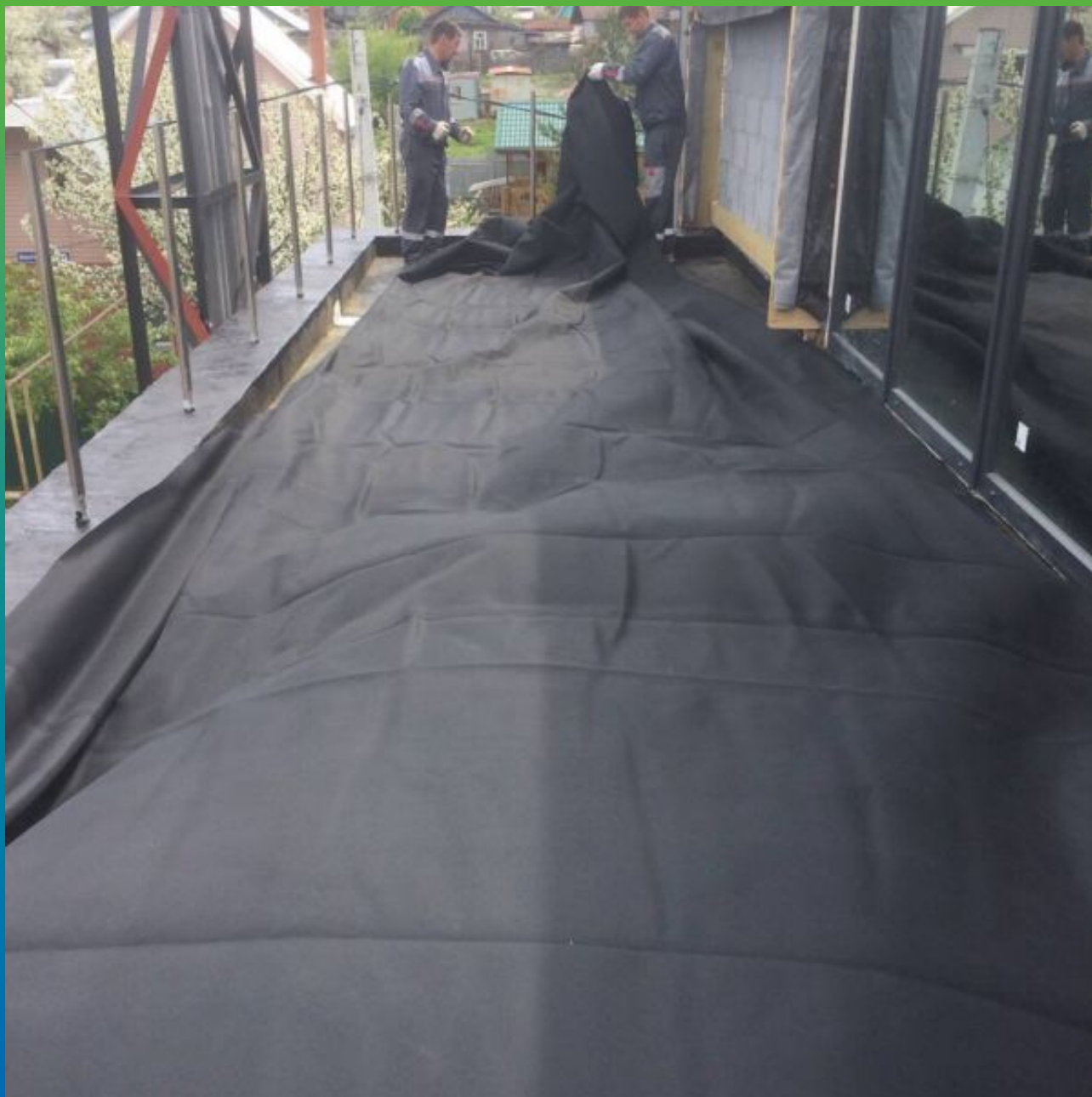
Укладка ЭПДМ мембраны Преласты СТ 1.2 мм