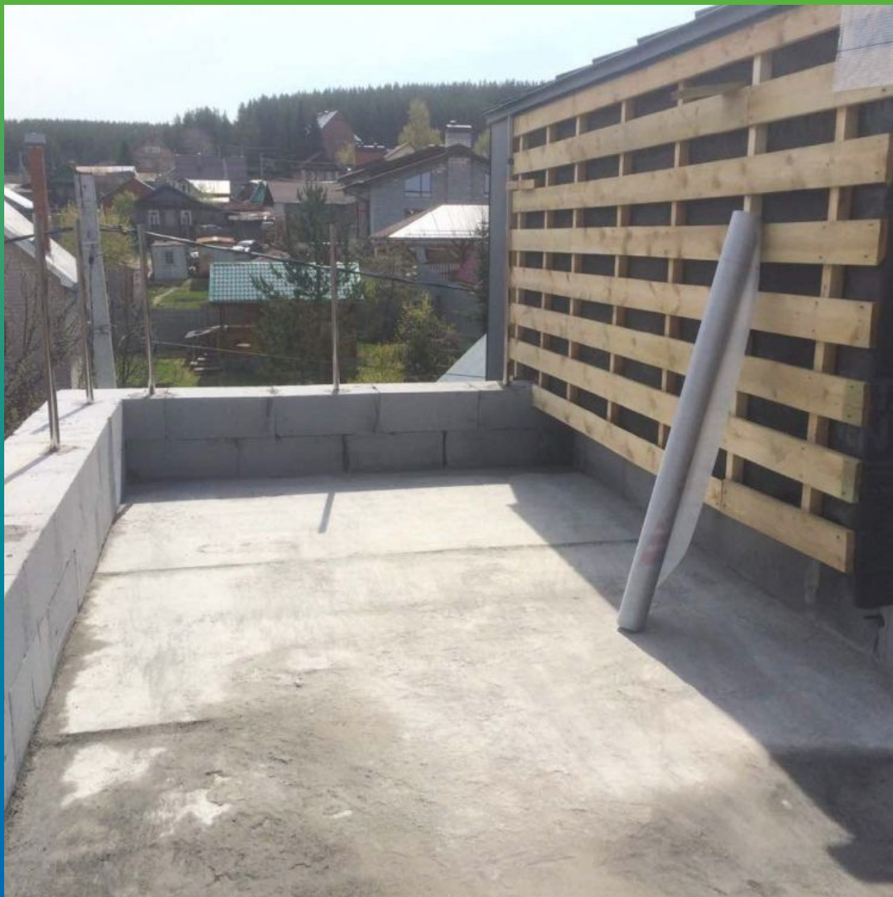
Первоначальный вид кровли