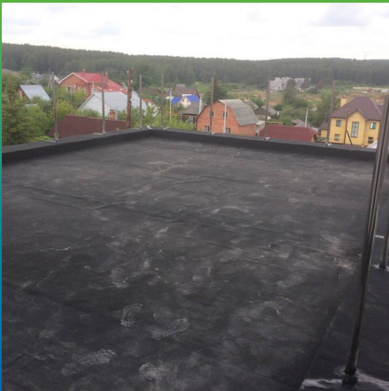
Финальный вид кровли