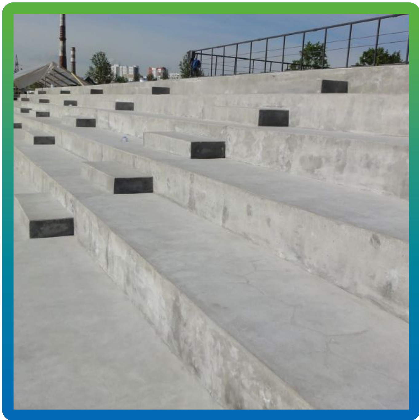
Вид подготовленной поверхности