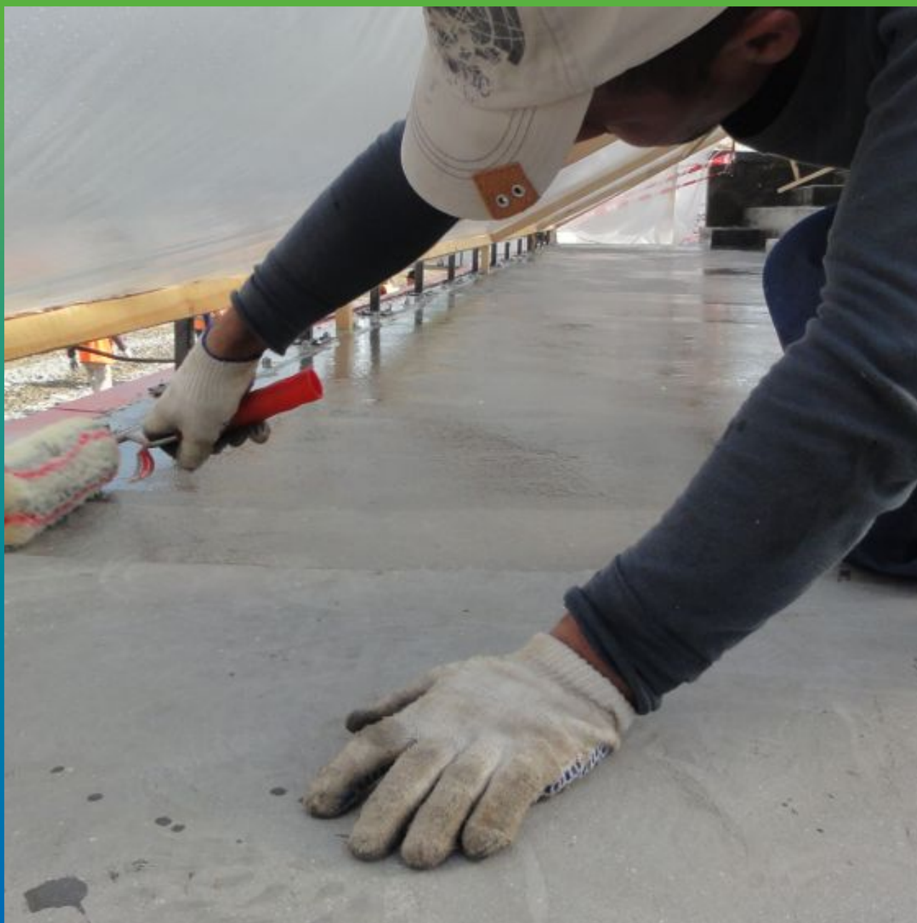
Нанесение грунтовки ДенТоп ЭП 106