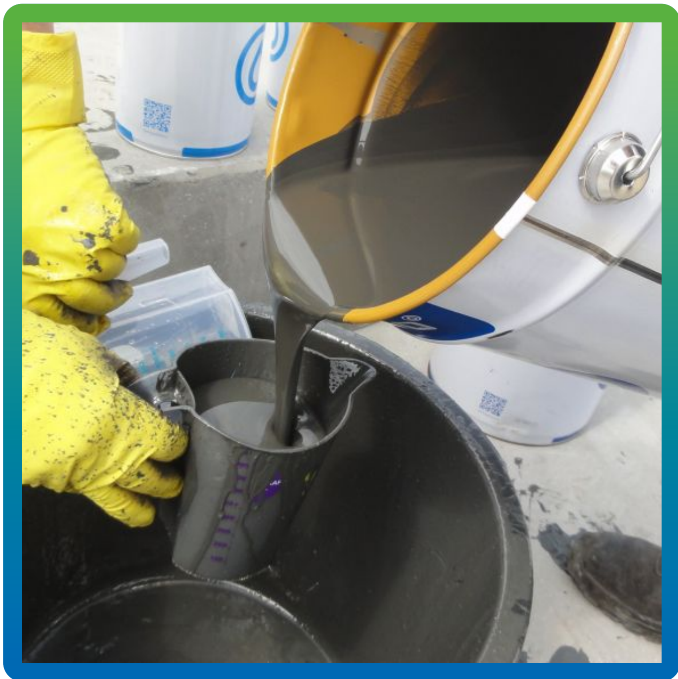
Затворение финишного покрытия ДенСтол ПУ 302