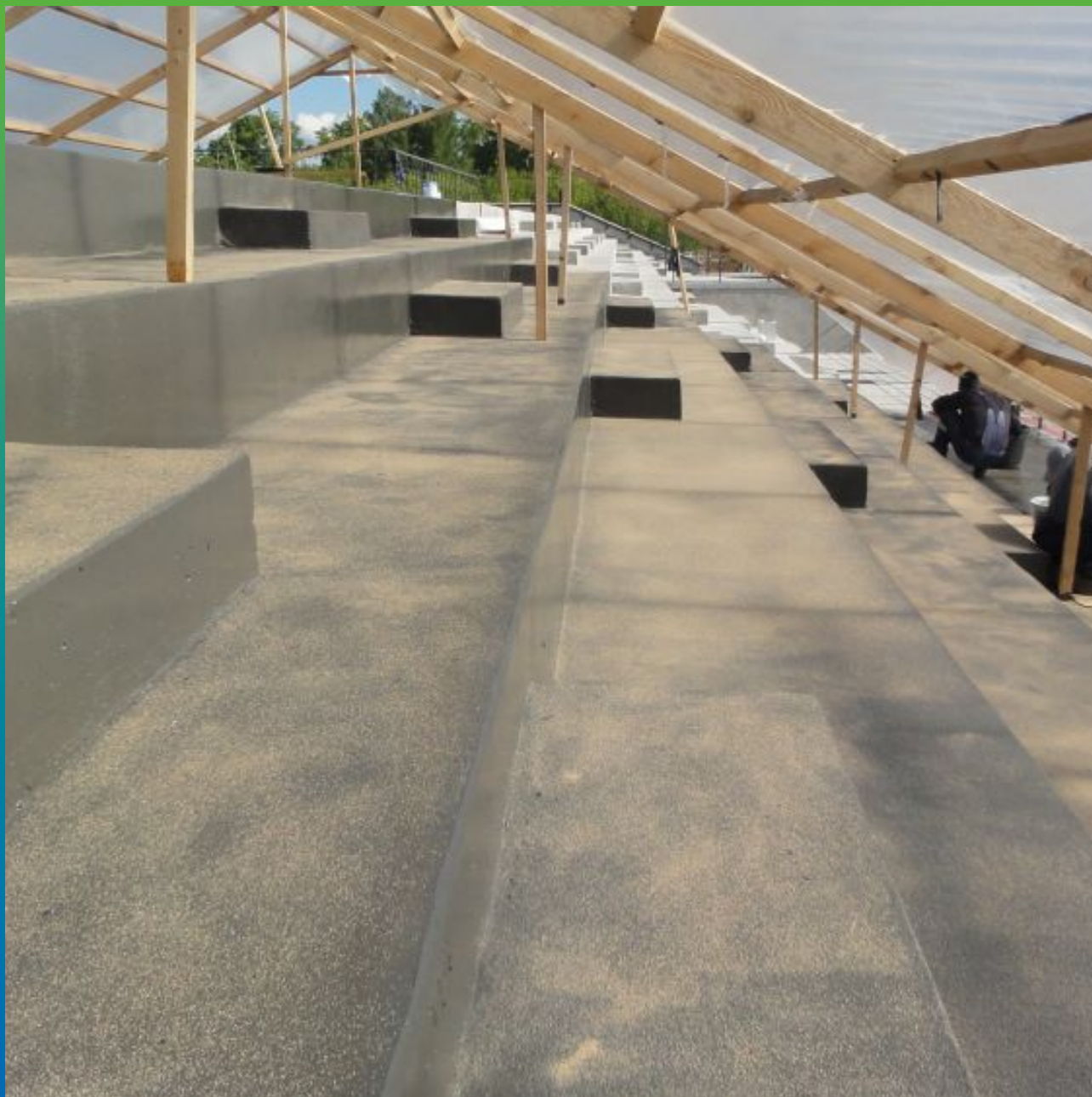
Вид покрытия присыпанного кварцевым песком