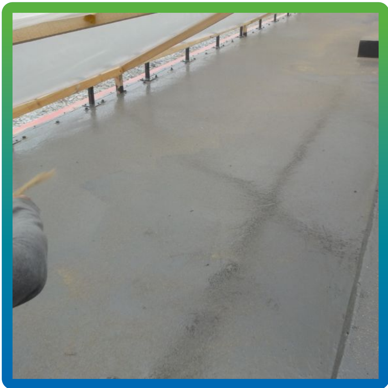
Присыпка первого слоя ДенсТоп ПУ 302 кварцевым песком