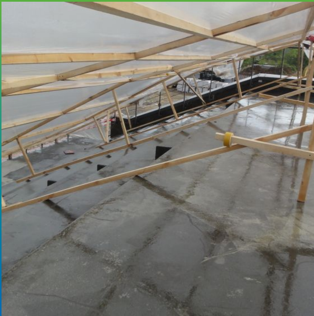
Вид загрунтованной поверхности