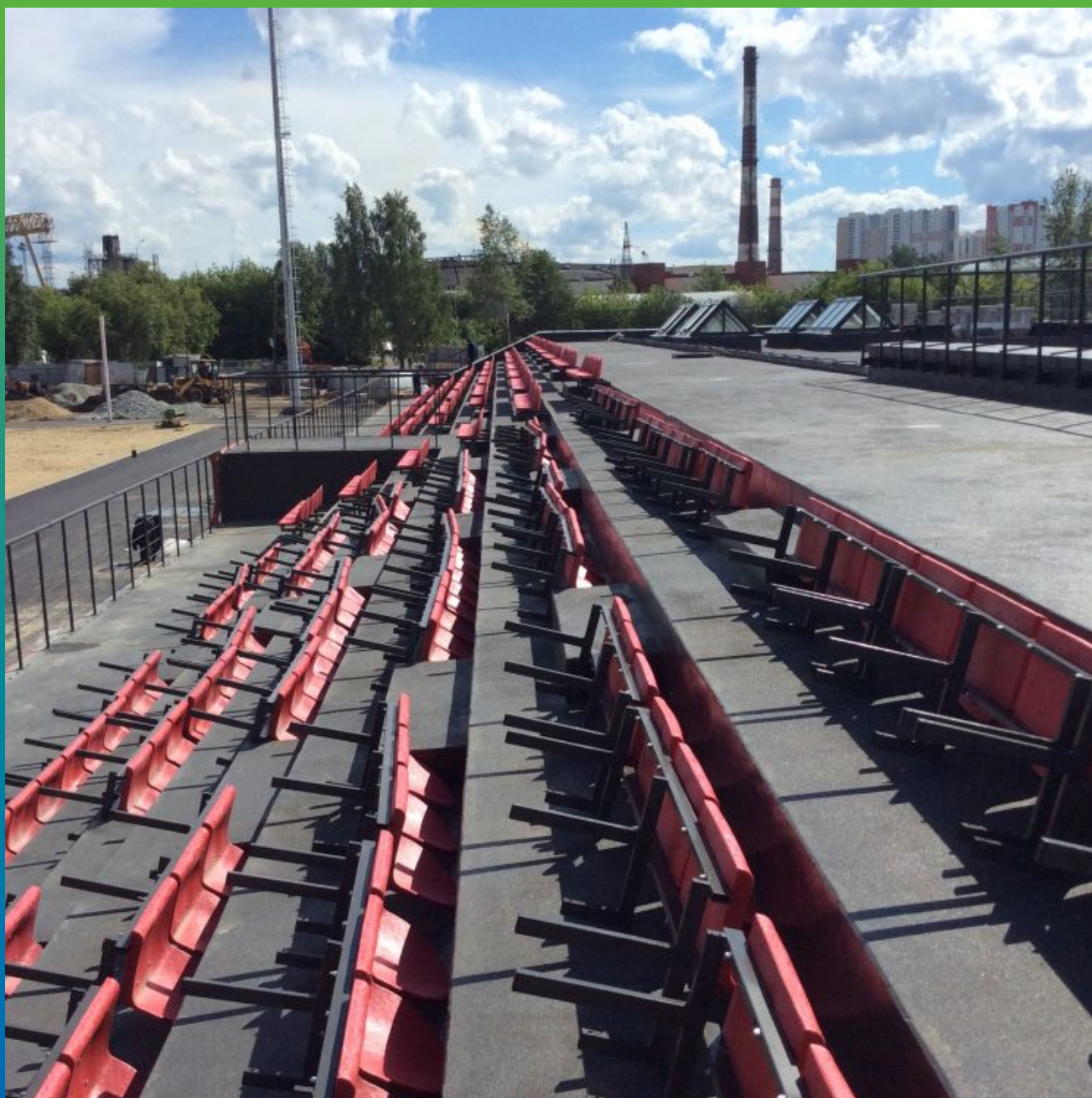
Финальный вид трибун