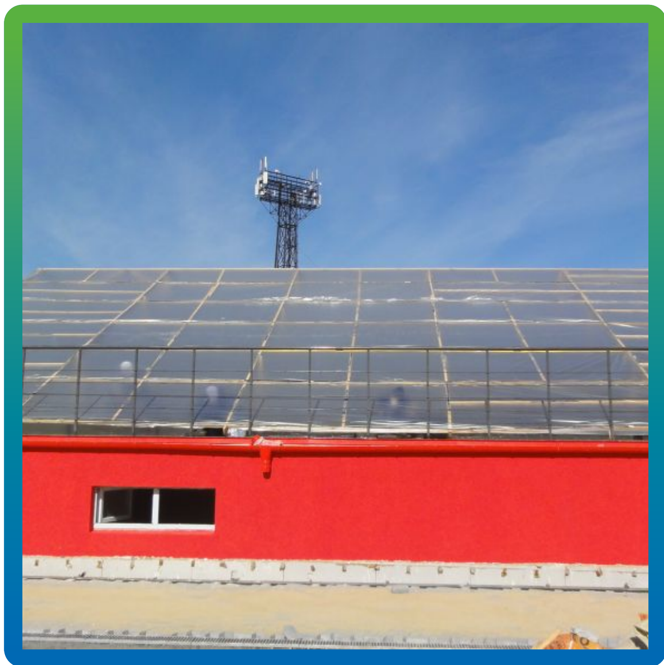
Вид навеса над рабочей зоной