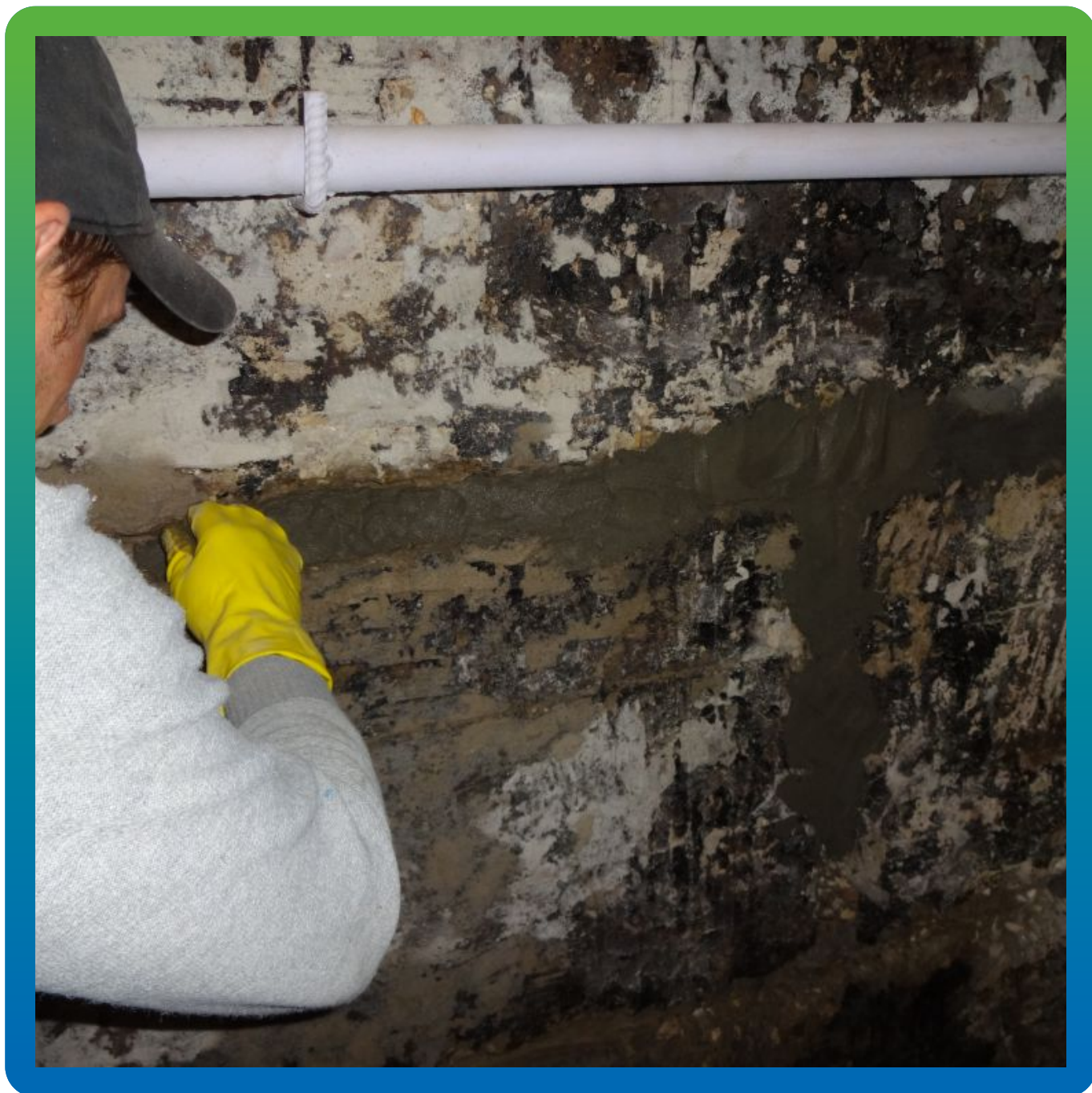
Устранение активных протечек