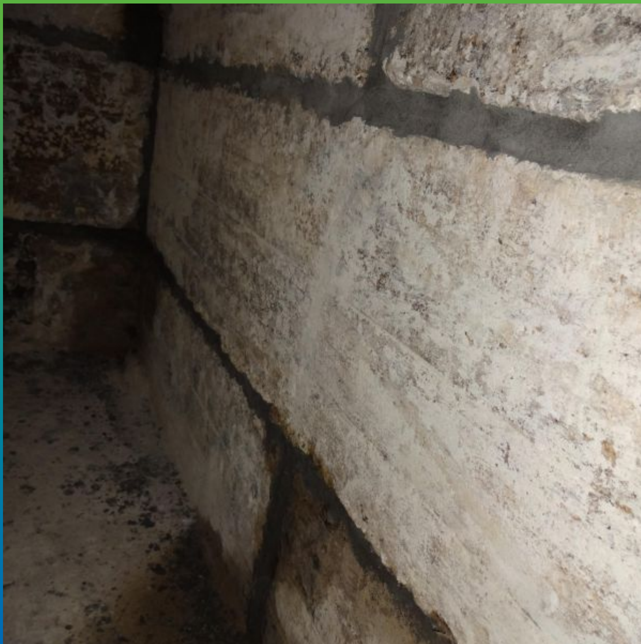
Швы после устранения активных протечек