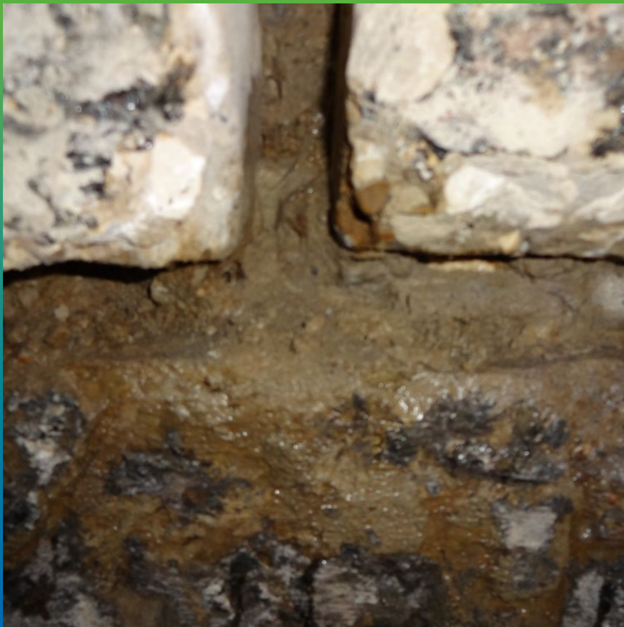
Активные протечки из швов ФБС