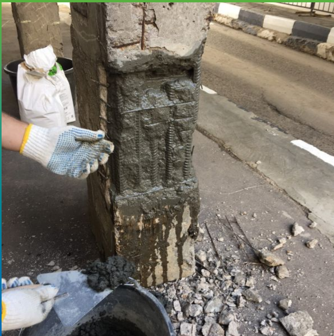
Нанесение грунтовочного слоя из Стармекс РМЗ