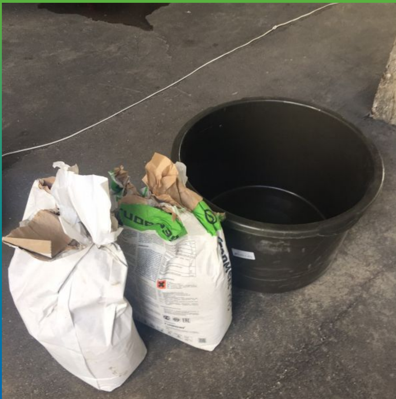
Ремонтные материалы Стармекс РМ3 и Стармекс РМ2