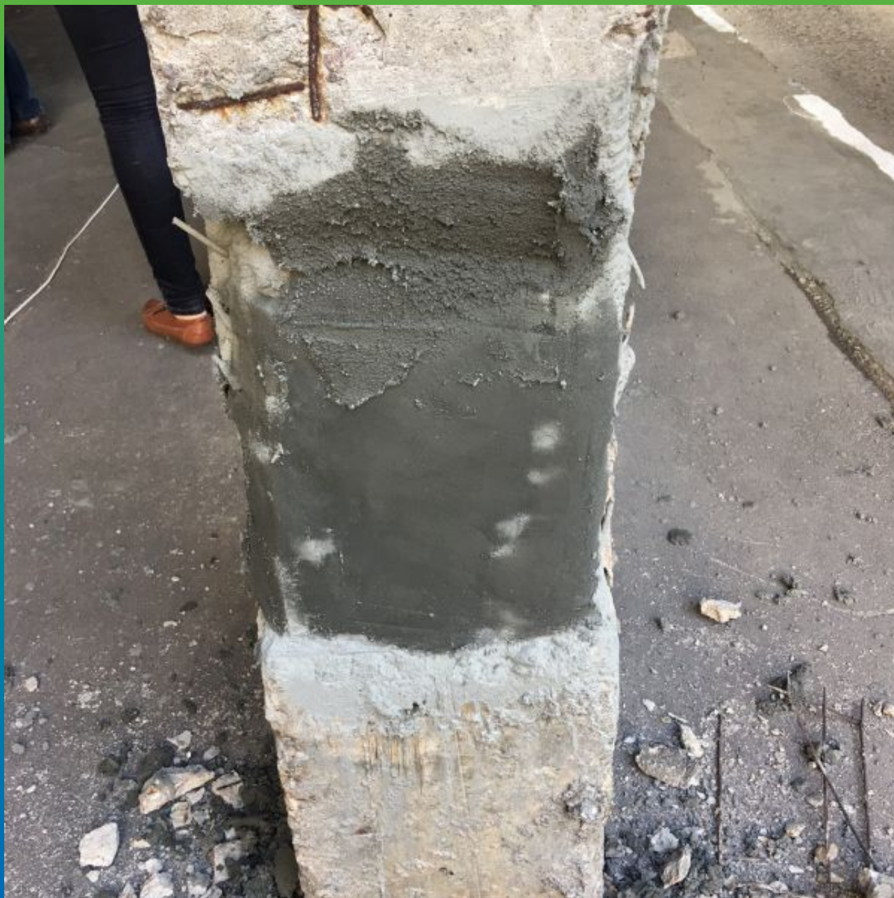
Нанесенный первый слой материала Стармекс РМЗ