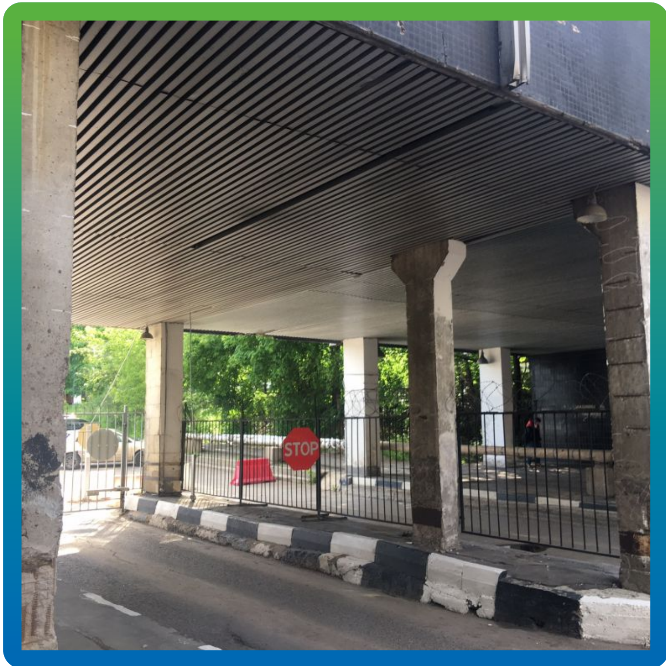
Вид разрушающихся несущих колонн