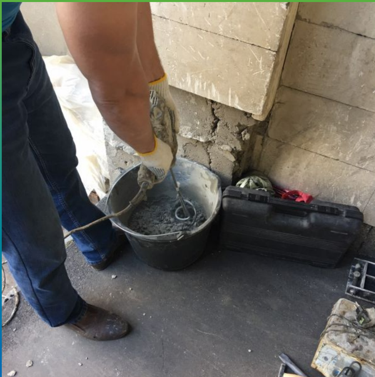
Приготовление ремонтного состава из Стармекс РМЗ