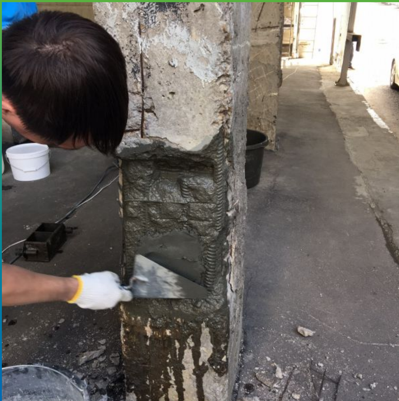
Нанесение ремонтного материала Стармекс РМЗ