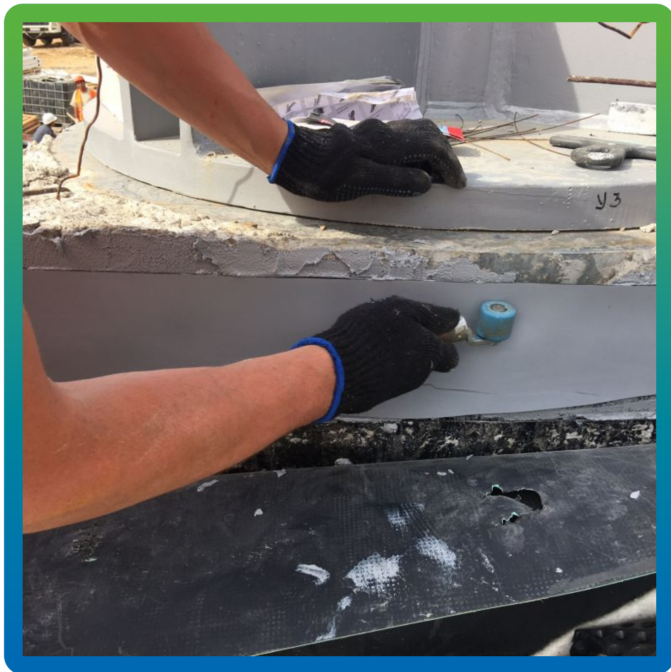
Прикатывание ленты Манодил Про латексным валиком