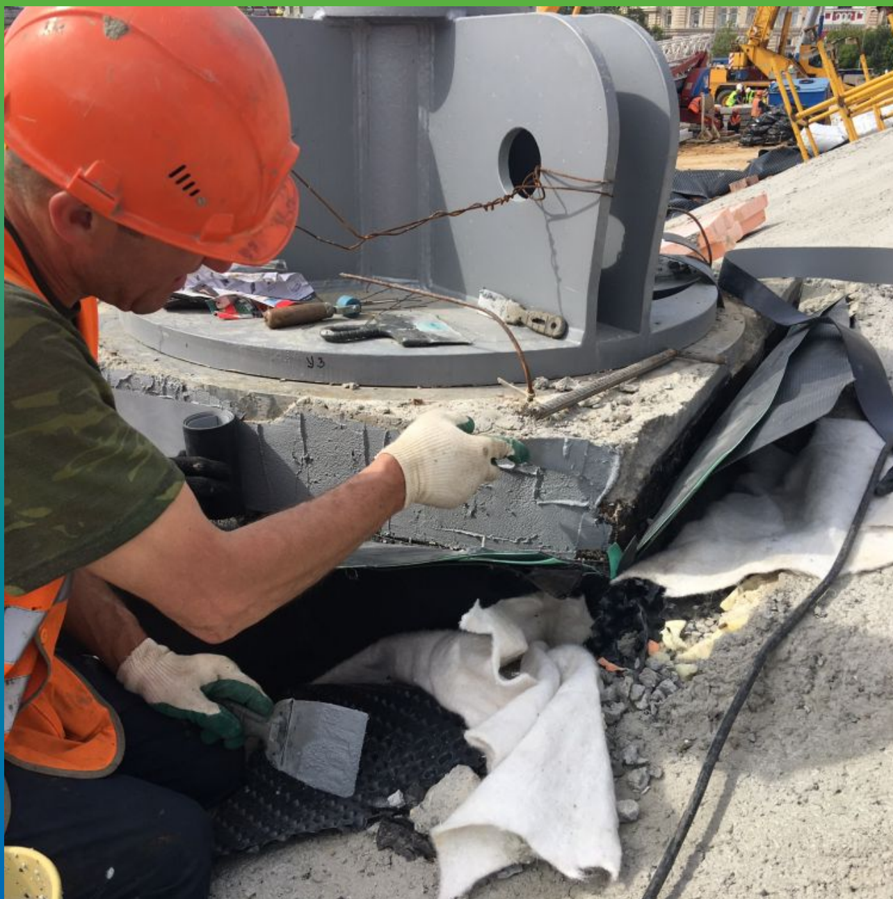
Нанесение клея Манопокс 331 на элемент стилобатной части и приклеивание ленты Манодил Про