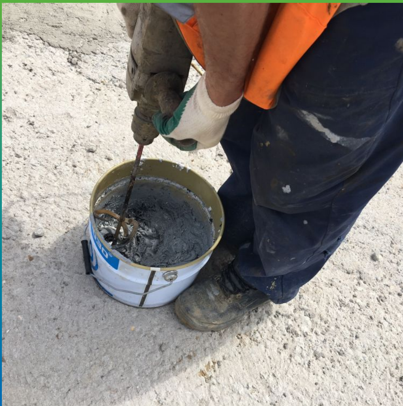
Приготовление эпоксидного состава Манопокс 331