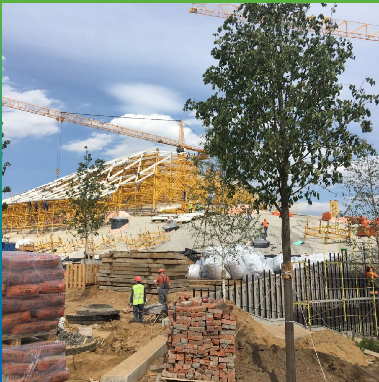
Вид строящегося объекта