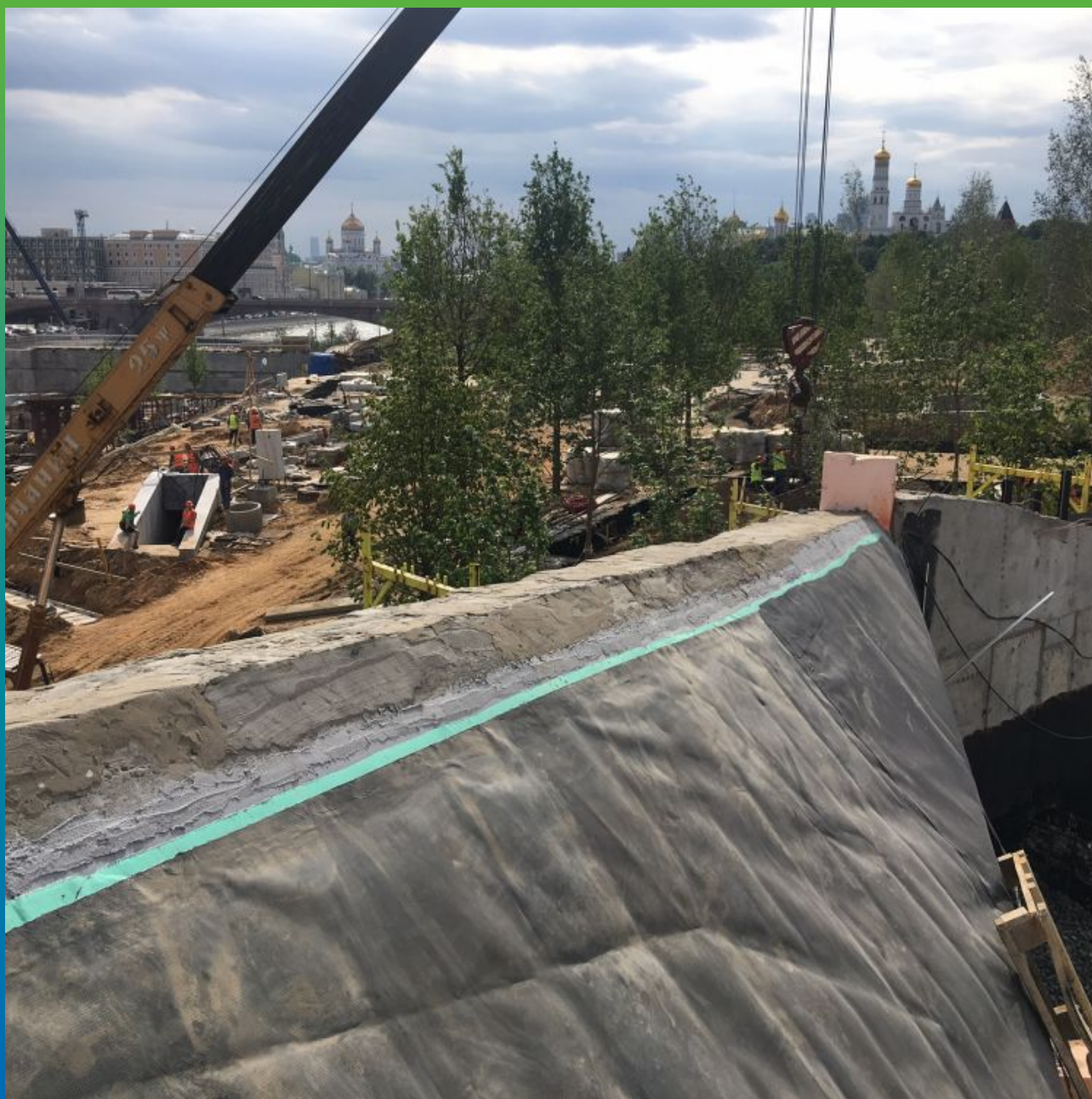
Вид приваренной мембраны ТПО к ленте Манодил Про