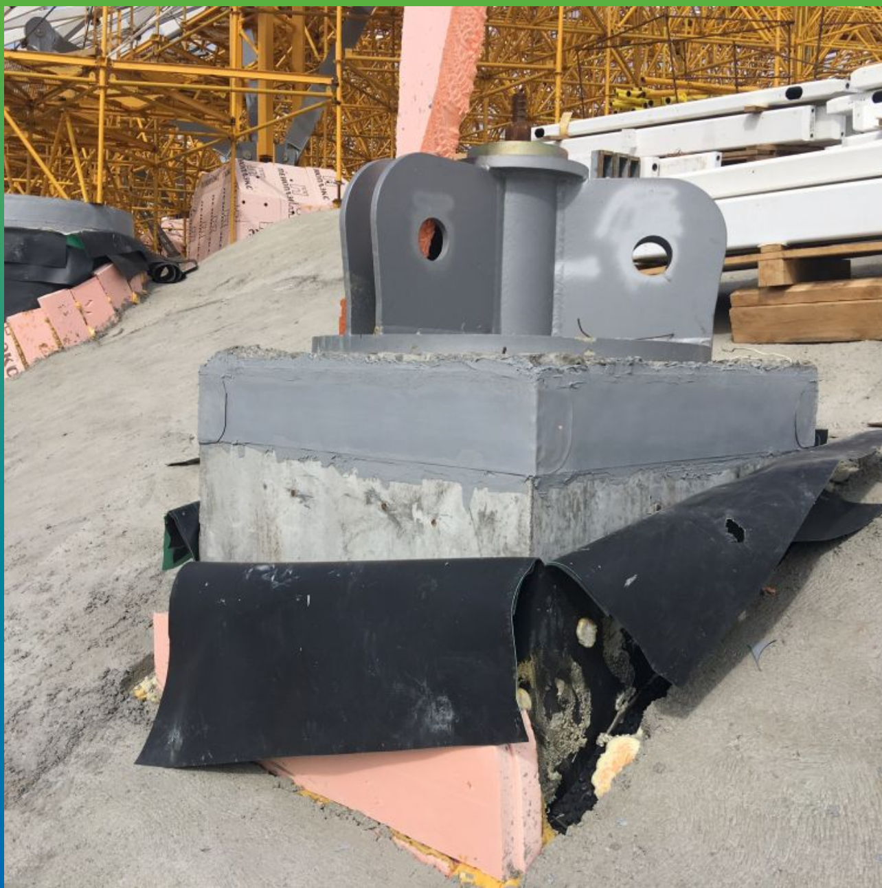
Приклеенная лента Манодил Про на Манопокс 331 на элементах стилобатной части