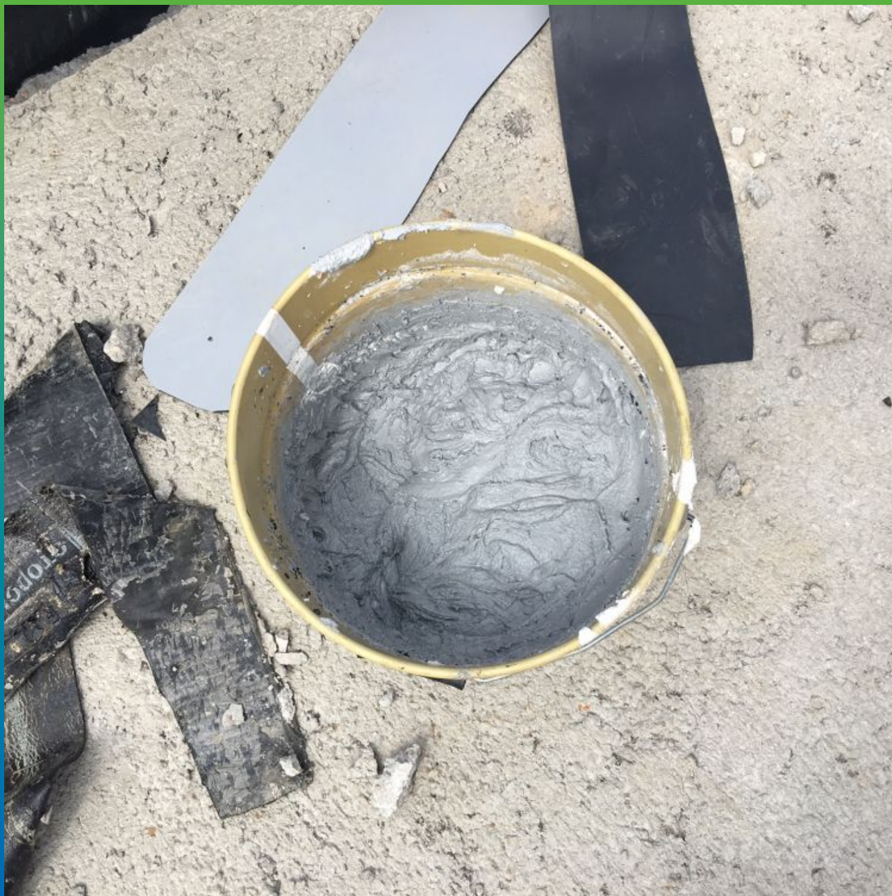
Приготовленный эпоксидный состав Манопокс 331