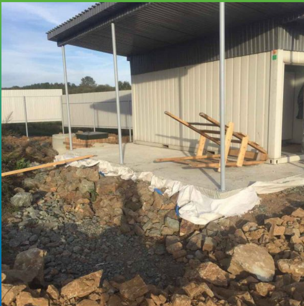
Устройство котлована под водоем