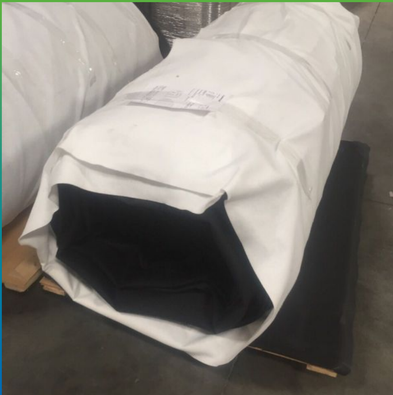
Вид материала на объекте