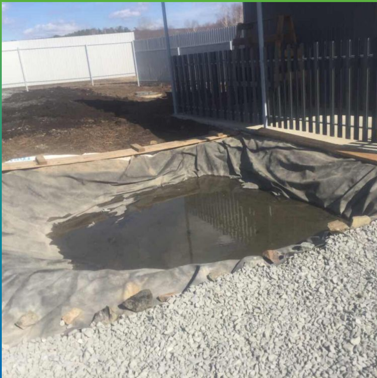
Укладка ЭПДМ мембраны