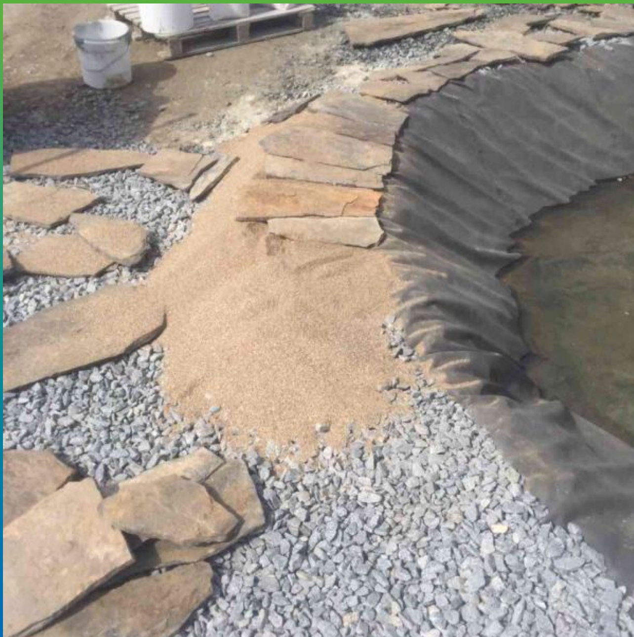
Закрепление ЭПДМ мембраны и создание декоративного берега