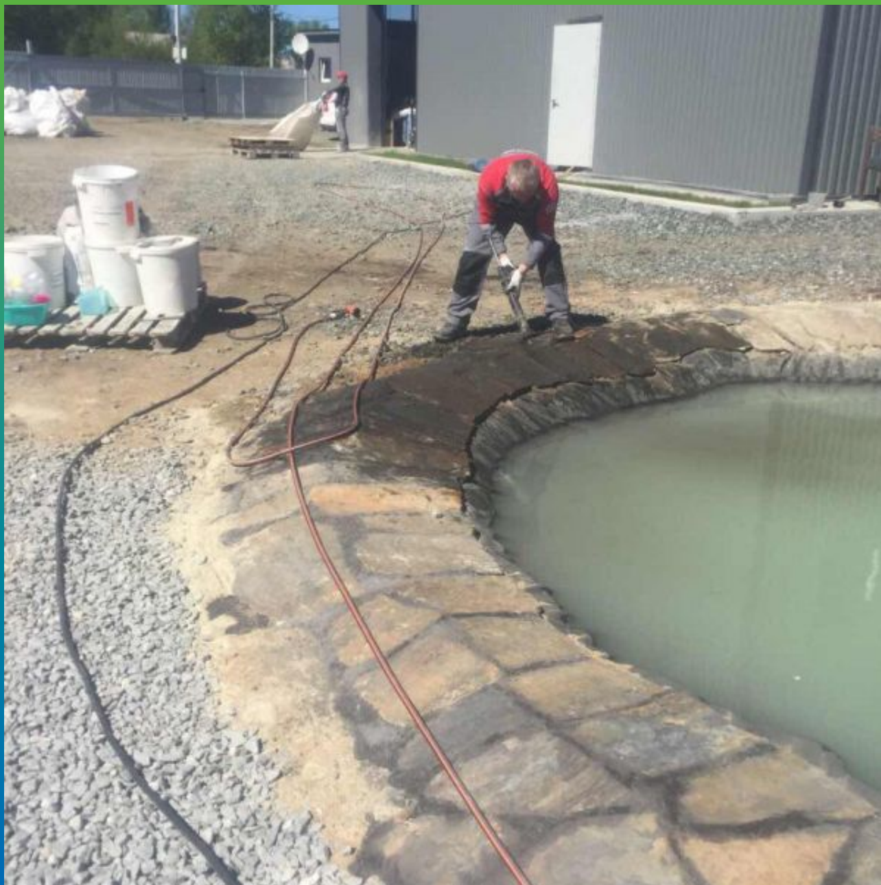
Закрепление ЭПДМ мембраны и создание декоративного берега