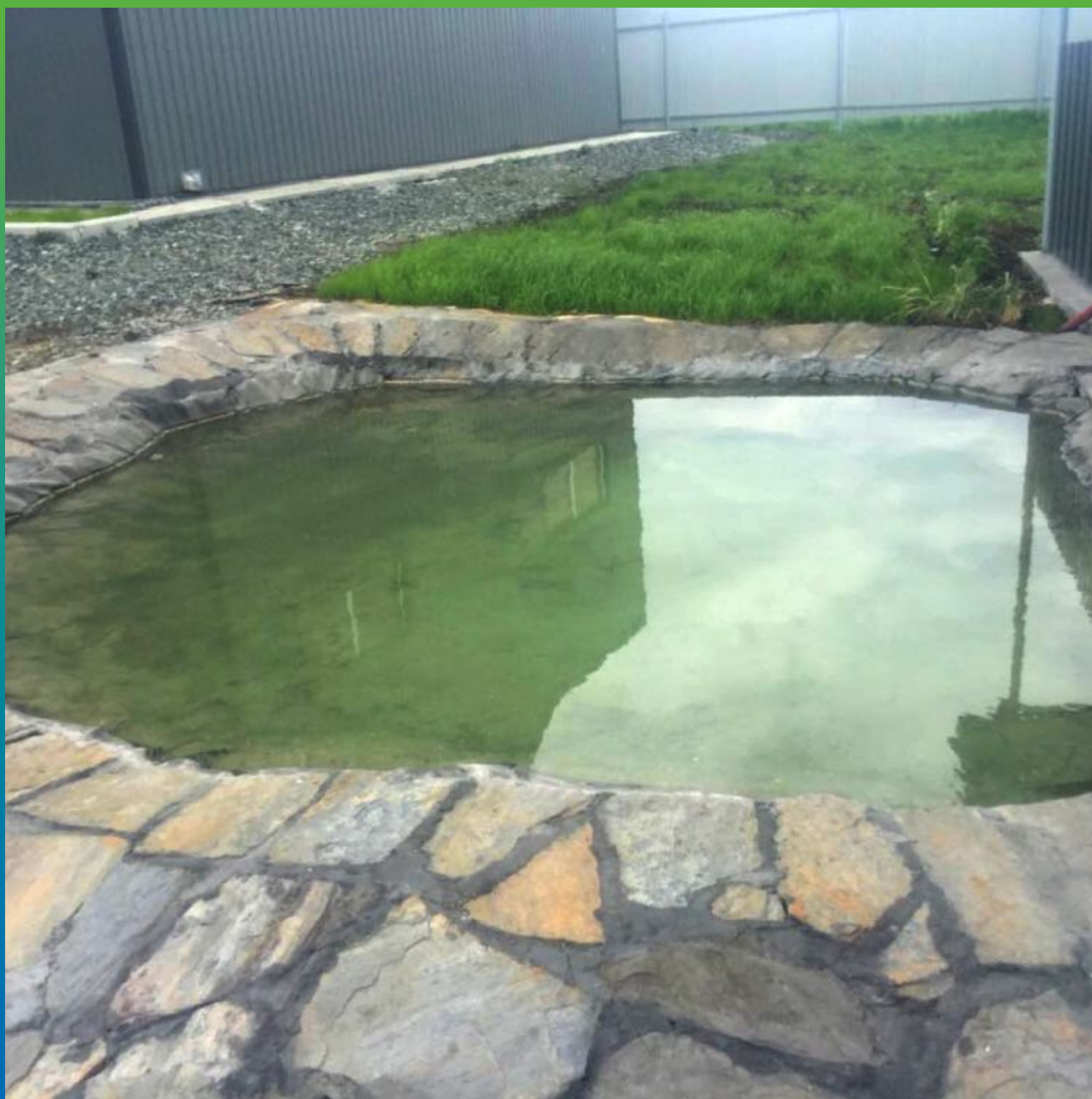
Финальный вид водоема