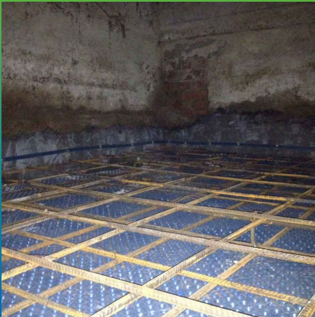
Вид готовой к заливке площадки