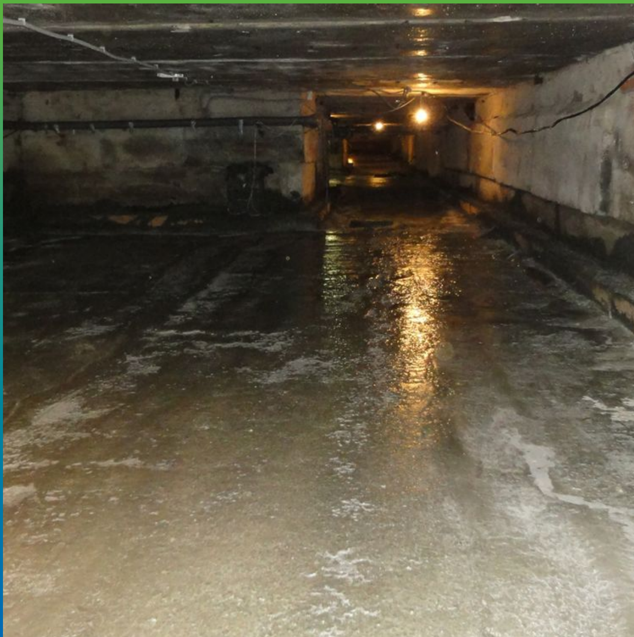
Вид залитой плиты