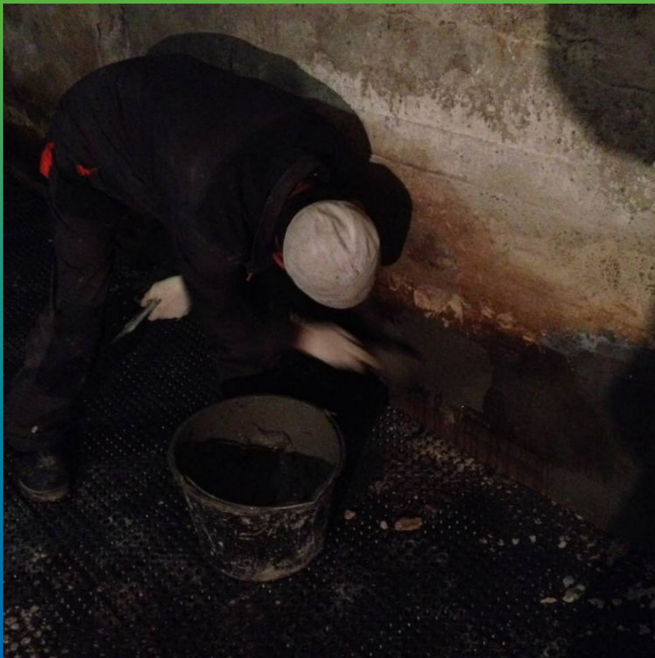
Выравнивание поверхности с помощью Стармекс РМЗ