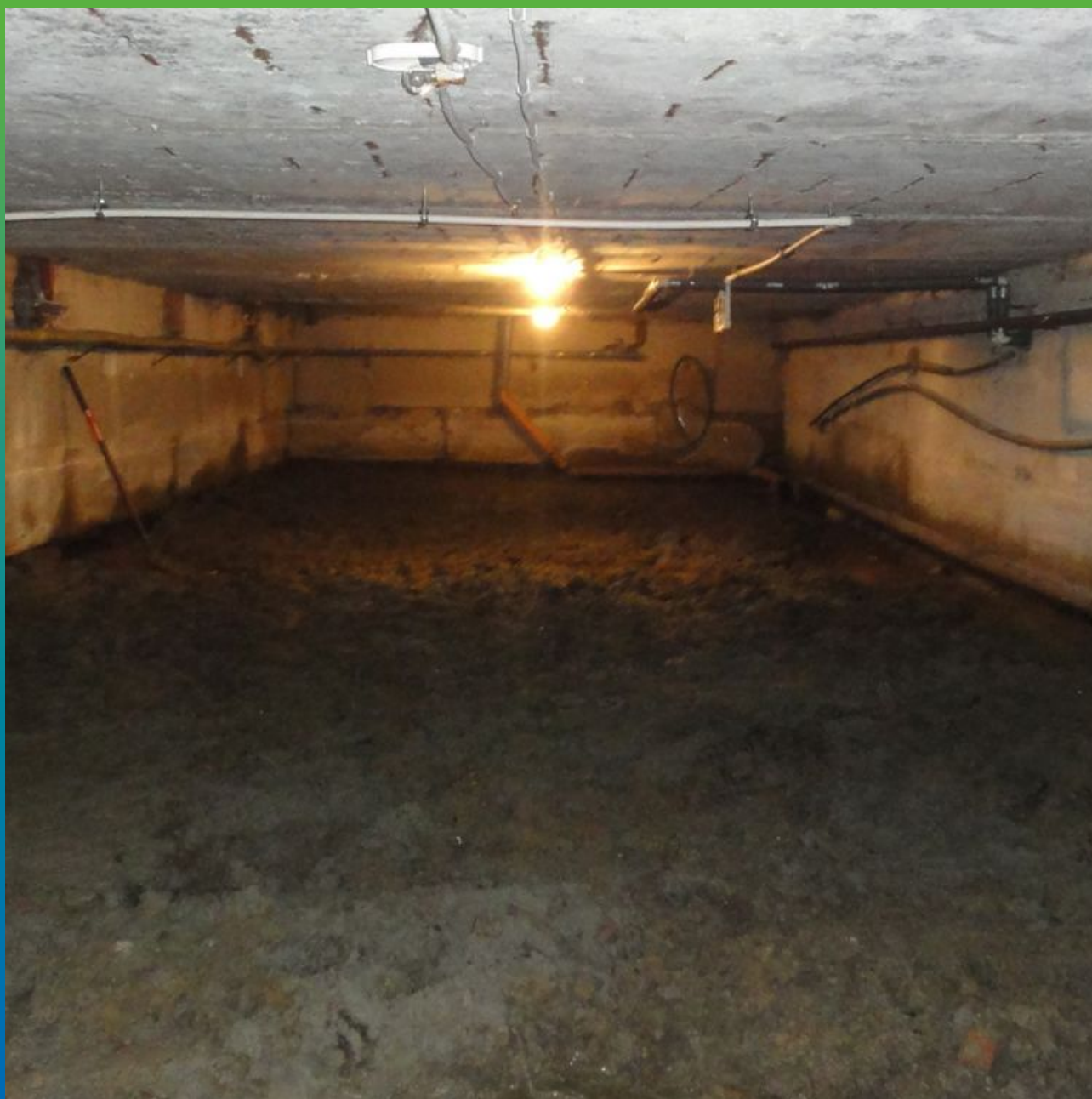
Первоначальный вид подвала