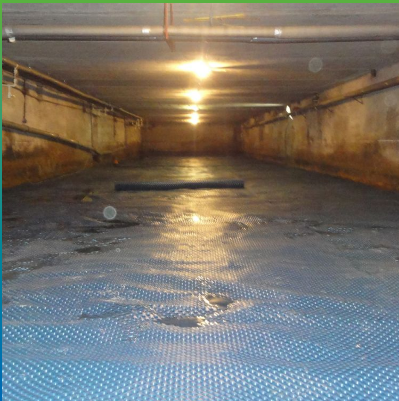
Укладка дренажной мембраны Максдрейн 8, перед заливкой плиты