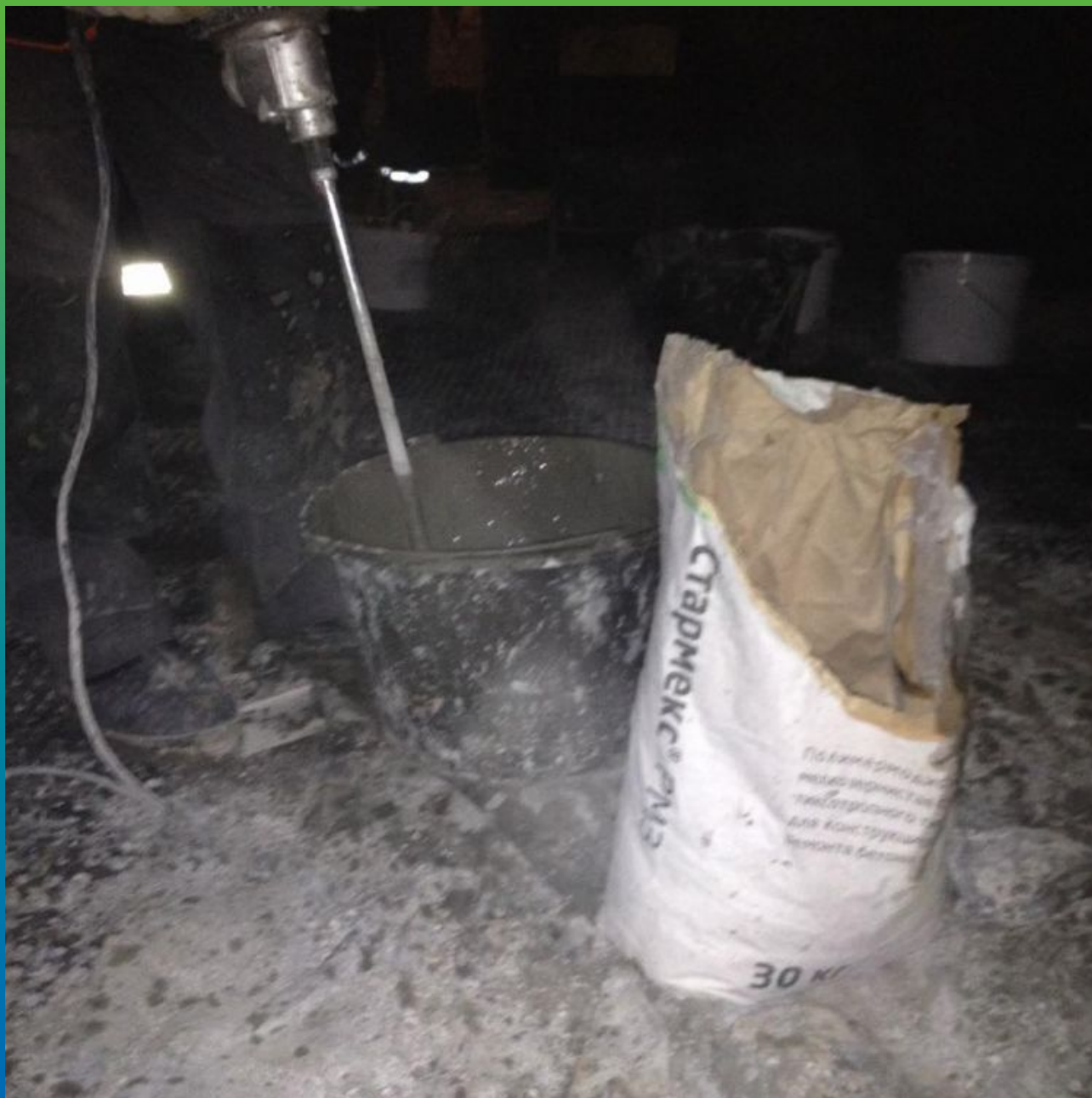
Затворение ремонтного состава Стармекс РМЗ