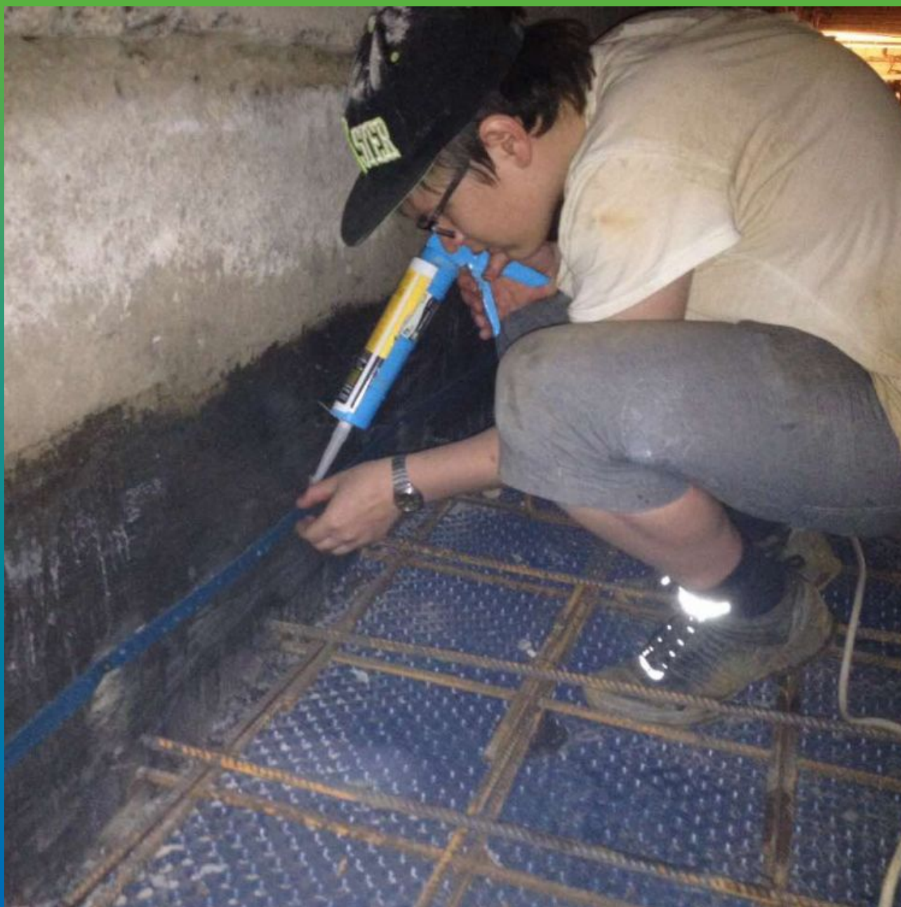
Монтаж разбухающего профиля Манодил Свелл