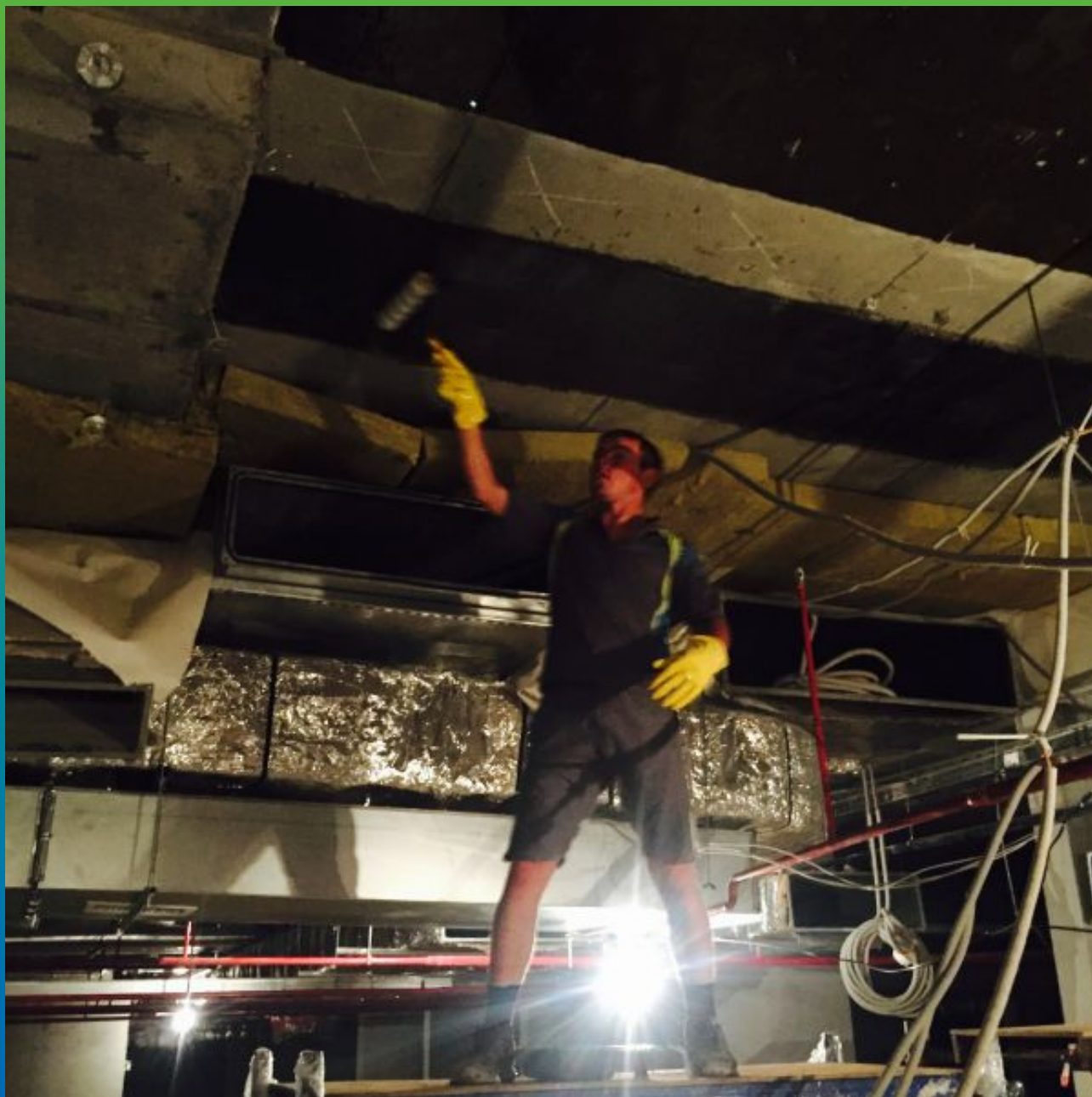
Грунтование шлифованной поверхности