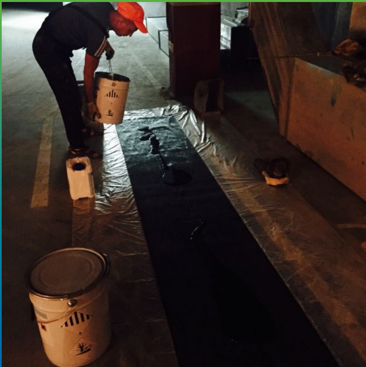
Пропитка холста эпоксидным клеем Манопокс 372