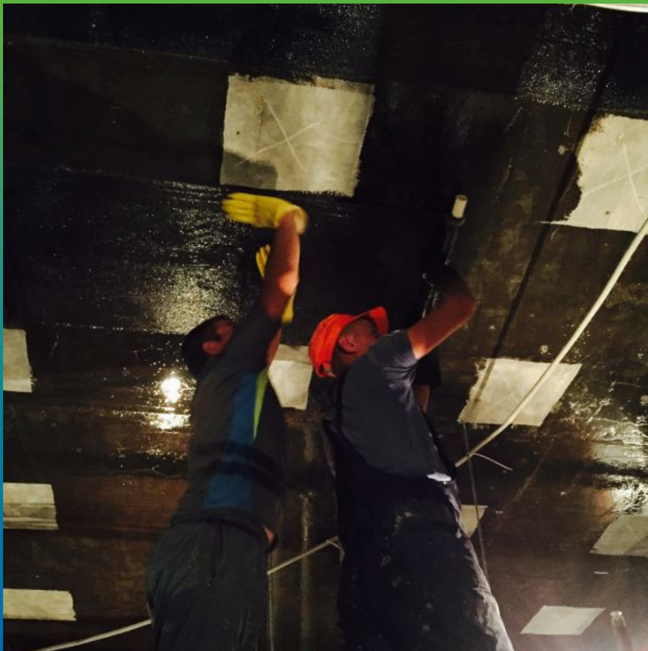
Монтаж системы Армошел