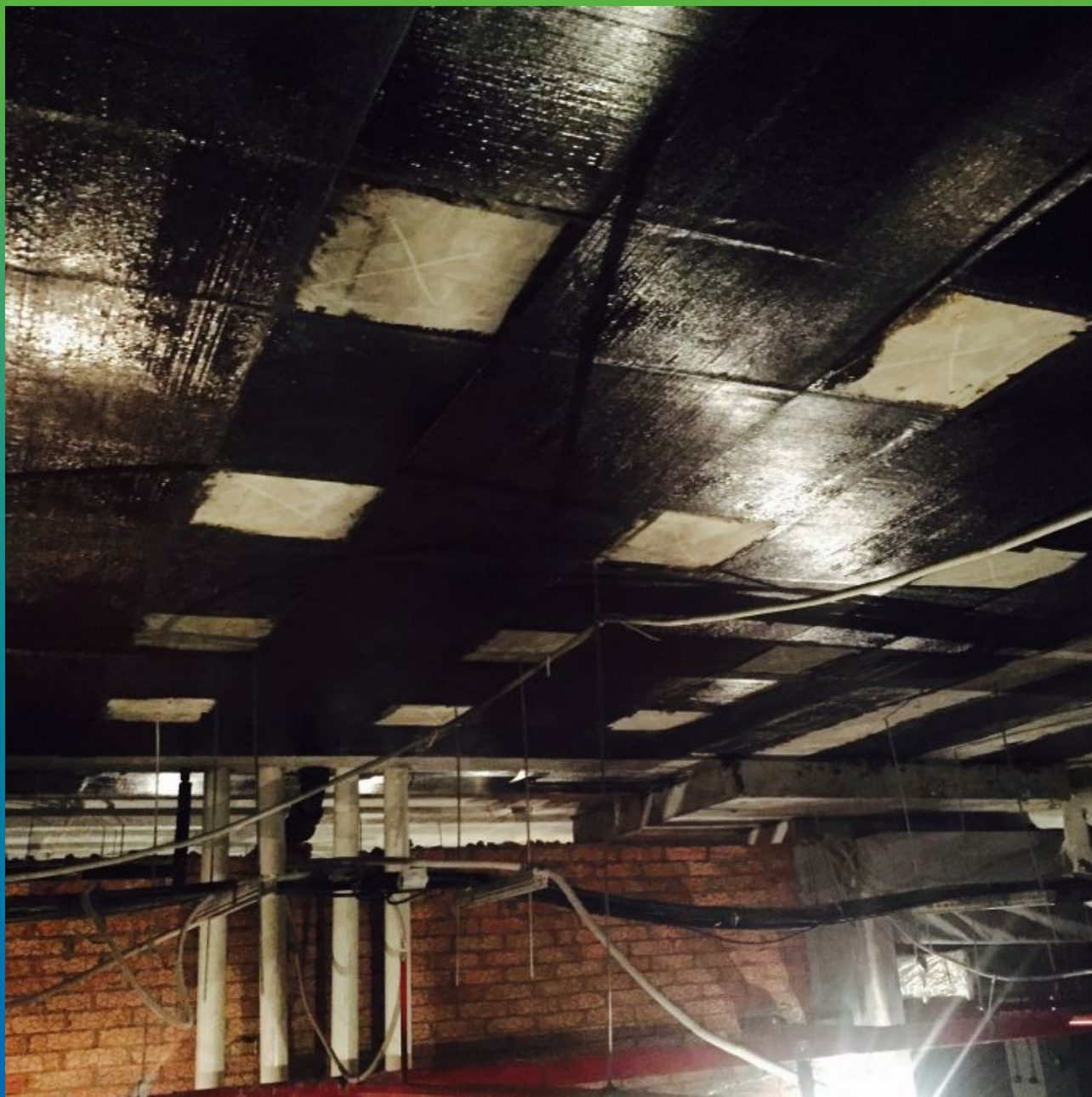
Смонтированная система усиления Армошел