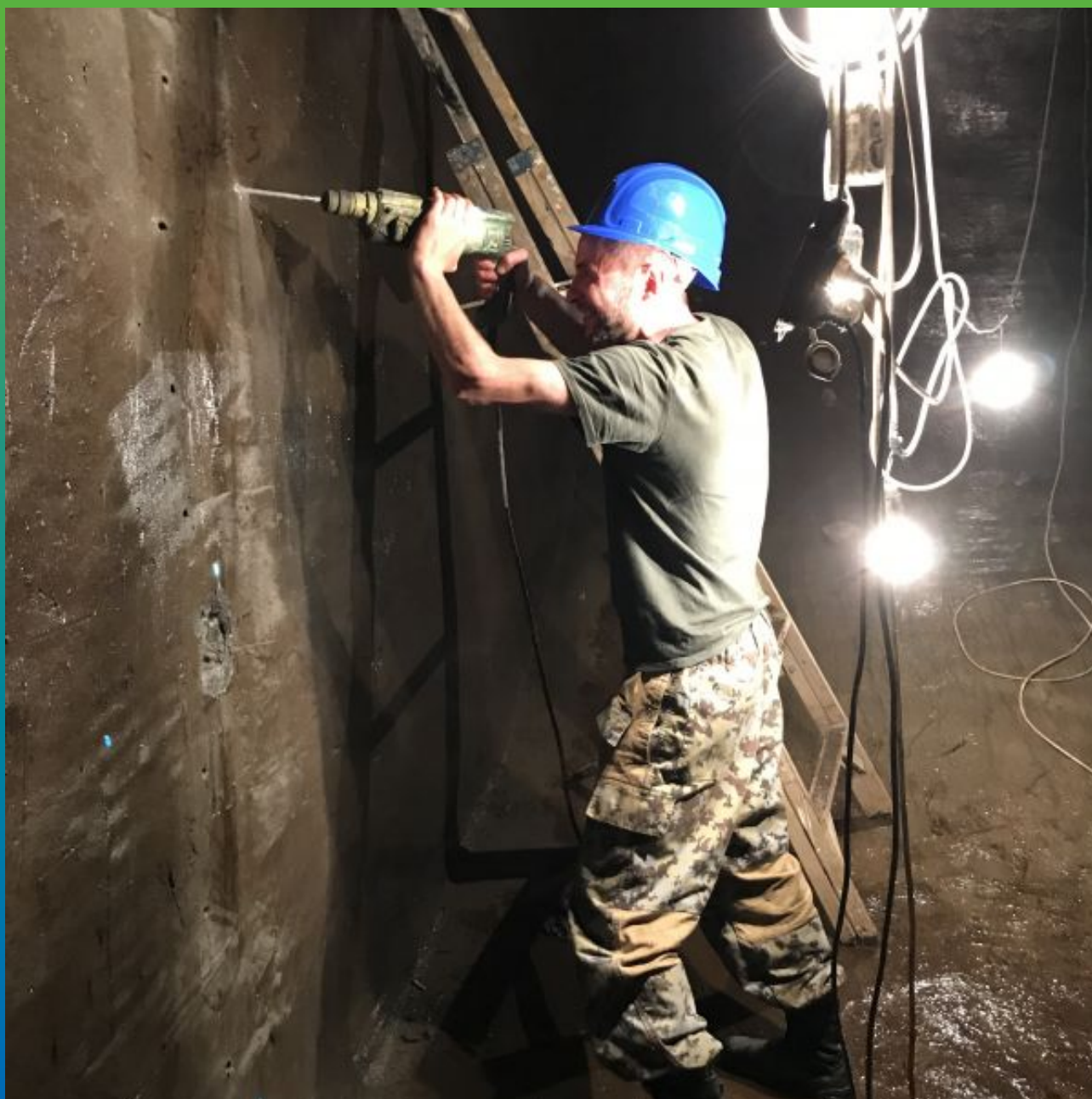
Бурение инъекционных каналов