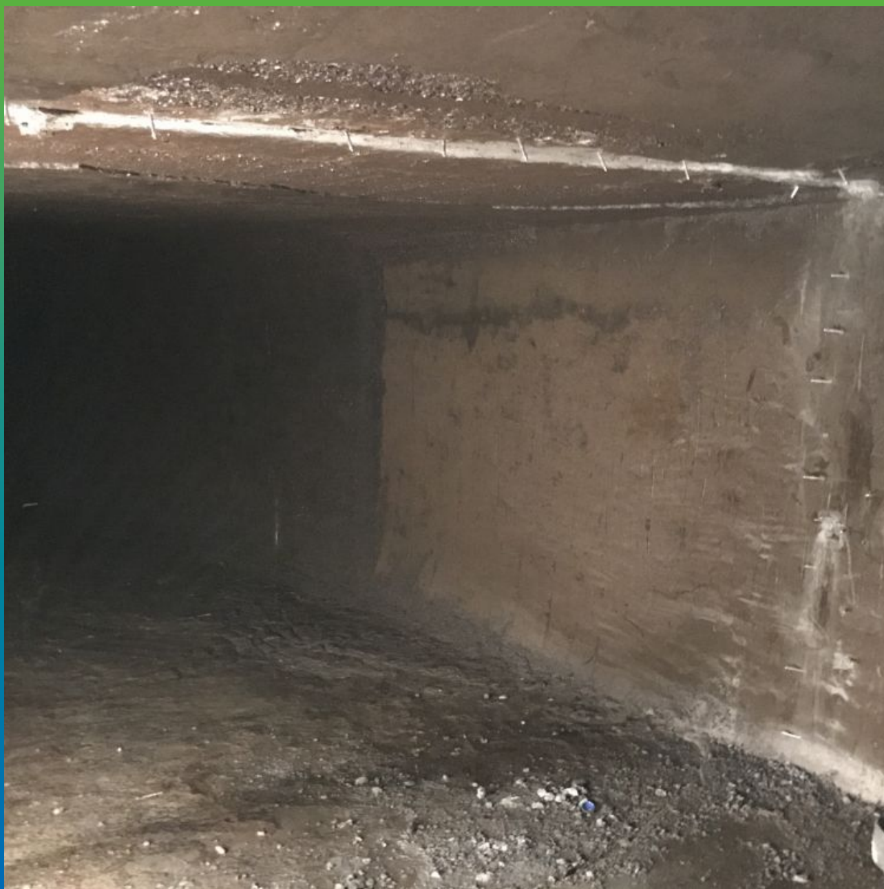
Шов, зачеканенный составом Максплаг