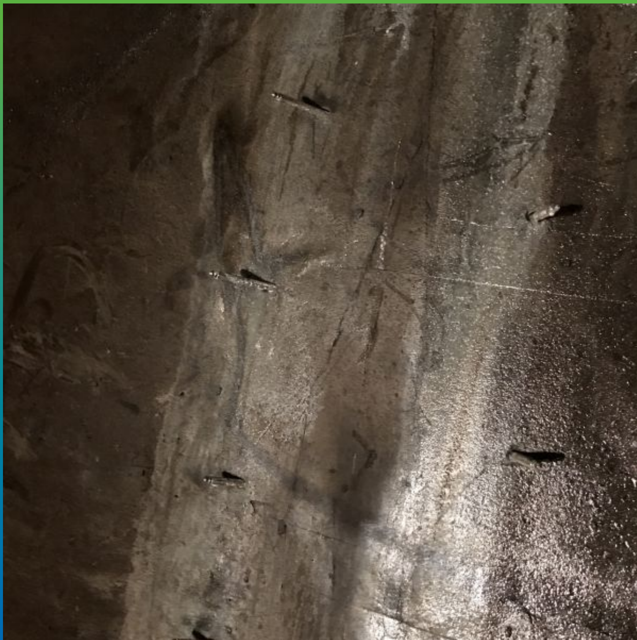
Вид на проинъектированный шов