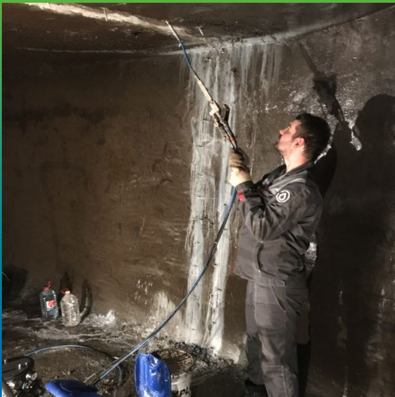
Инъектирование составов Манокрил Гель В + Манокрил Флекс