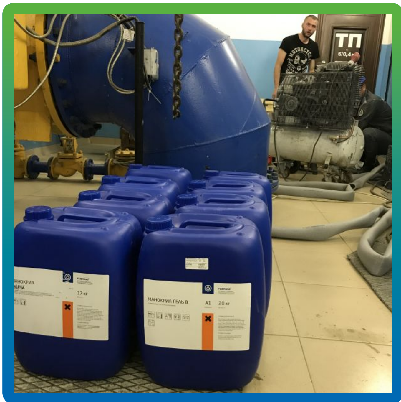
Трехкомпонентный "быстрый" акрилатный гель Манокрил Гель В и пластификатор Манокрил Флекс