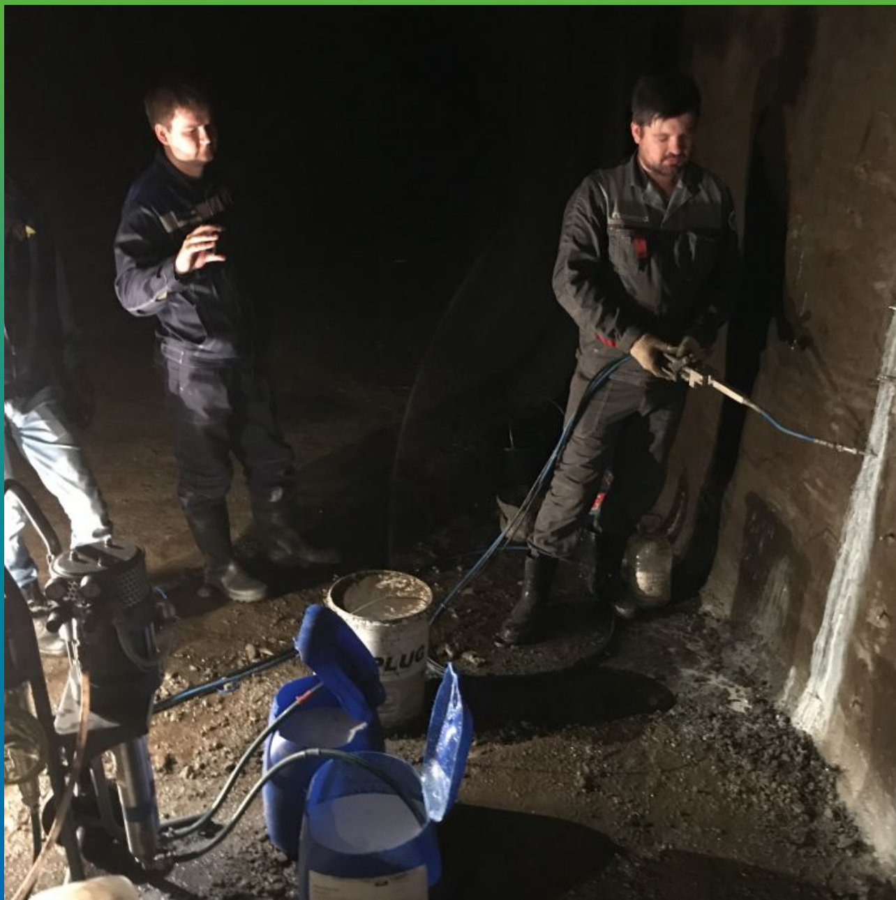
Инъектирование составов Манокрил Гель В + Манокрил Флекс