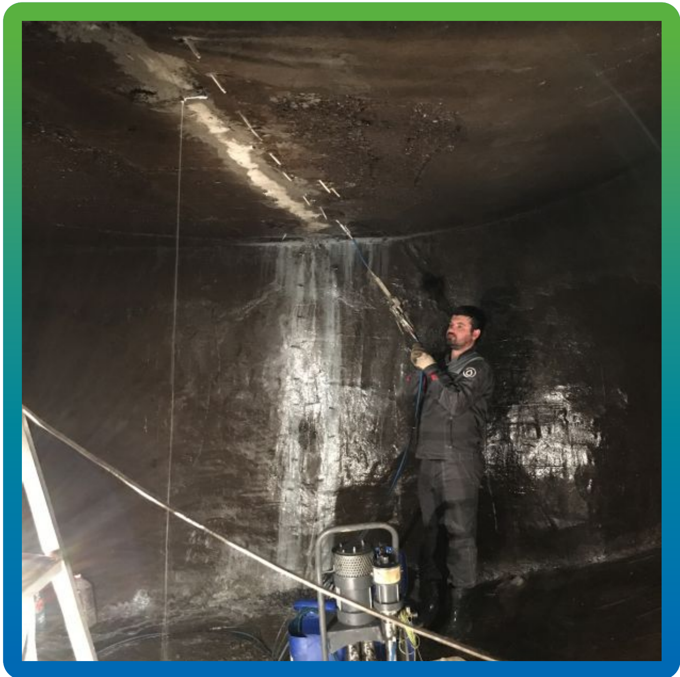
Инъектирование составов Манокрил Гель В + Манокрил Флекс