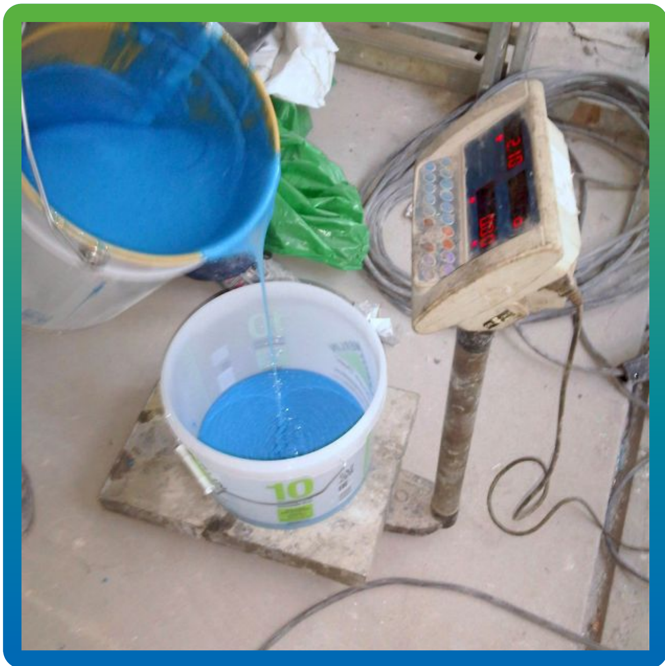
Смешение компонентов клея Манопокс 183