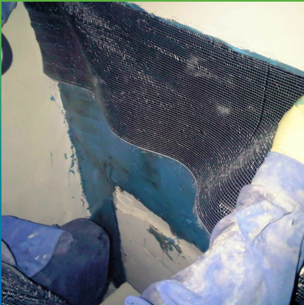
Приклеивание композитной ткани Армошел KB 200