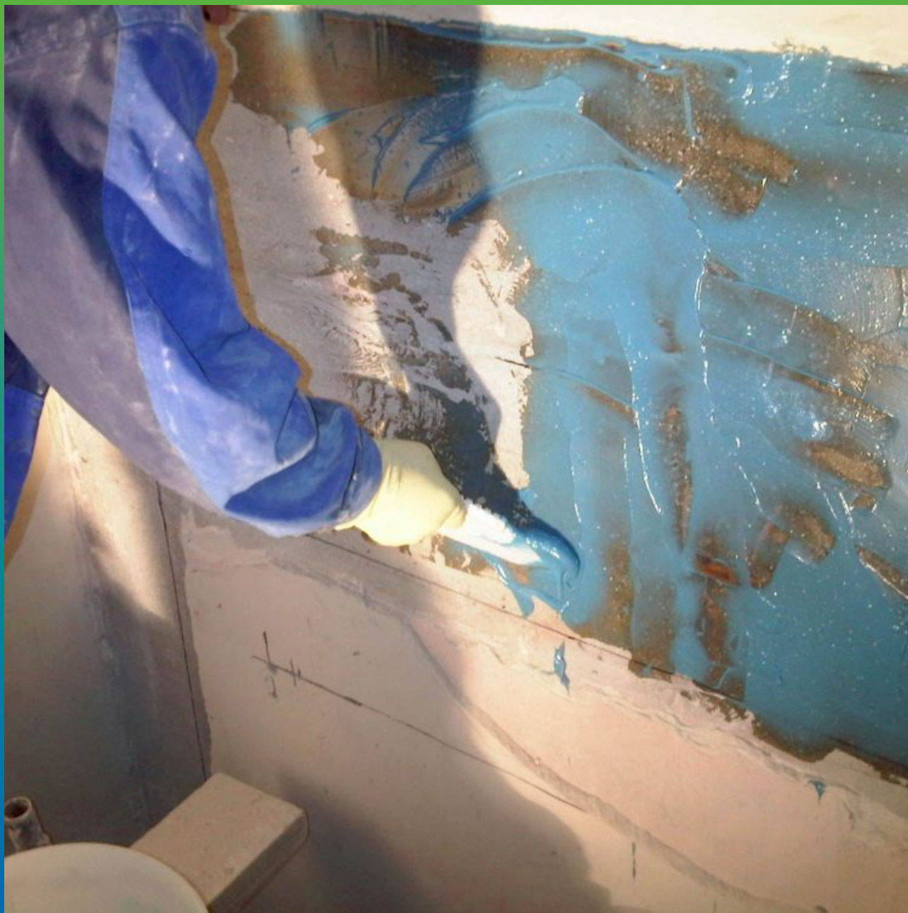
Нанесение клея Манопокс 183 на основание