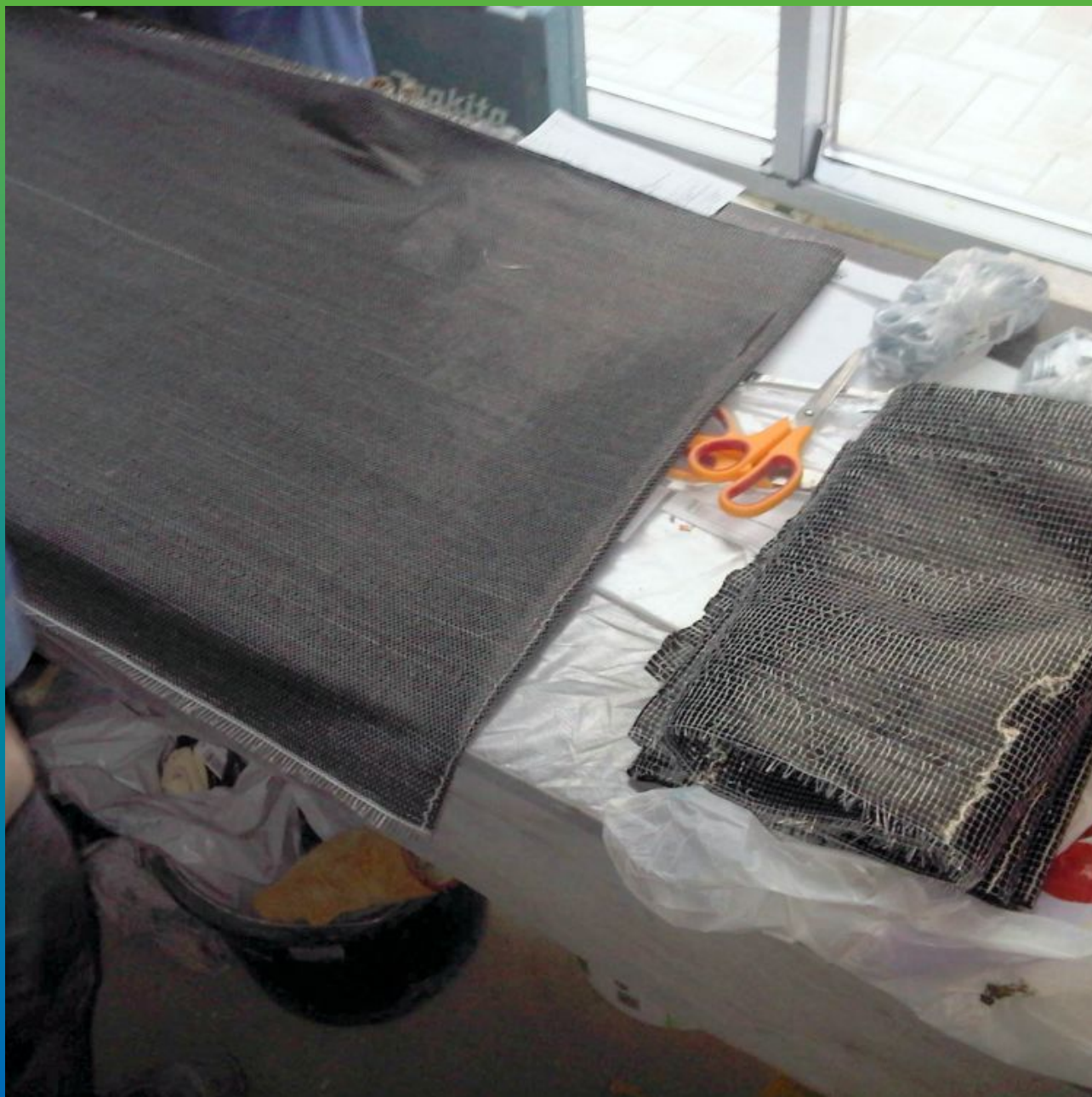
Подготовленные раскрои композитной ткани Армошел