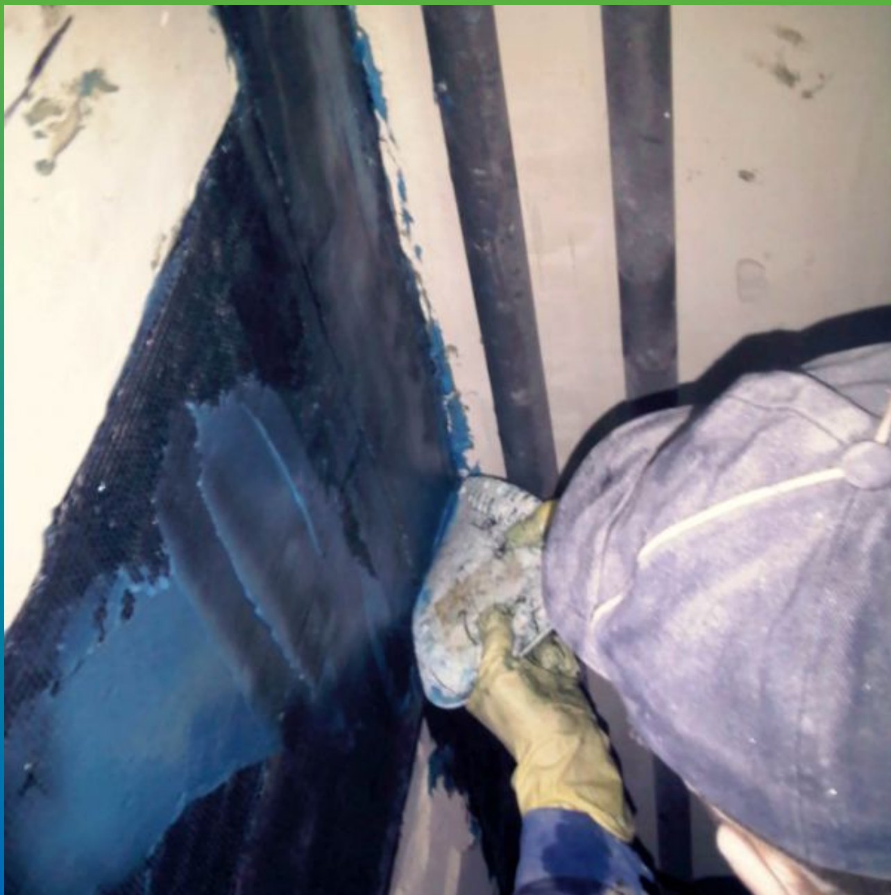
Нанесение запечатавающего слоя клея