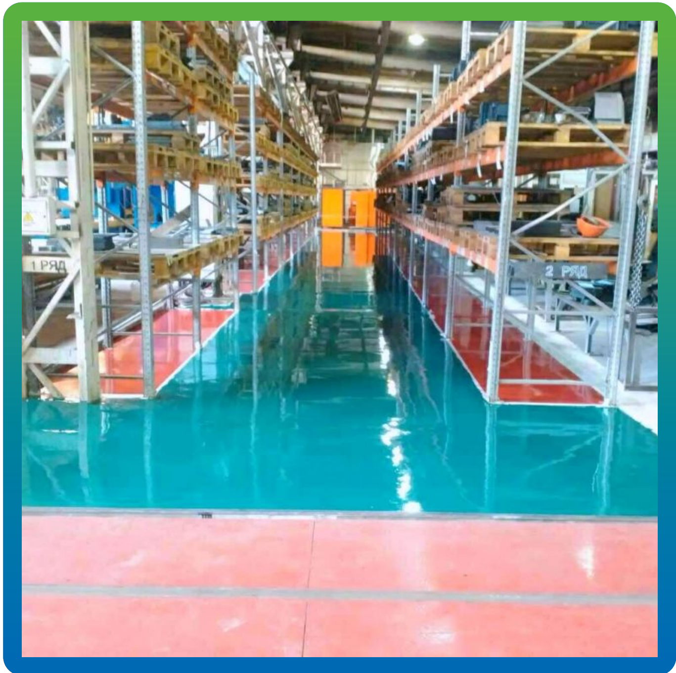
Конечный вид участка хранения деталей - другие цветовые решения