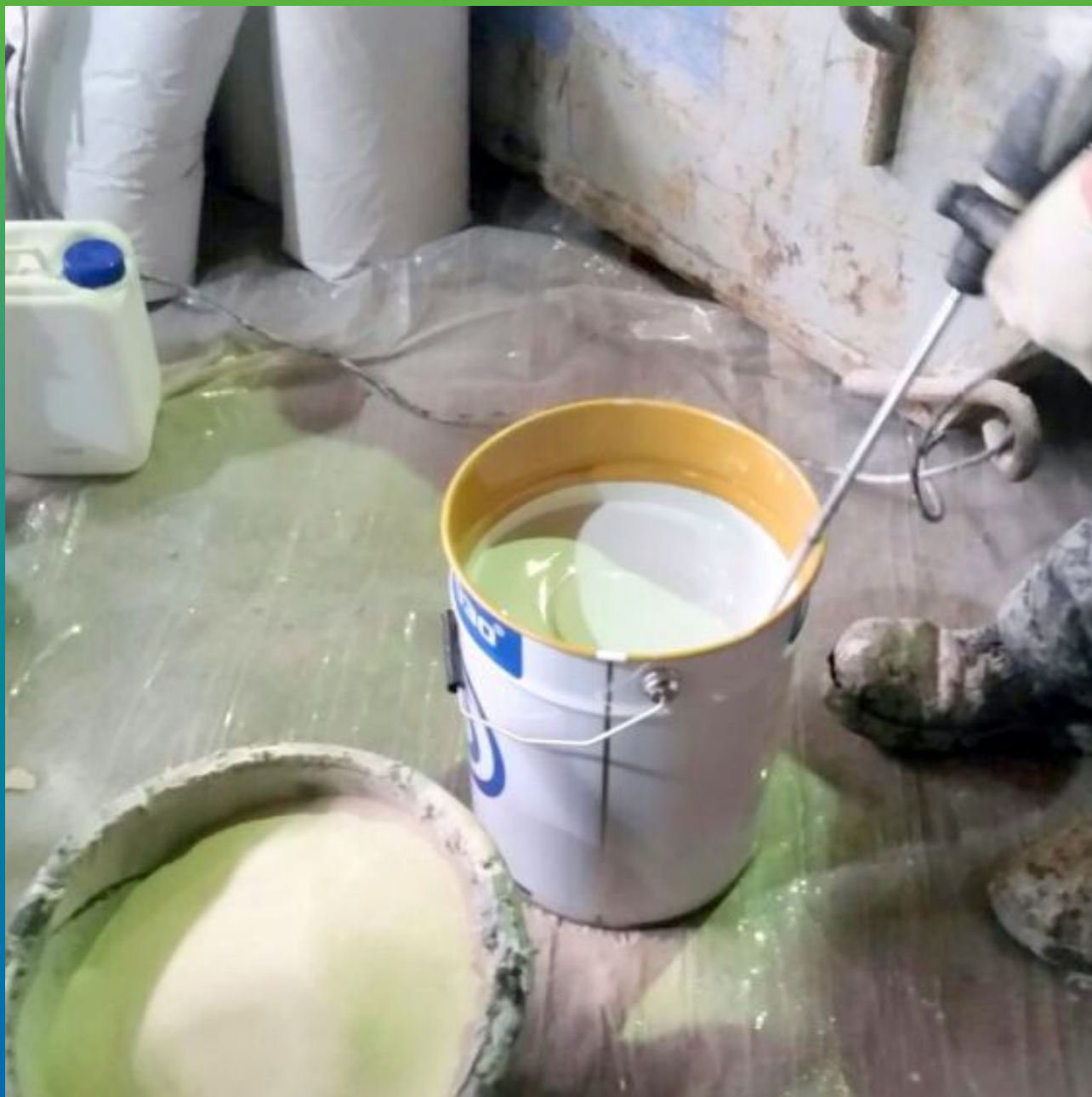
Смешение компонентов финишного покрытия ДенсТоп ЭП 500