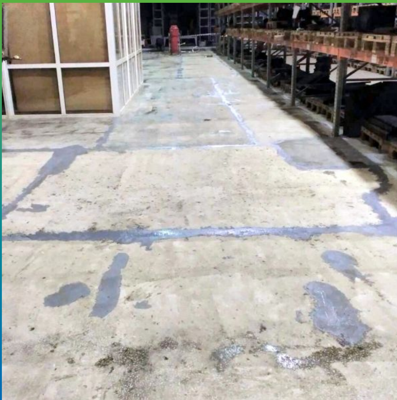
Заделка дефектов готовым эпоксидным ремонтником Манопокс 331