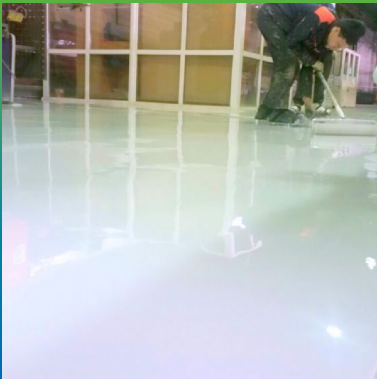
Итоговый вид готового покрытия