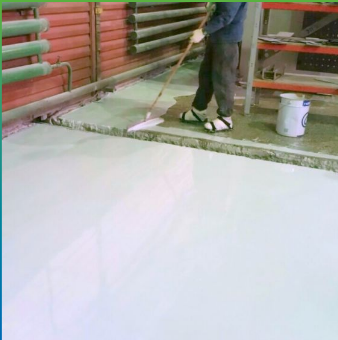
Удаление воздушных пузырей игольчатым валиком