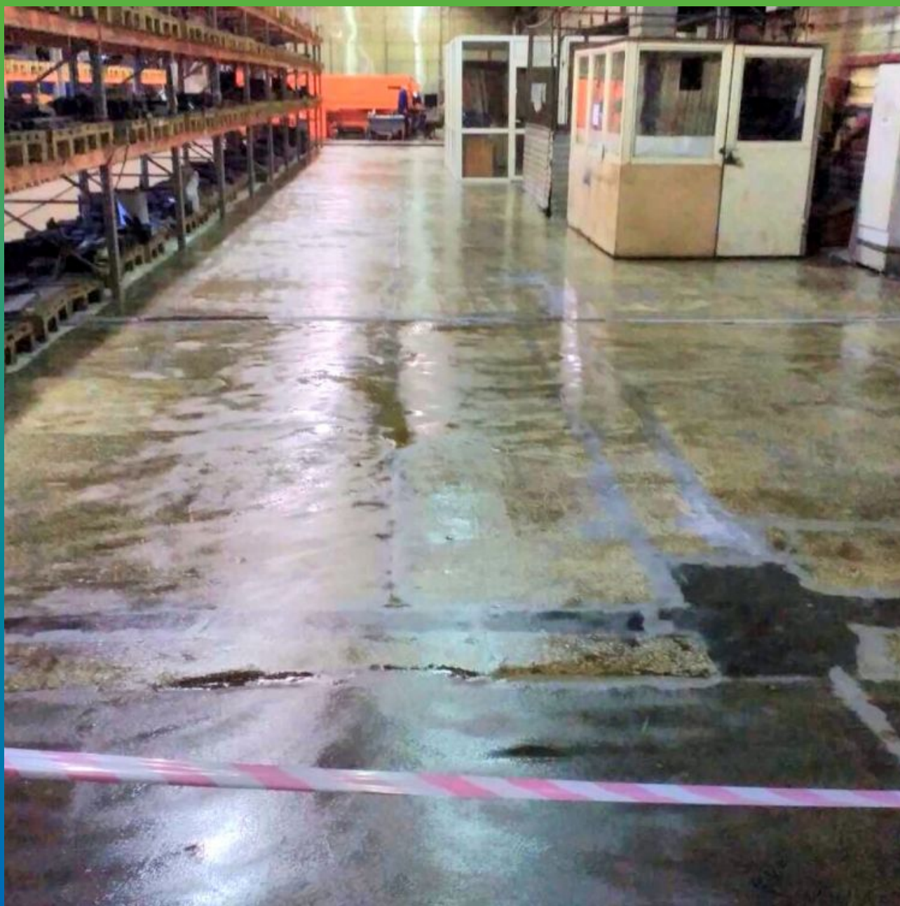
Грунтование площади эпоксидным составом ДенТоп ЭП 100