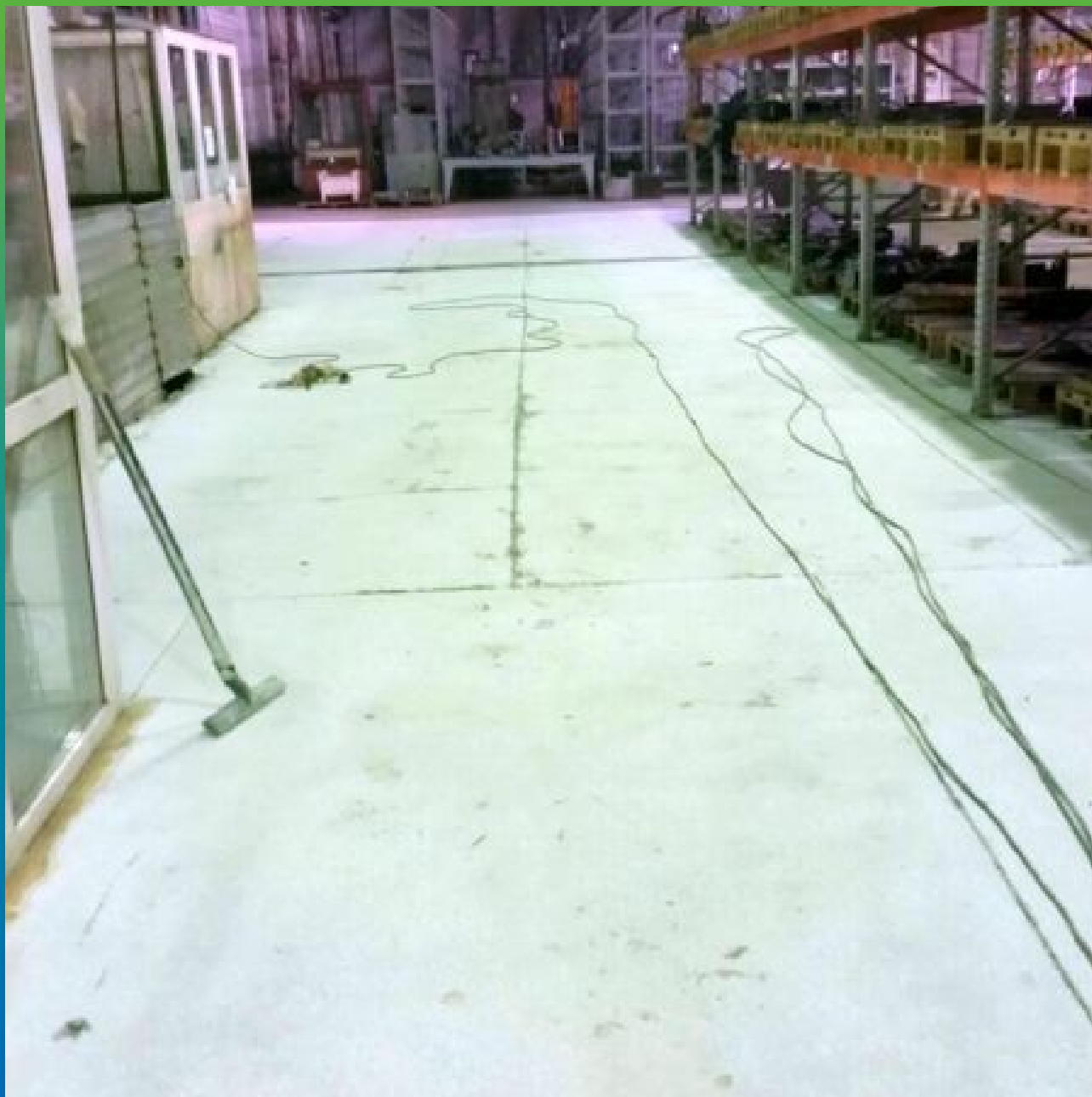
Общий вид площадки