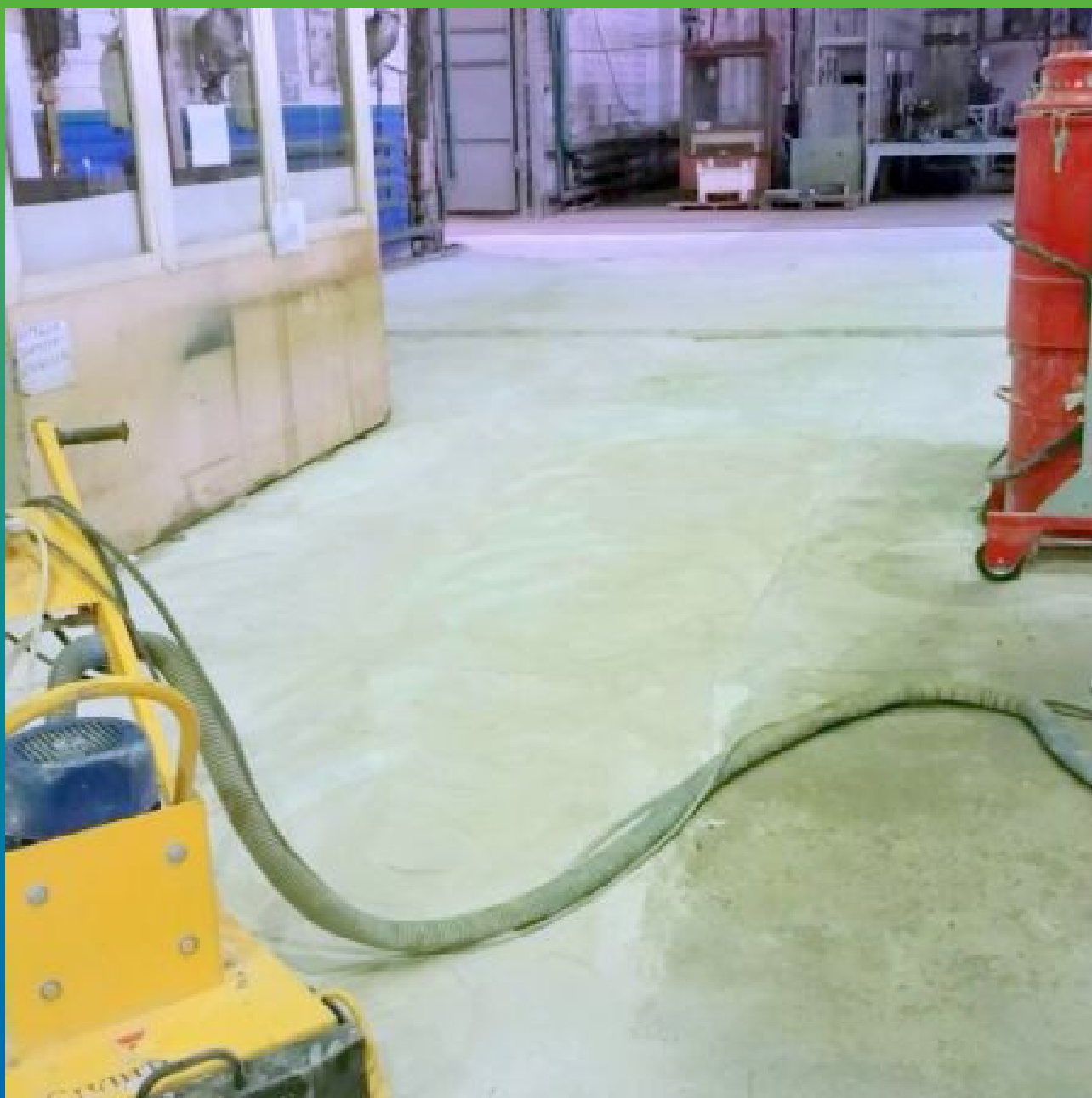
Шлифовка и выравнивание площадей