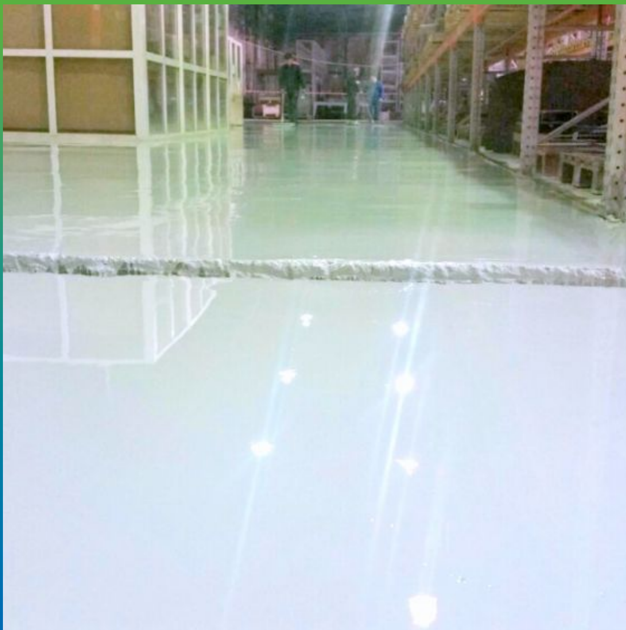
Общий вид на объект - готовое покрытие ДенсТоп ЭП 500