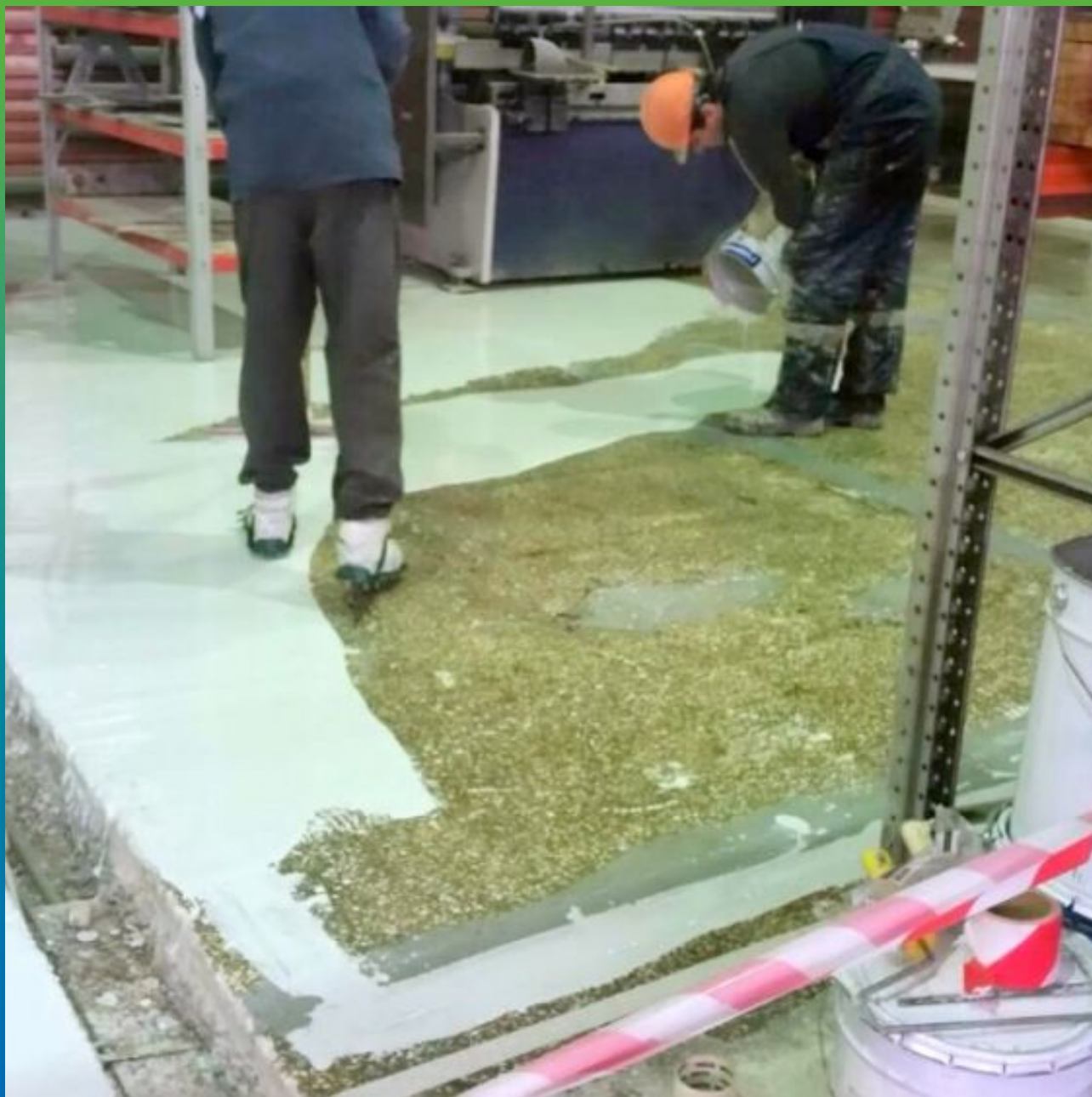
Распределение материала по площади