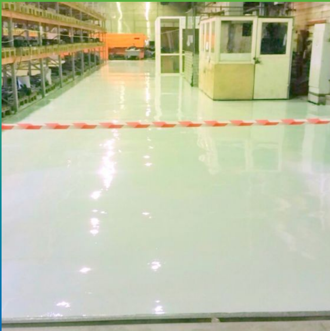
Общий вид на объект - готовое покрытие ДенсТоп ЭП 500