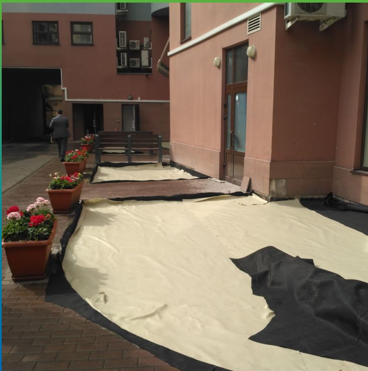
Гидроизоляция клумб на стилобате здания с применением ЭПДМ мембраны Преласты СТ