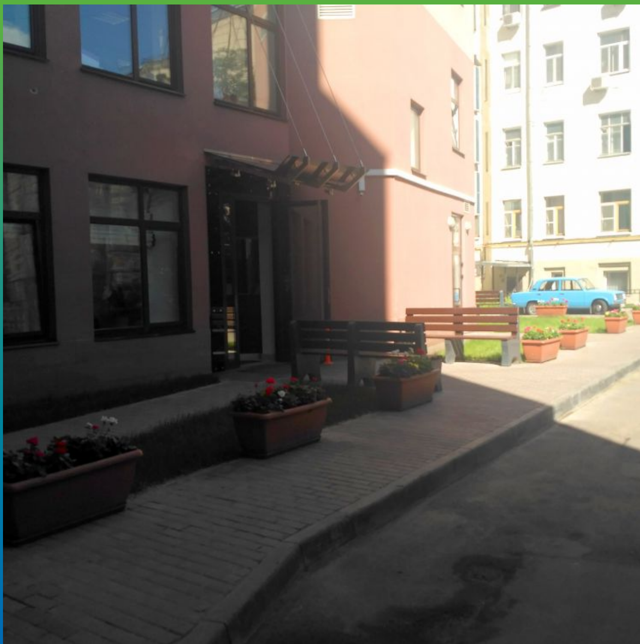
Конечный вид объекта