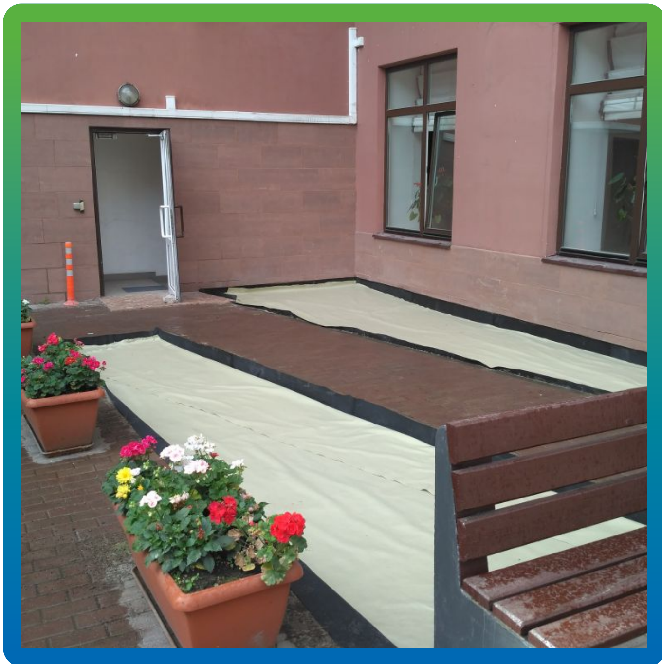
Гидроизоляция клумб с применением ЭПДМ мембраны Прелести СТ

Жилой комплекс, Малый Сухаревский переулок, д. 7