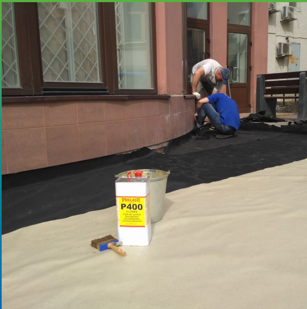
Монтаж мембраны к цокольной части здания с применением Адгезива П400

Жилой комплекс, Малый Сухаревский переулок, д. 7