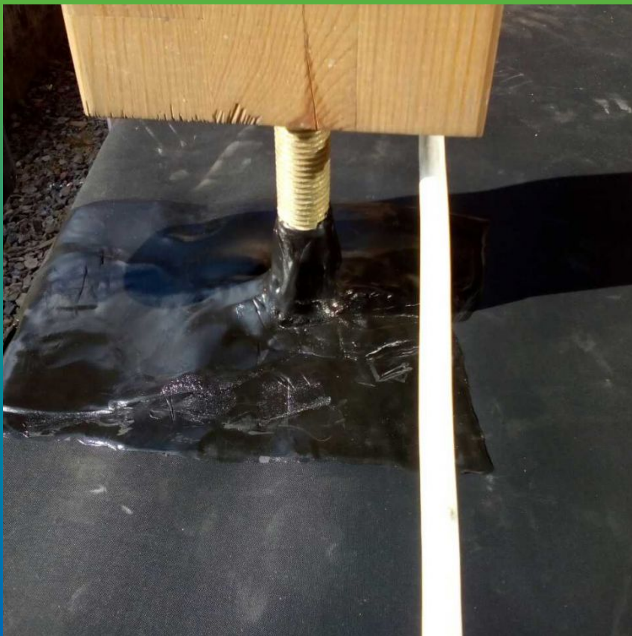
Герметизация локальных технологических отверстий на поверхности мембраны с применением ТПО ленты