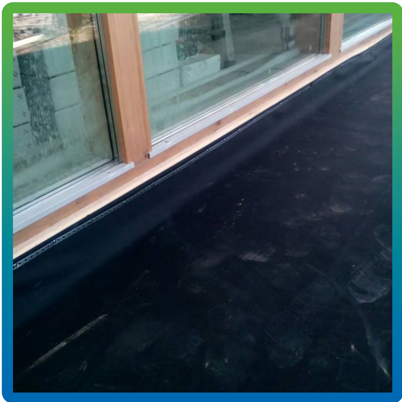
Применение монтажной ленты