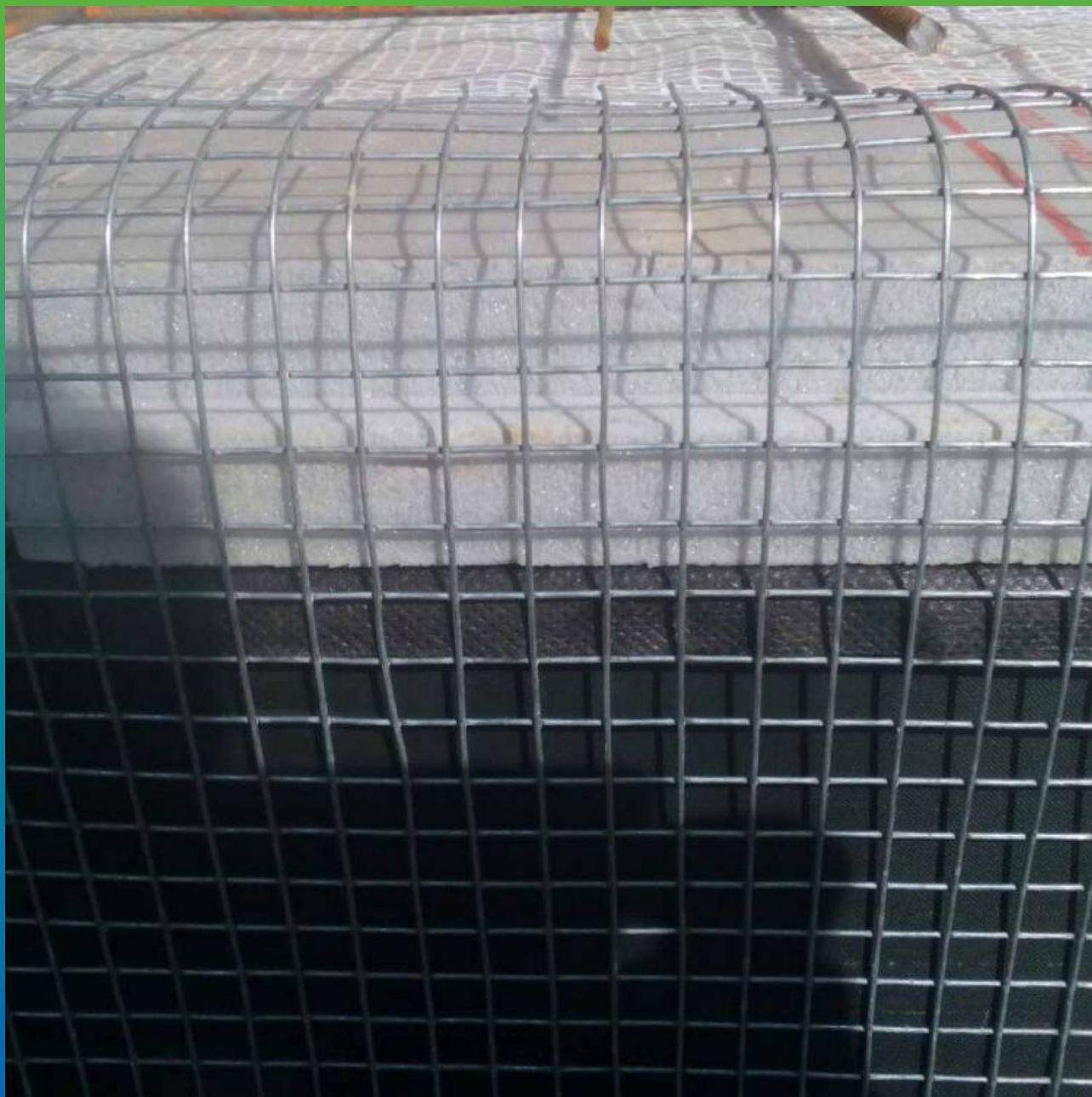
Установка утеплителя и сетки для дальнейшей заливки