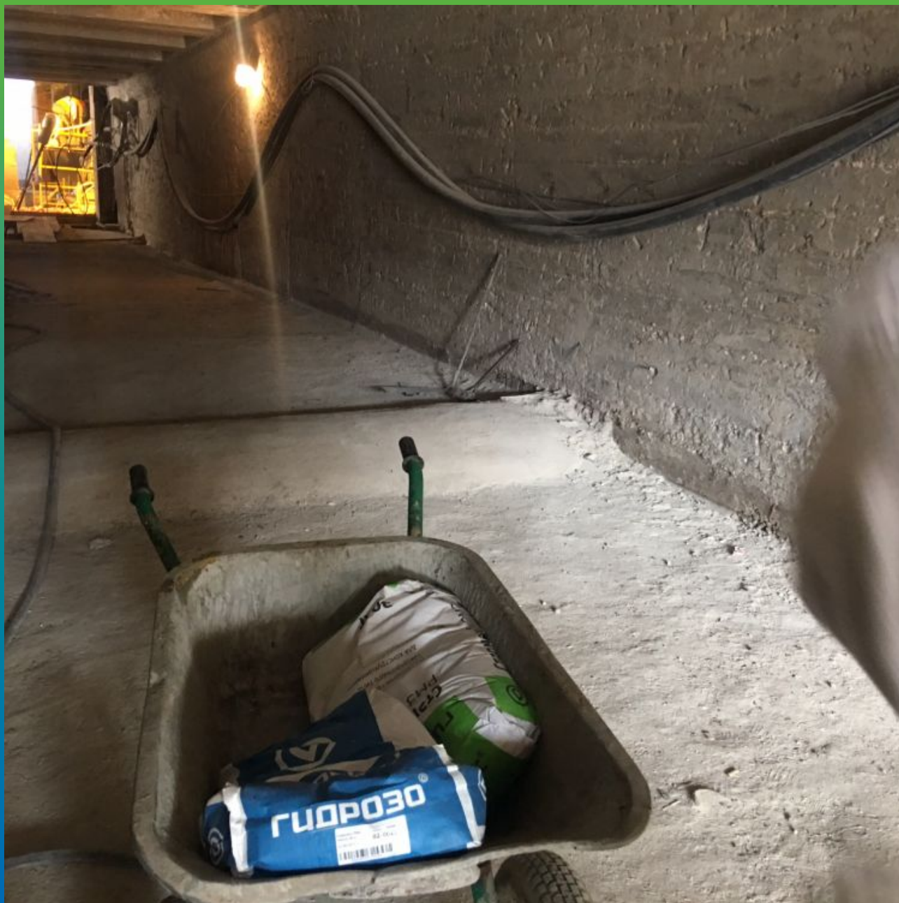
Ремонтные материалы Гидрозо: Стармекс РМ3 и Стармекс РМ2