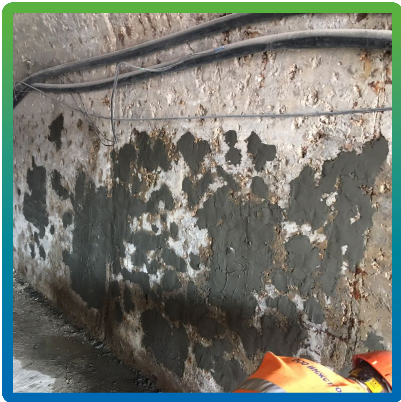
Общий вид ремонтируемого участка