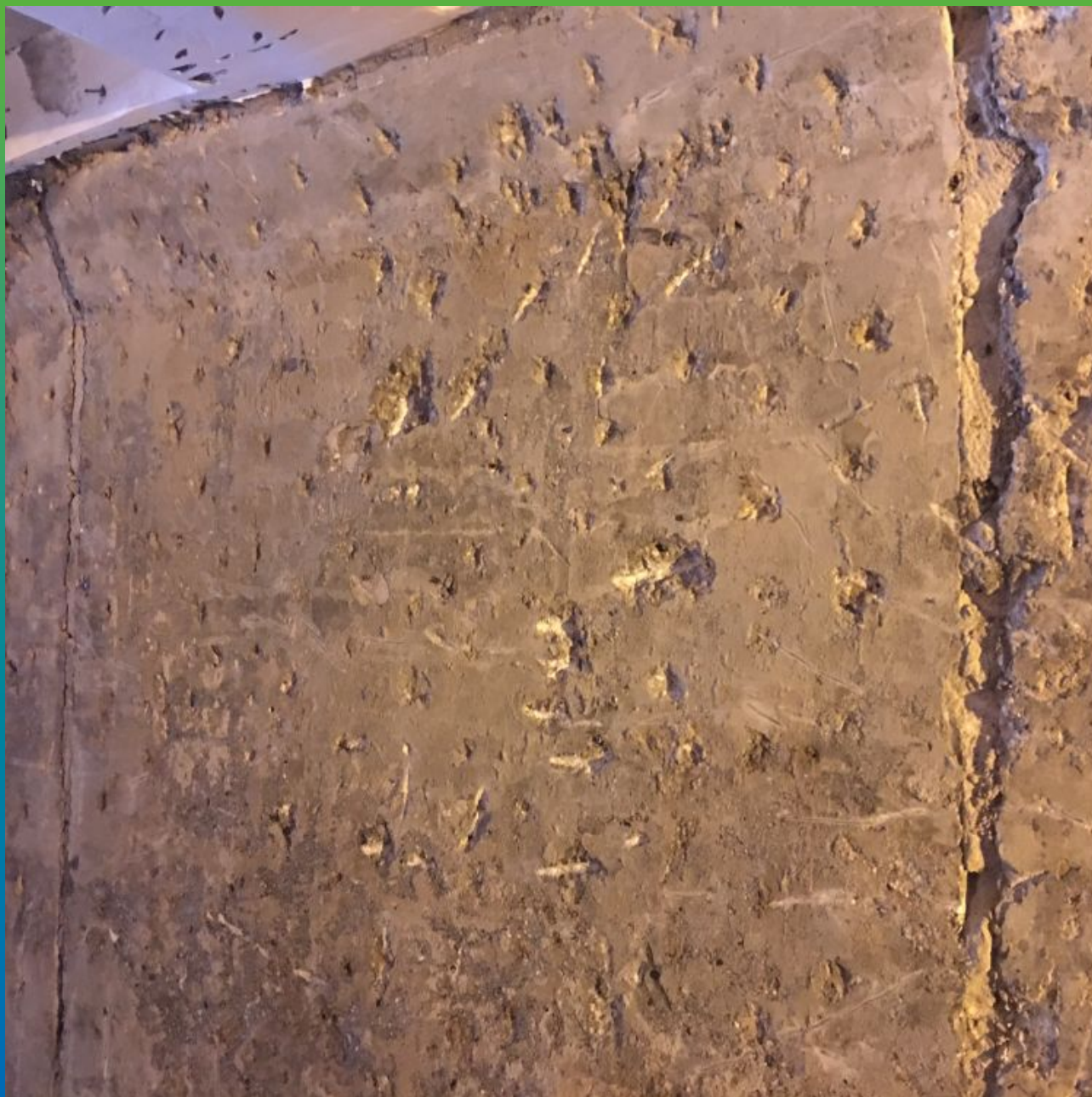
Общий вид стен пешеходного перехода