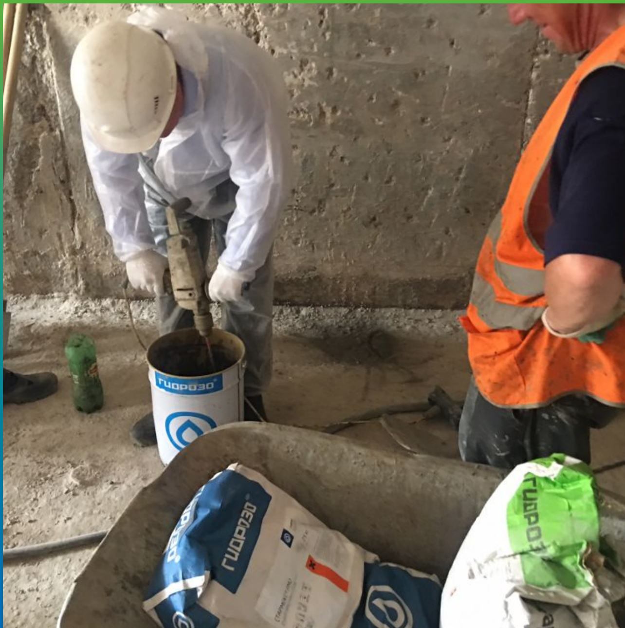
Приготовление ремонтного состава Стармекс РМЗ