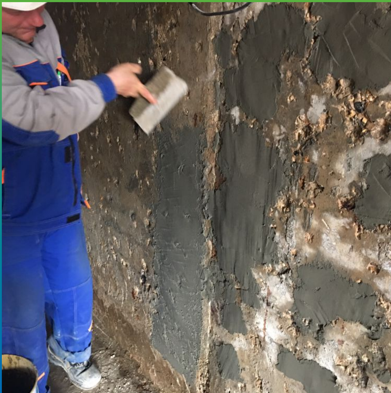
Нанесение тонкослойного ремонтного материала Стармекс РМ2