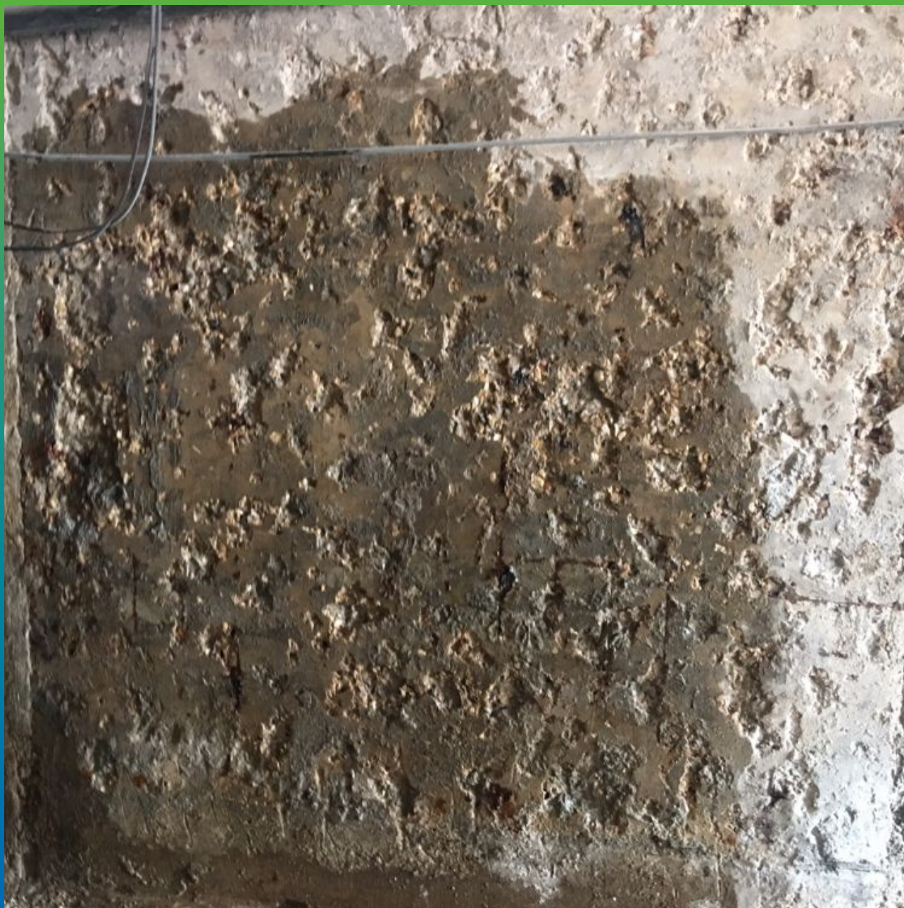
Смачивание ремонтируемой поверхности