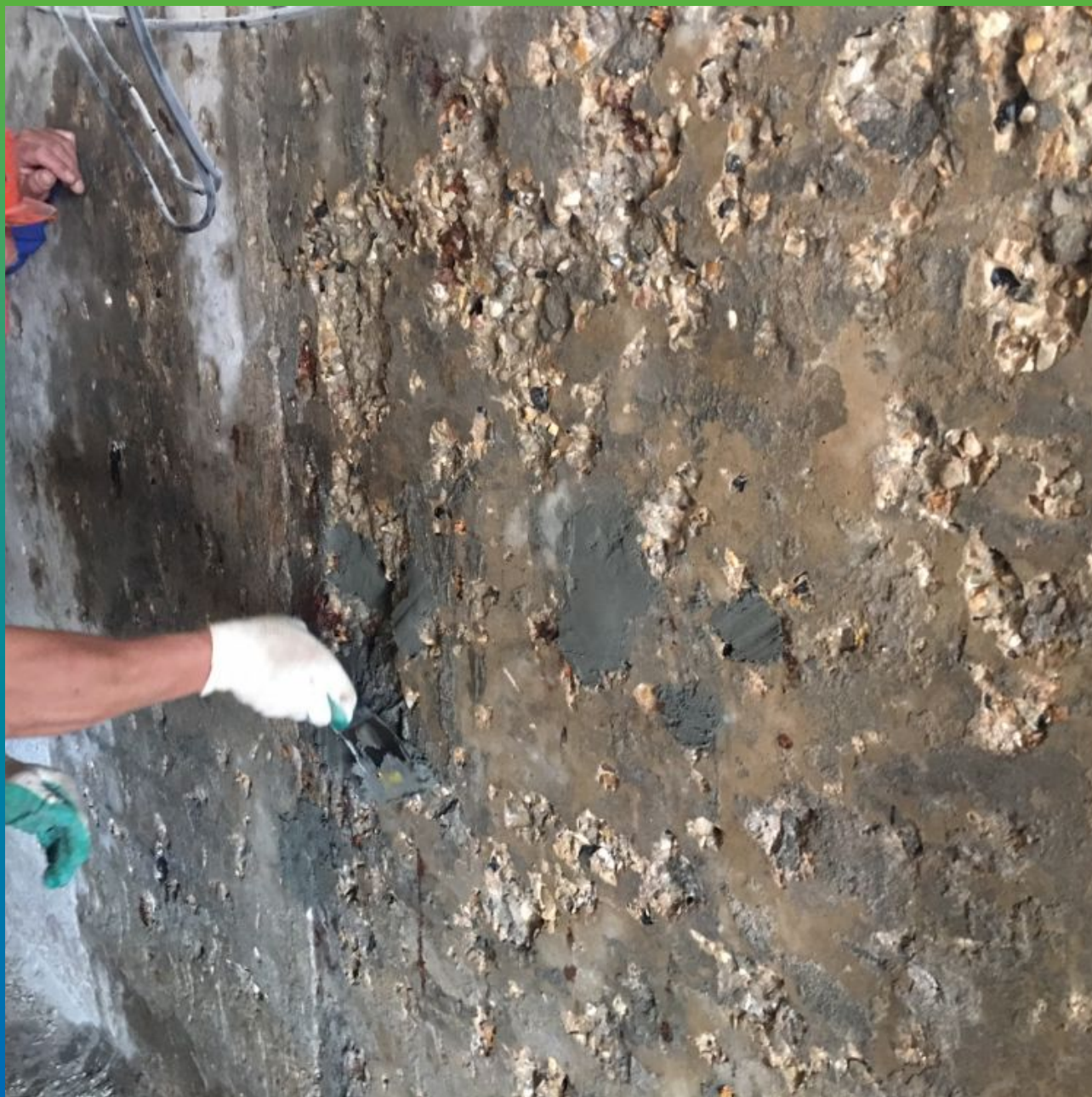
Восстановление поверхности тиксотропным материалом Стармекс РМЗ