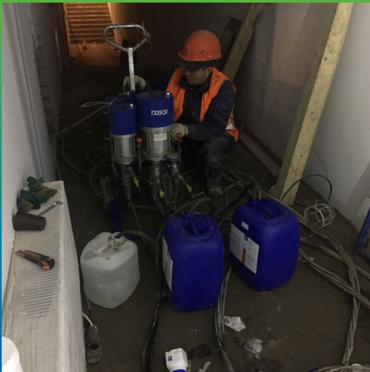
Материал и оборудование