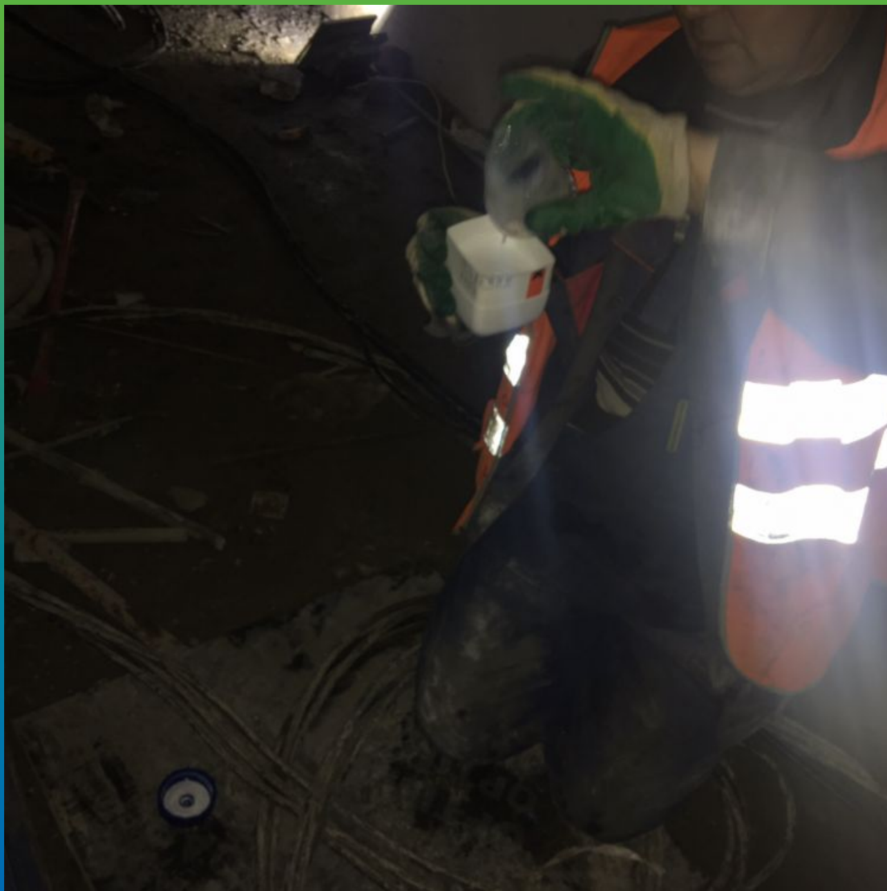
Пробное замешивание геля