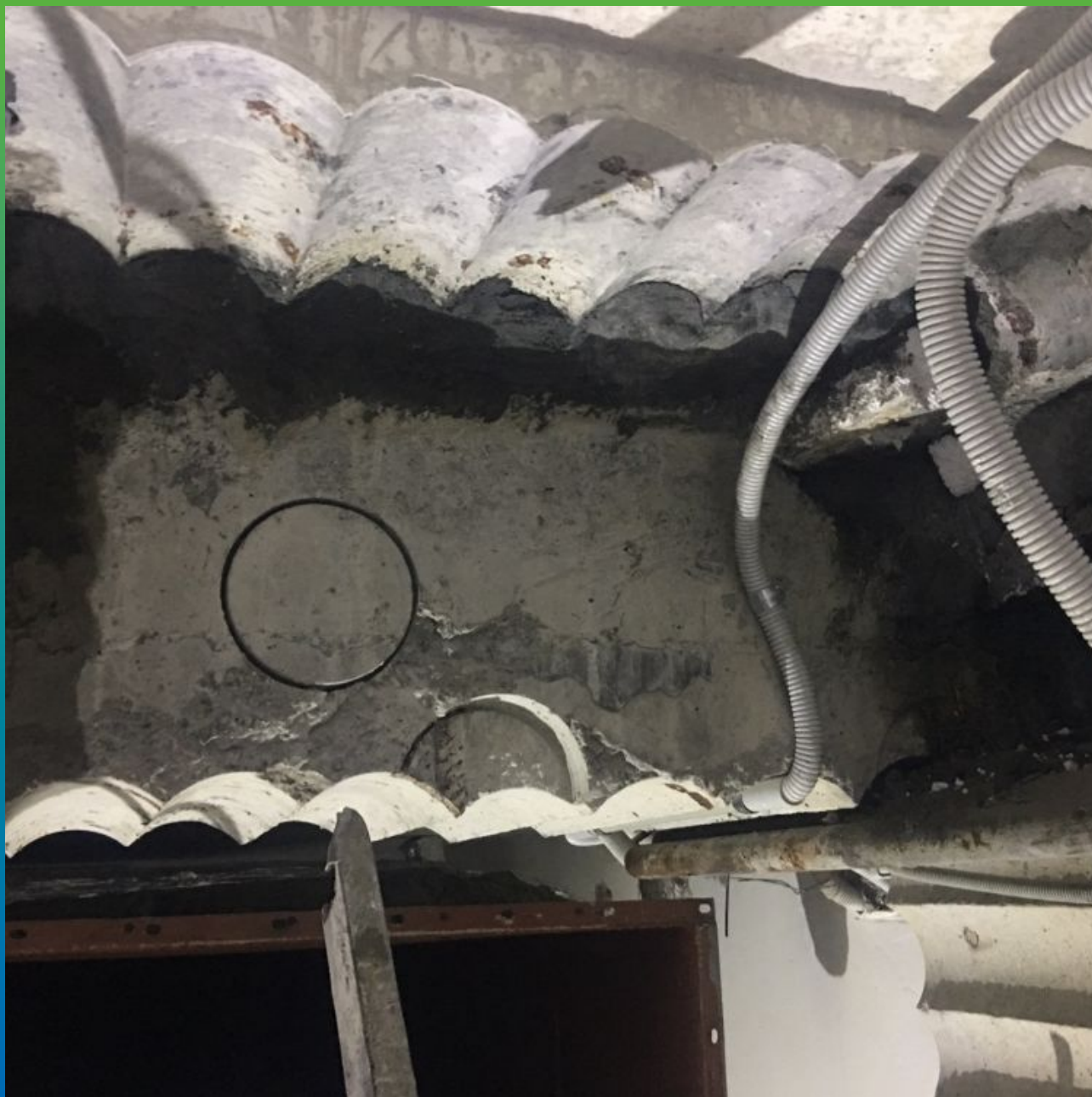
Установленные пакеры в деформационный шов