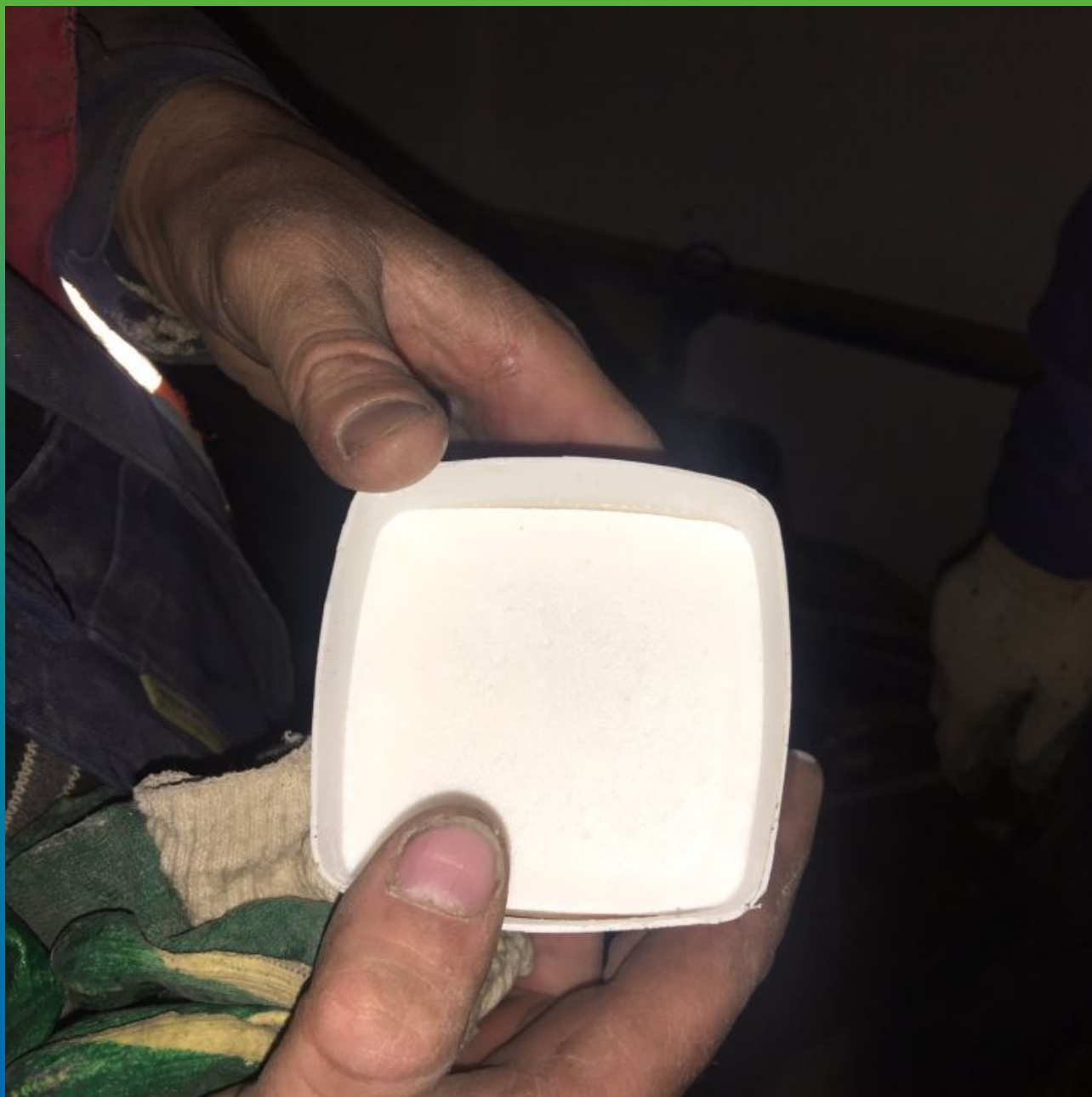
Пробное замешивание геля