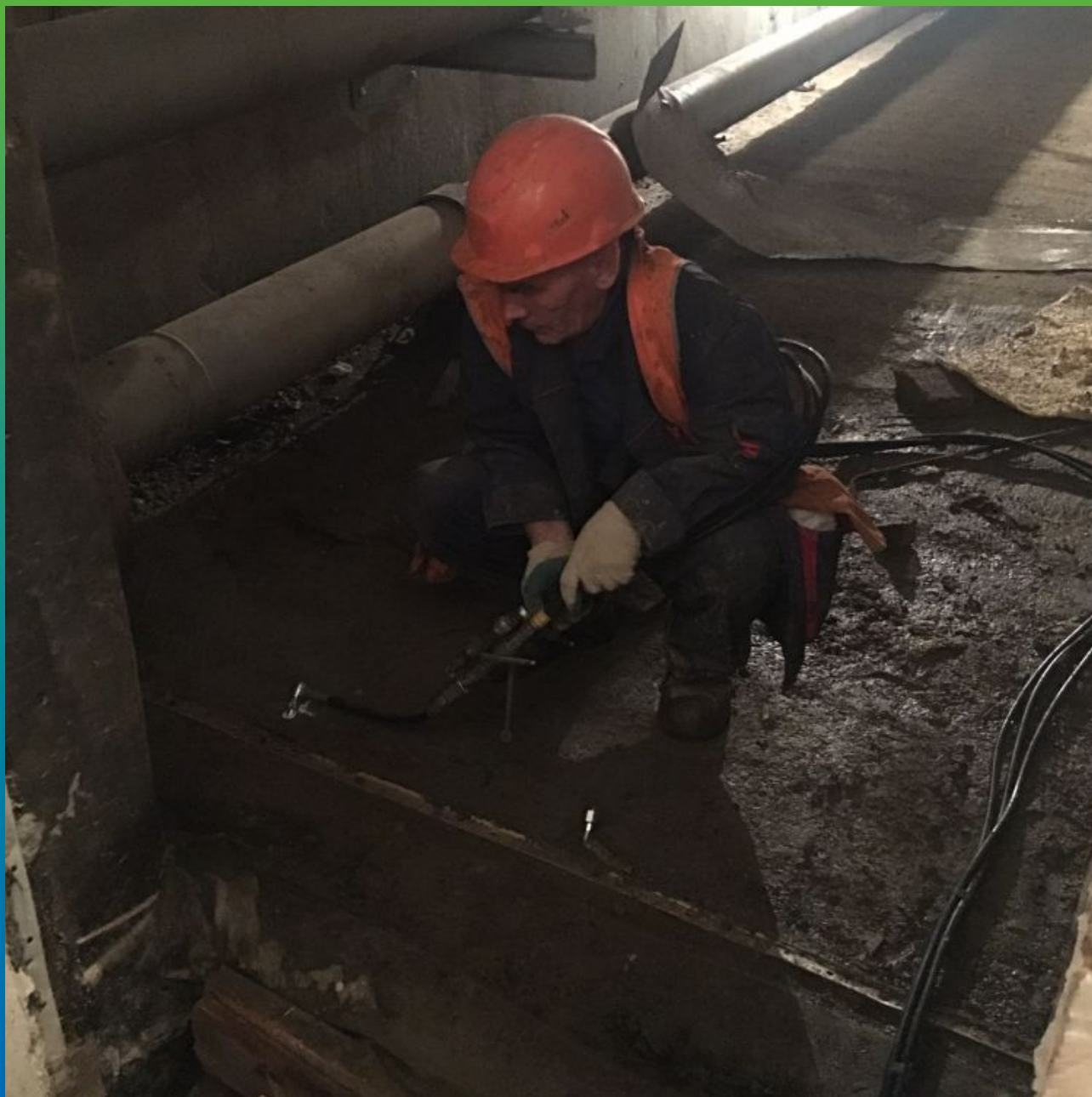
Инъектирование деформационного шва: Манокрил Гель В + Манокрил Флекс Тикс