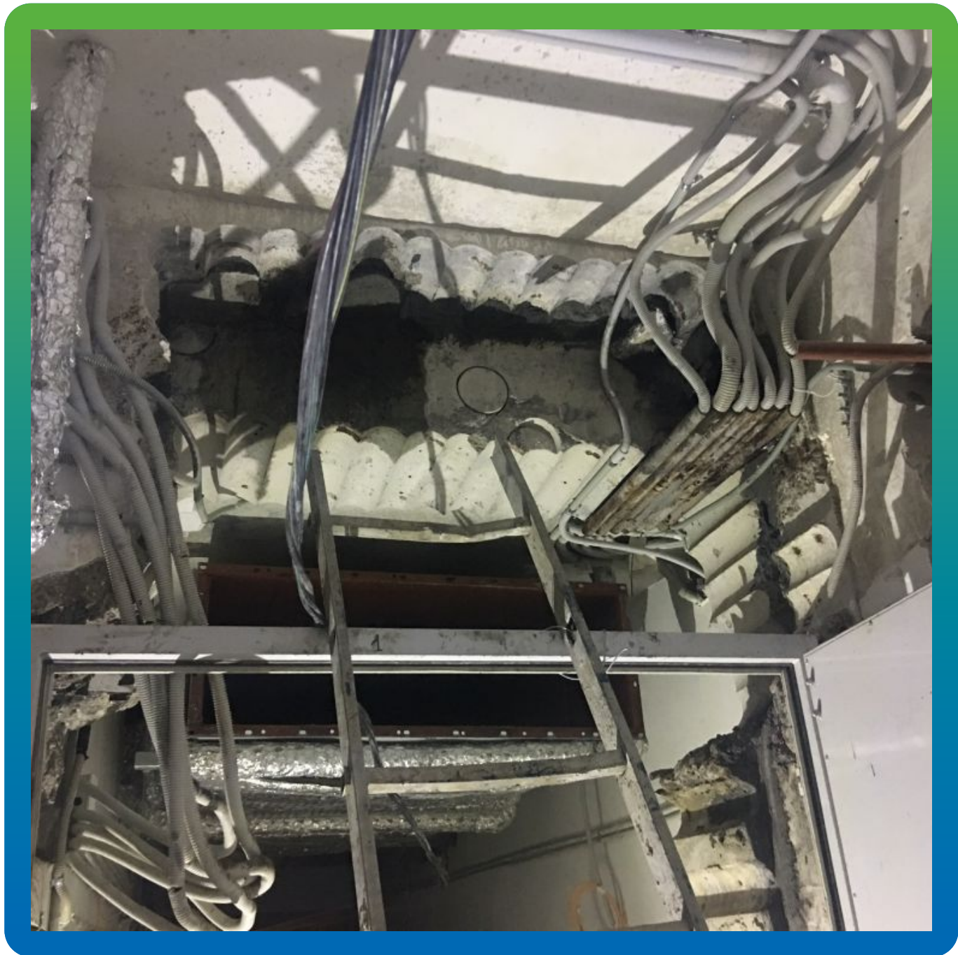
Вид деформационного шва