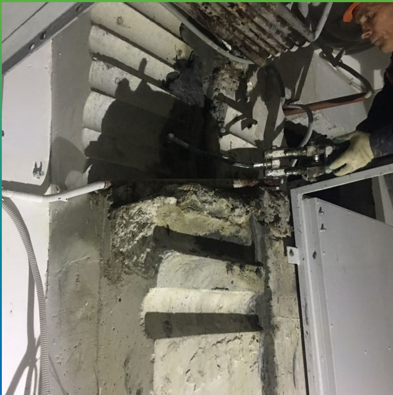
Инъектирование деформационного шва: Манокрил Гель В + Манокрил Флекс Тикс