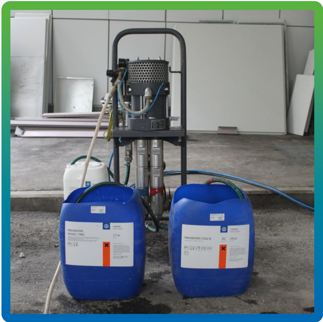
Оборудование и материалы на объекте