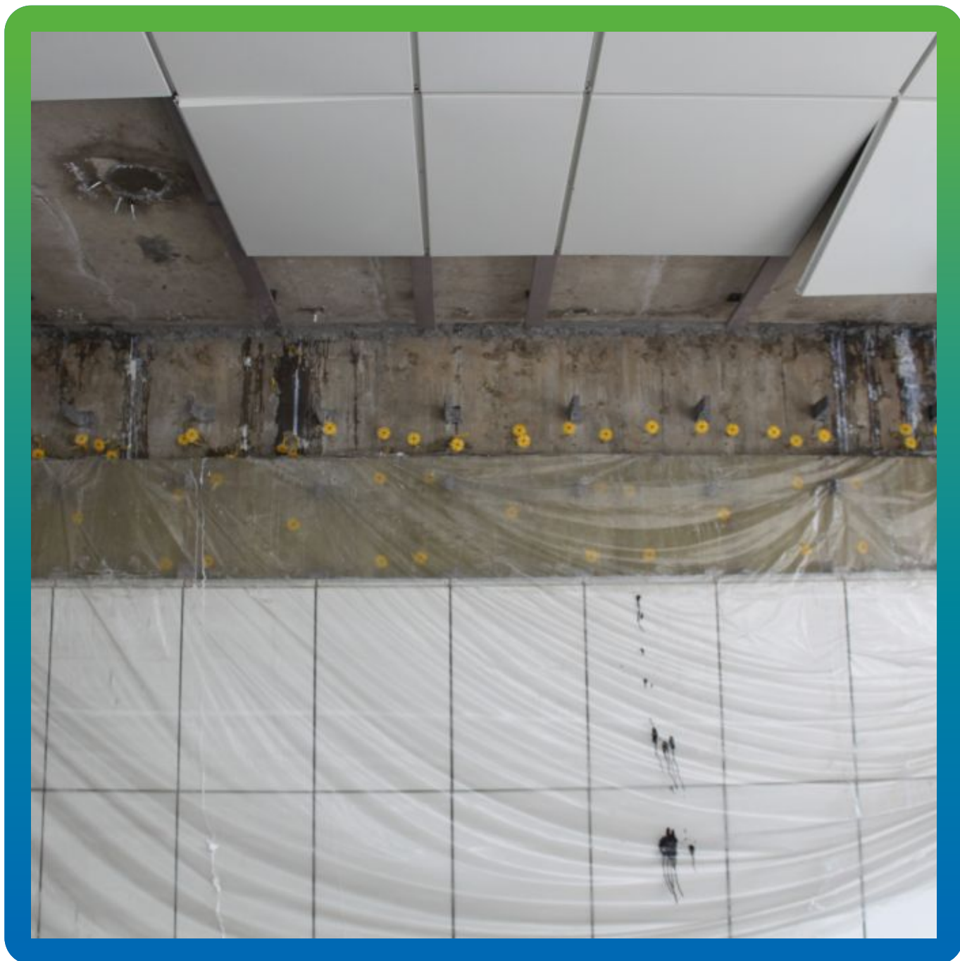
Результат проведенных работ