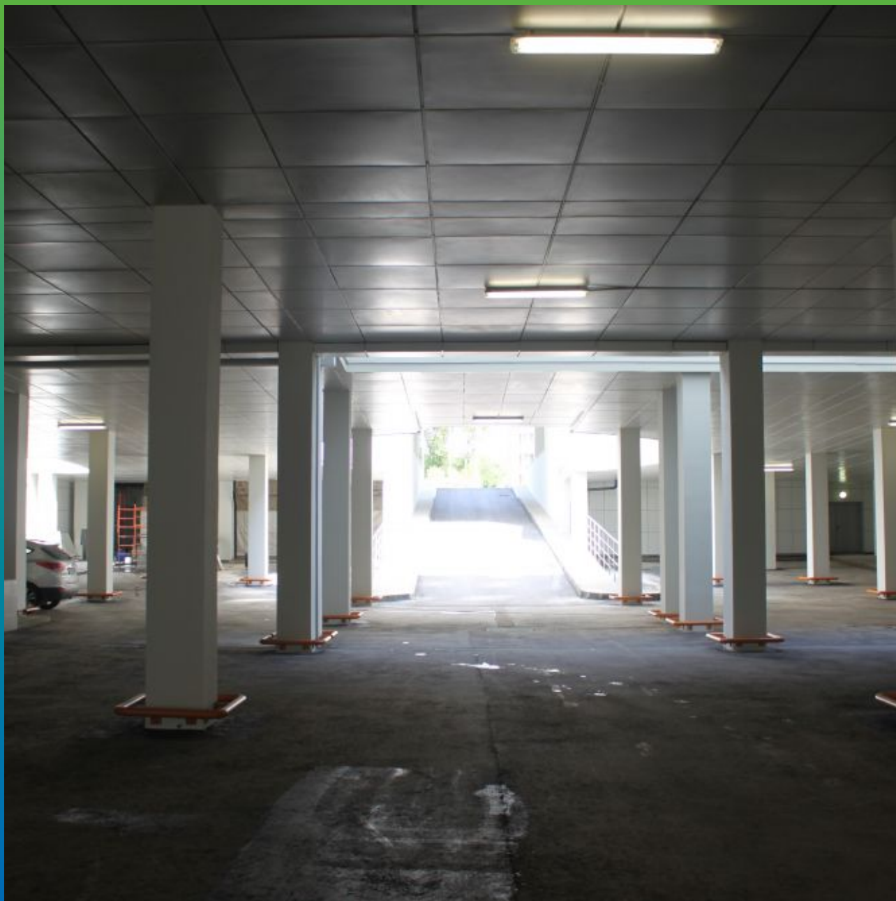
Вид объекта изнутри