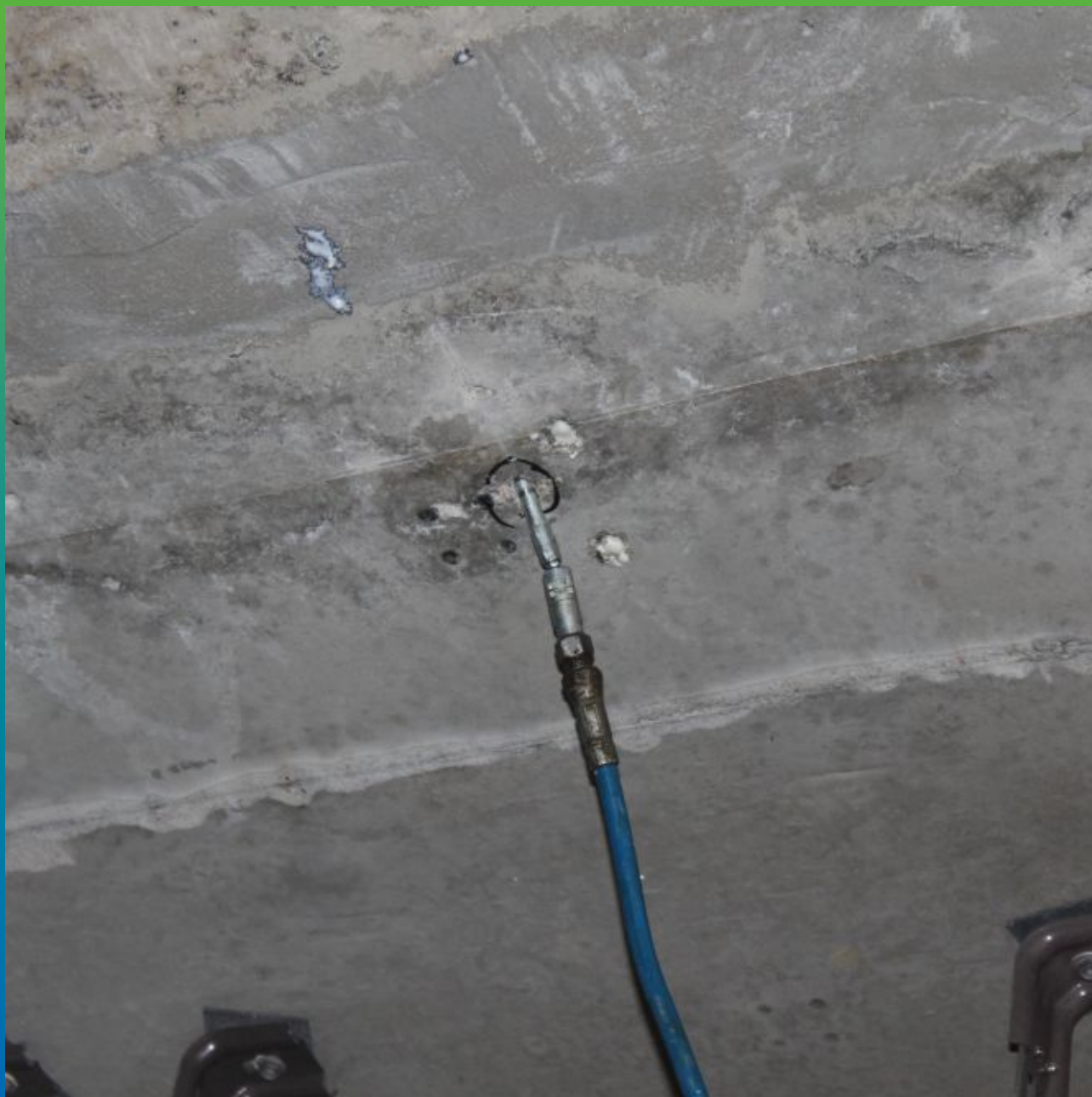
Выполнение работ по инъектированию