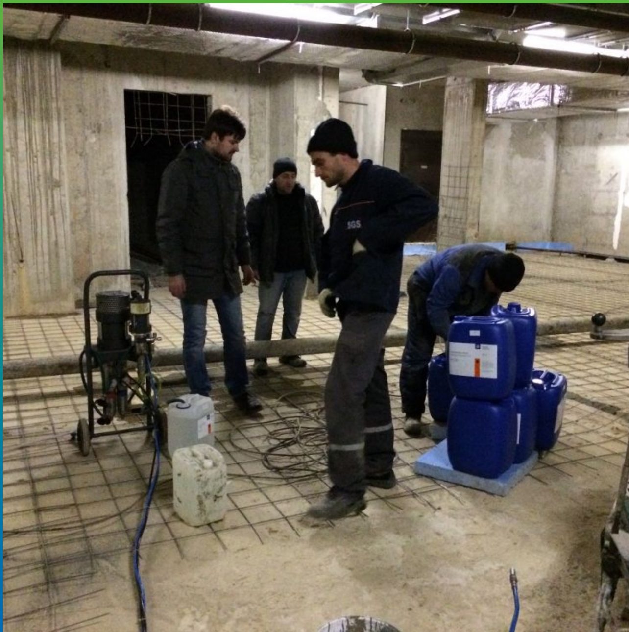
Подготовка инъекционного насоса БМ 1425 и акрилатного геля Манокрил Гель В к началу работ