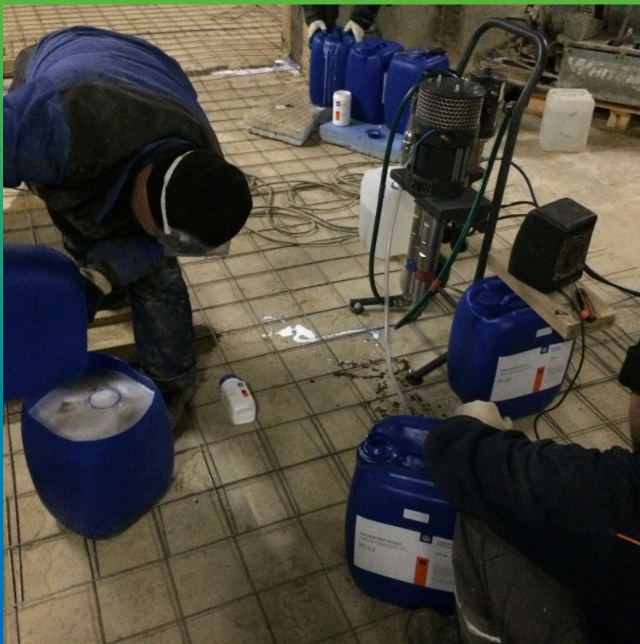
Смешивание компонентов "быстрого" акрилатного геля Манокрил Гель В и пластификатора Манокрил Флекс