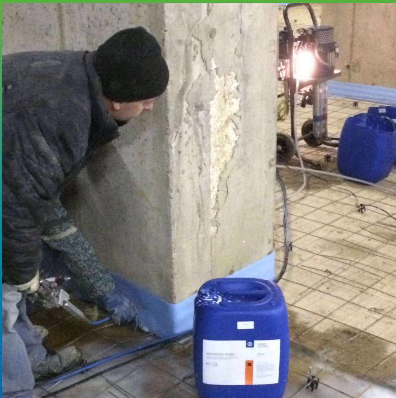
Инъектирование геля в конструкцию с помощью пневматической поршневого насоса БМ 1425