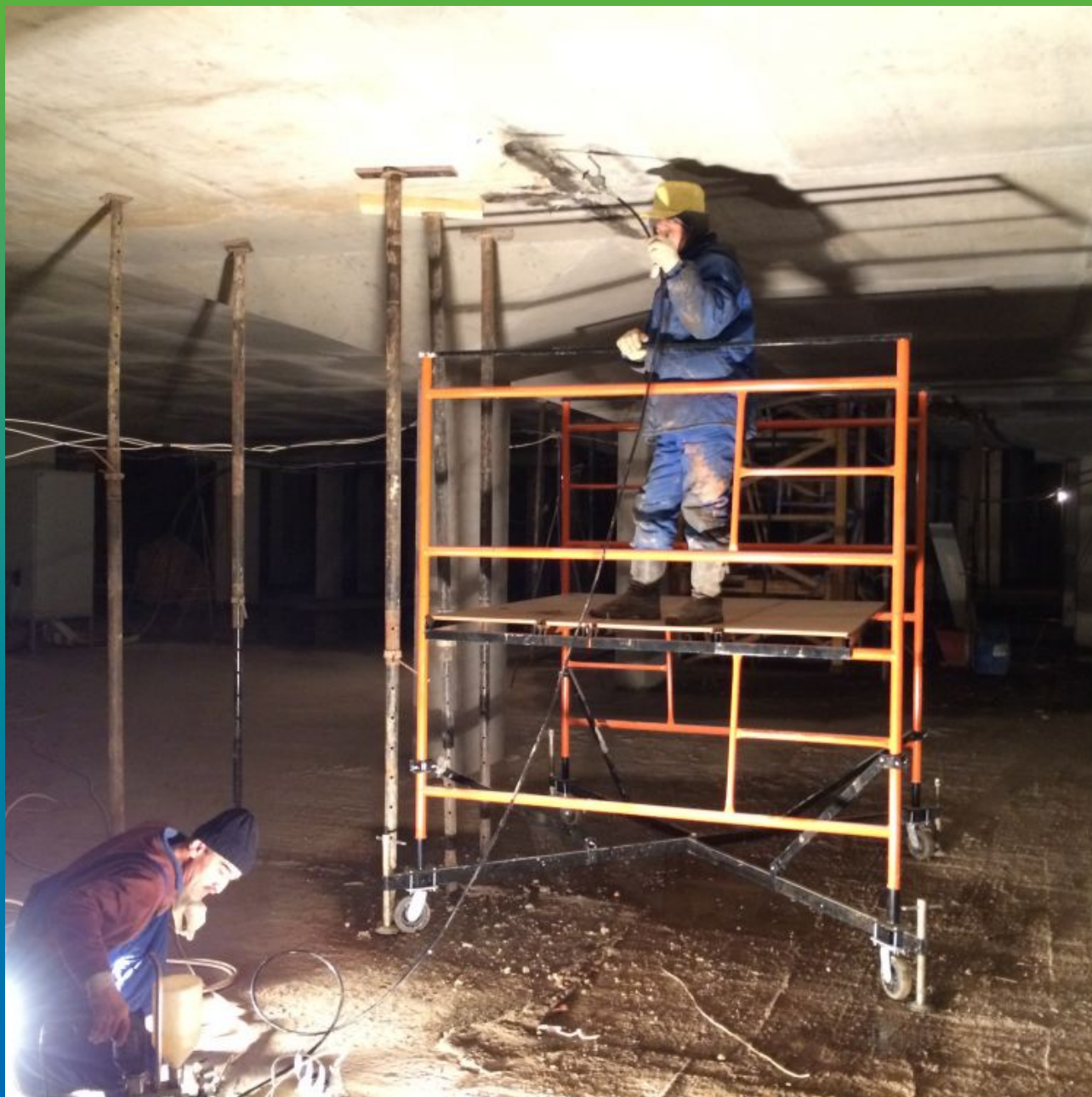
Проведение инъекционных работ с помощью электрического инъекционного насоса БМ 0401