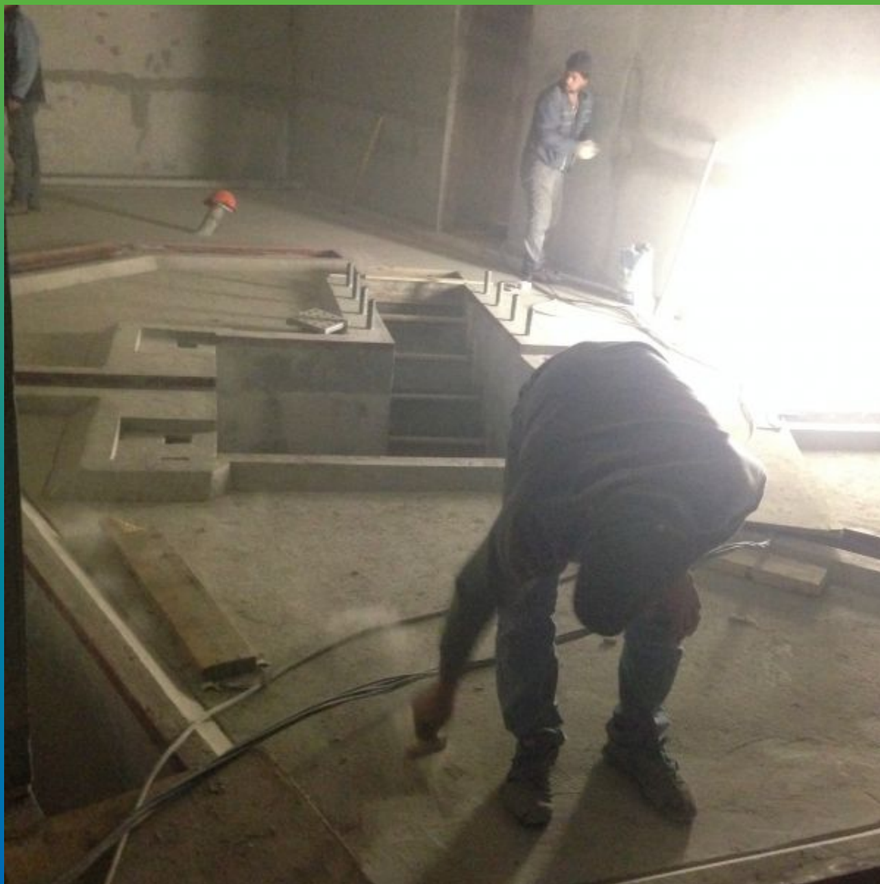
Подготовка основания методом шлифования.