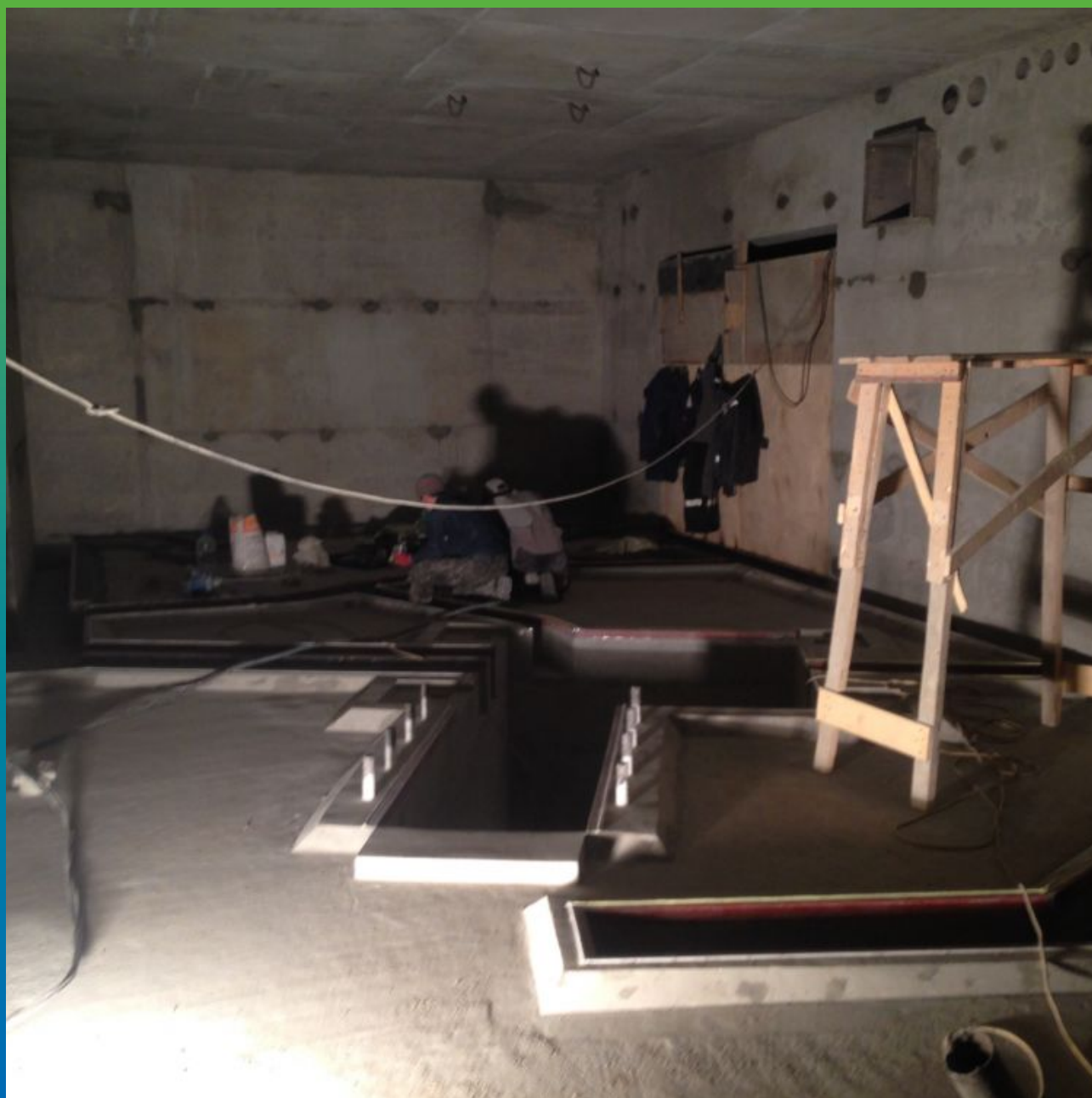
Общий Вид. Помещение циклотронной установки.