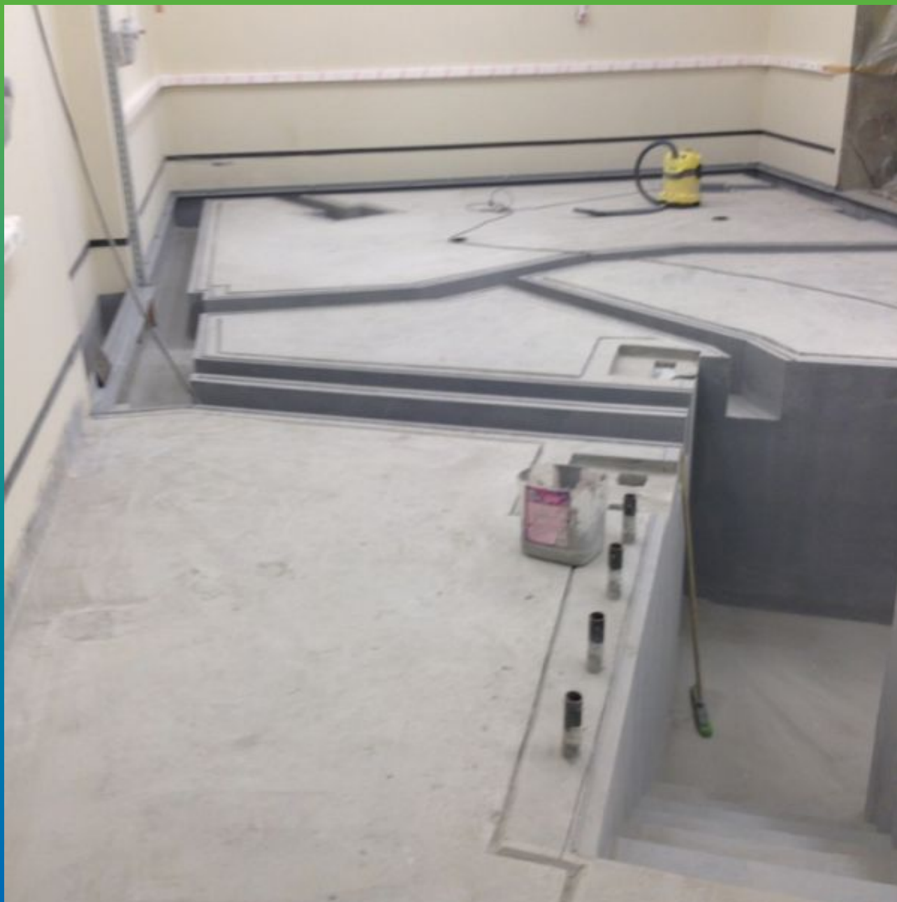
Общий Вид объекта после монтажа стяжки на эластичную гидроизоляцию.