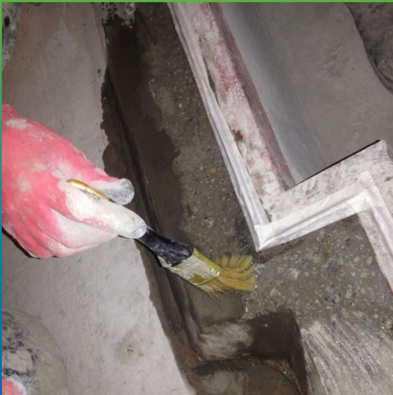
Обеспыливание и смачивание основания.