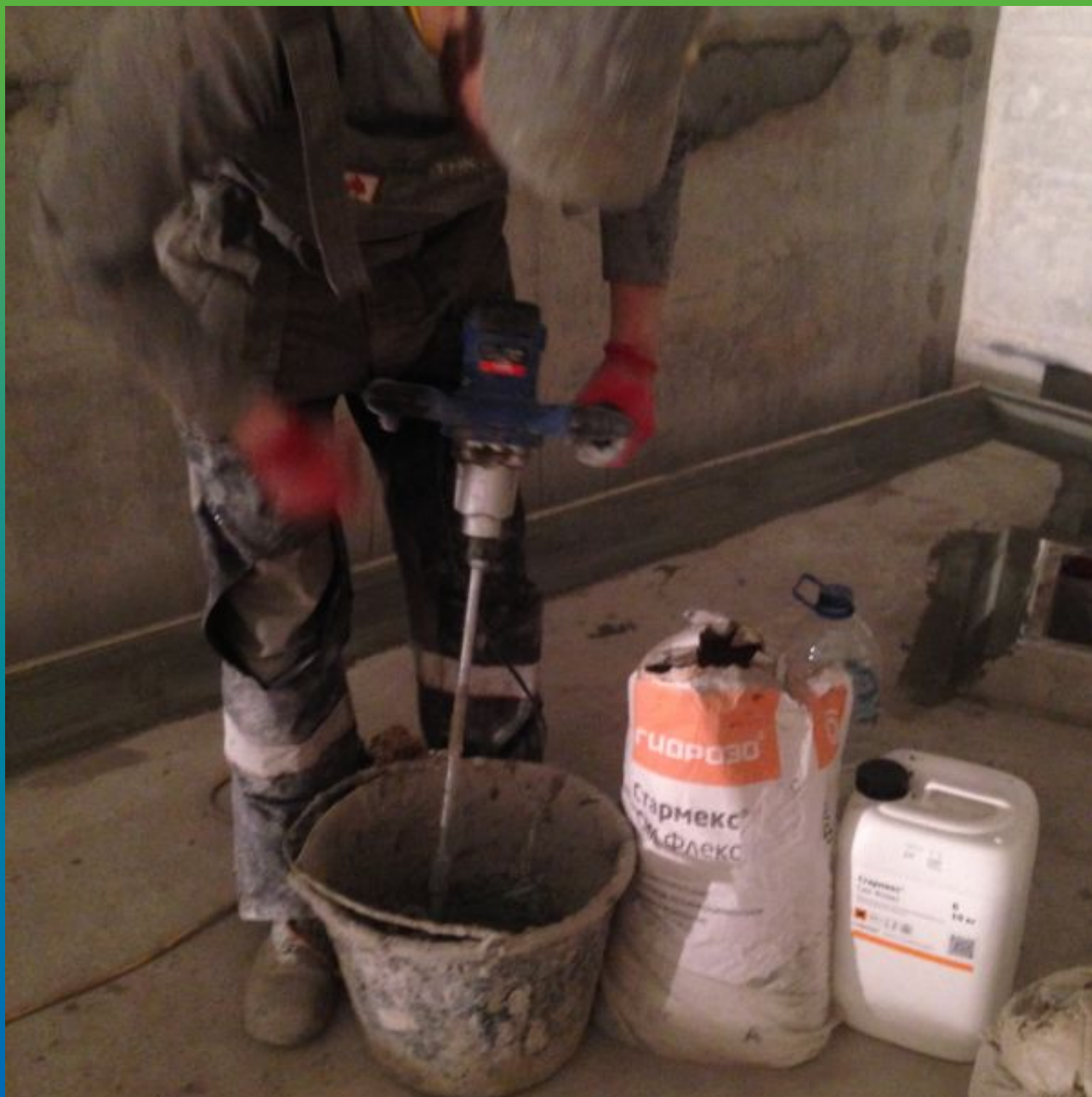
Замешивание компонентов эластичной гидроизоляции.