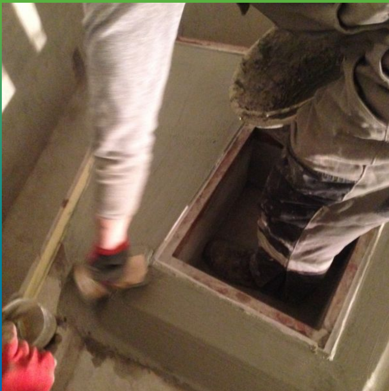
Детализация нанесения эластичной гидроизоляции.