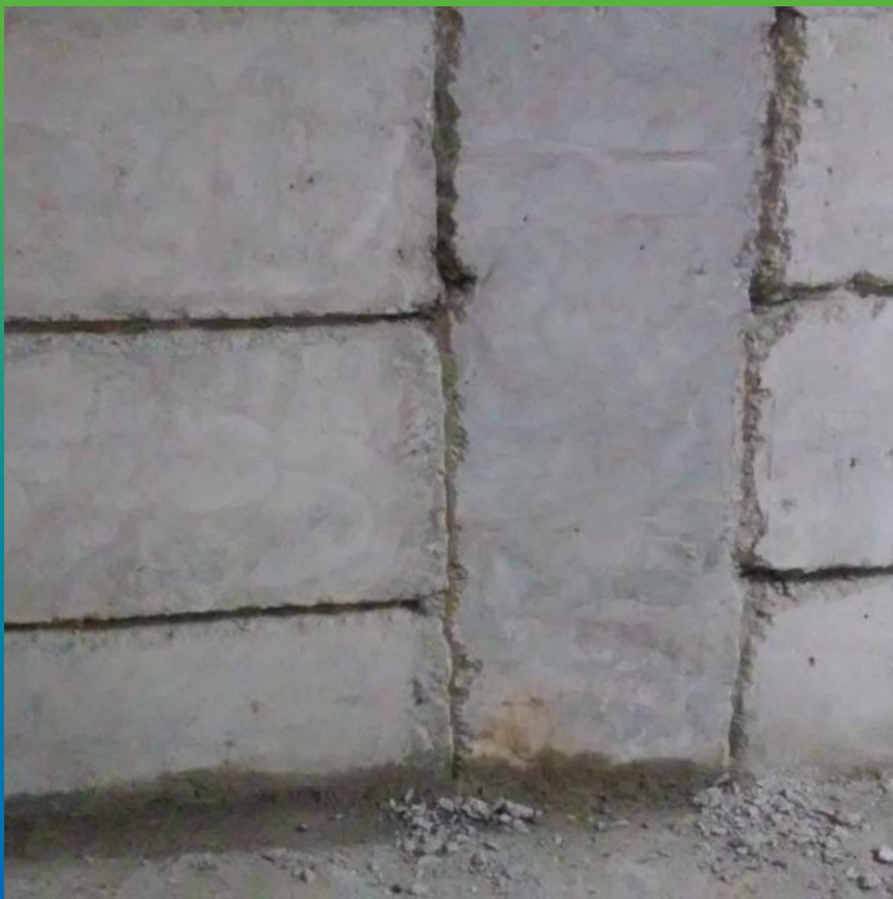
Штробление швов перед чеканкой ремонтным составом