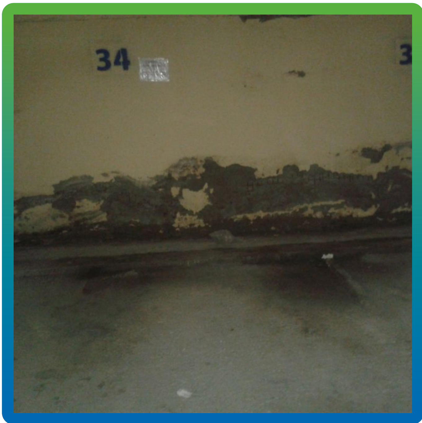
Замокание стены на парковочных местах