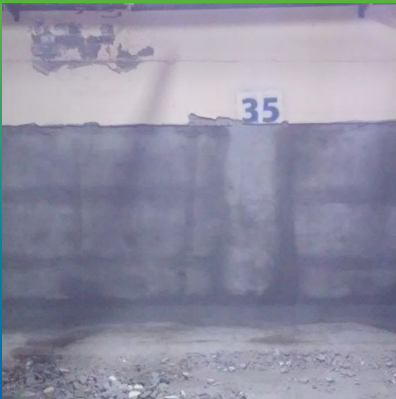
Вид отремонтированных стен подземной парковки