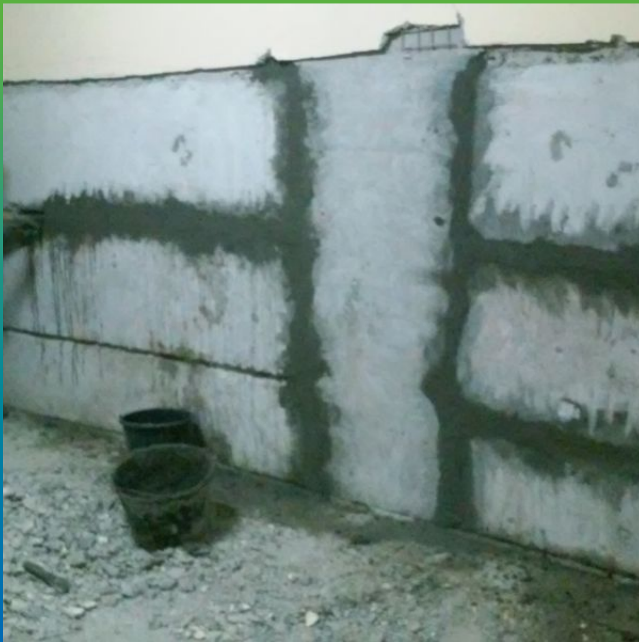
Чеканка швов ремонтным составом Стармекс РМЗ