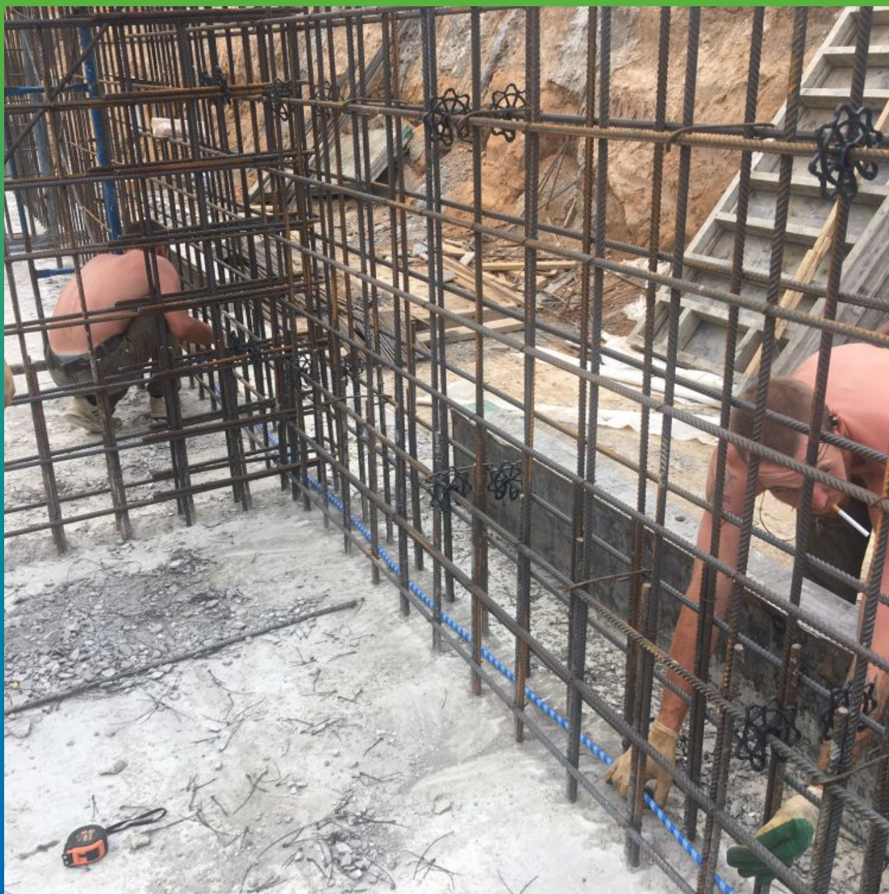
Монтаж системы Инжпайп в месте холодного шва