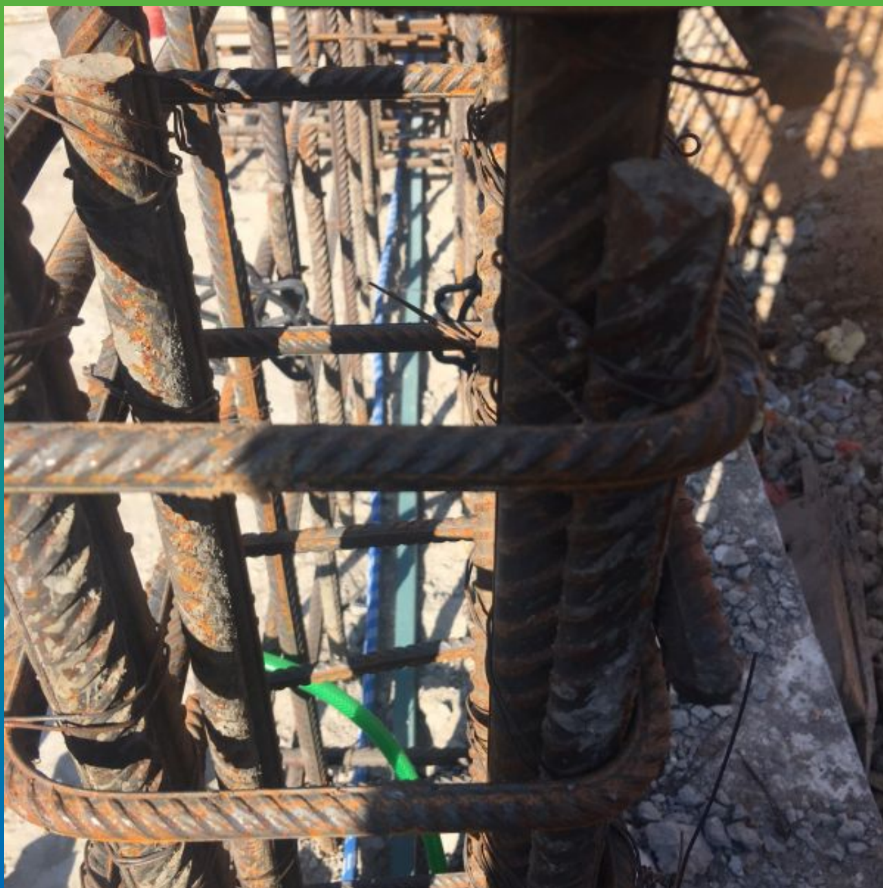
Уложенная система Инжпайп и профиль Манодил Свелл ХК 2507 в месте холодного шва