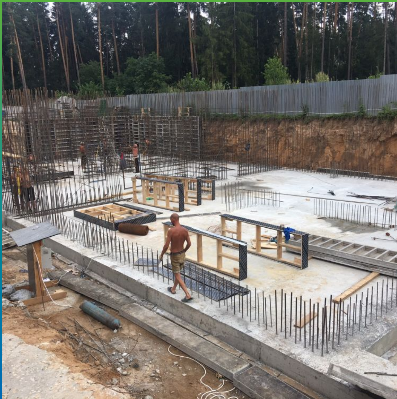
Вид строительной площадки во время устройства стен подземной части