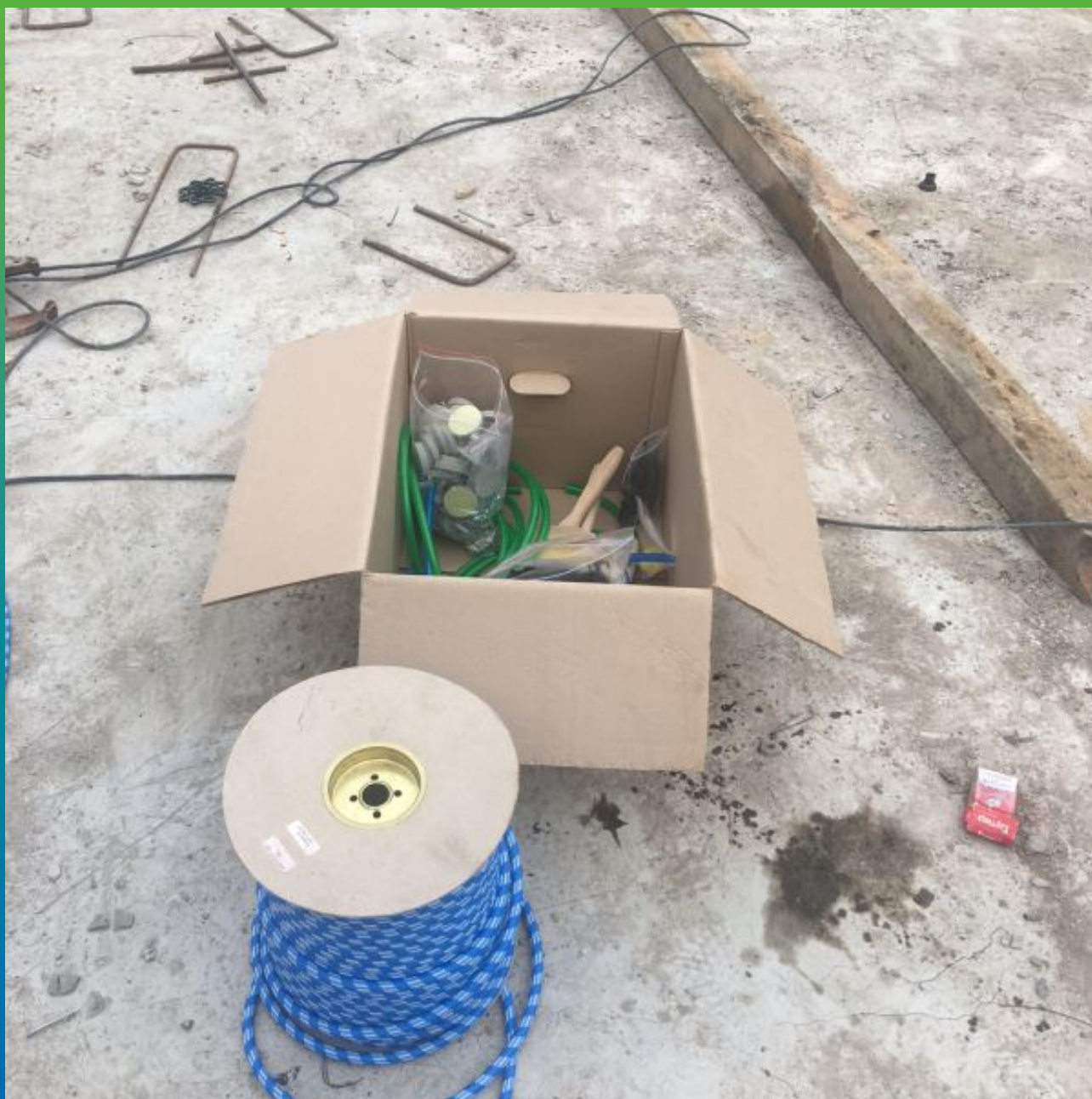
Комплект системы Инжпайп