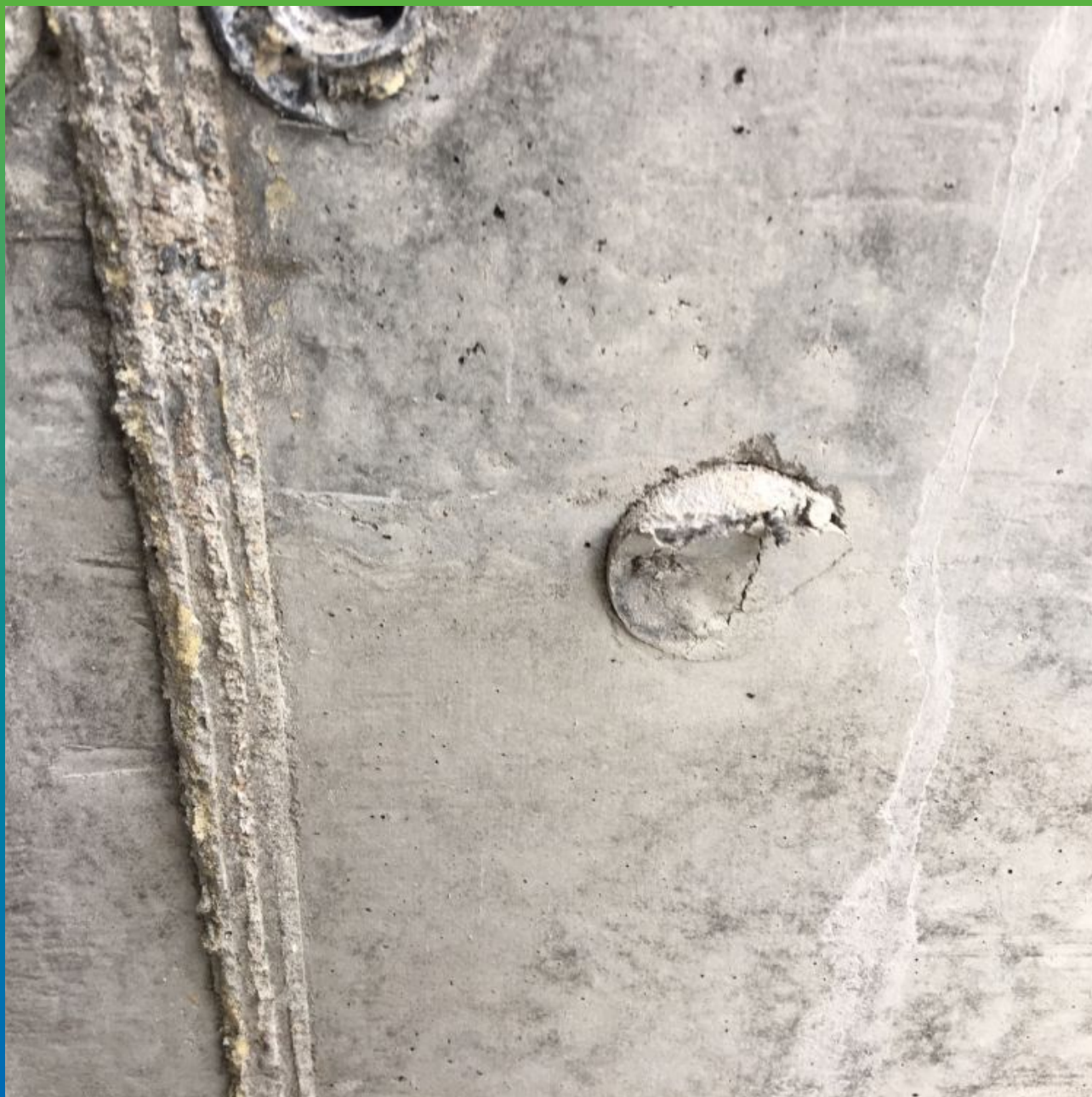
Выход Инжпайп после отливки стены