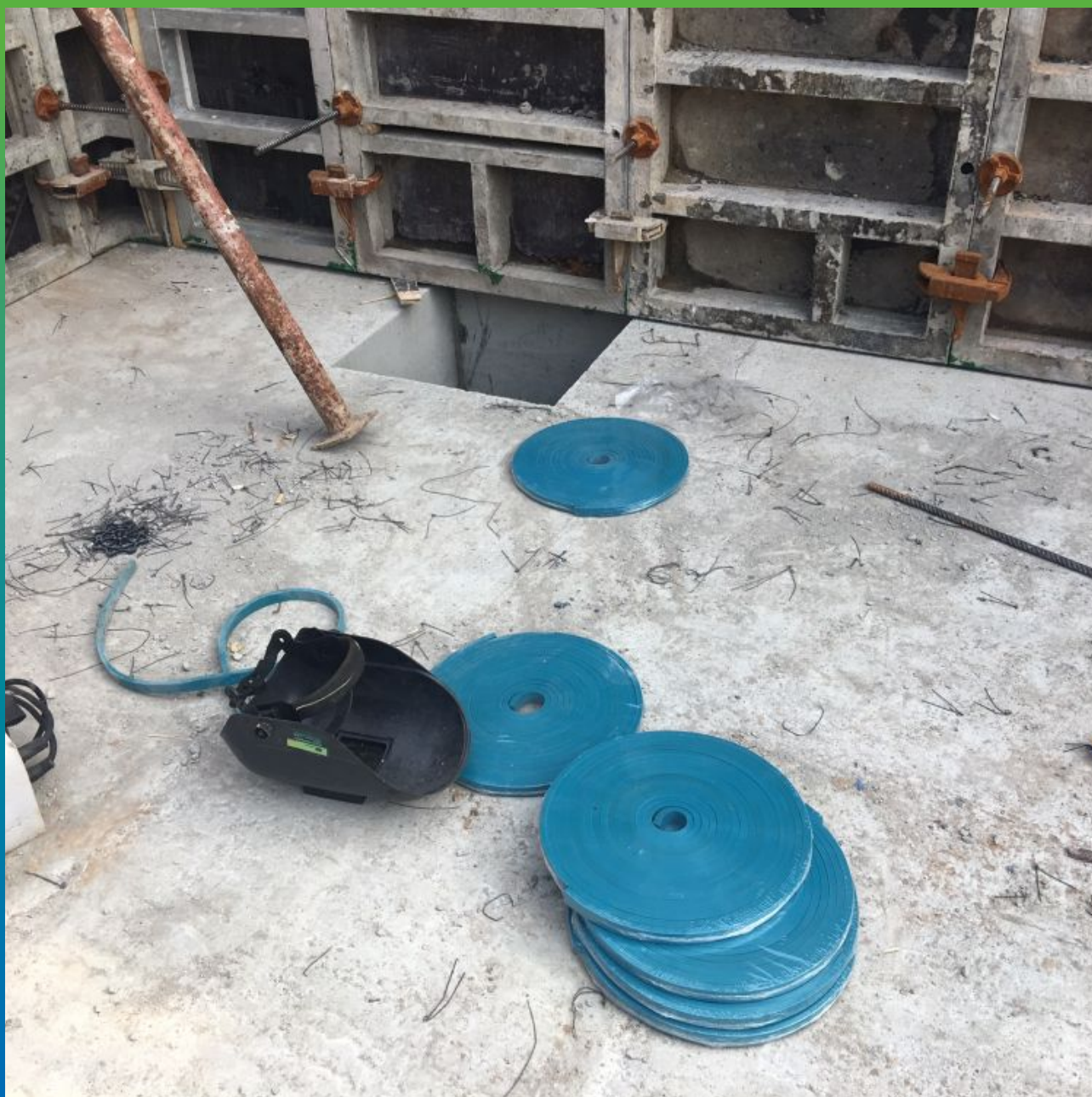
Профиль Манодил Свелл ХК 2507 на объекте