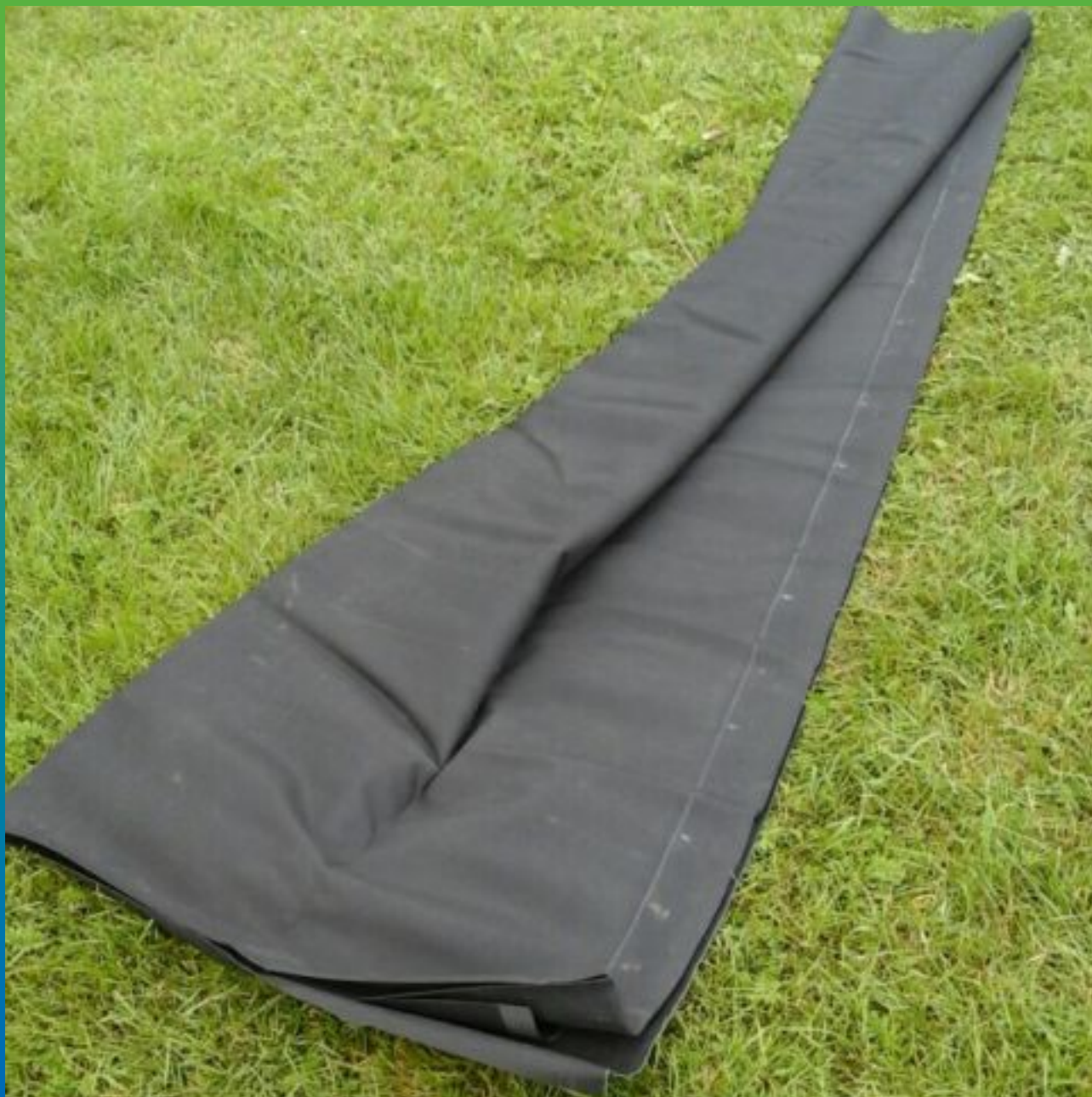
Раскладка ЭПДМ мембраны