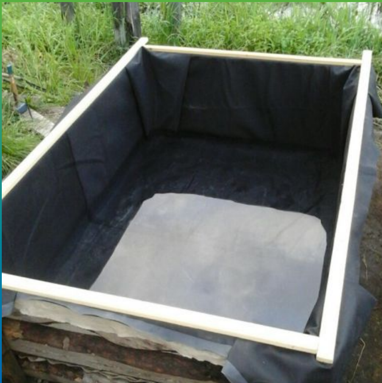
Вид закрепленной ЭПДМ мембраны