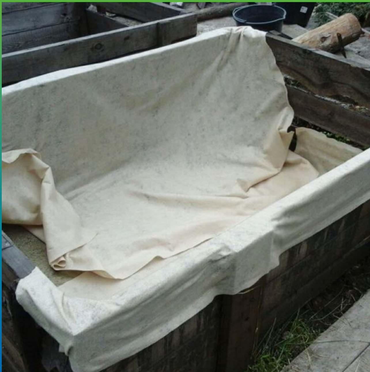
Укладка подстилающего слоя - геотекстиля