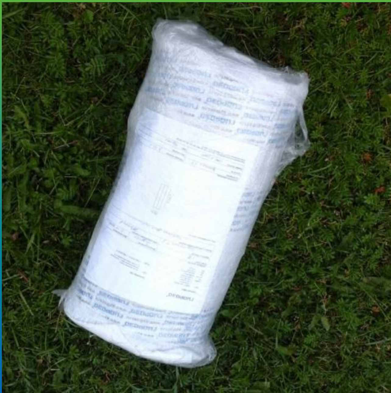
Вид материала на объекте