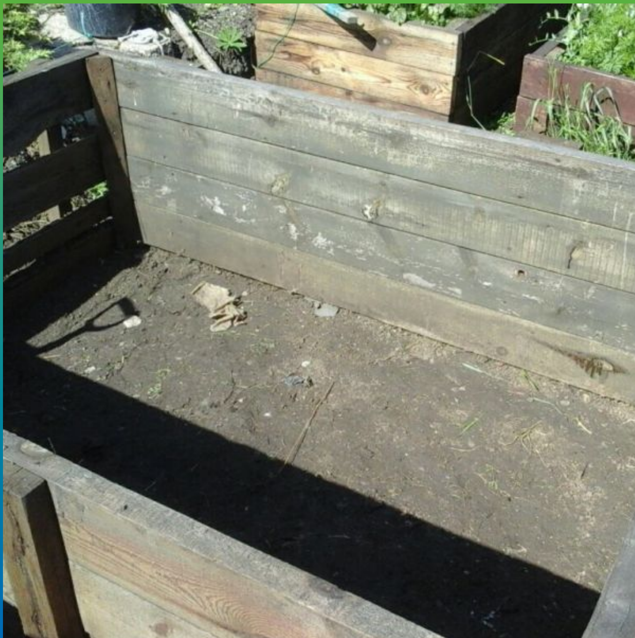
Первоначальный вид объекта - устройство искусственного водоема