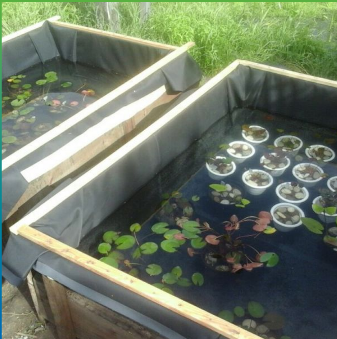
Финальный вид объекта