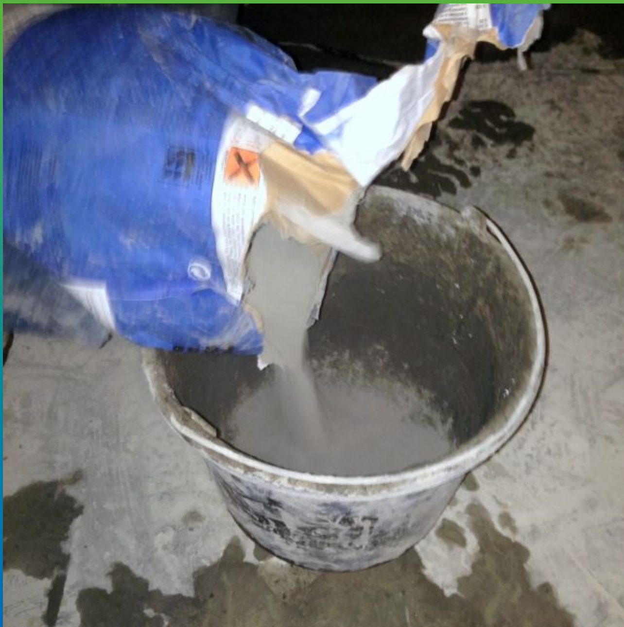
Смешивание гидравлического ремонтника Максбетон с водой.