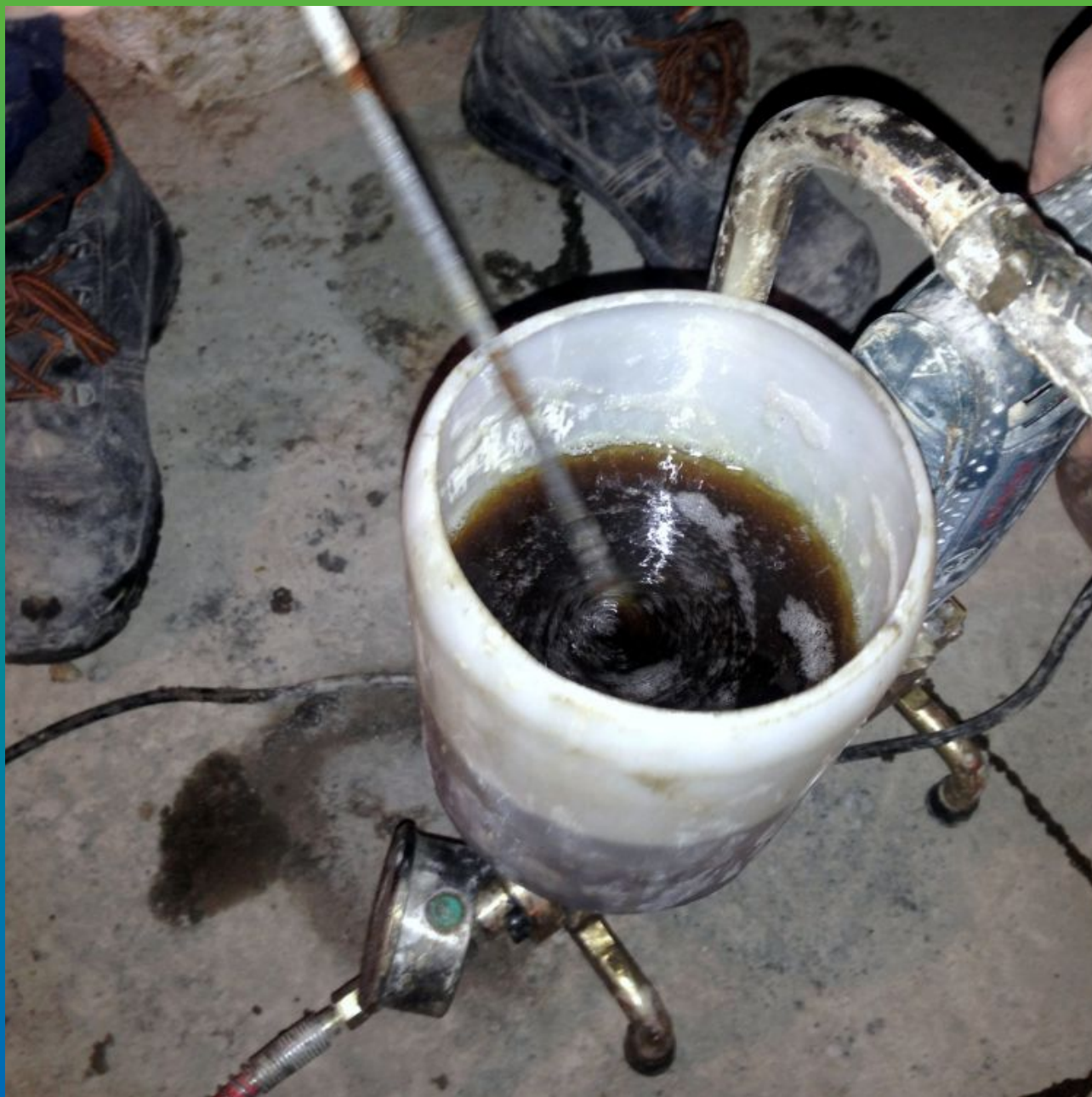
2-я стадия - инъектирование Манопур 143