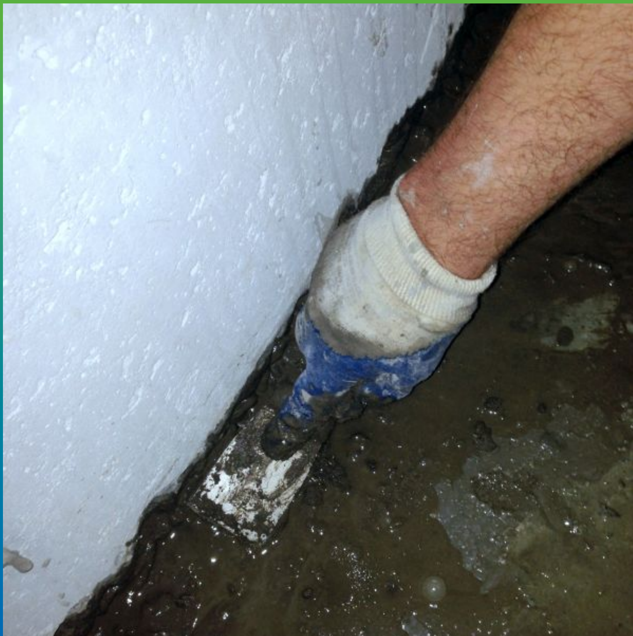
Чеканка штробы гидравлической смесью.