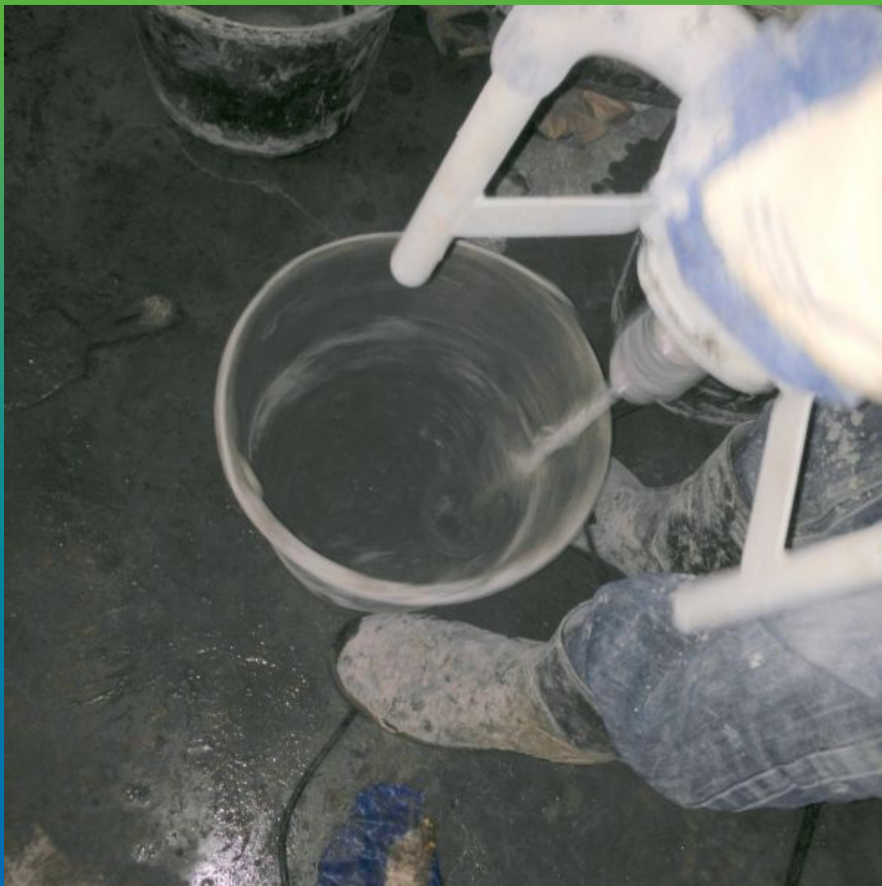
Замешивание гидравлической смеси/