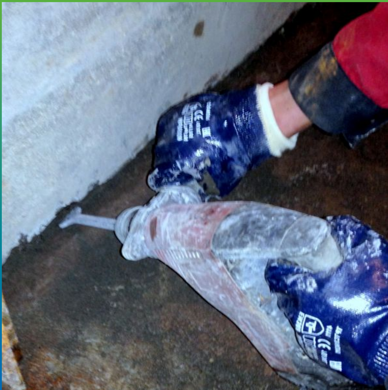
Процесс подготовки сопряжения. Создание штрыбы.