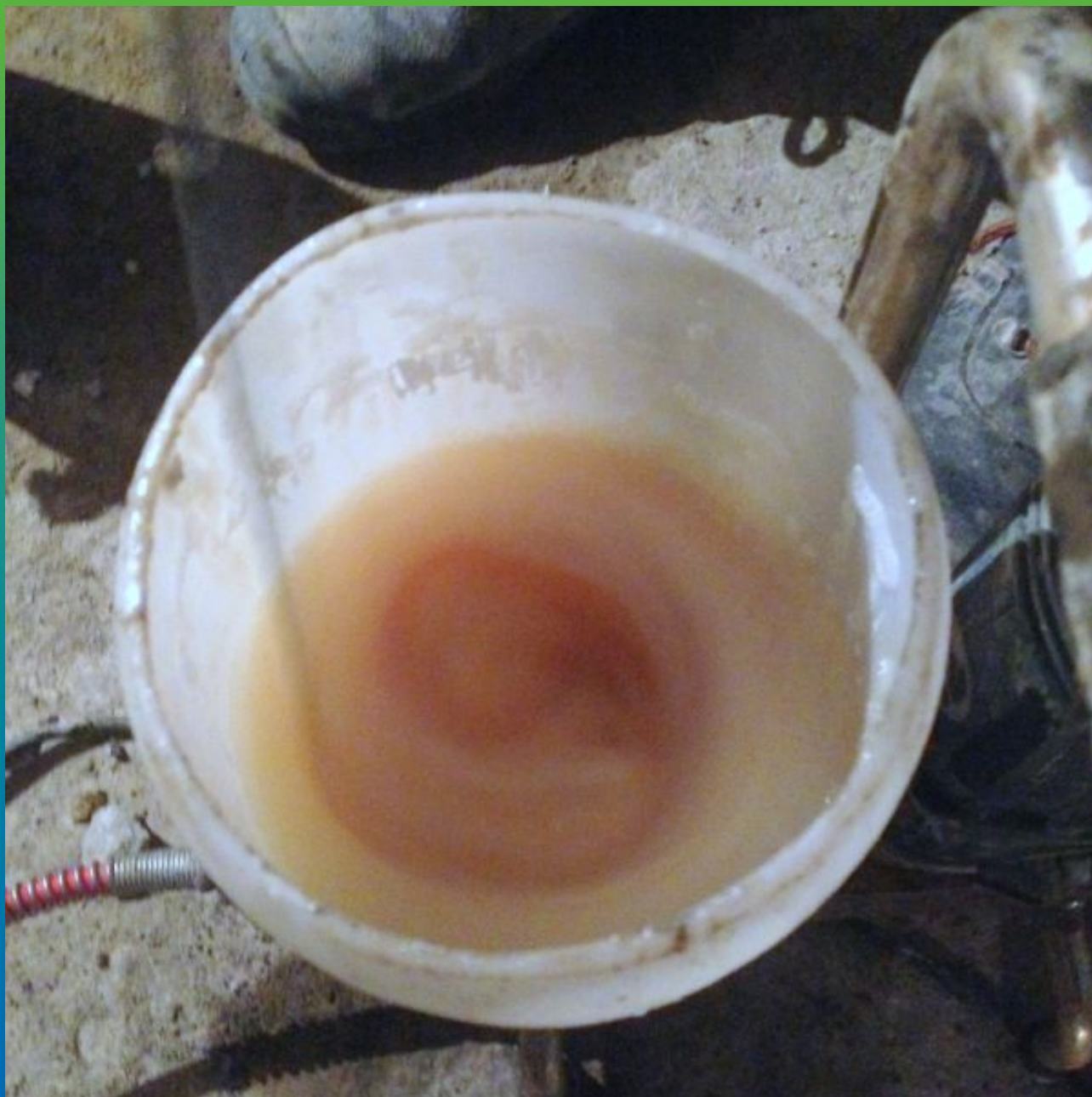
1-я стадия - инъектирование Манопур 15