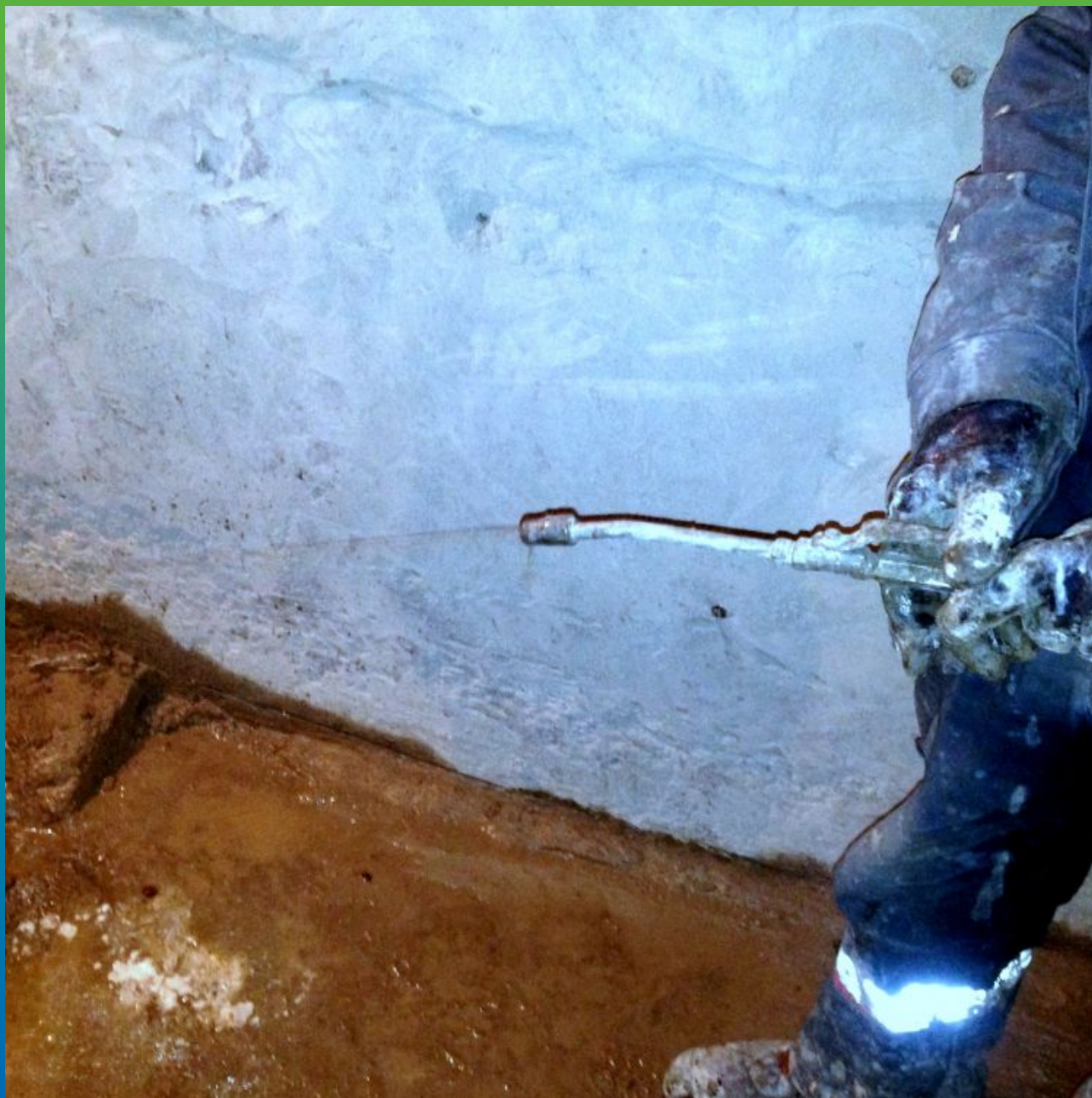
Проверка инъекционного насоса