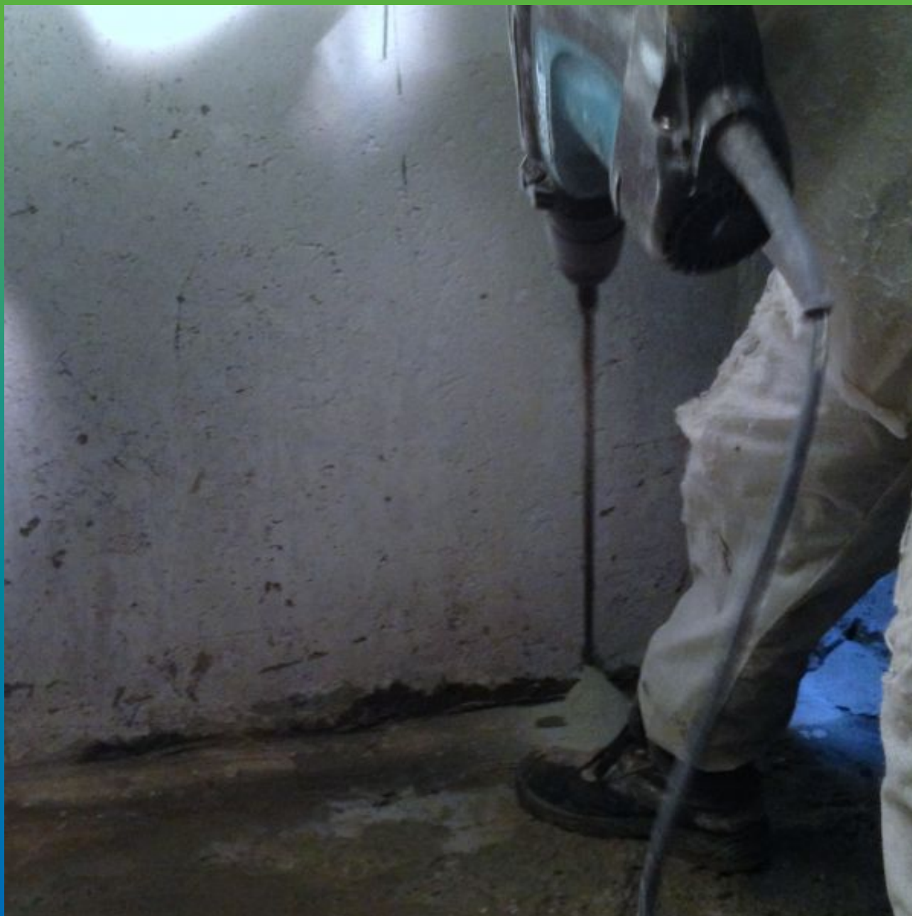
Бурение шпуров для установки пакеров.