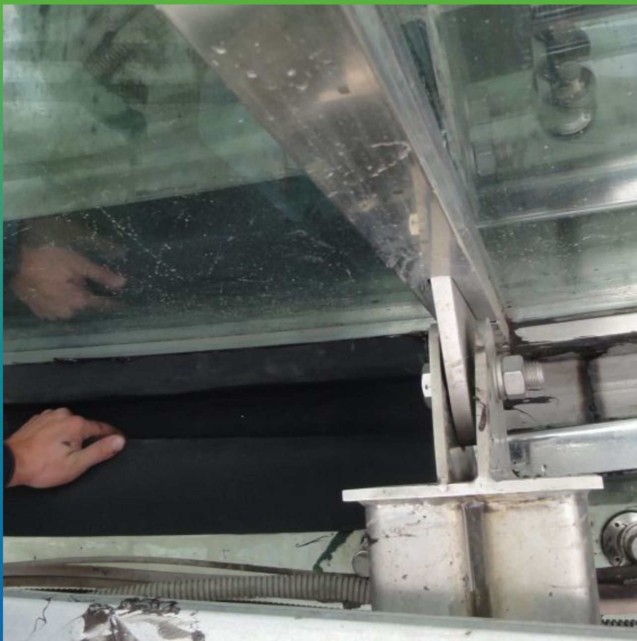
Укладка ЭПДМ мембраны