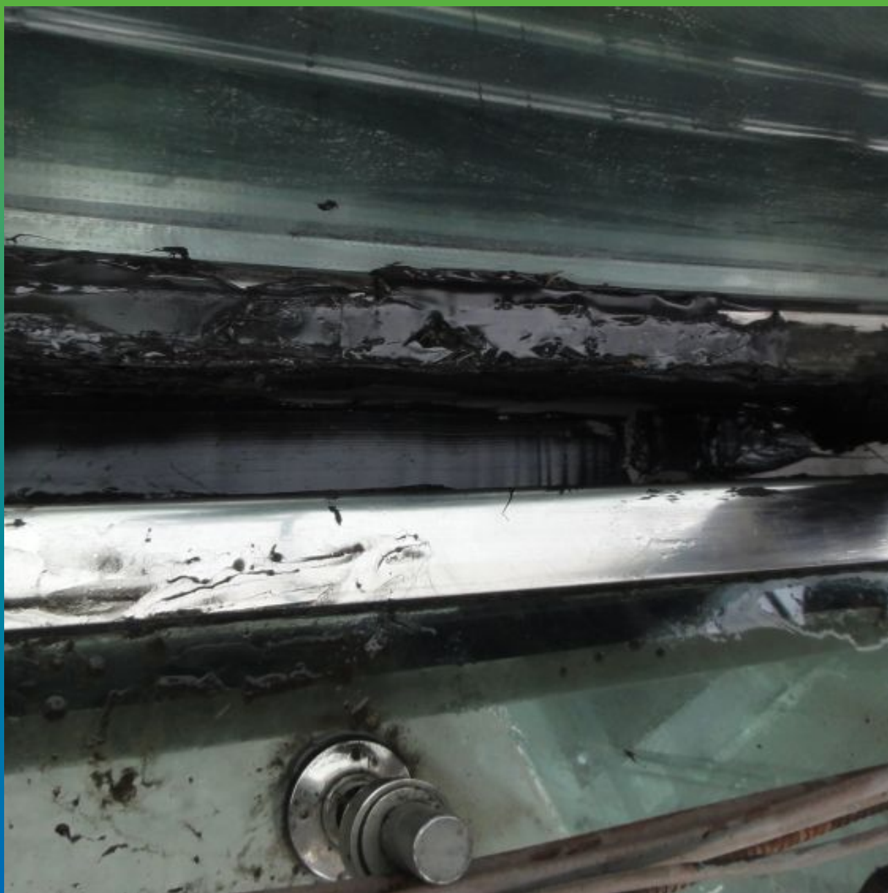
Нанесение Витрафин Бонд Ф