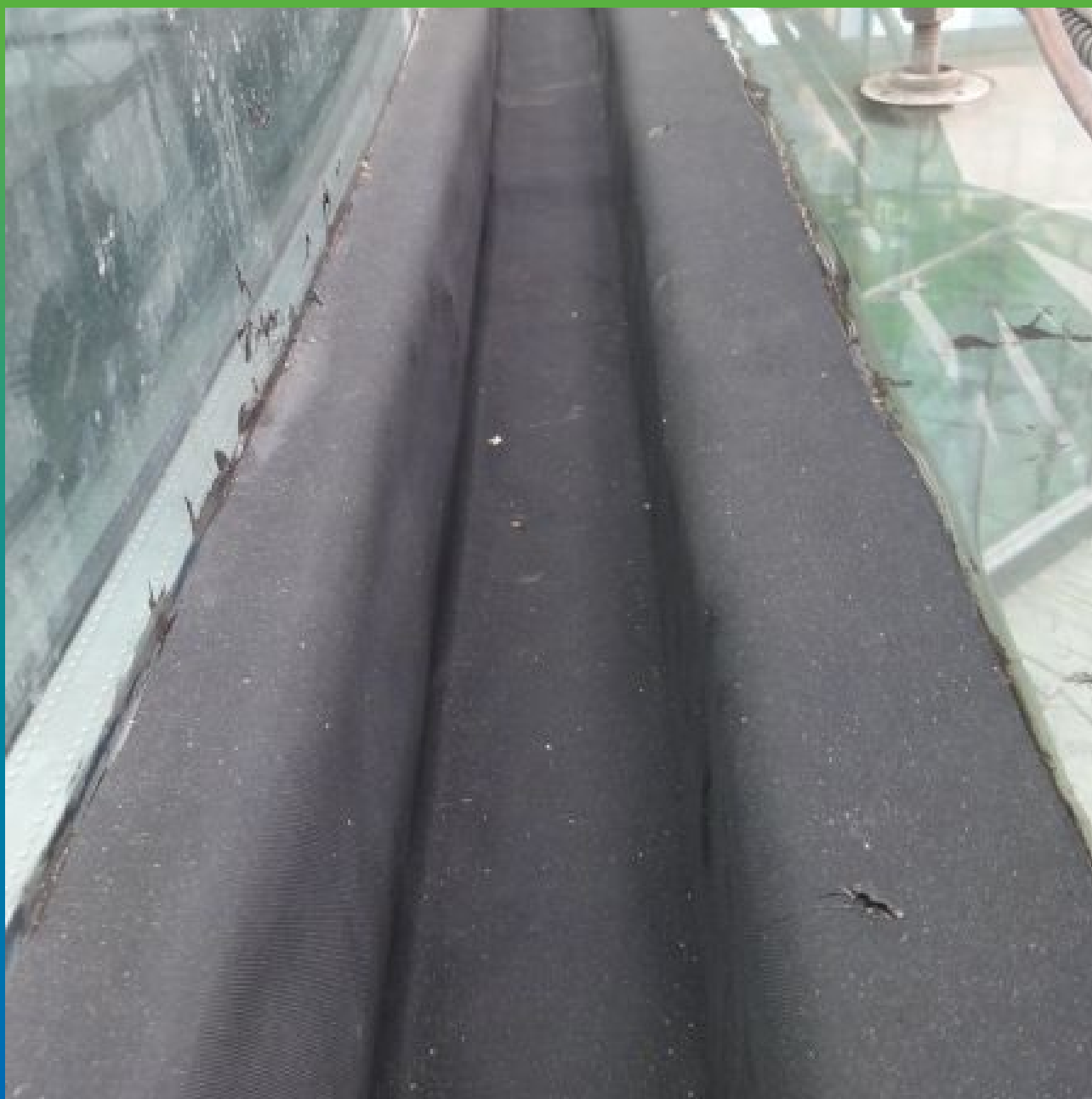
Финальный вид шва