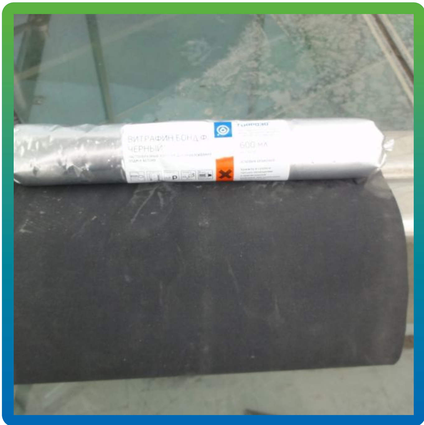
Вид материалов на объекте