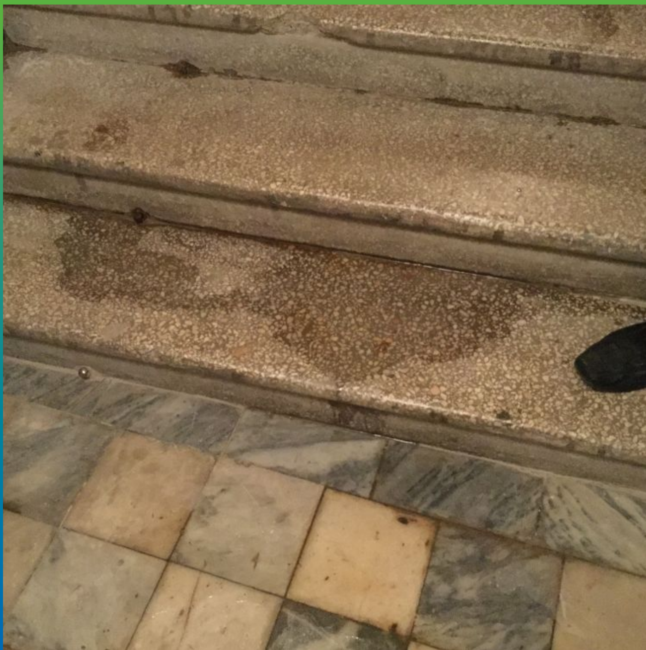
Намокание лестничного марша