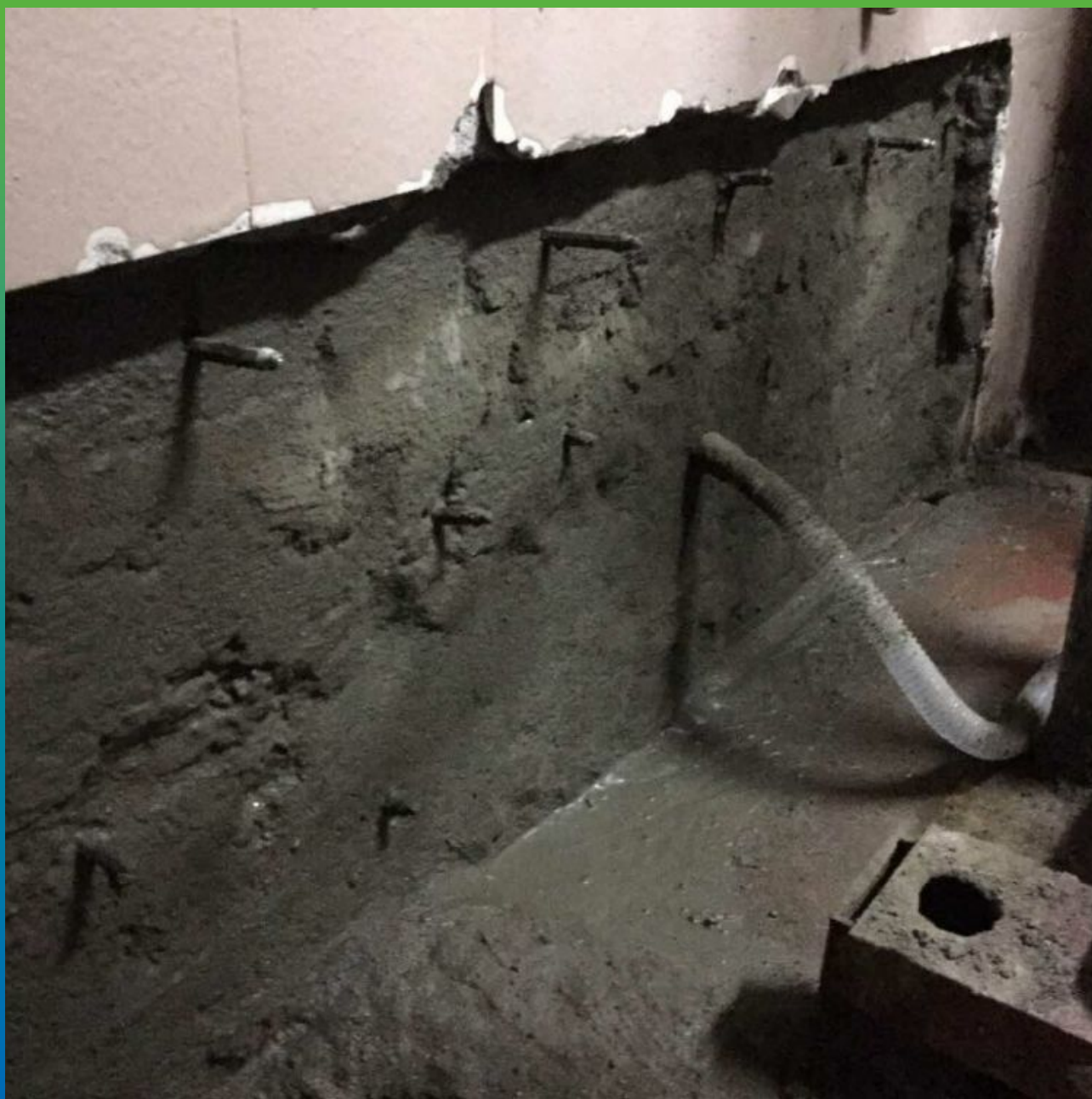
Установка пакеров в местах намокания