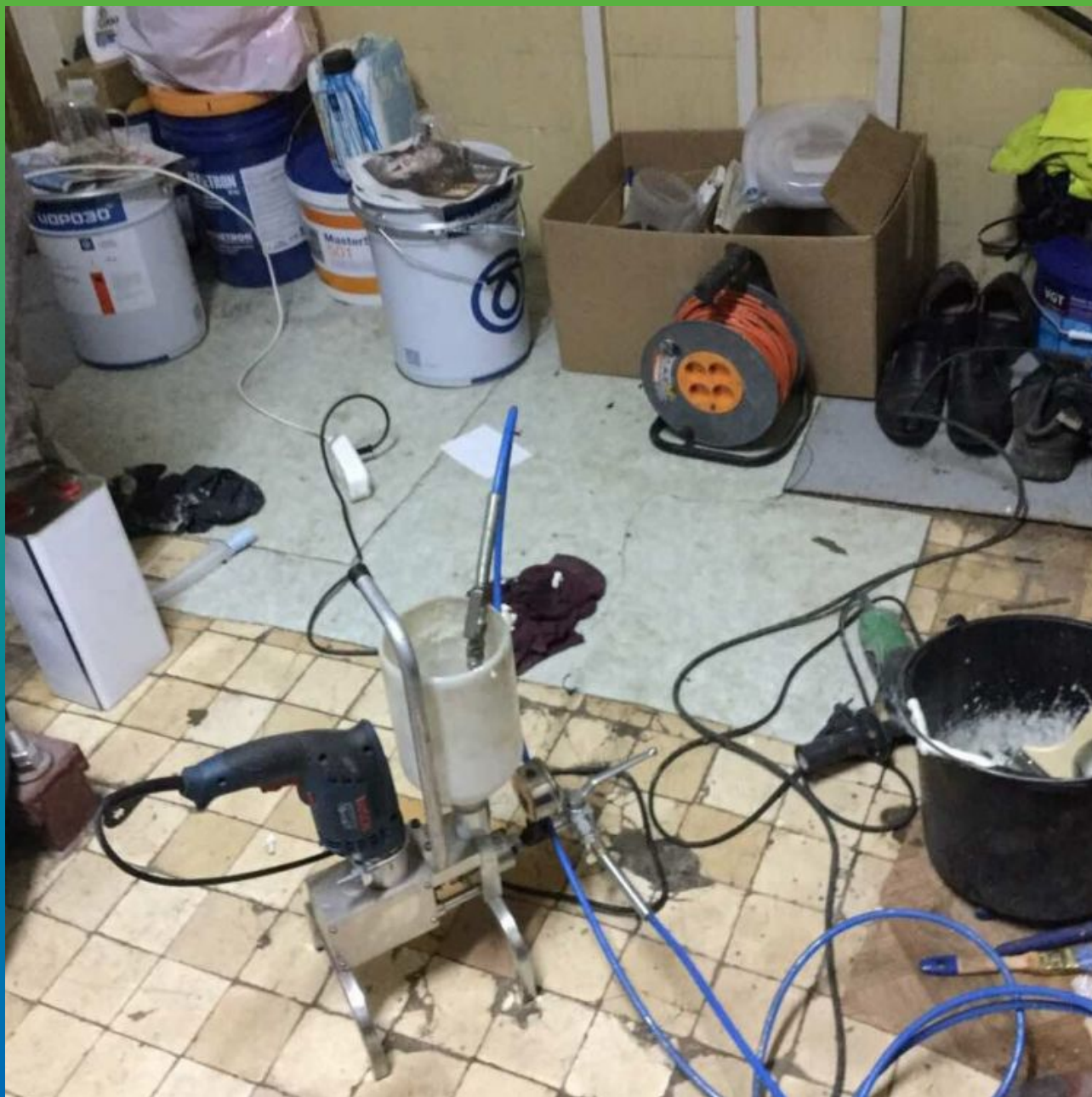
Насос для прокачки БМ 0401