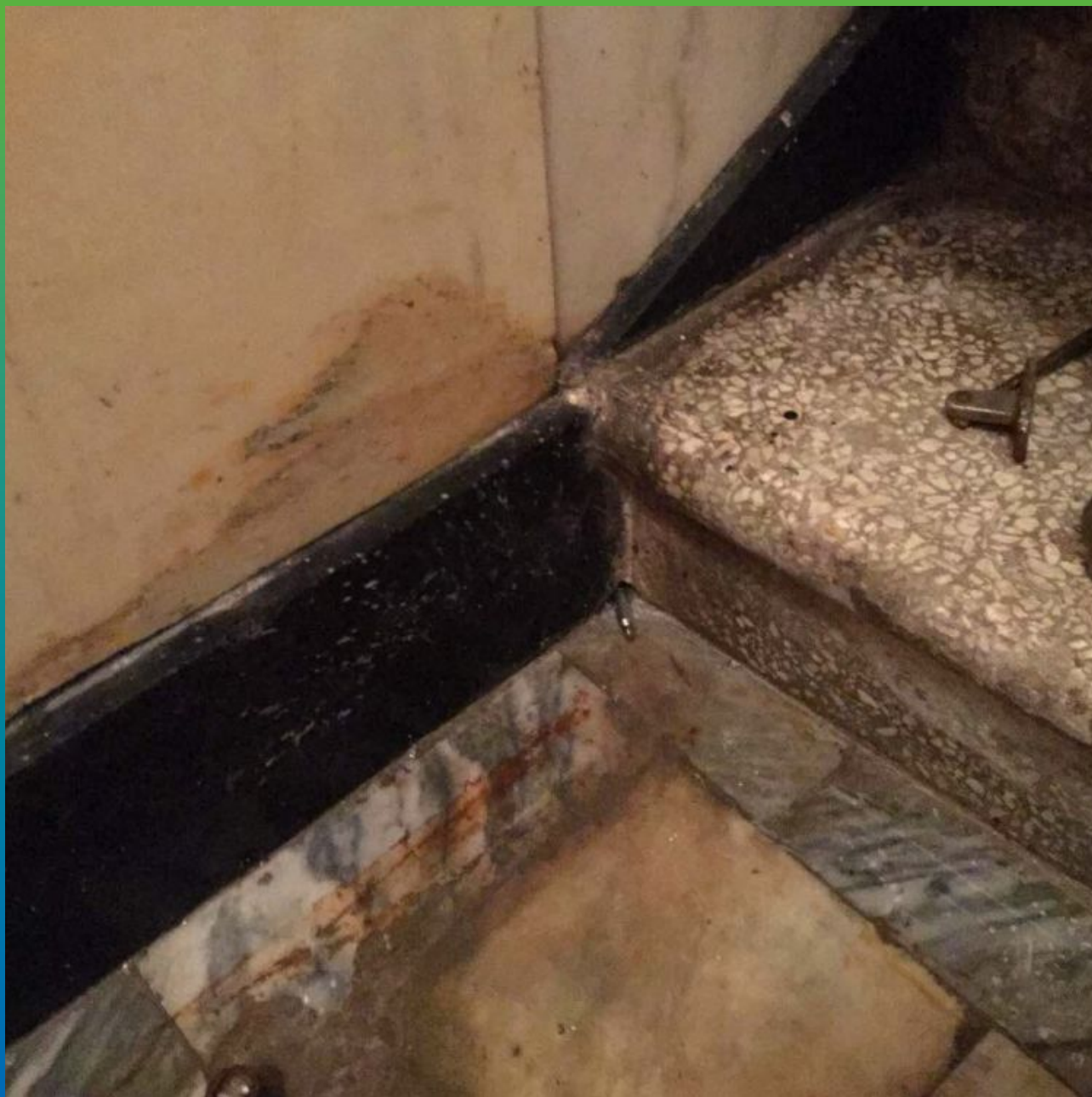
Установка пакеров в местах намокания