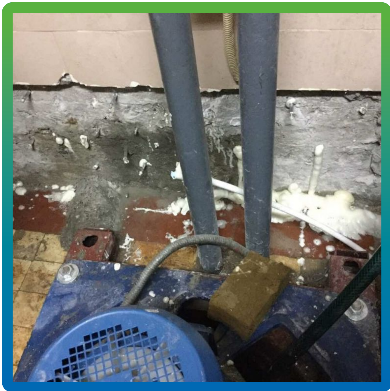
Заполнение пустот материалом Манопур 15