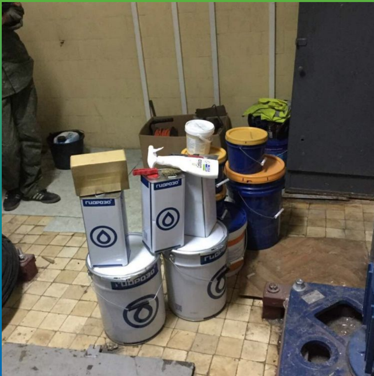
Инъекционные материалы Гидрозо - Манопур 15, Манопур 143 и очиститель Манопур Клинер