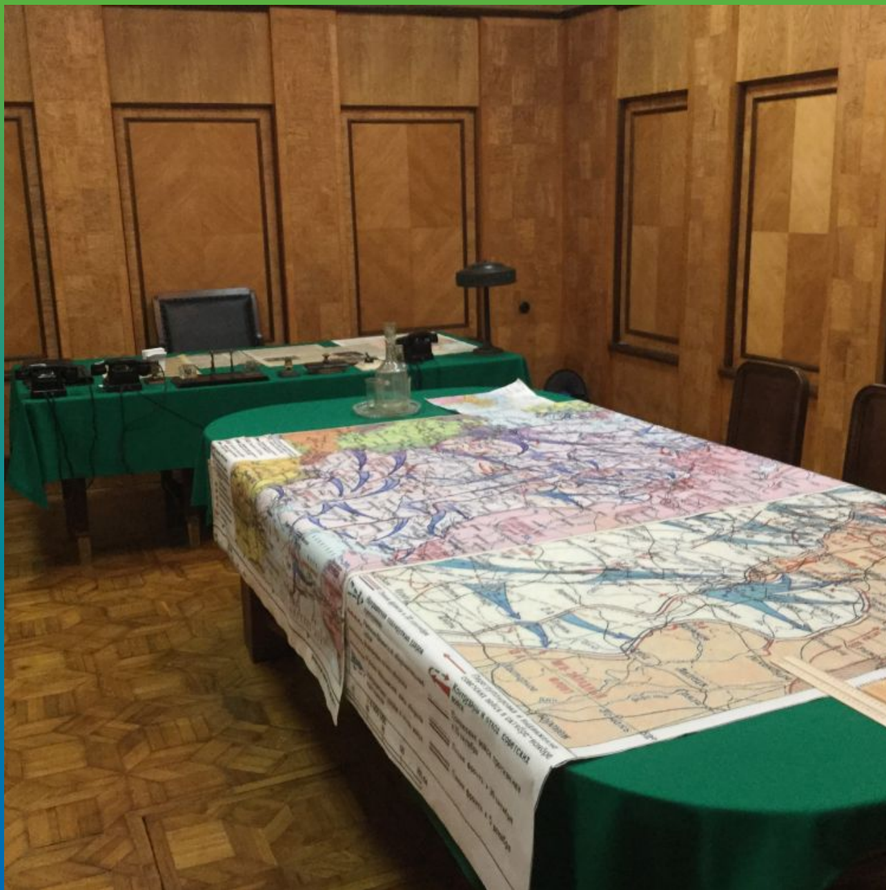
Вид кабинета И.В. Сталина