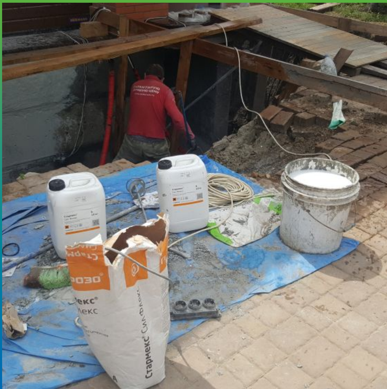
Внешняя гидроизоляция Стармекс Сил Флекс