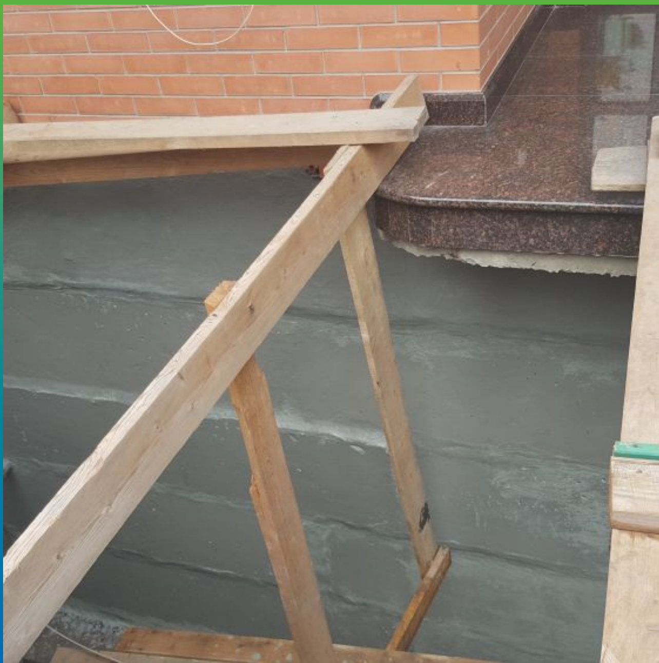
Вид стены цокольного этажа после применения материала Стармекс Сил Флекс