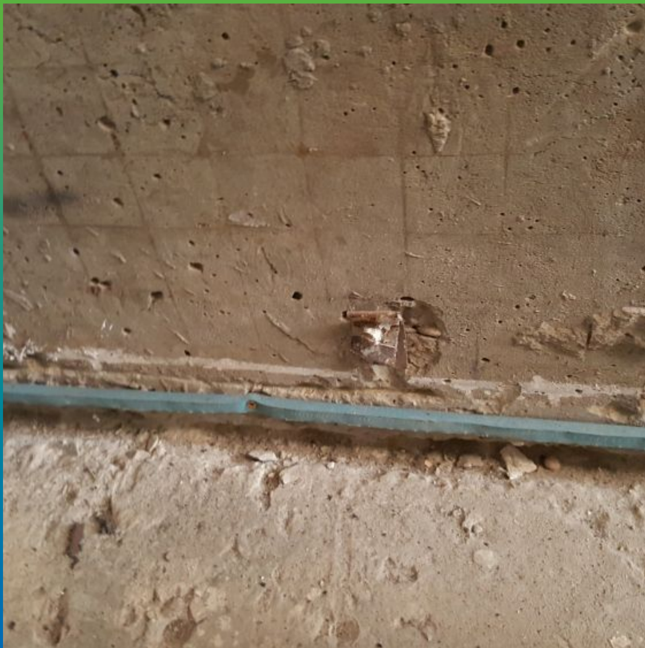
Монтаж гидрофильного профиля Максджоинт В-Сил