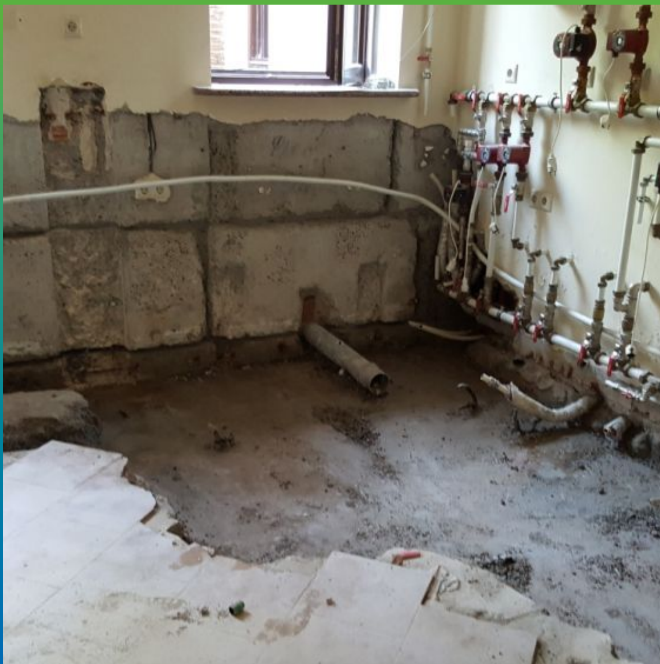
Расшивка швов из ФБС блоков