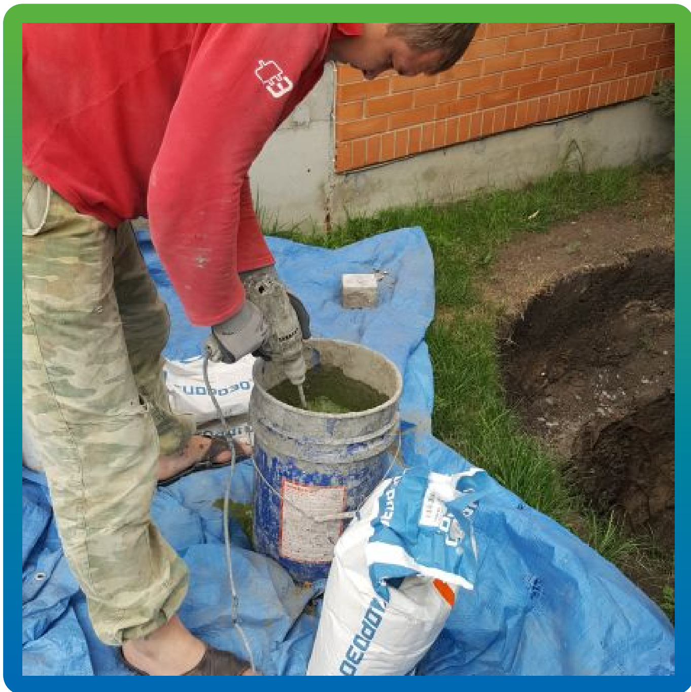
Добавка в бетон Реолен Адмикс