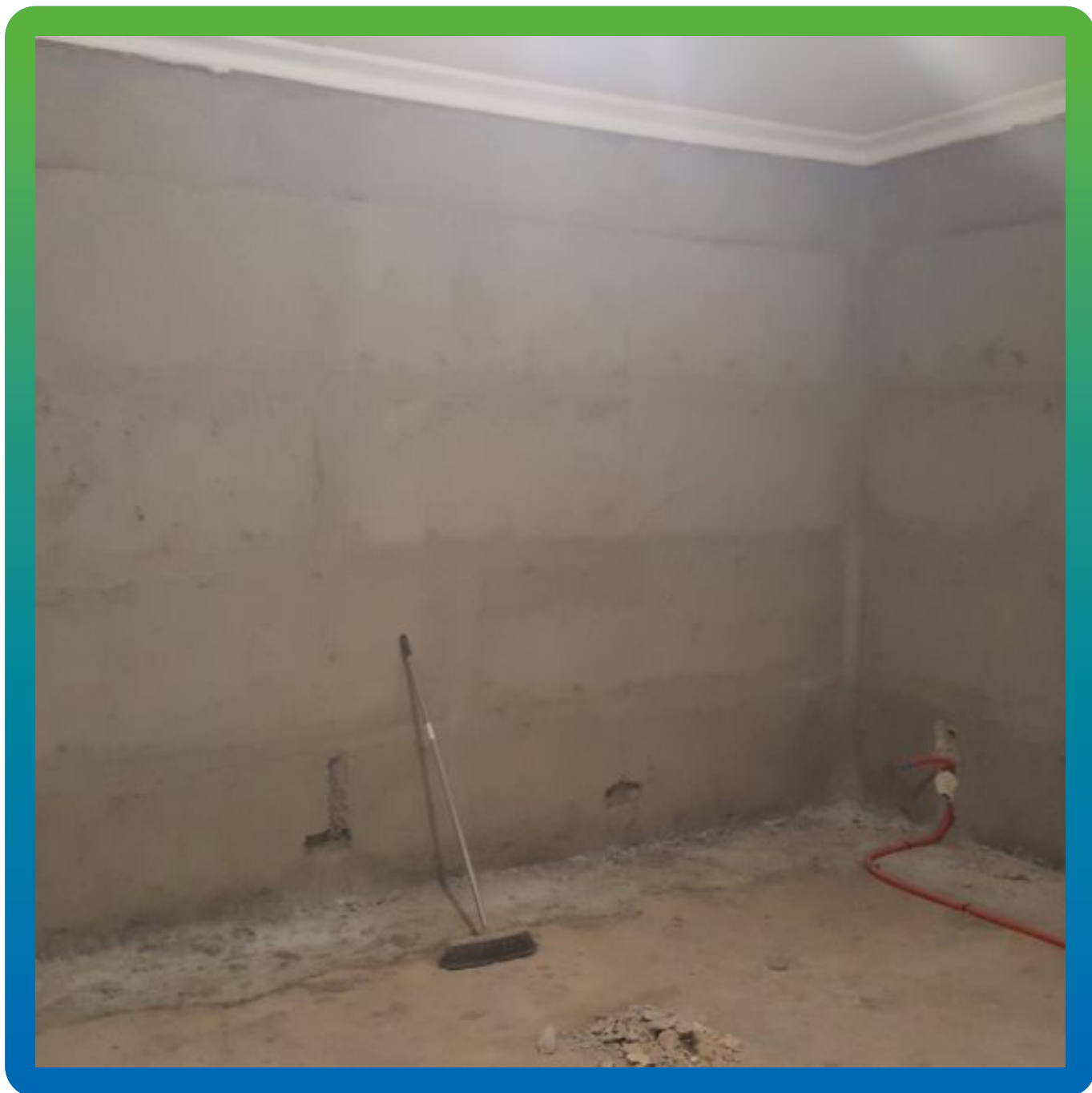
Вид внутренней стены цокольного этажа после применения материала Стармекс Кристалл