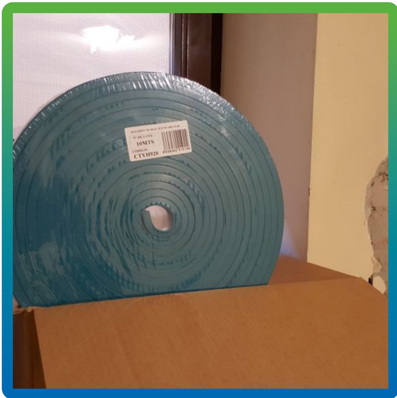
Материалы на объекте: Максджоинт В-Сил