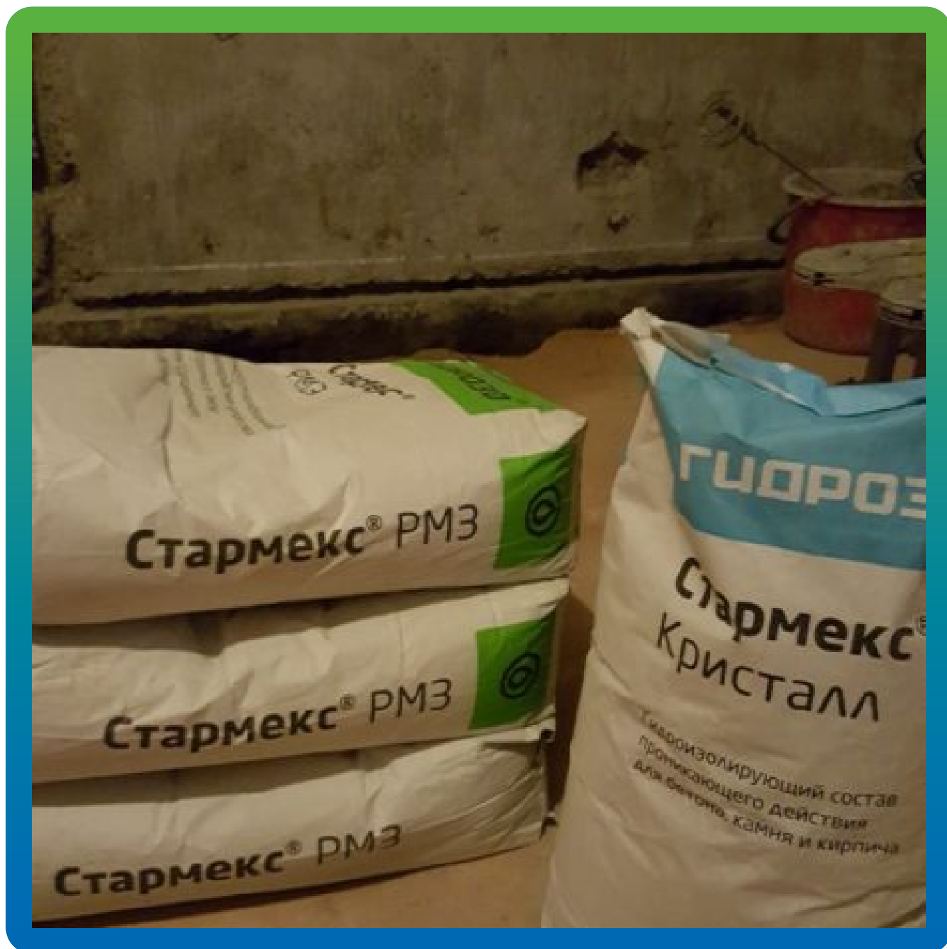
Материалы на объекте: Стармекс РМЗ, Стармекс Кристалл