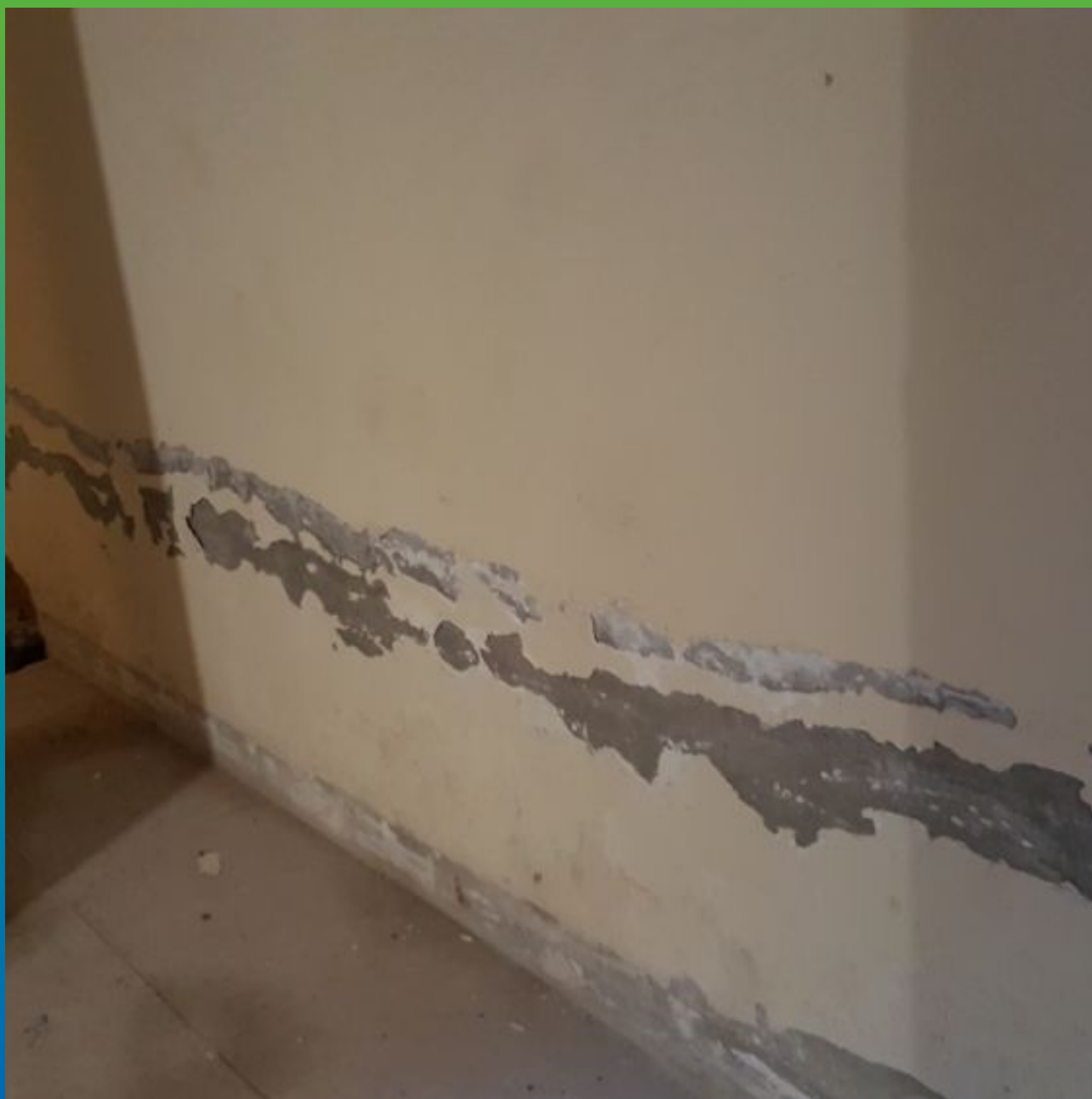
Вид объекта до применения материала