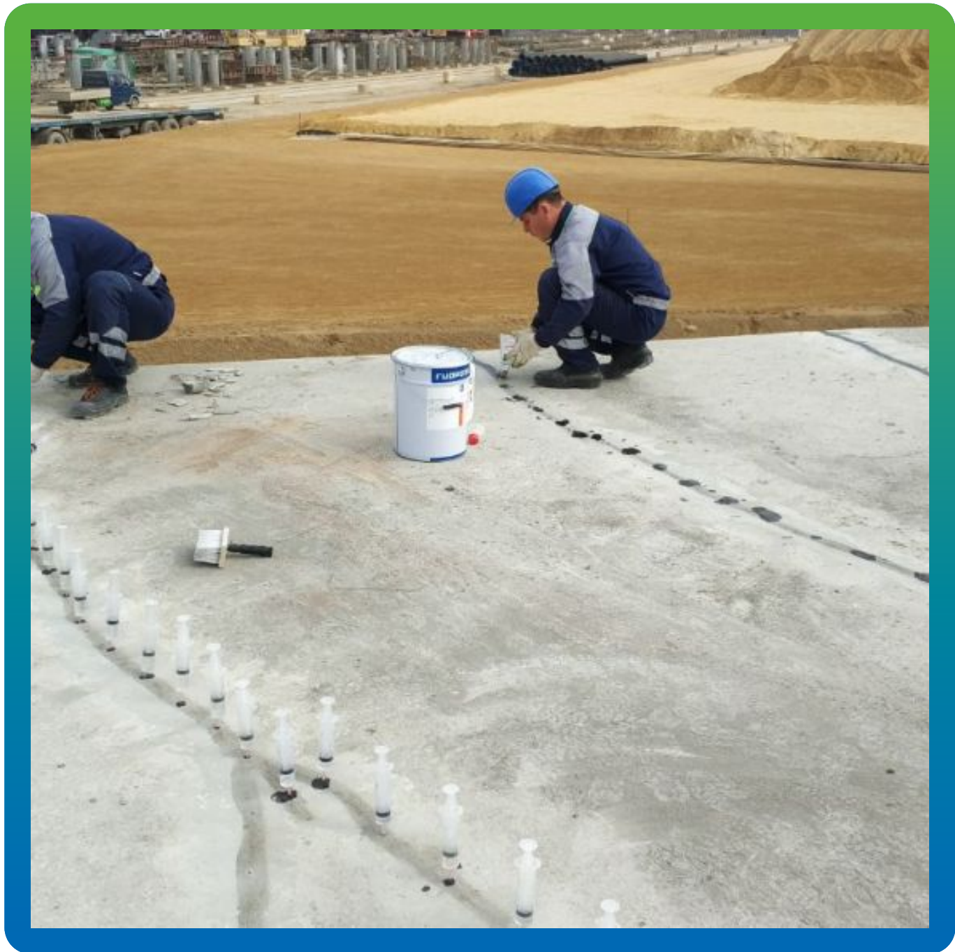
Работы по инъектированию Манопокс 352 ЛВ в трещины.