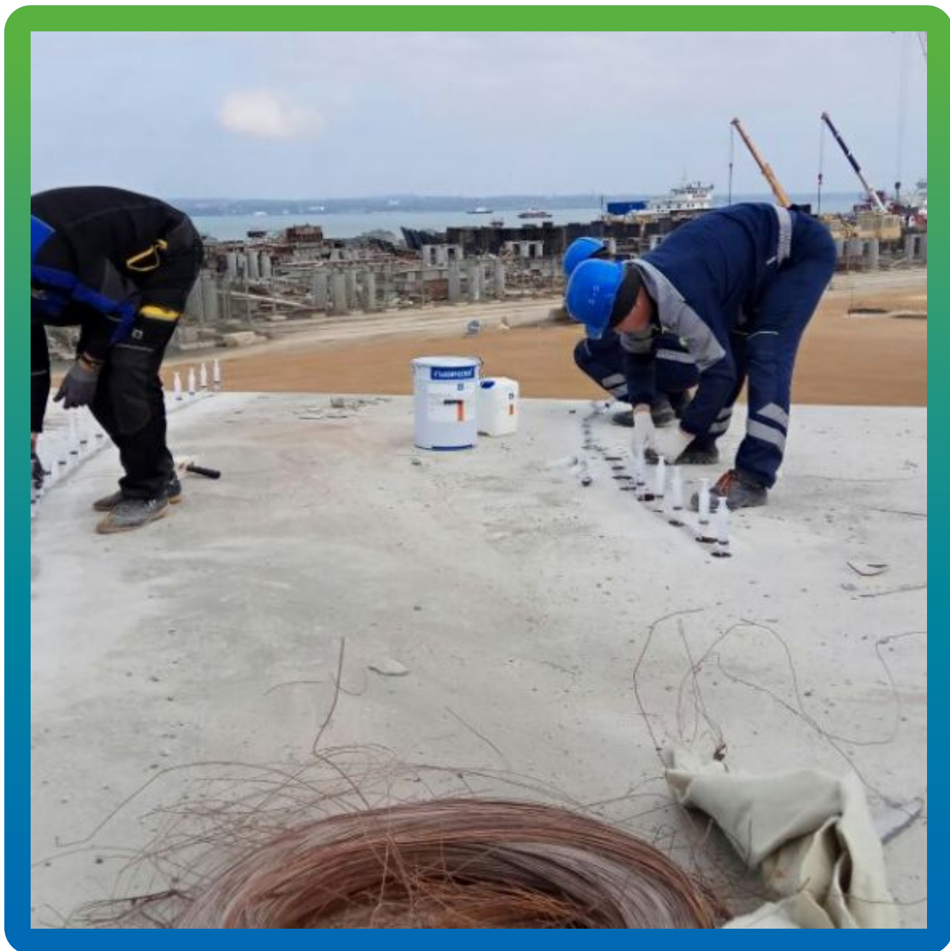
Работы по инъектированию Манопокс 352 ЛВ в трещины.