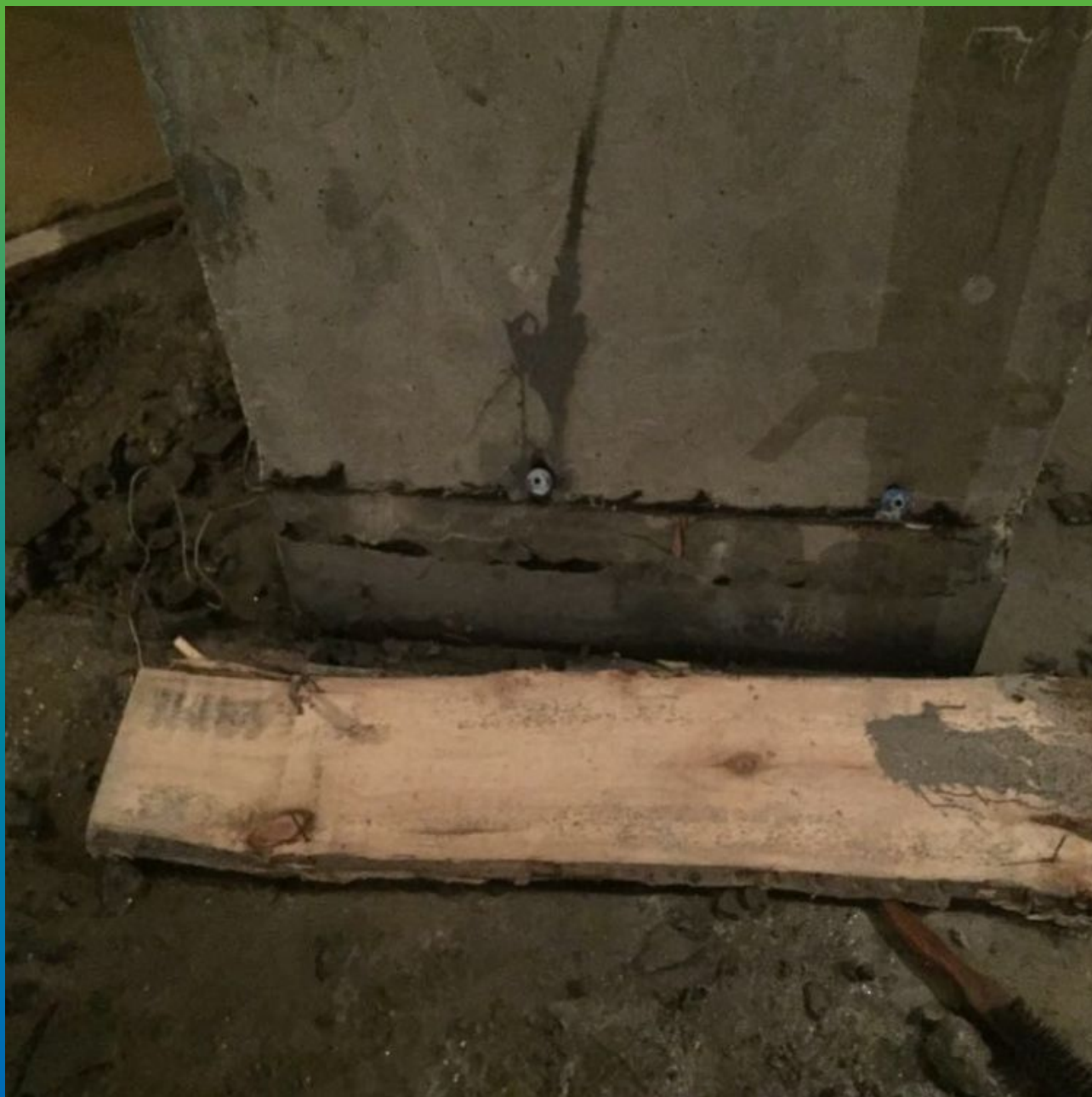
Распалубливание колонны после ремонта.