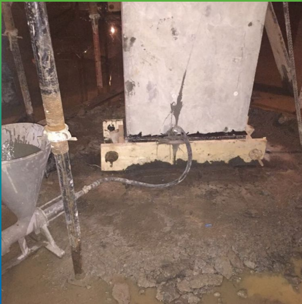
Процесс инъектирования Маноцем Гроут в колонну.