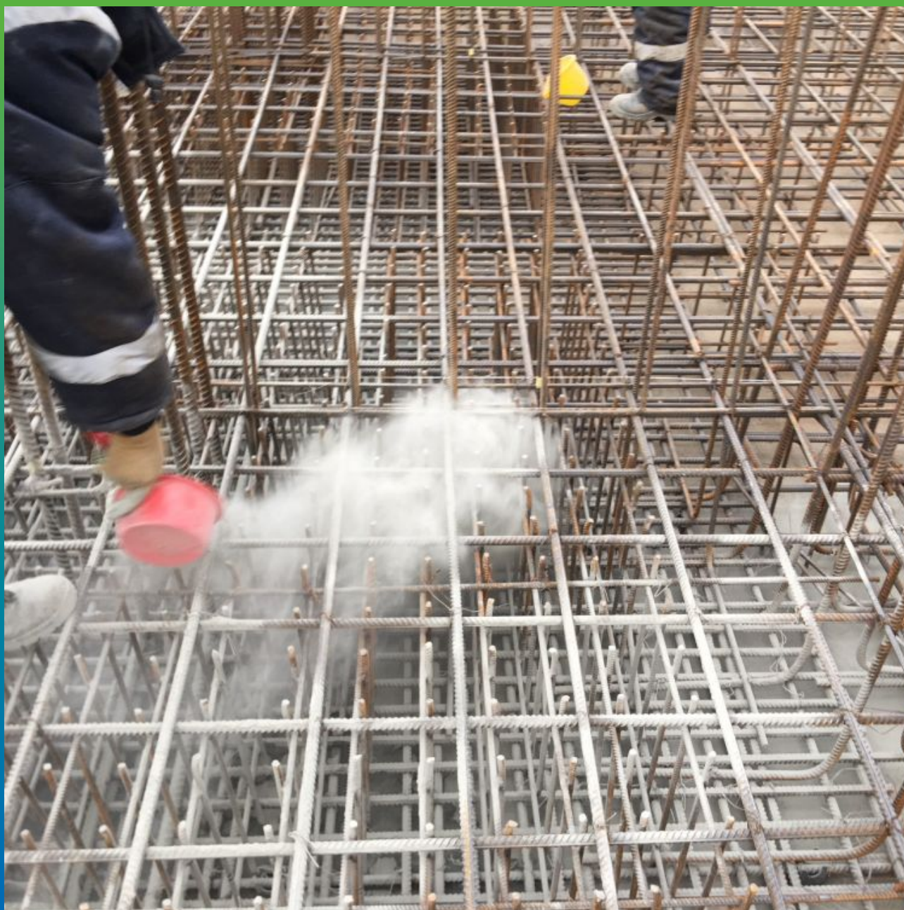
Просыпка Стармекс Сил по бетонной подготовке