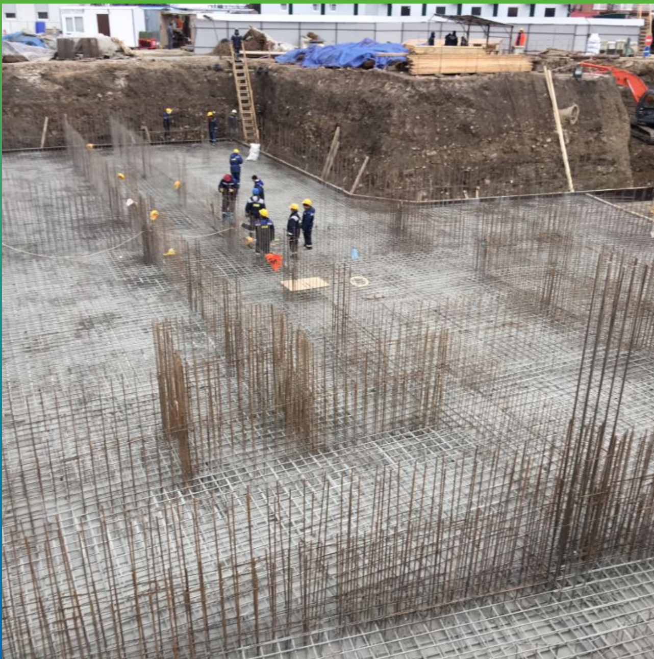
Общий вид объекта перед бетонированием