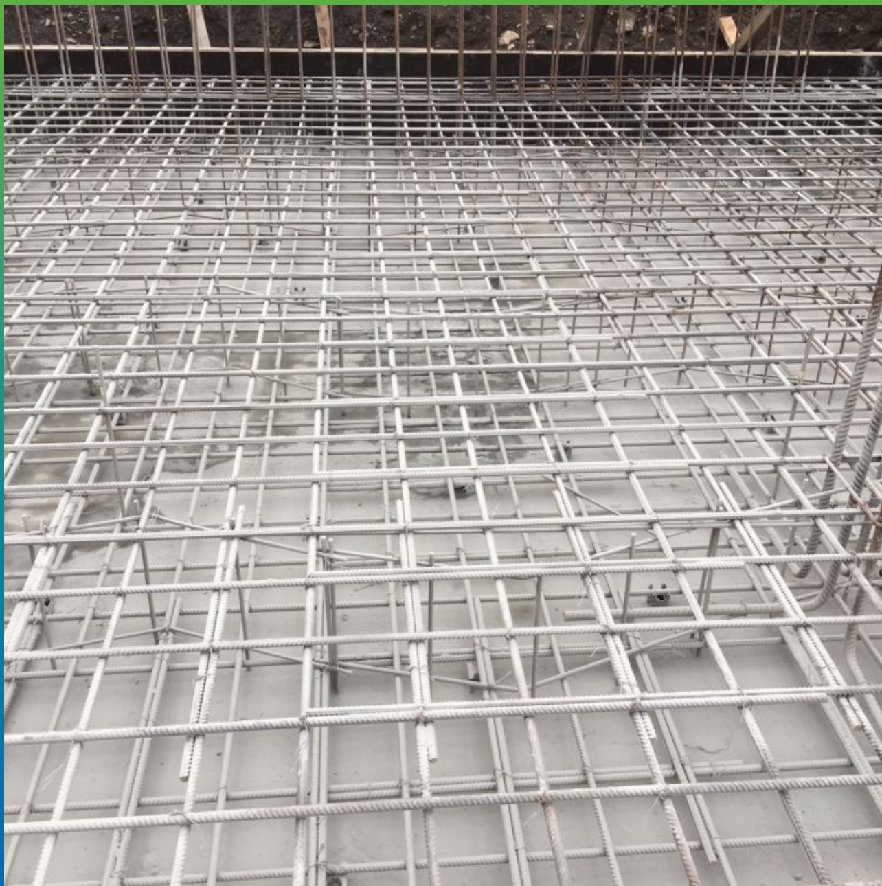
Бетонная подготовка с просыпанной гидроизоляцией Стармекс Сил