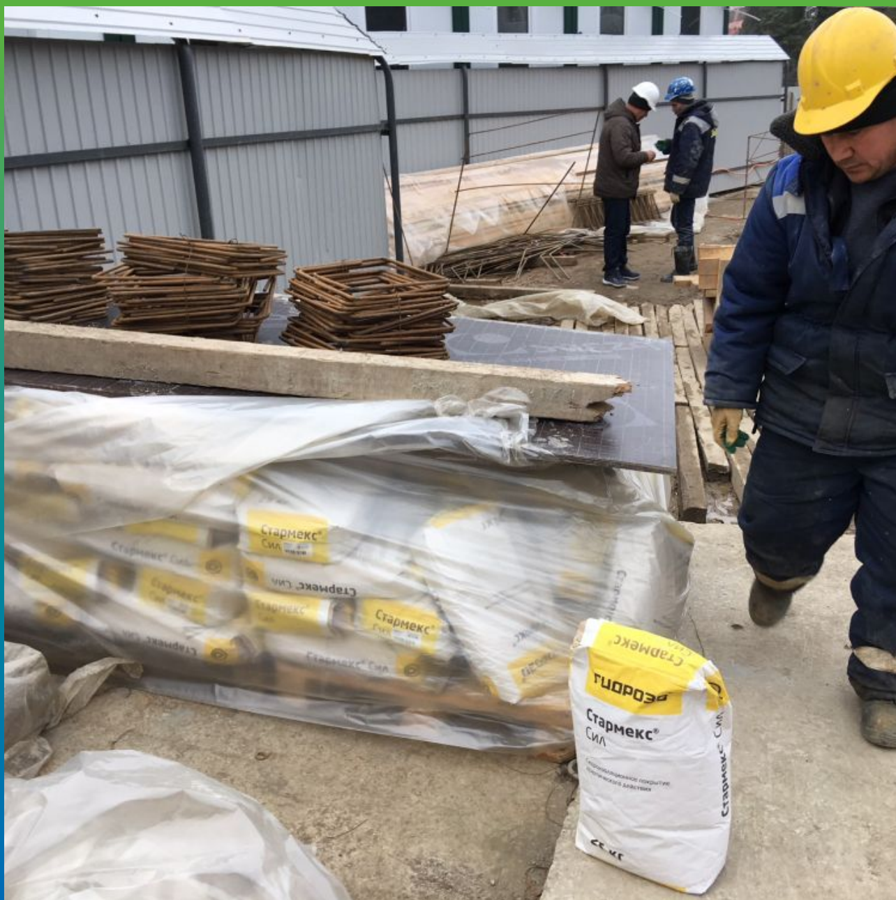
Гидроизоляционный состав осмотического типа действия Стармекс Сил на объекте