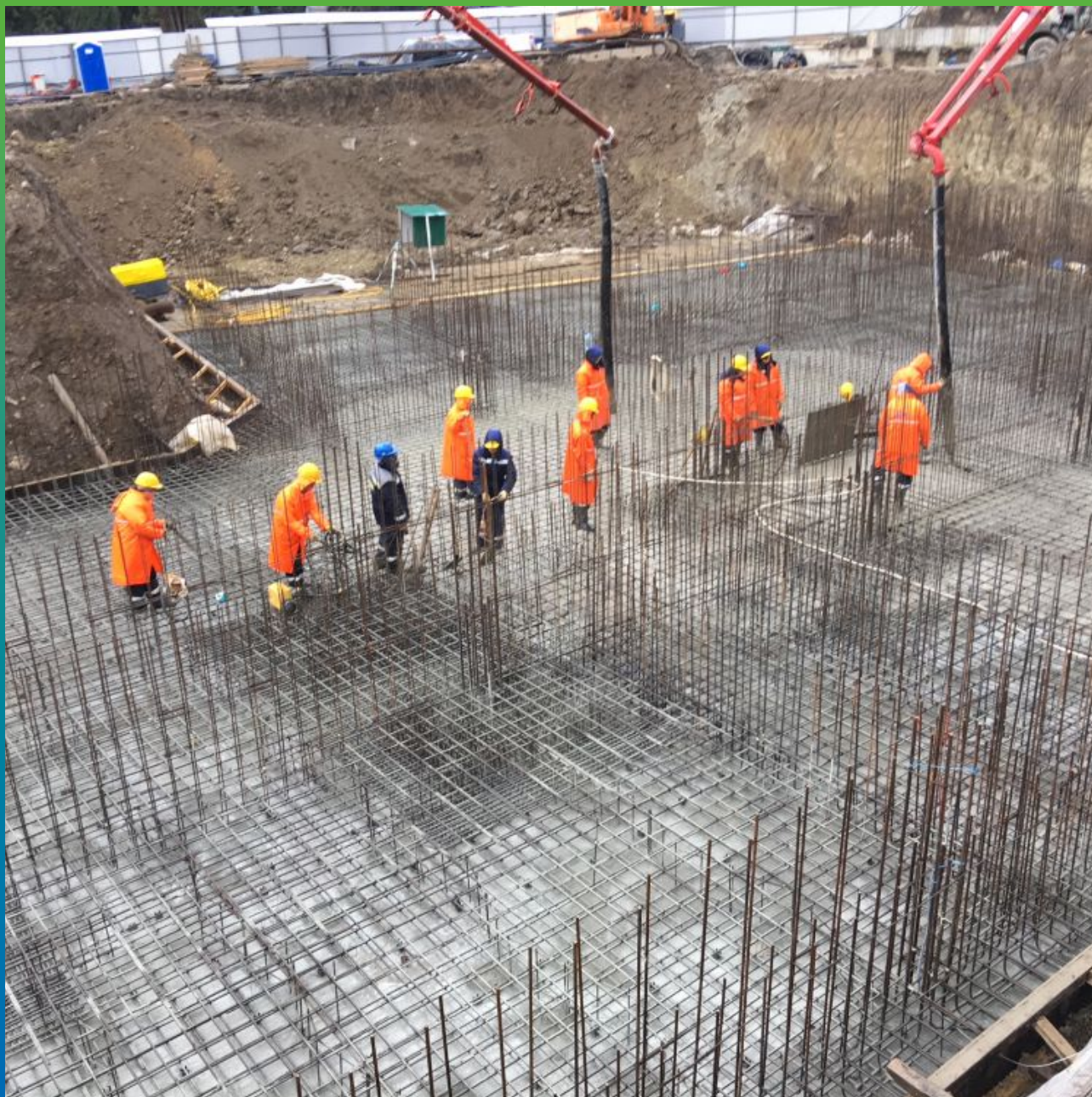
Заливка фундаментной плиты