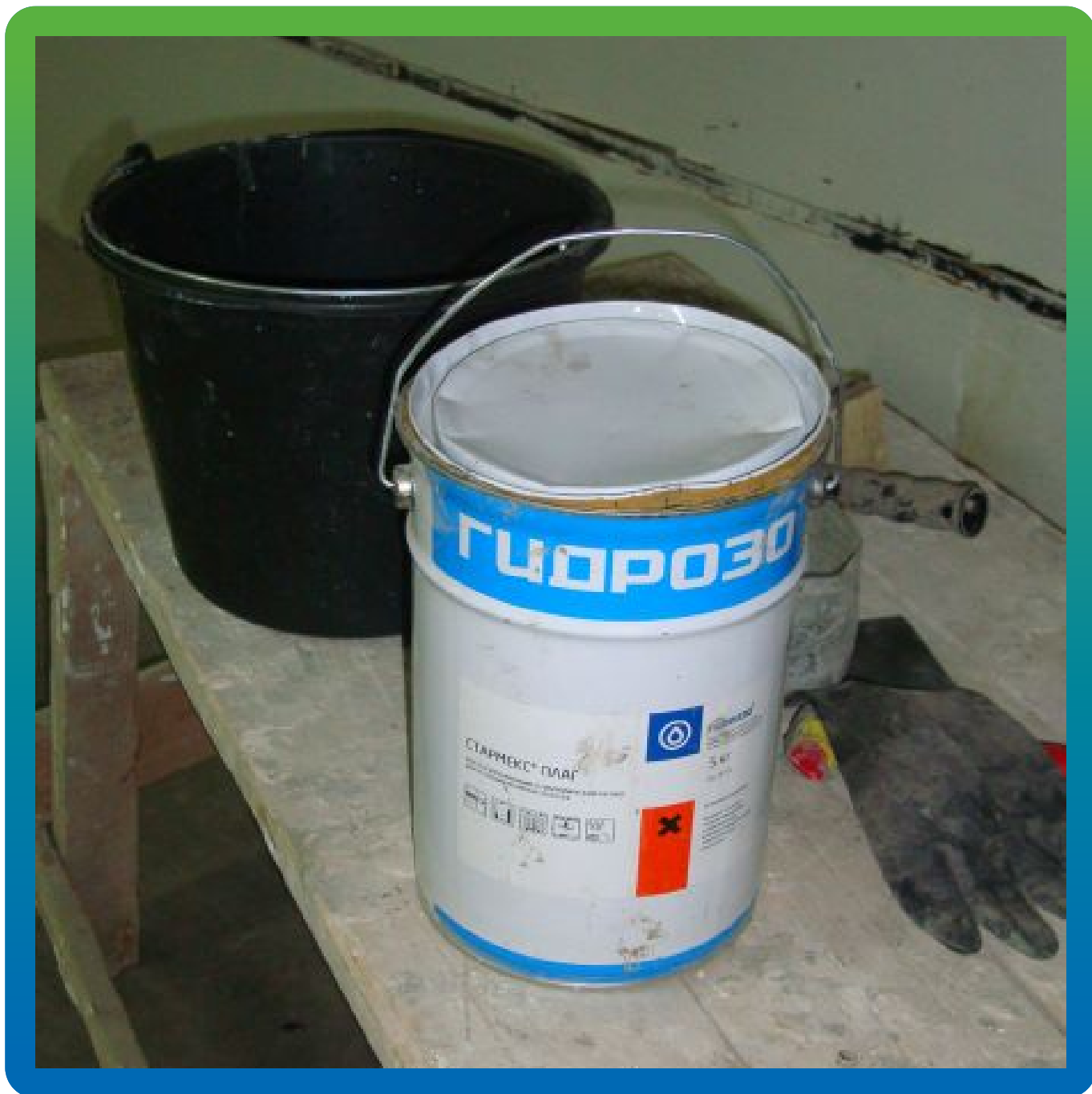
Гидравлический состав Стармекс Плаг на объекте