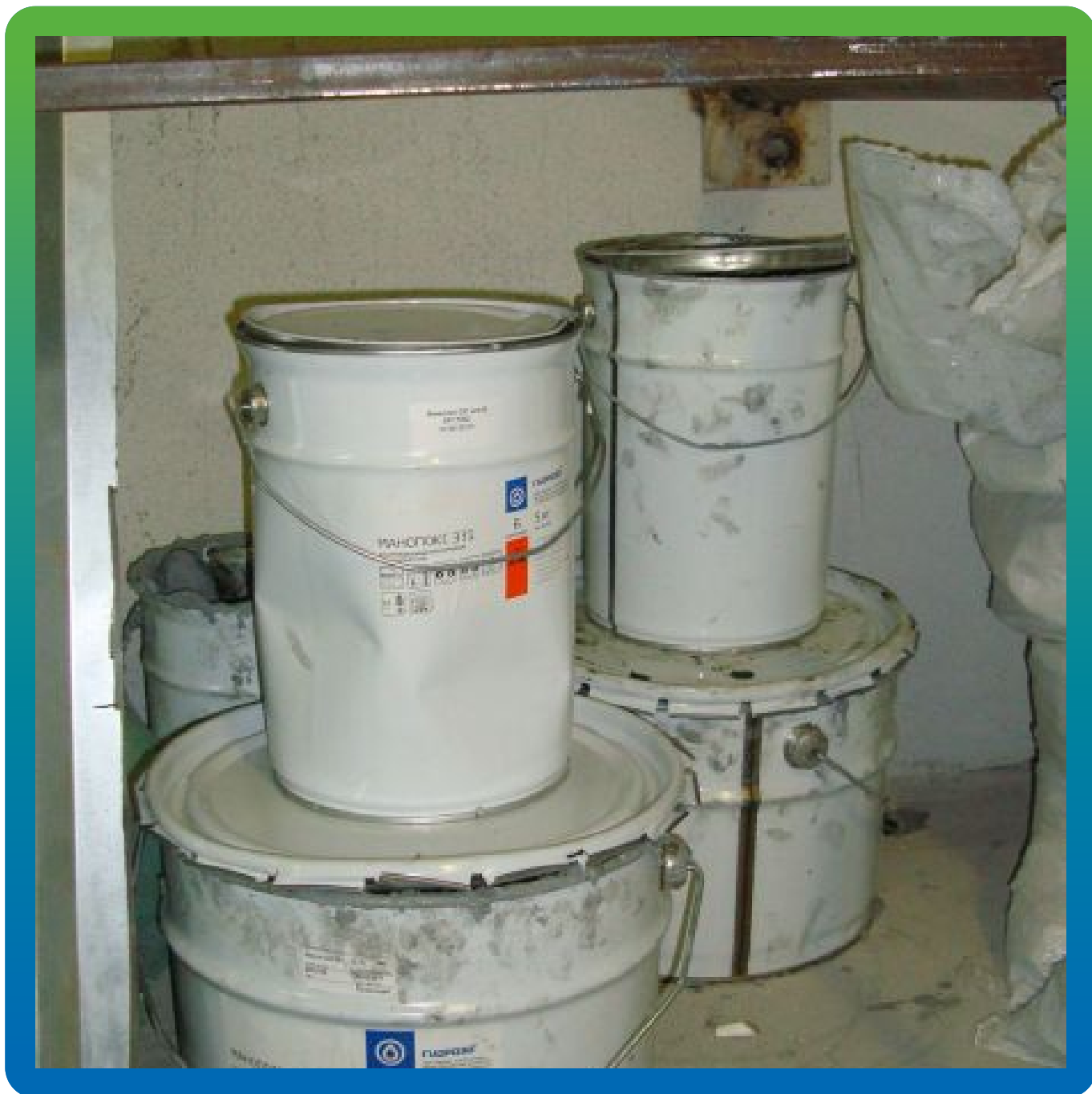
Эпоксидный клей Манопокс 331 на объекте