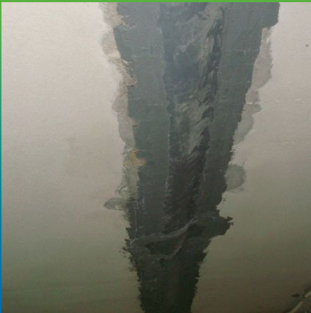
Деформационный шов, выполненный лентой Манодил Про и эпоксидным клеем Манопокс 331