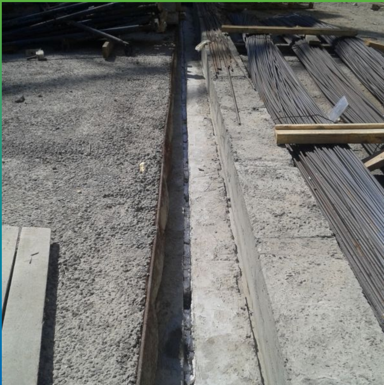
Деформационный шов до исполнения