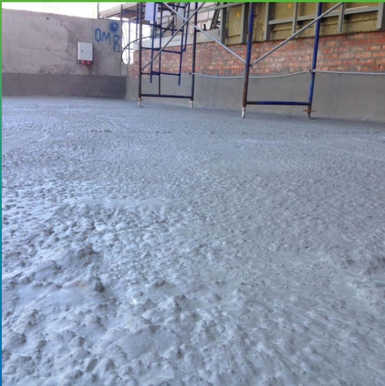
Гидроизоляция эластичным покрытием Стармекс Сил Флекс