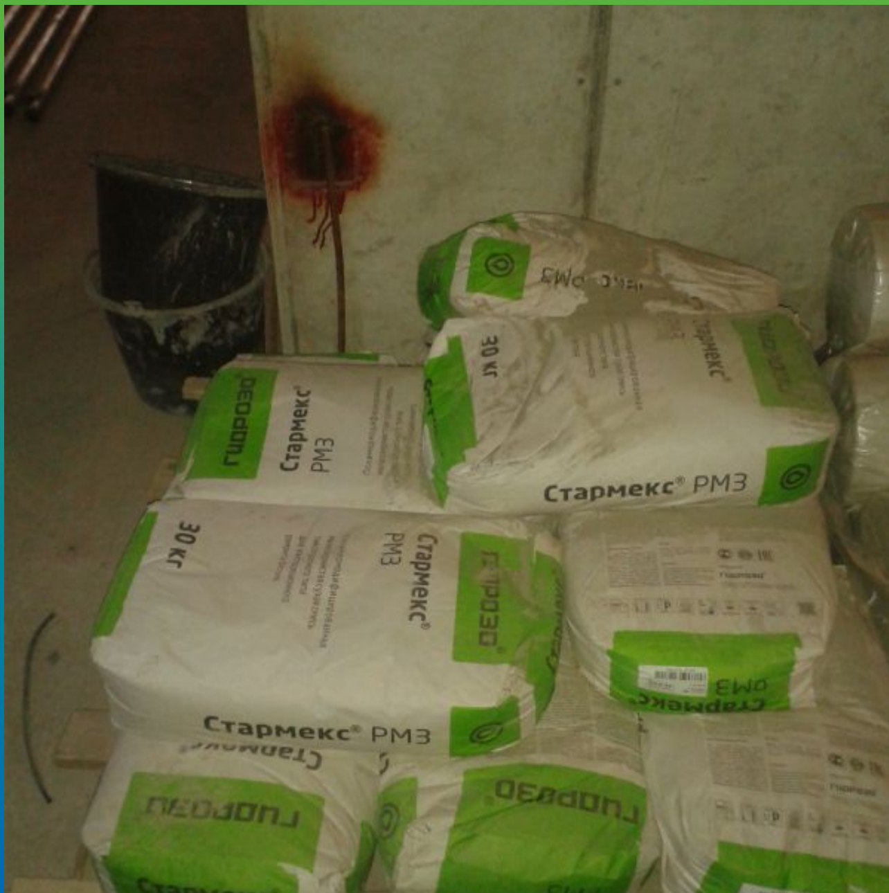
Ремонтный состав Стармекс РМЗ на объекте