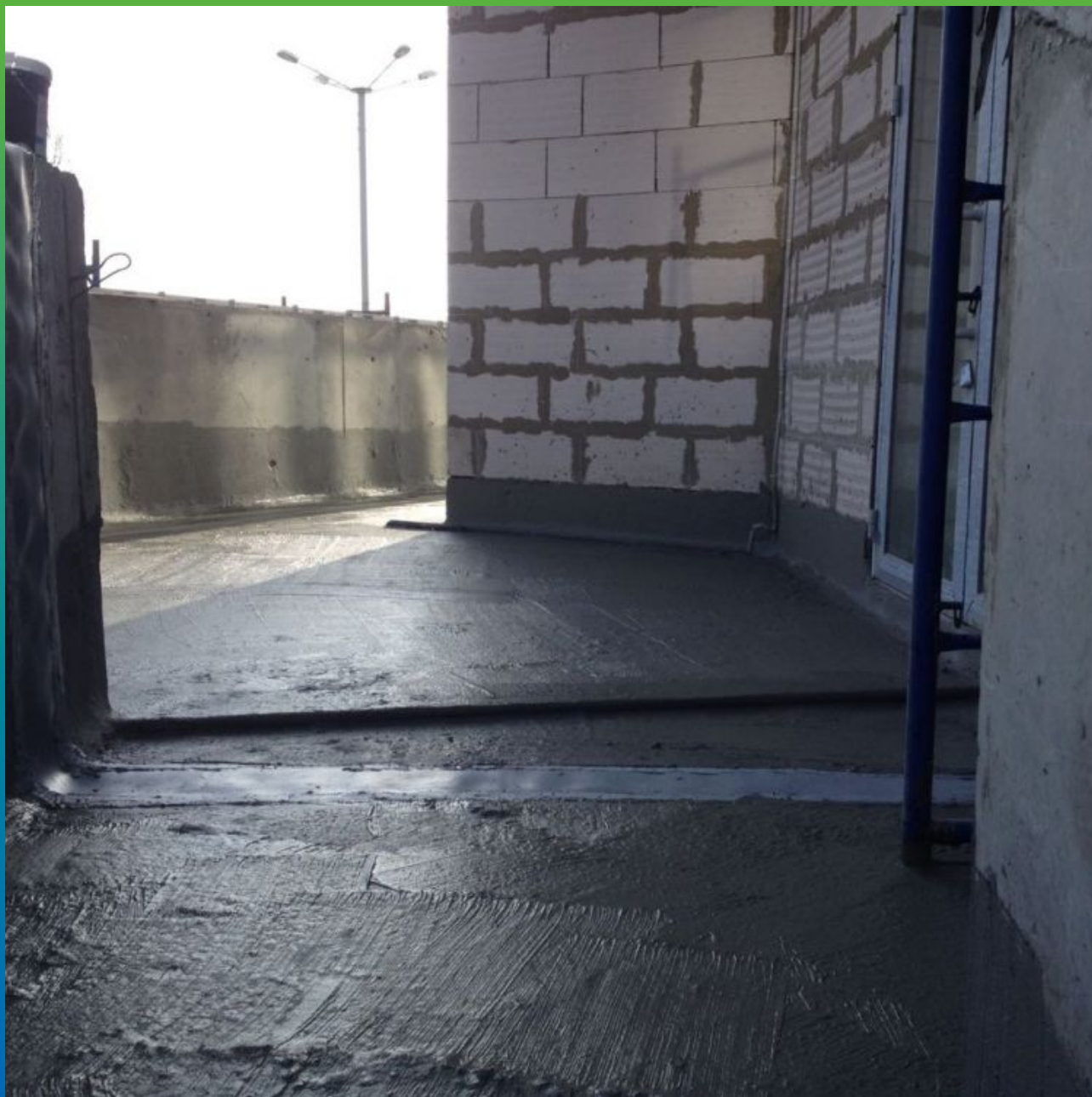
Обмазка пола Стармекс Сил Флекс и деформационный шов, выполненный лентой Манодил Про