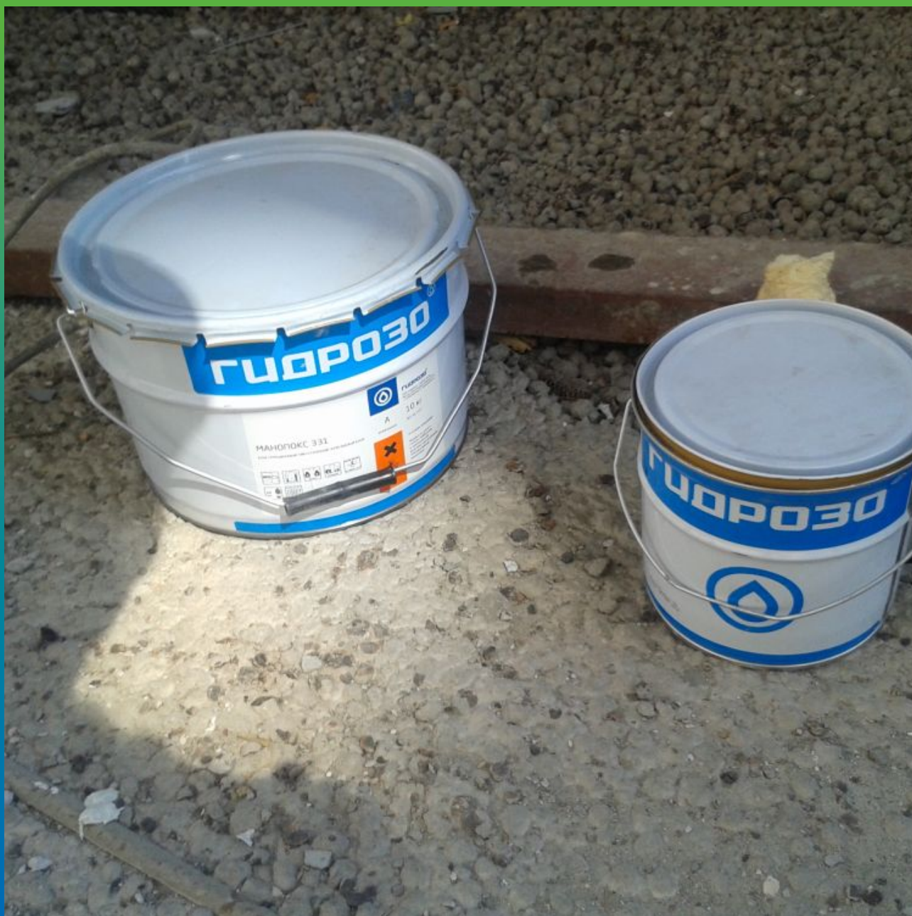
Эпоксидный клей Манопокс 331