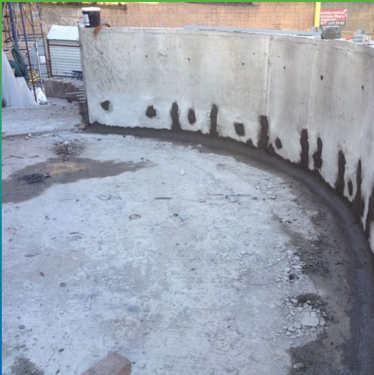
Чеканка швов ремонтным составом Стармекс РМЗ