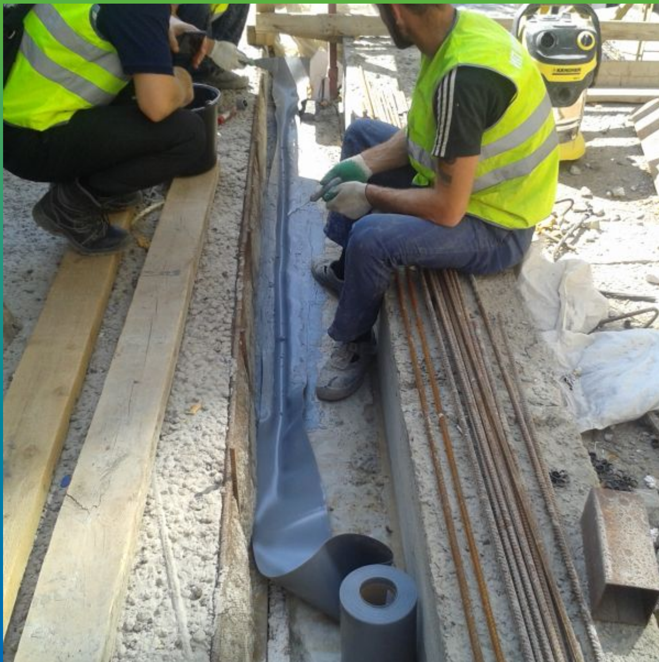
Устройство деформационного шва эластичной лентой Манодил Про на клей Манопокс 331