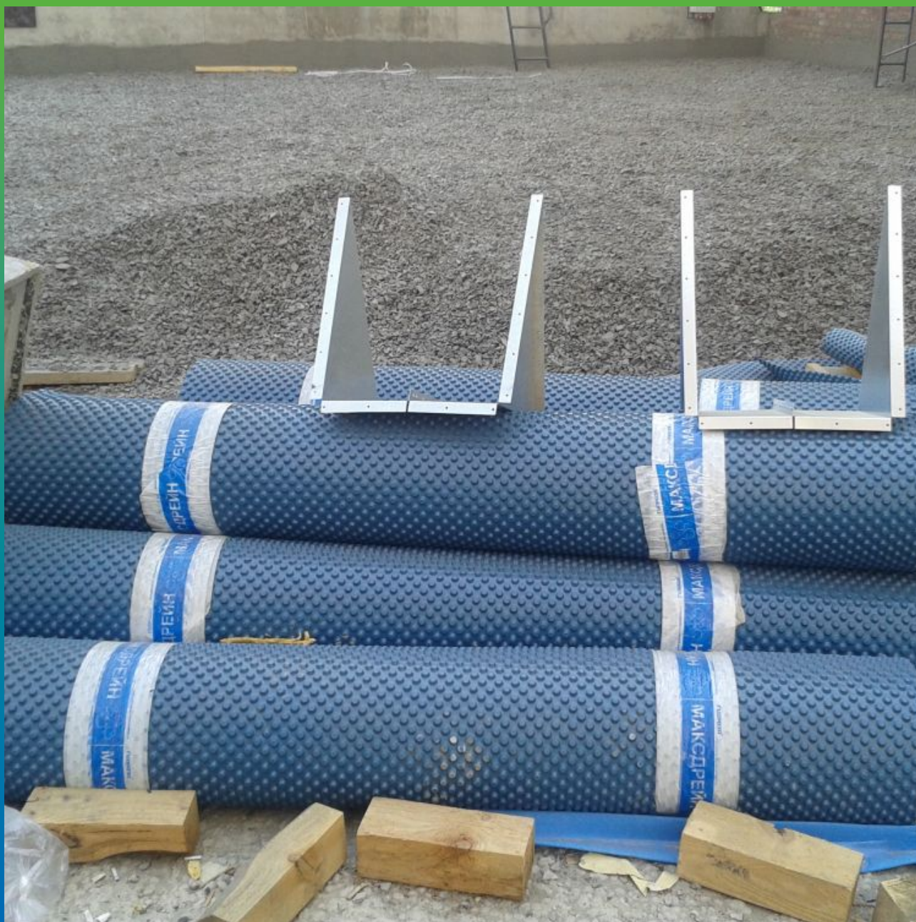
Дренажное полотно Максдрейн 8 на объекте