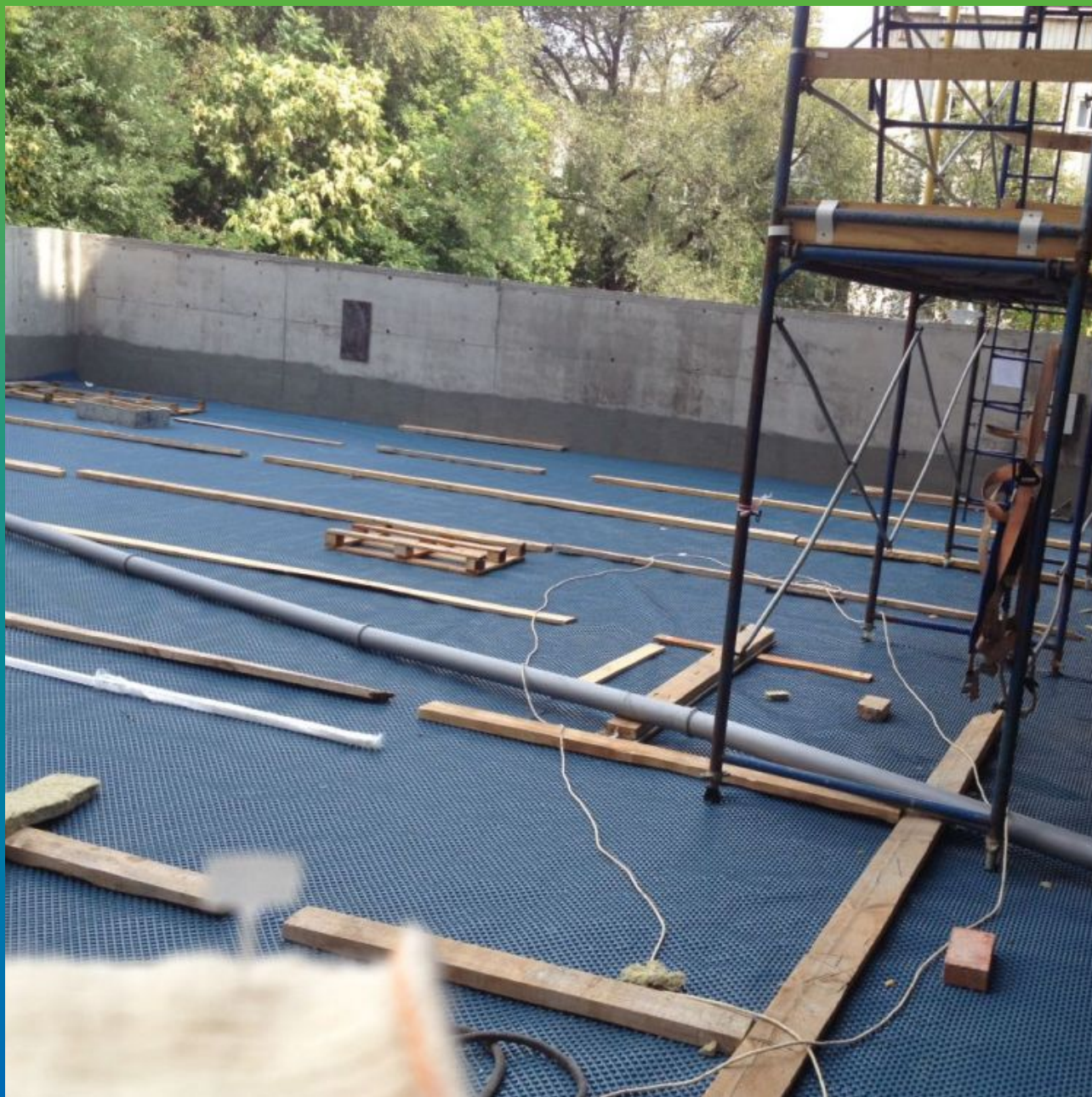
Укладка дренажного полотна Максдрейн 8 на стилобатной части здания