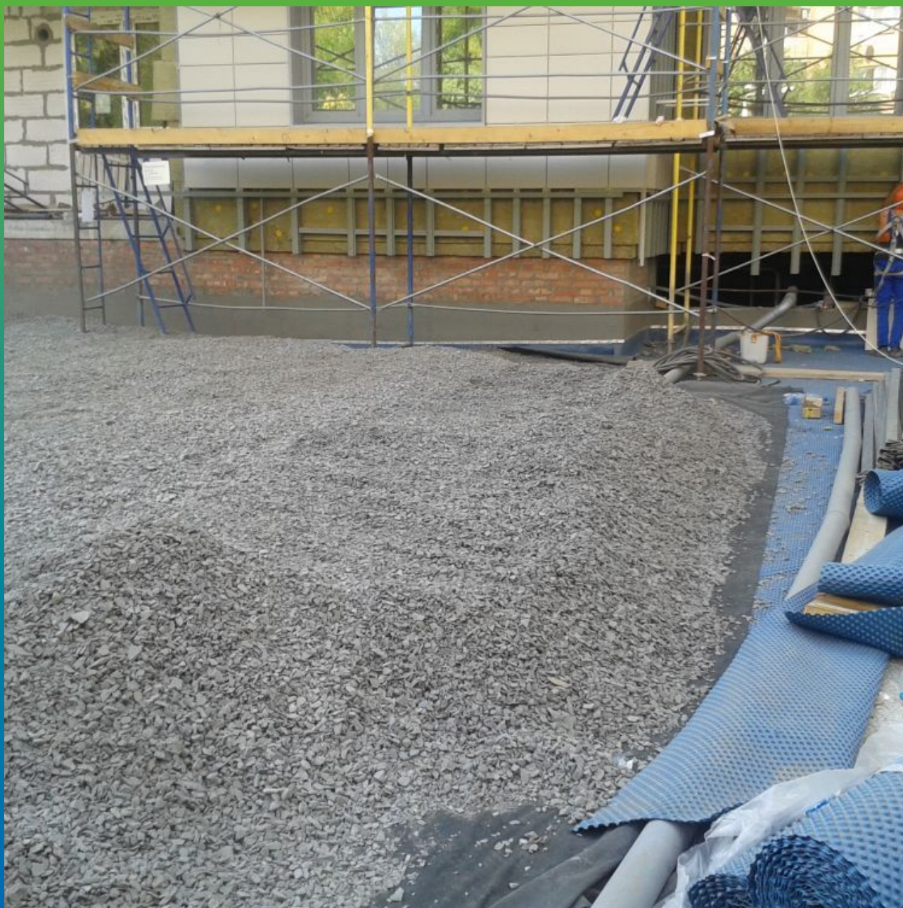
Присыпка гравием дренажного полотна