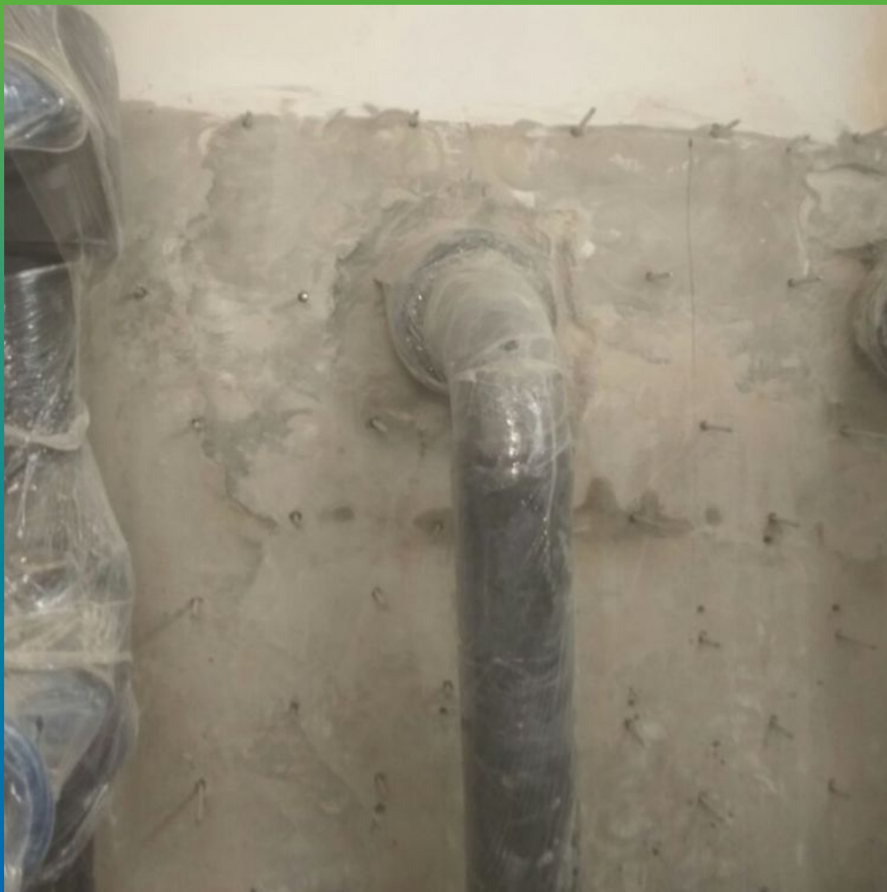
Стена после инъектирования