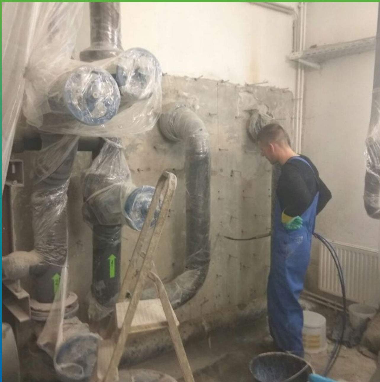
Инъектирование с целью устройства противодиффузионной завесы за стеной