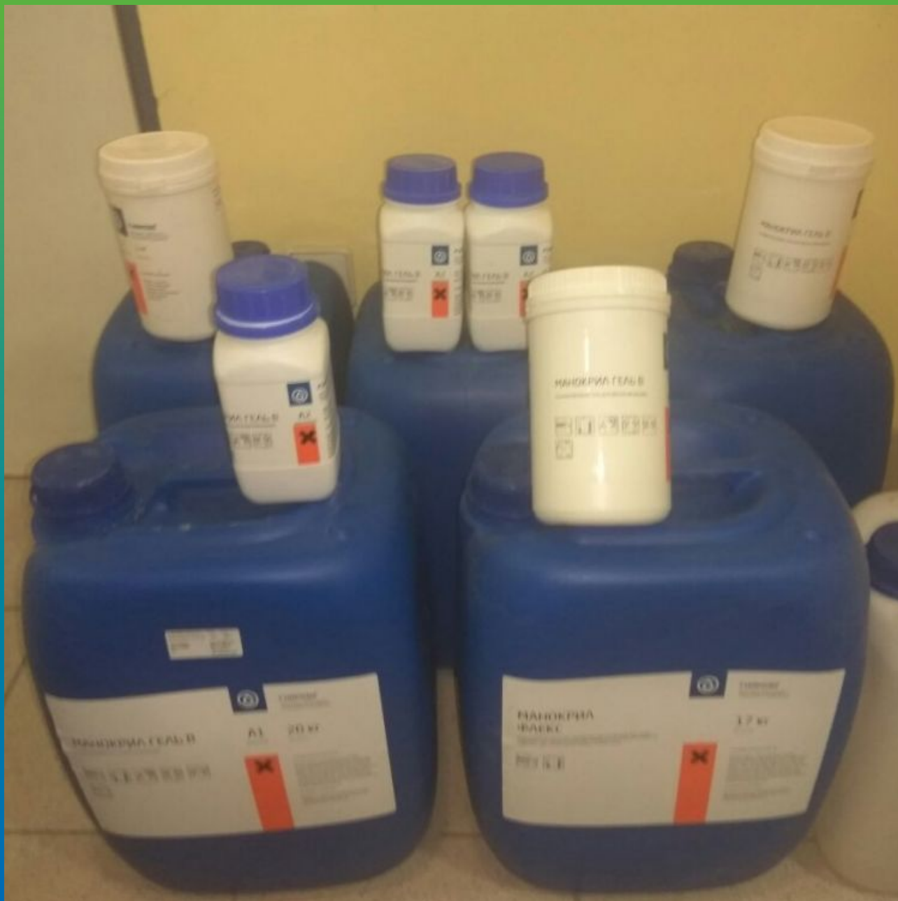
Материалы Гидрозо на объекте: акрилатный гель для инъектирования Манокрил Гель В и пластификатор Манокрил Флекс