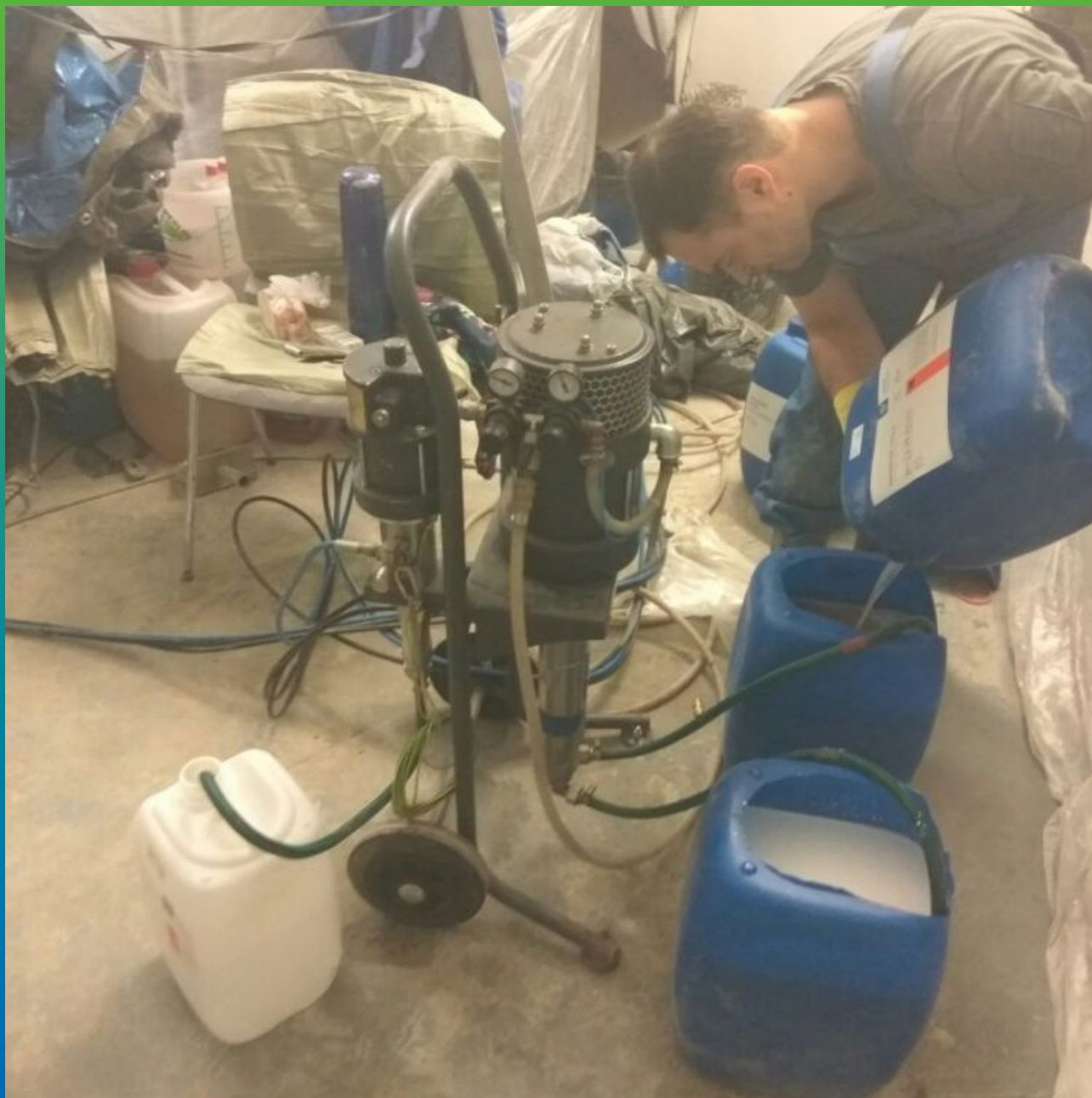
Подготовка акрилатного геля