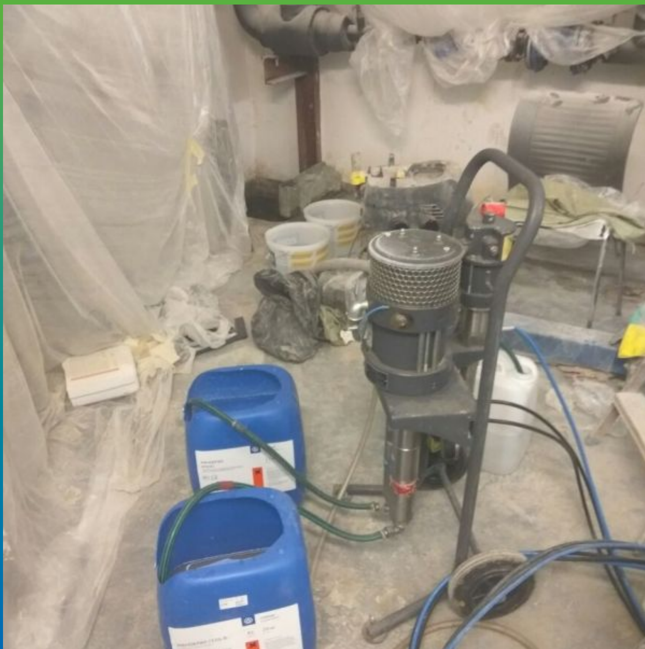
Подготовленное инъекционное оборудование и приготовленный состав