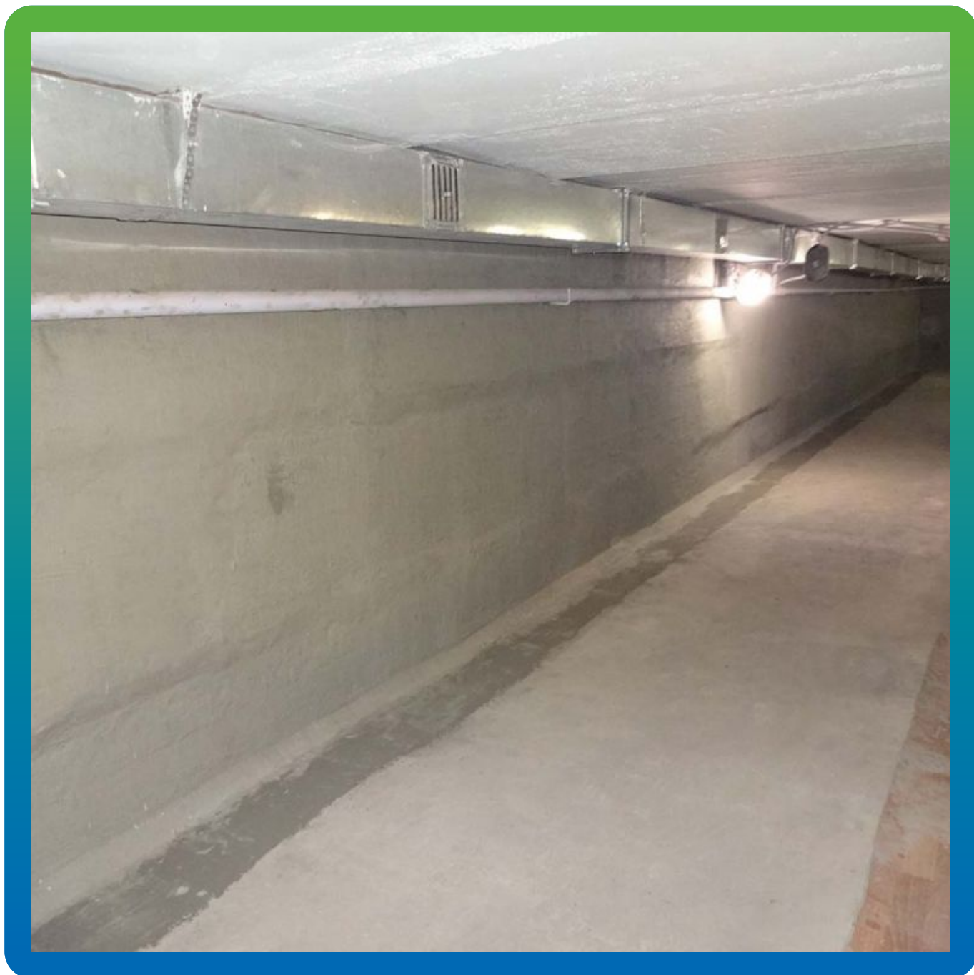
Объект в законченном виде.