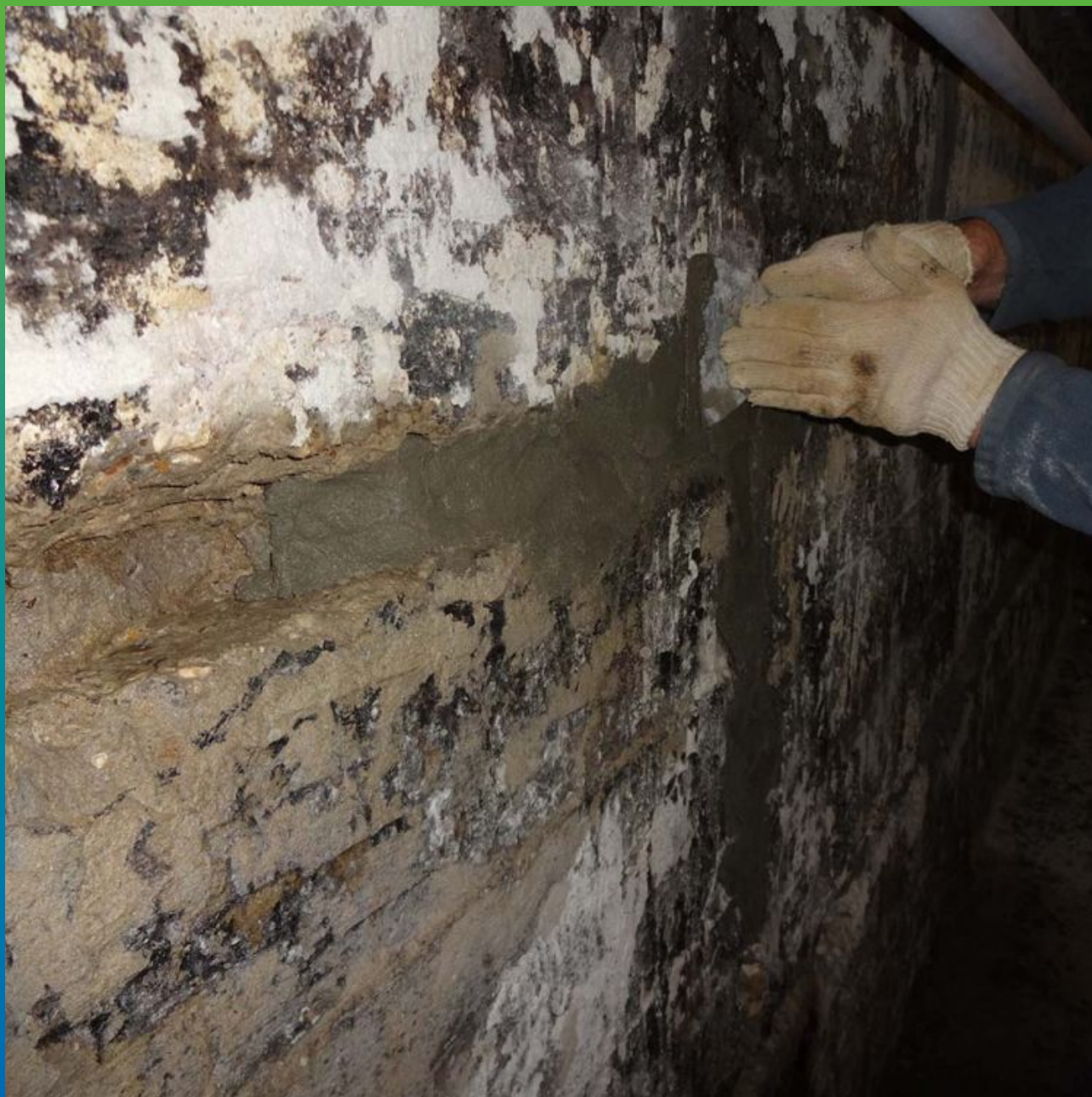
Чеканка швов между блоками ФБС ремонтным составом Стармекс РМЗ.