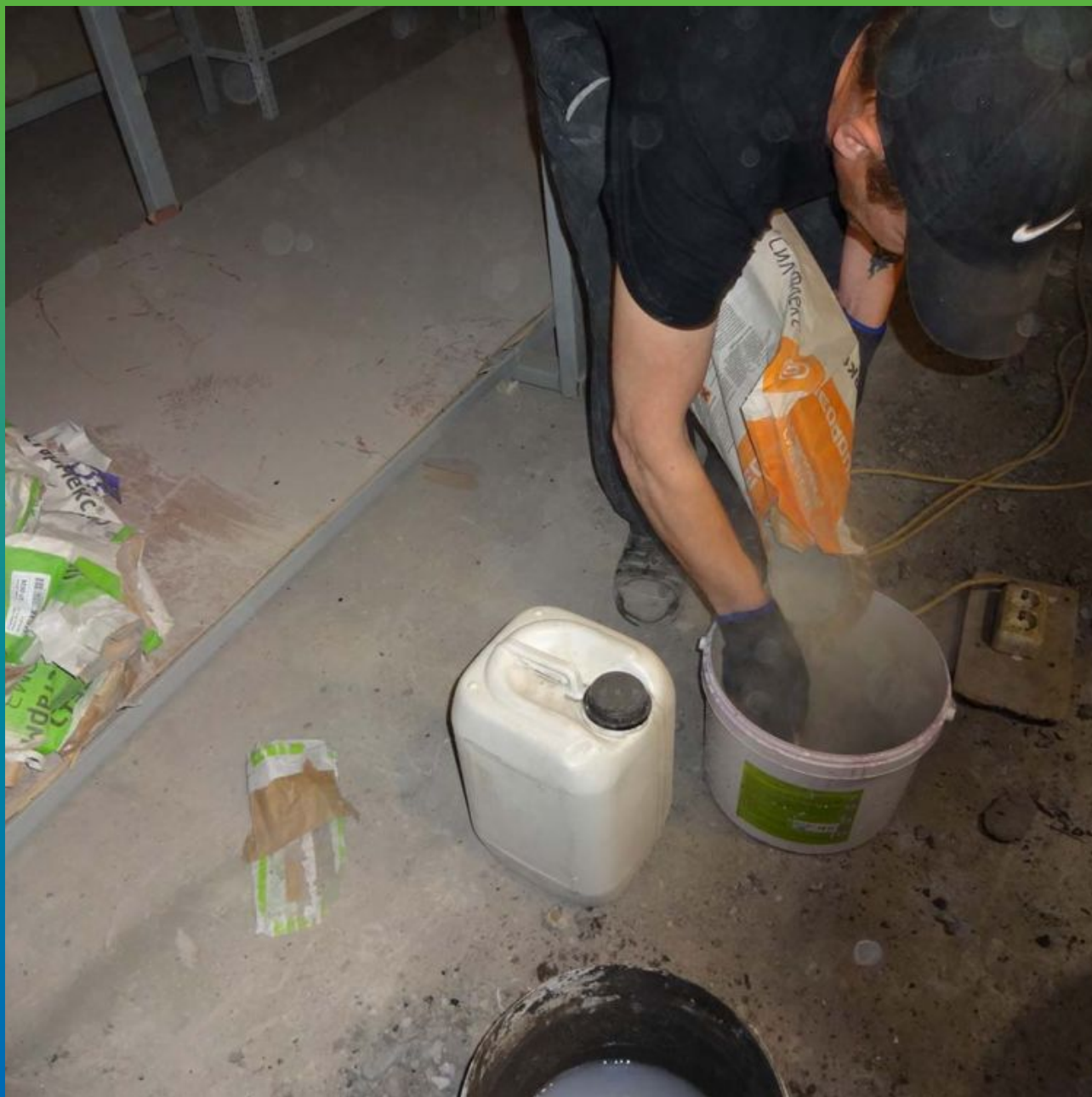
Подготовка гидроизоляции Стармекс Сил Флекс.