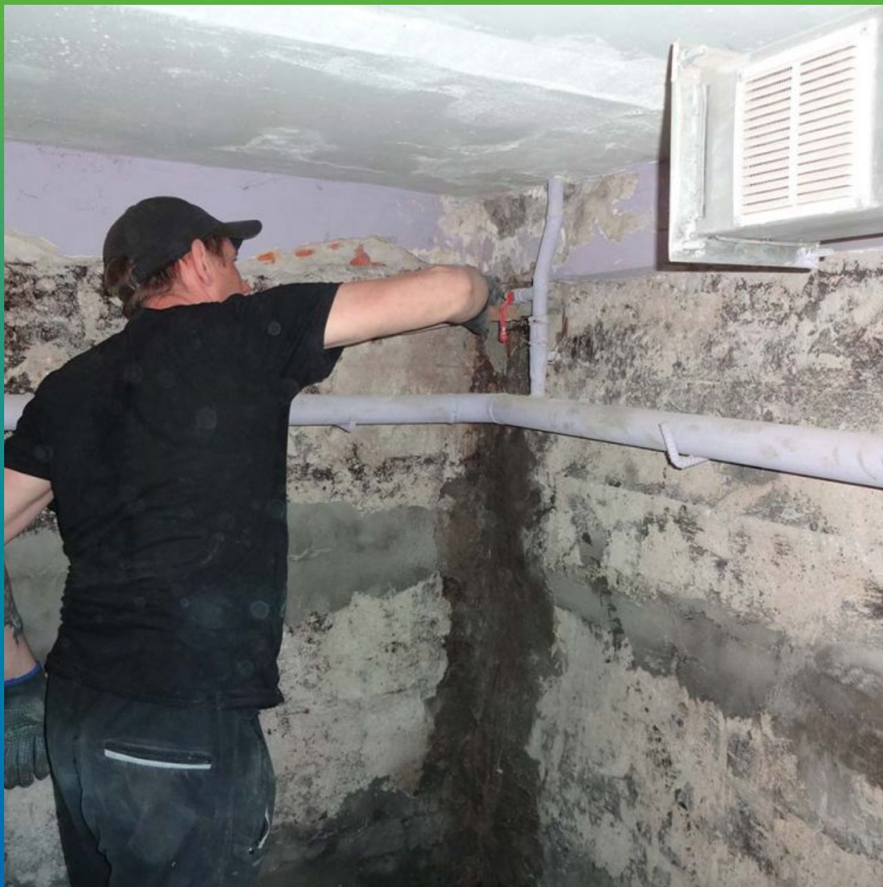
Устранение активных протечек гидравлическим составом Стармекс Плаг.