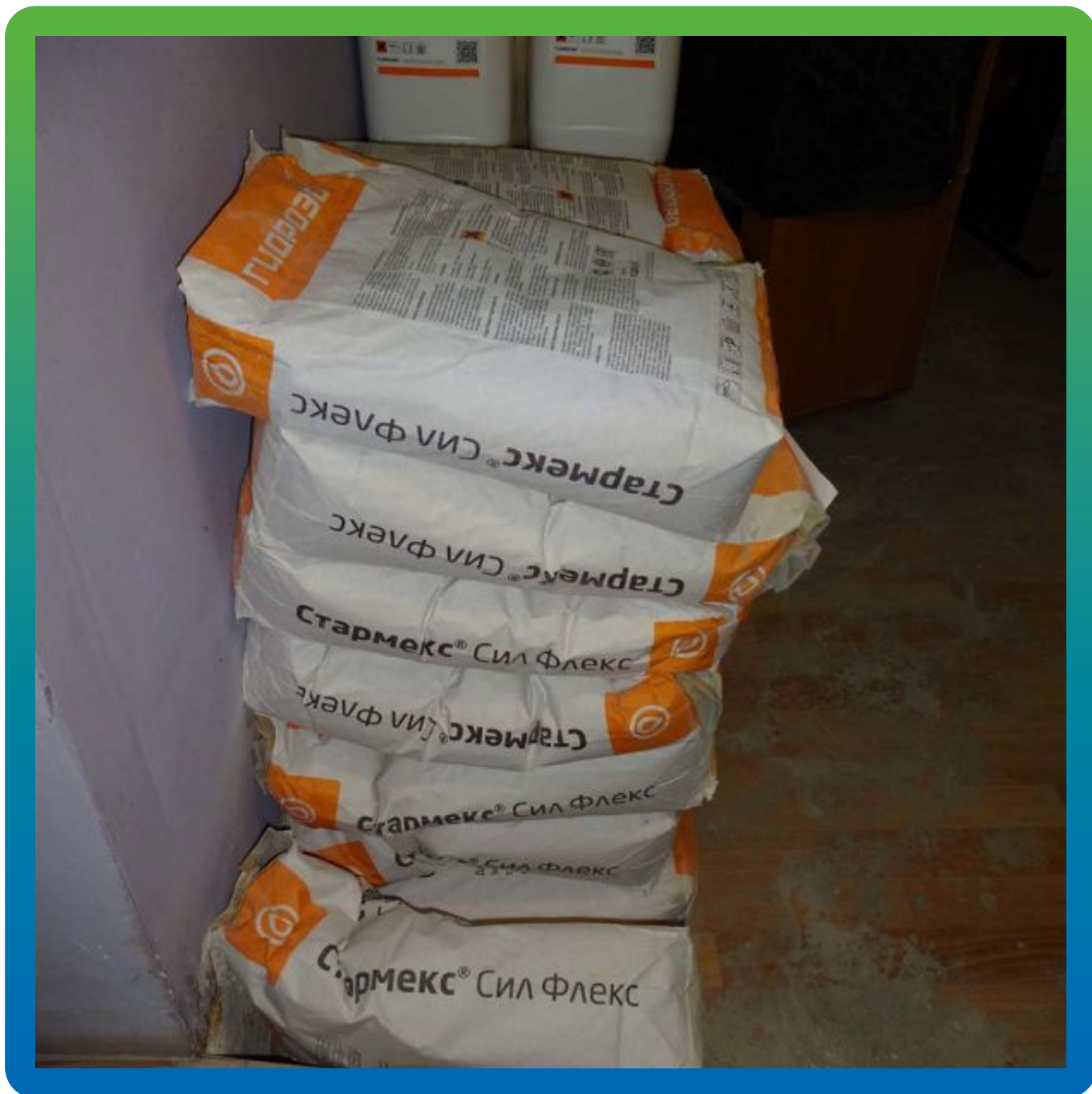
Материалы Гидрозо на объекте.