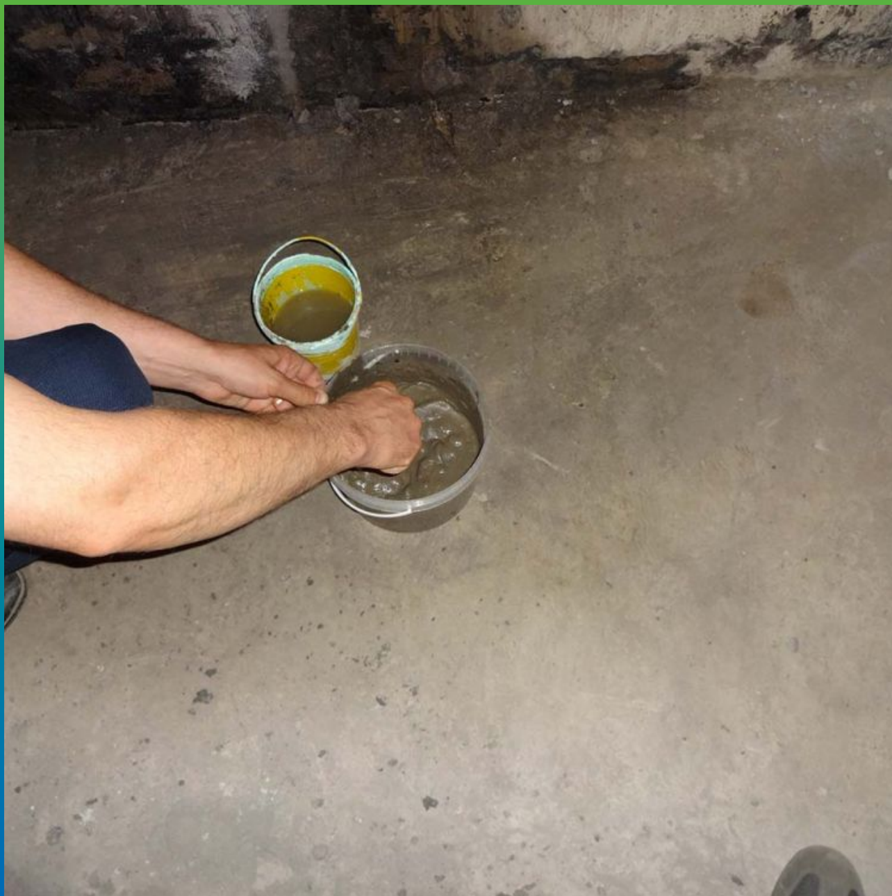
Подготовка гидравлического состава Стармекс Плаг для устранения протечек.