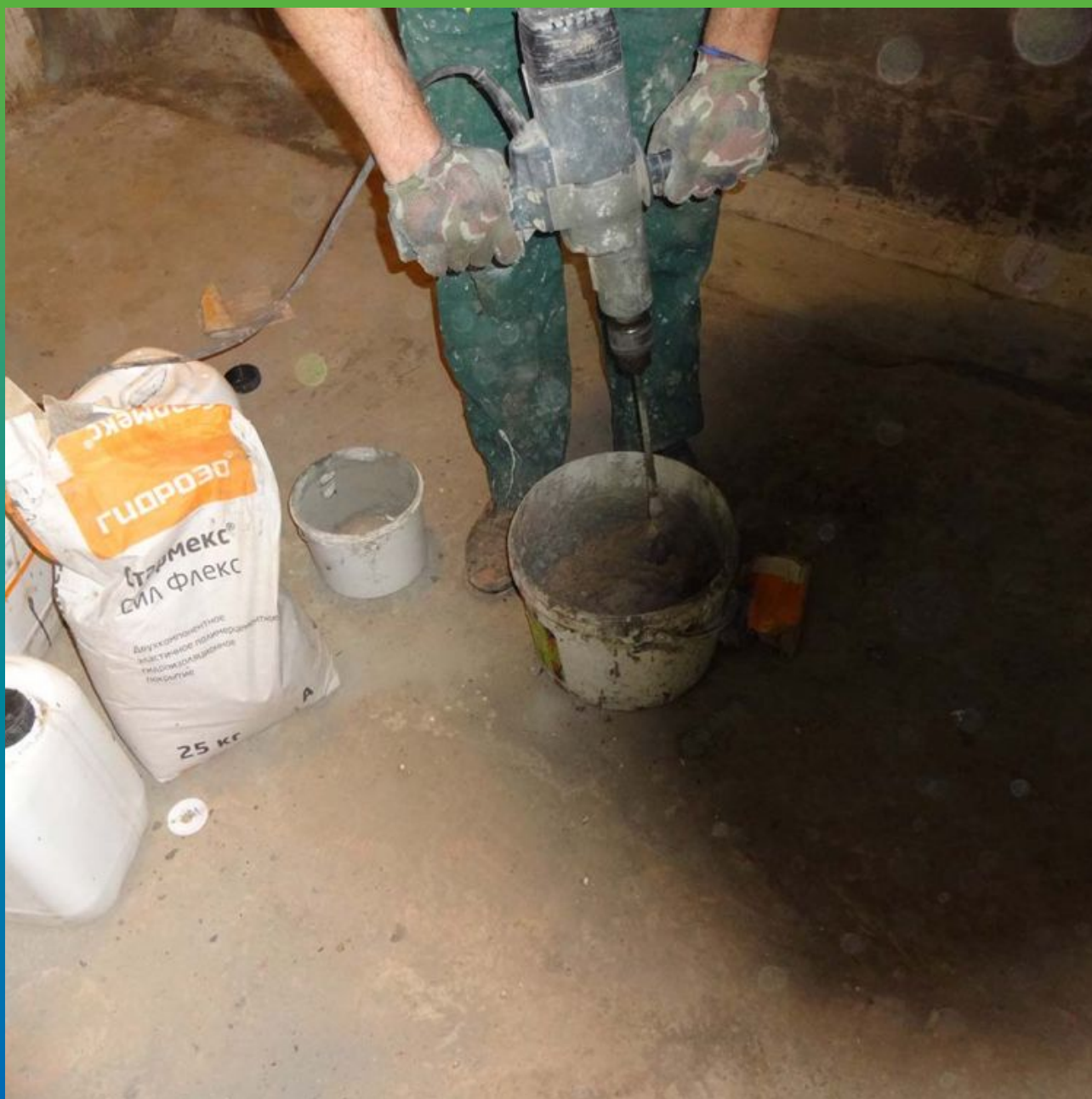
Подготовка и дальнейшее нанесение на стены гидроизоляции Стармекс Сил Флекс.