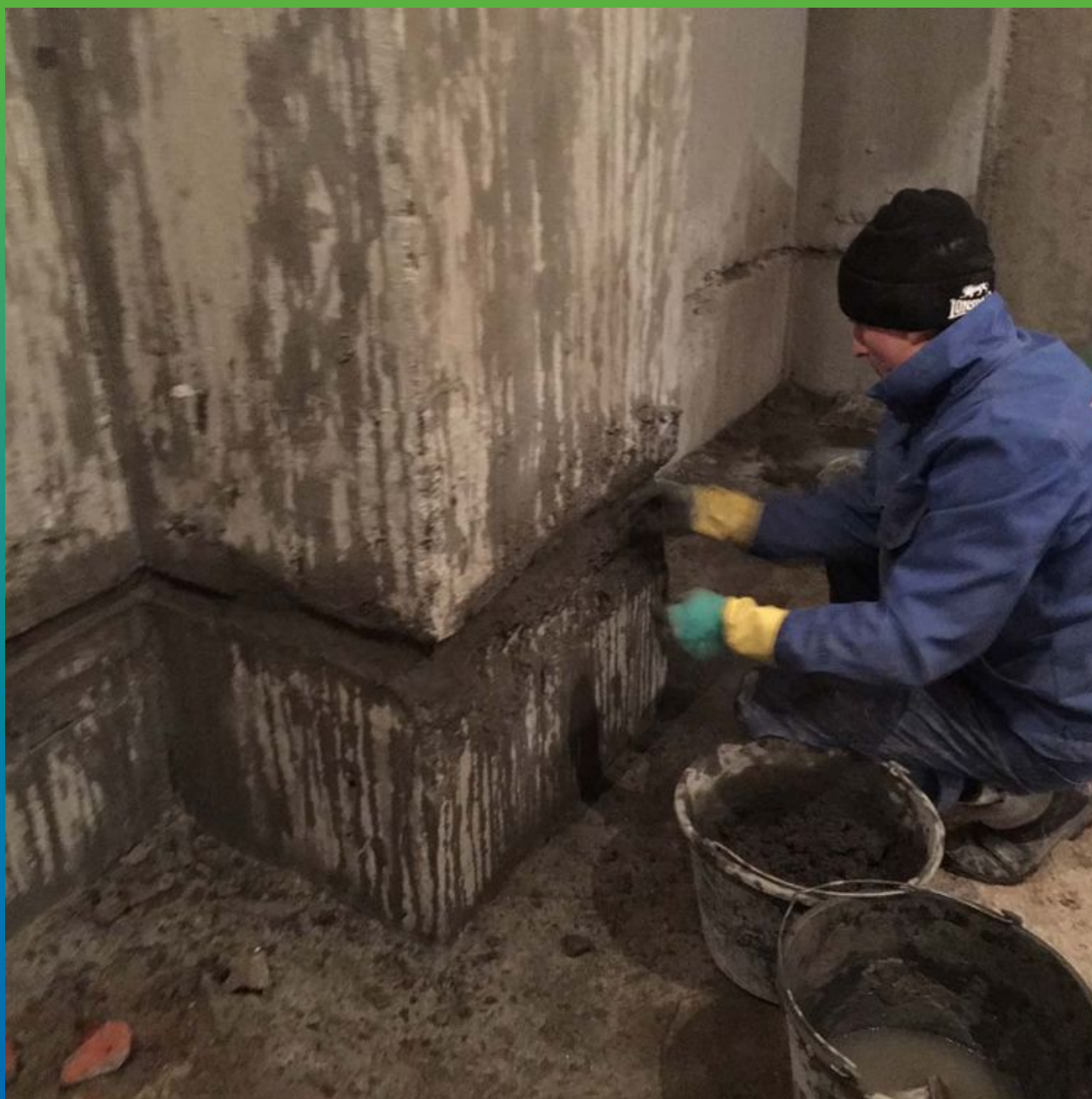
Зачеканка холодных швов ремонтным материалом Стармекс РМ 3