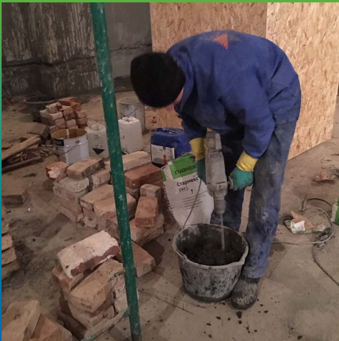
Приготовление ремонтного состава Стармекс РМЗ