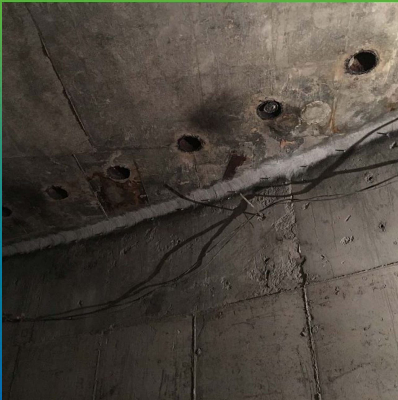
Заделанный шов, установленные пакеры