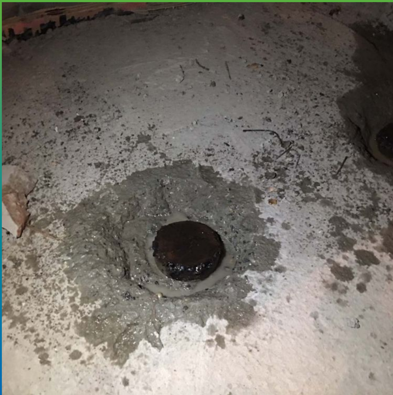
Увлажнение расшитой и заваренной металлической сваи