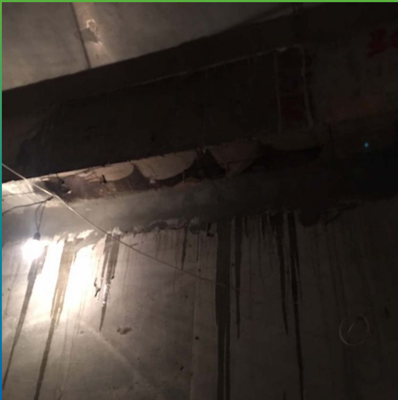
Проинъецированный холодный шов бетонирования и обмазанный гидроизоляцией Стармекс Сил Флекс