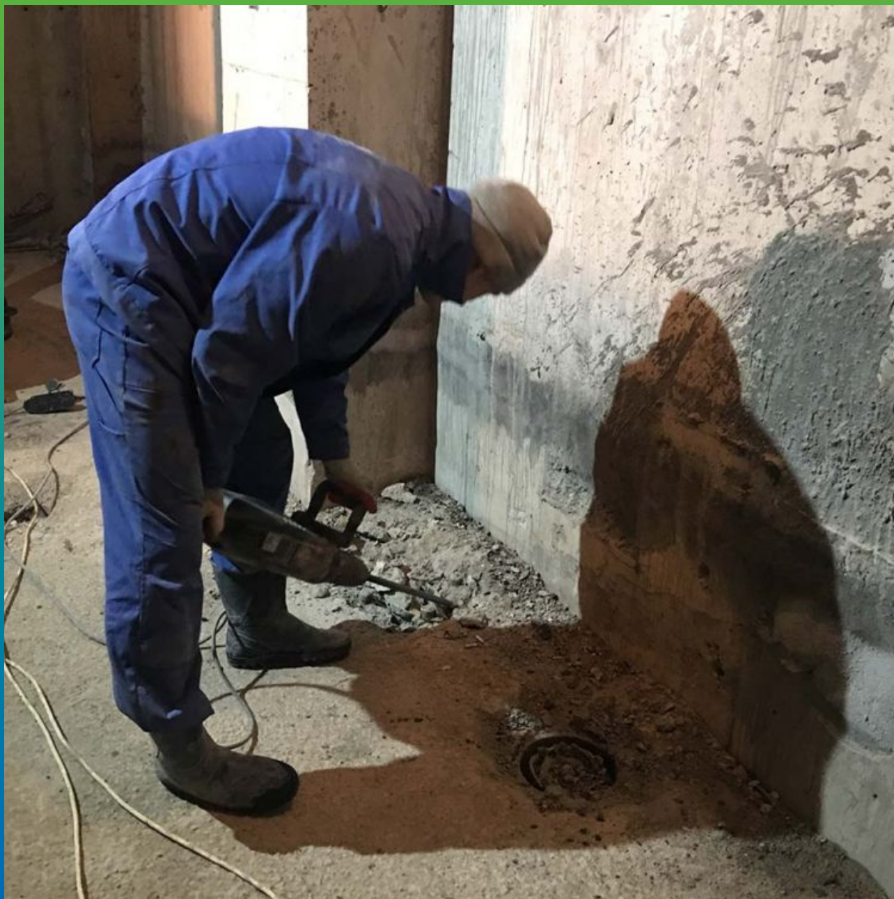
Вскрытие холодного шва между металлической сваей и фундаментной плитой