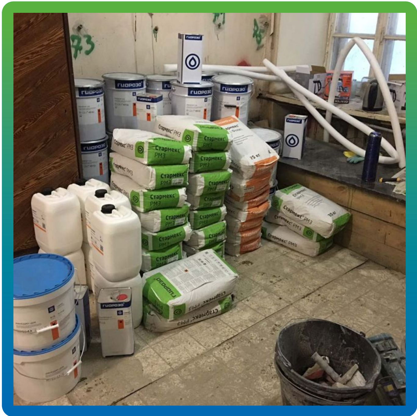
Продукция Гидрозо на объекте