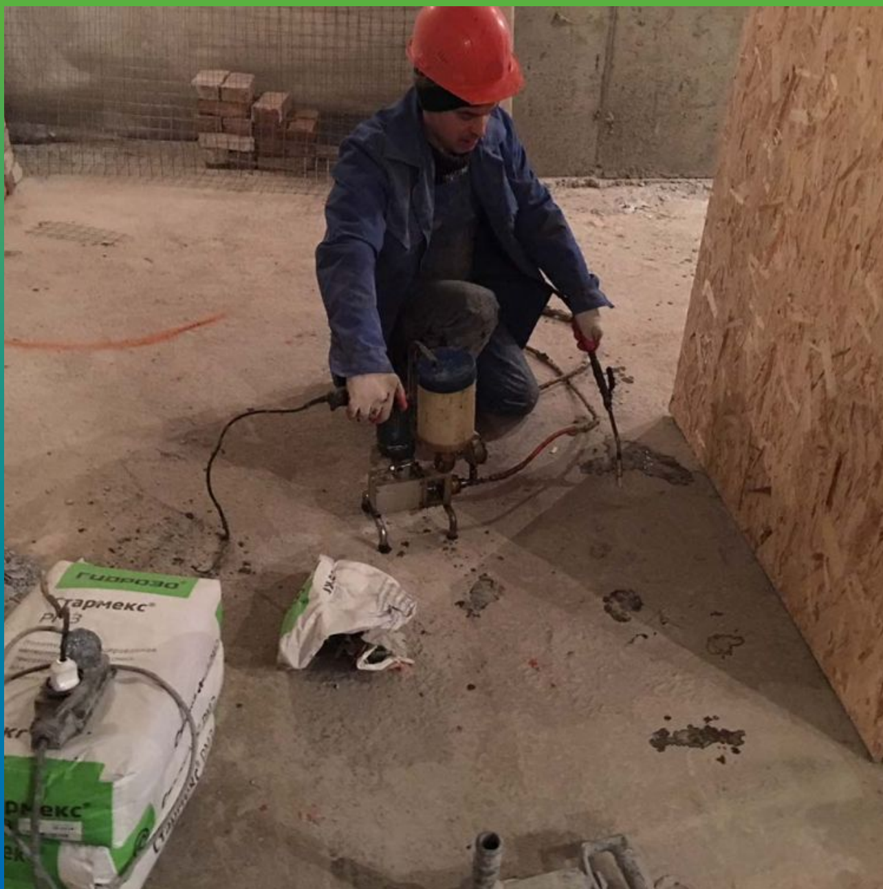
Инъектирование холодного шва между металлической сваей и фундаментной плитой смолой Манопур 143