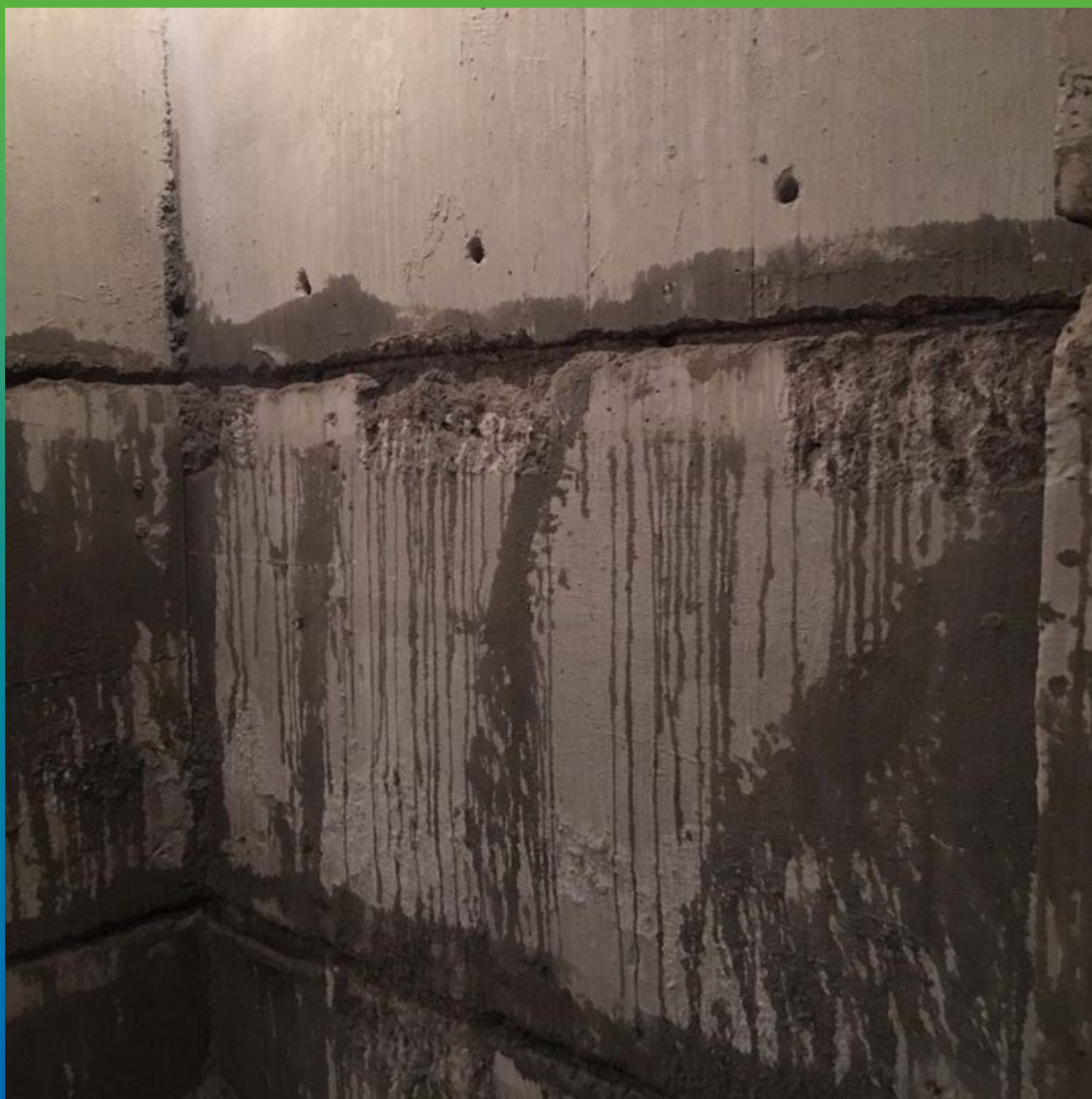
Увлажнение расшитых холодных швов