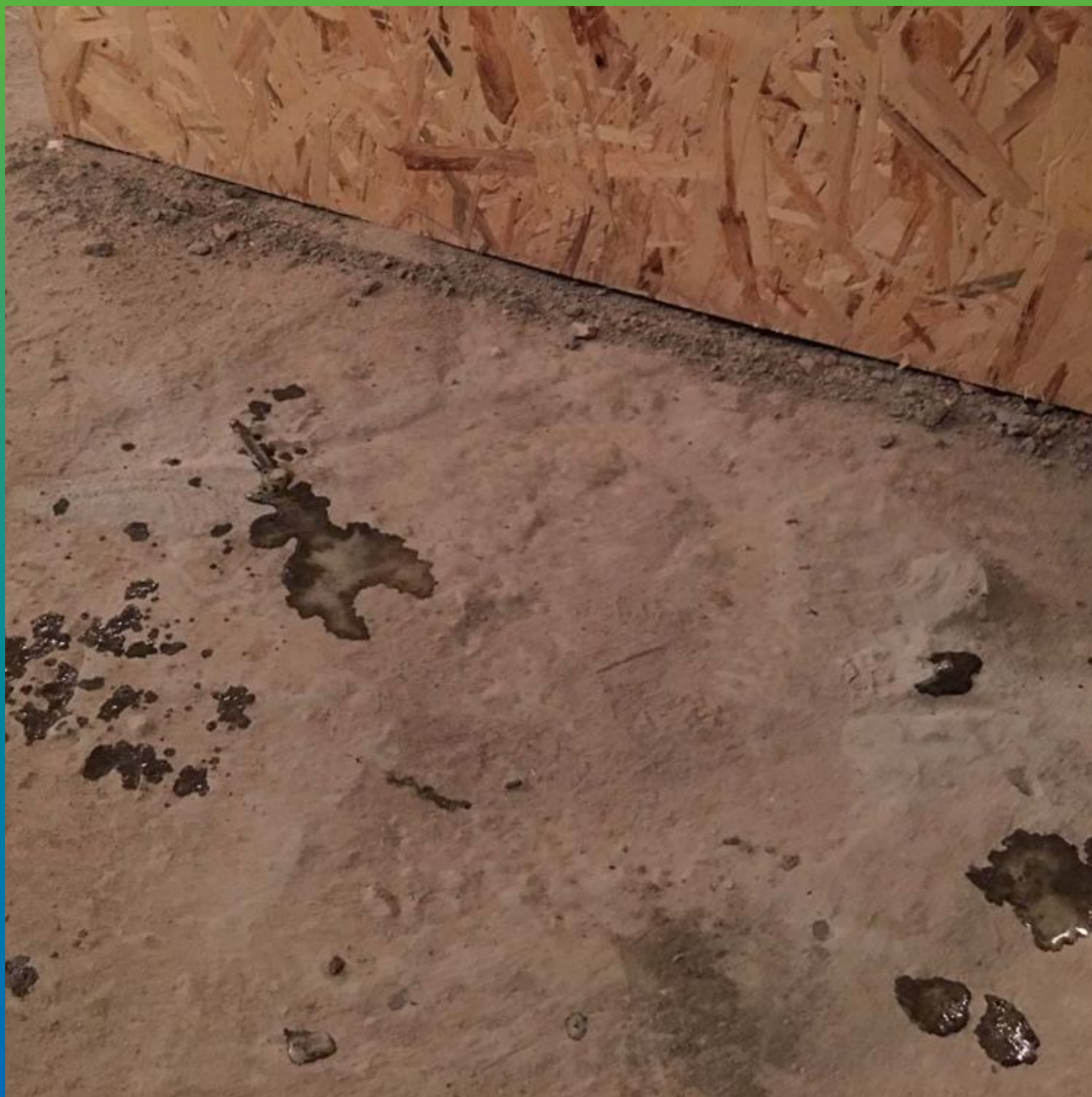
Проинъектированный шов между металлической сваей и фундаментной плитой