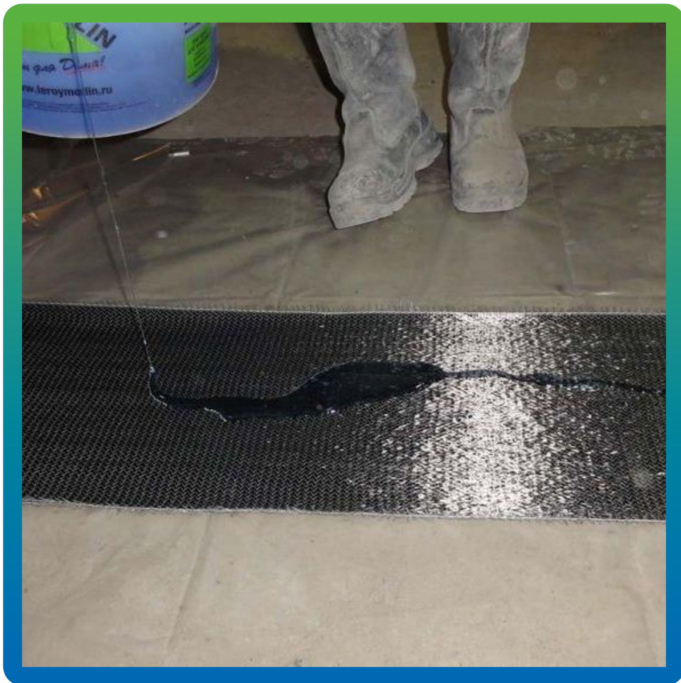
Пропитка холста Армошел мокрым методом