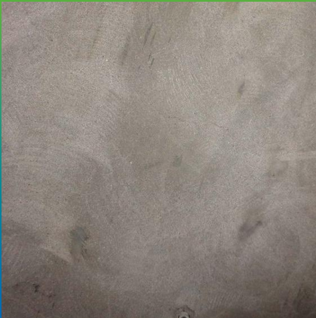
Вид поверхности после шлифования