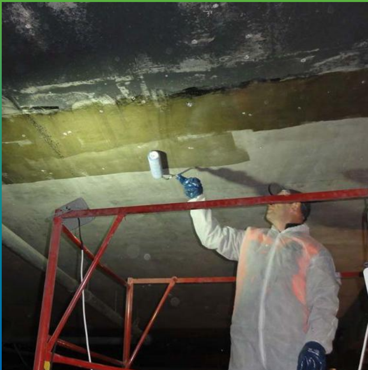
Грунтование поверхности материалом Манопокс 372