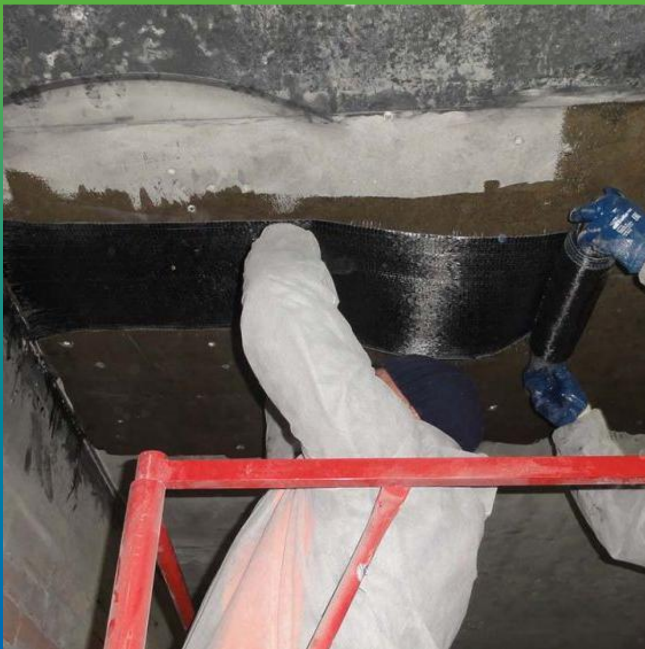
Монтаж холста Армошел к потолочной поверхности