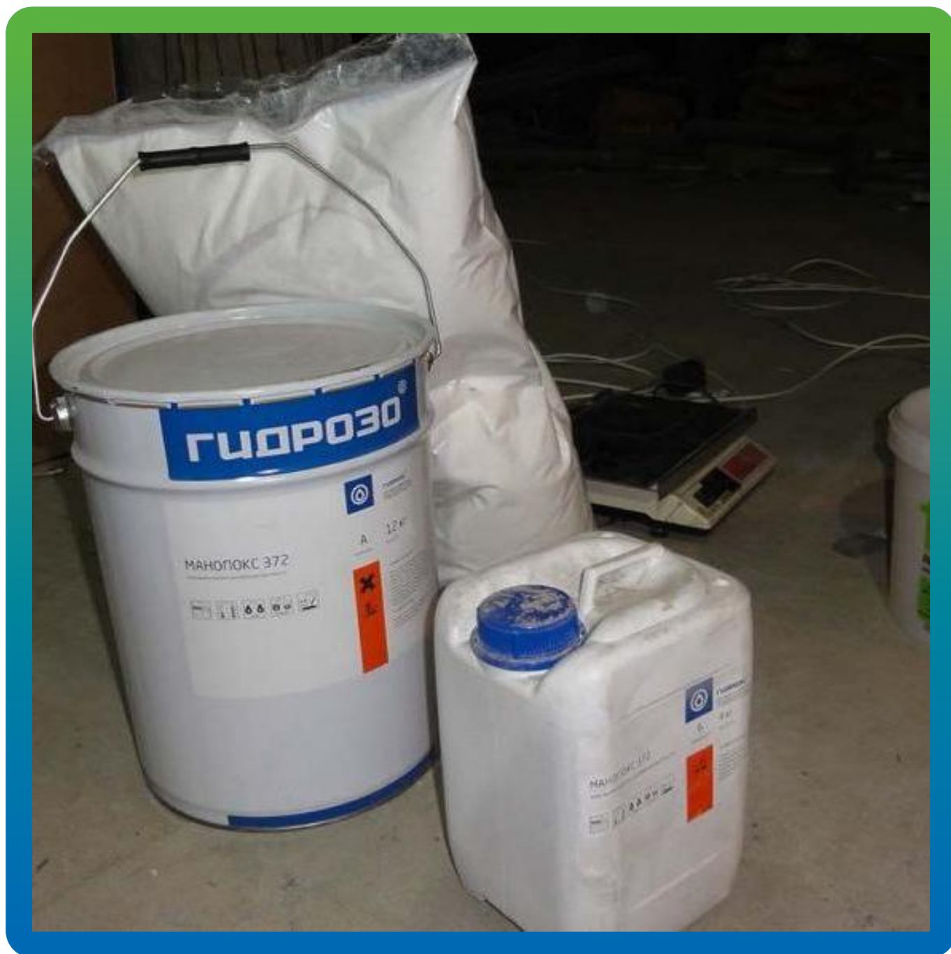
Материал перед началом монтажа