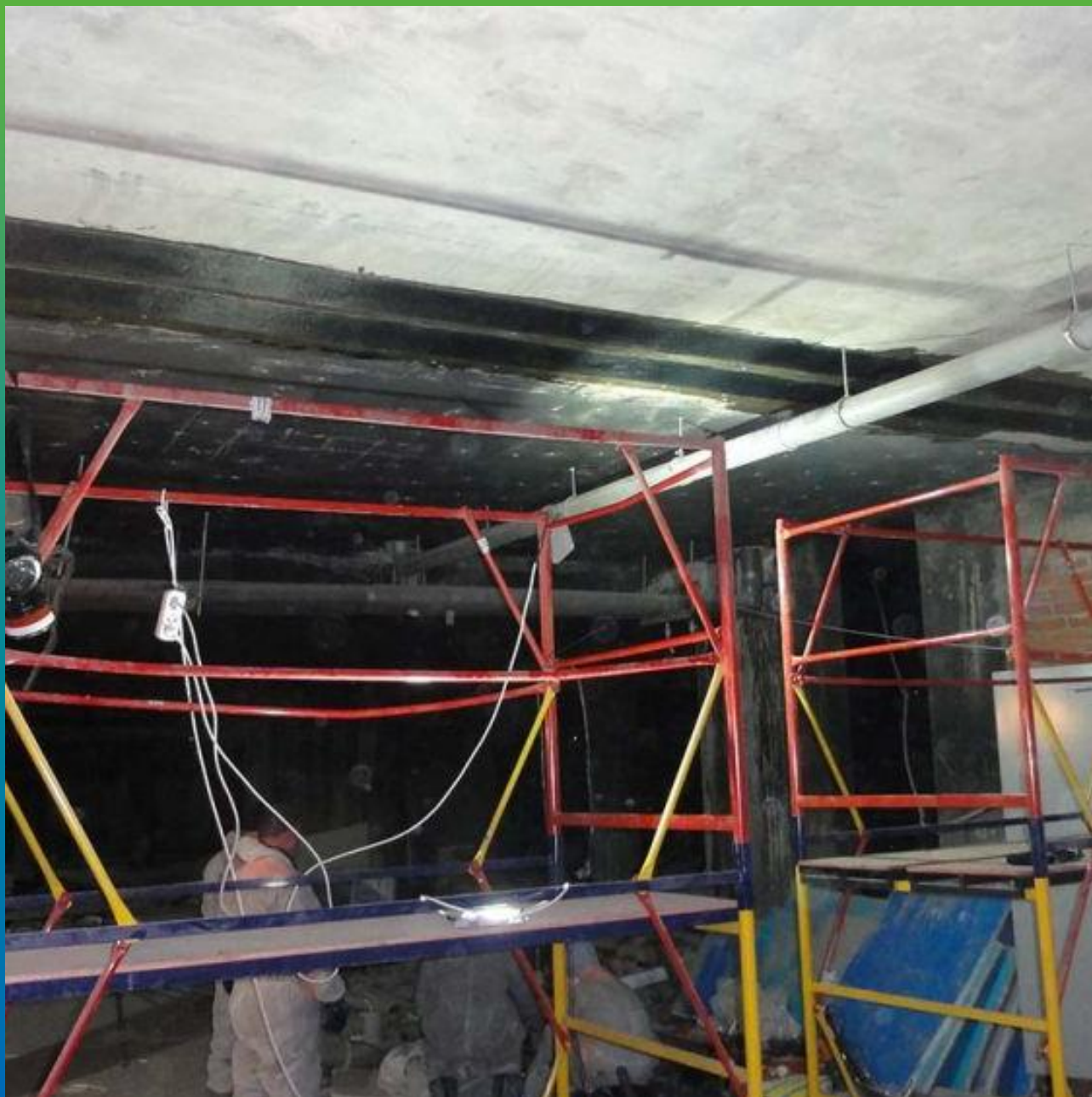
Вид потолочной поверхности после монтажа холста Армошел КВ 500