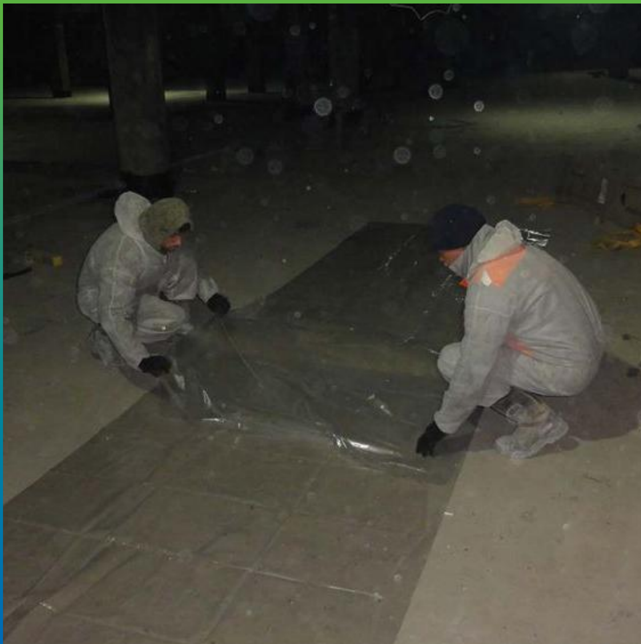
Организация рабочего места