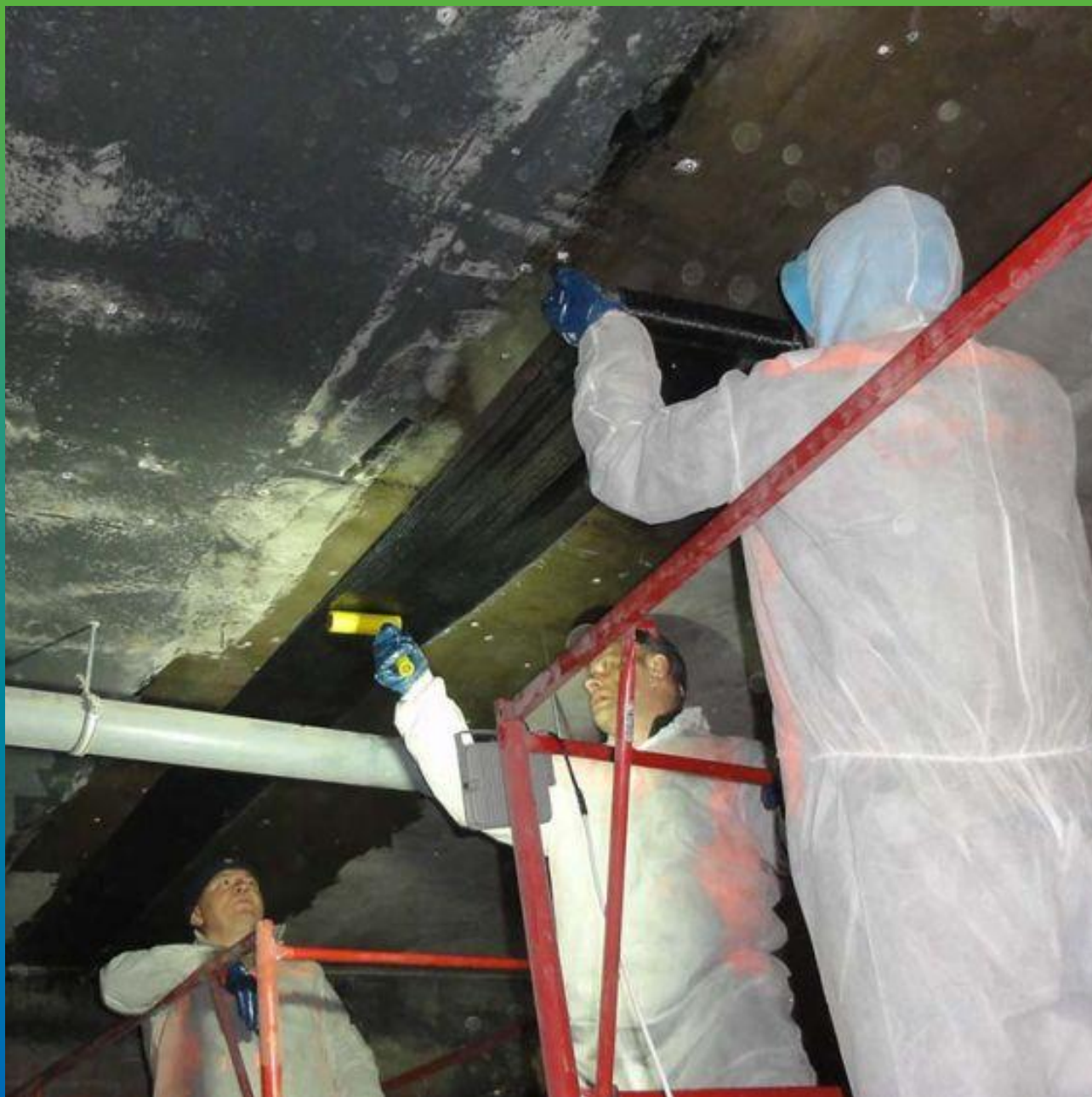
Монтаж холста Армошел к потолочной поверхности