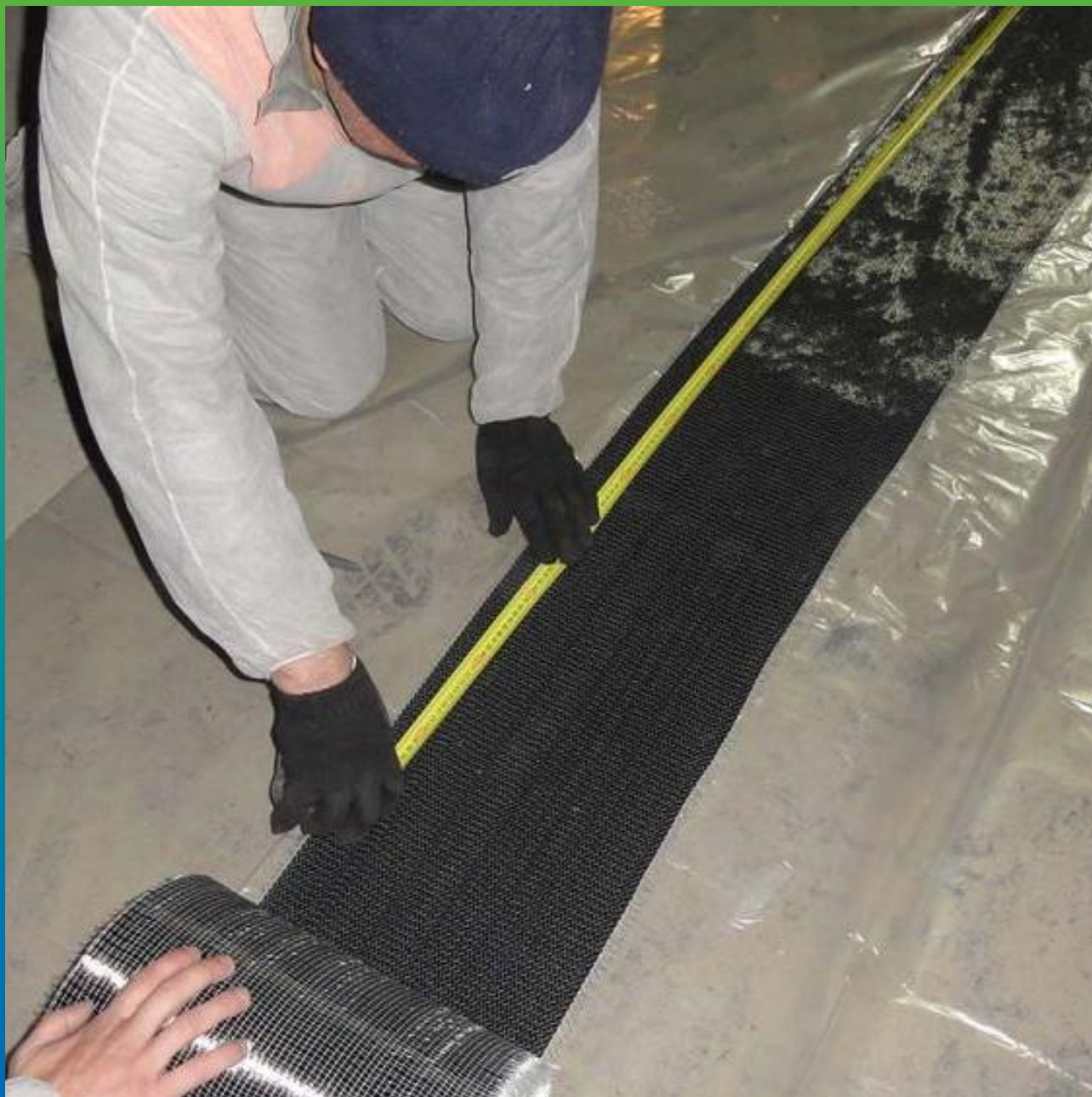
Раскраивание холста Армошел KB 500