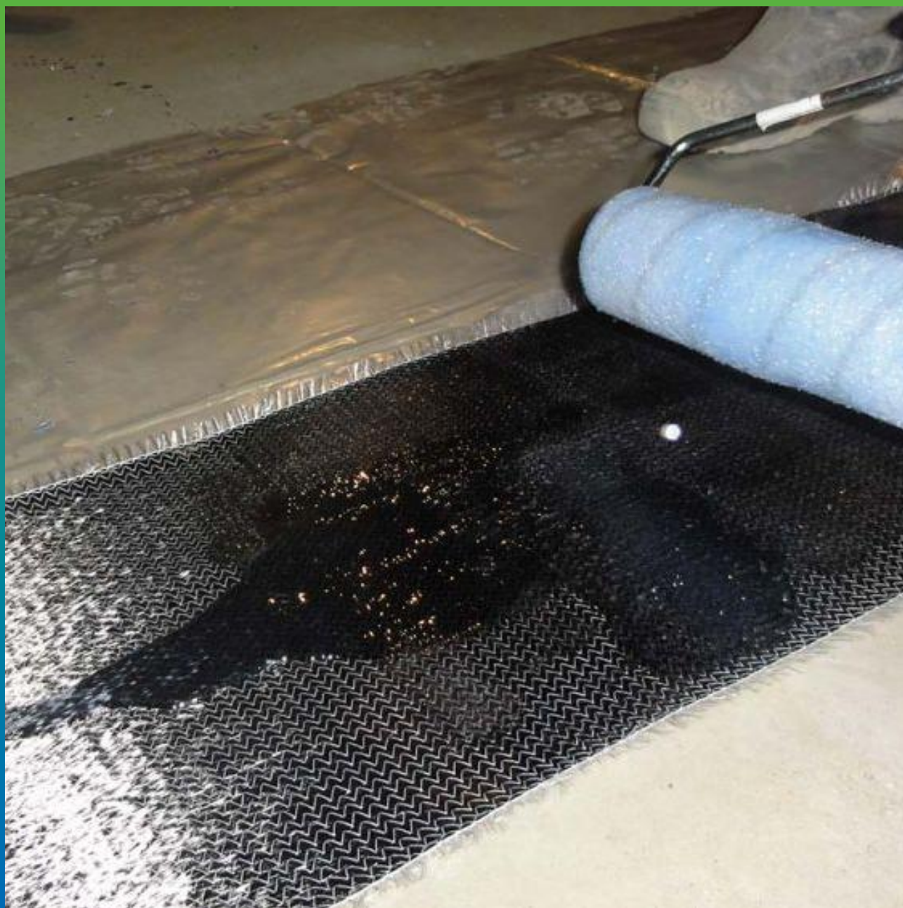
Пропитка холста Армошел адгезионным составом Манопокс 372