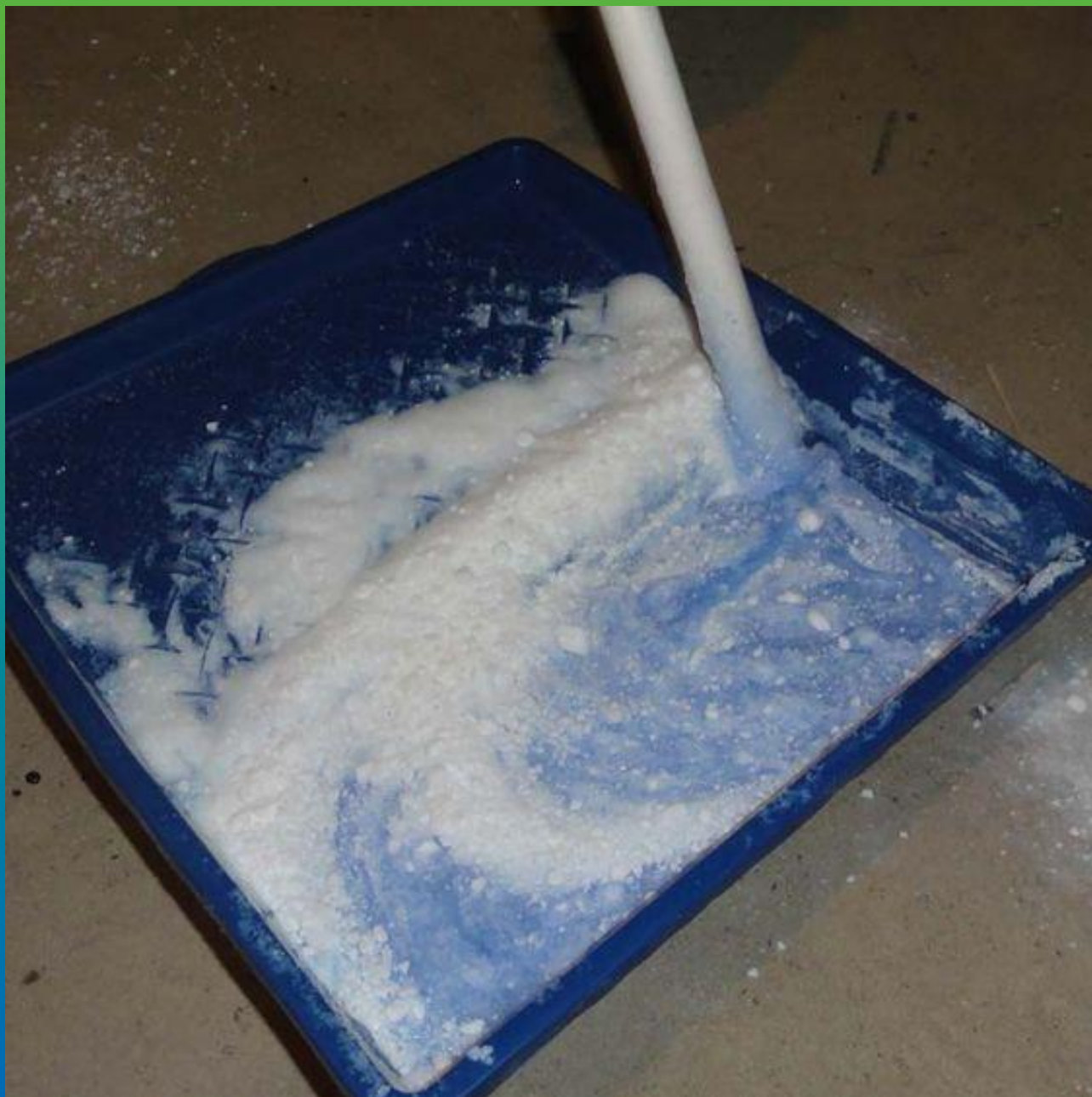
Приготовление адгезионного состава Манопокс 372 с добавлением Тайфо Тикс