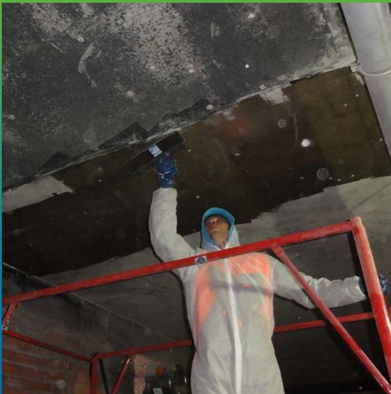
Нанесения Манопокс 372+Тайфо Тикс перед приклеиванием холста Армошел 500