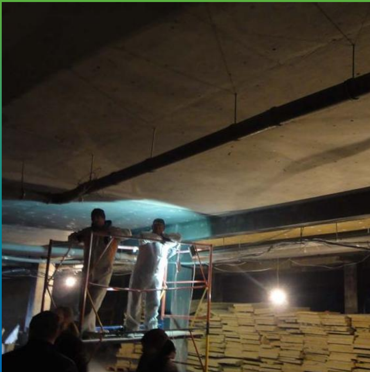
Вид объекта до проведения работ