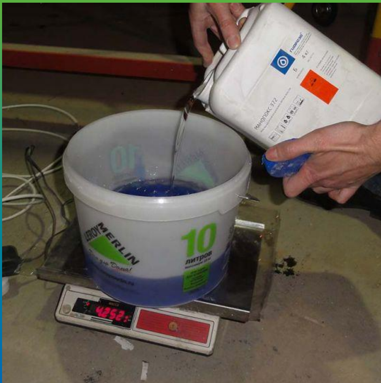
Приготовление материала Манопокс 372