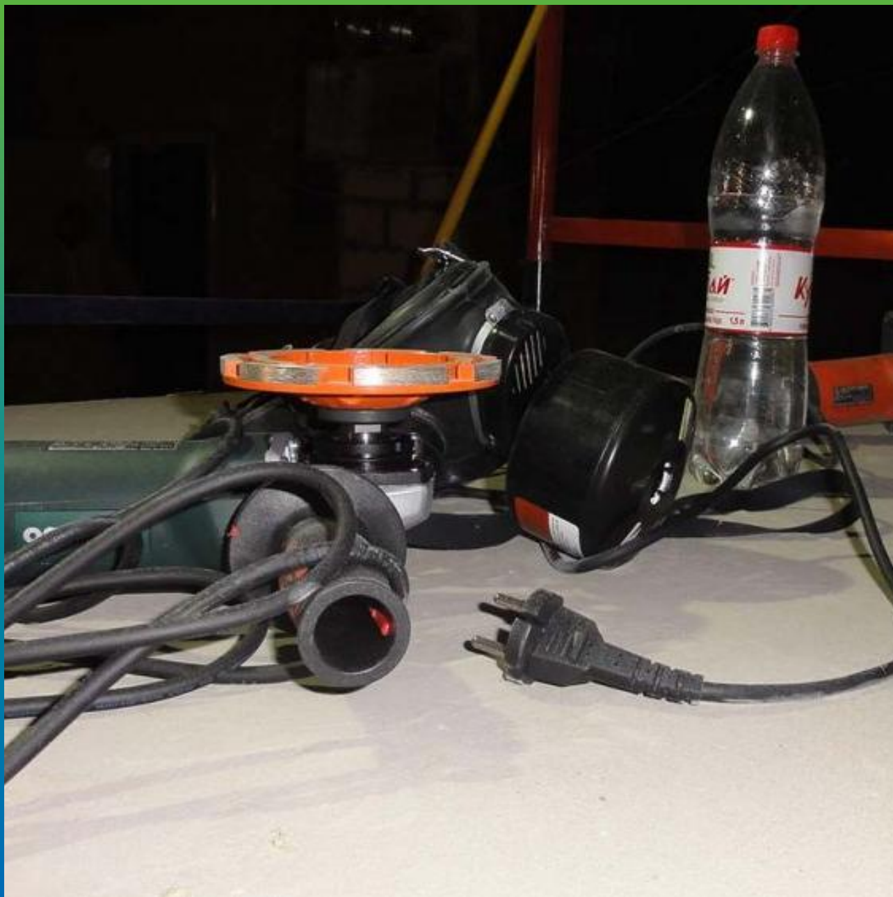
Оборудование для шлифования поверхности