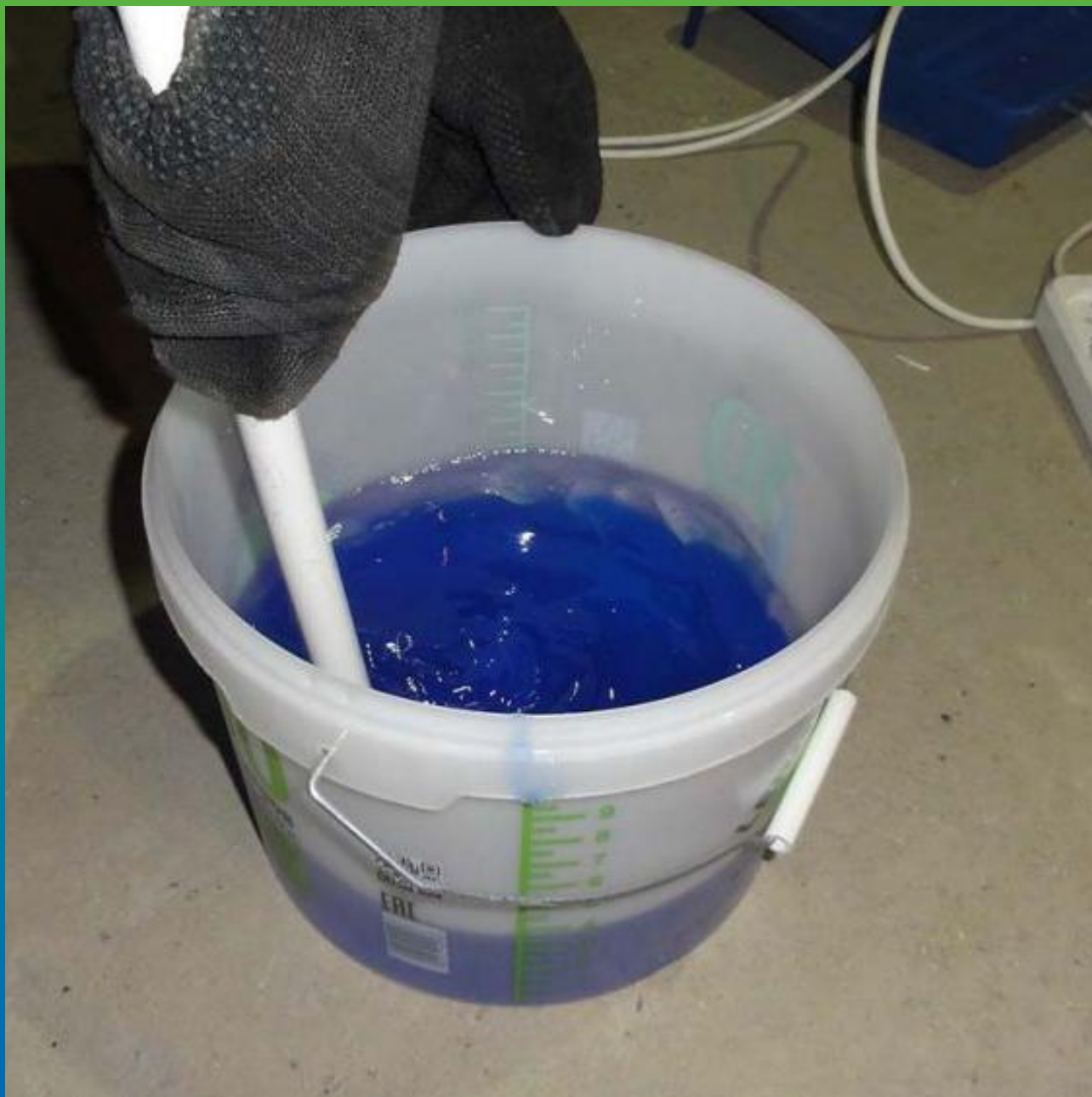
Приготовление материала Манопокс 372