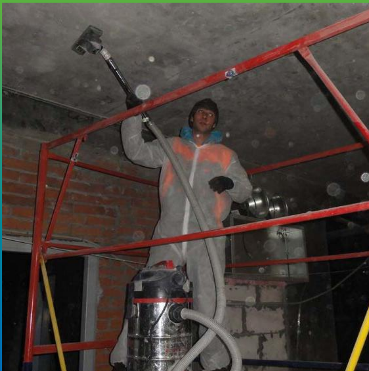
Удаление остаточной пыли с ремонтируемой поверхности