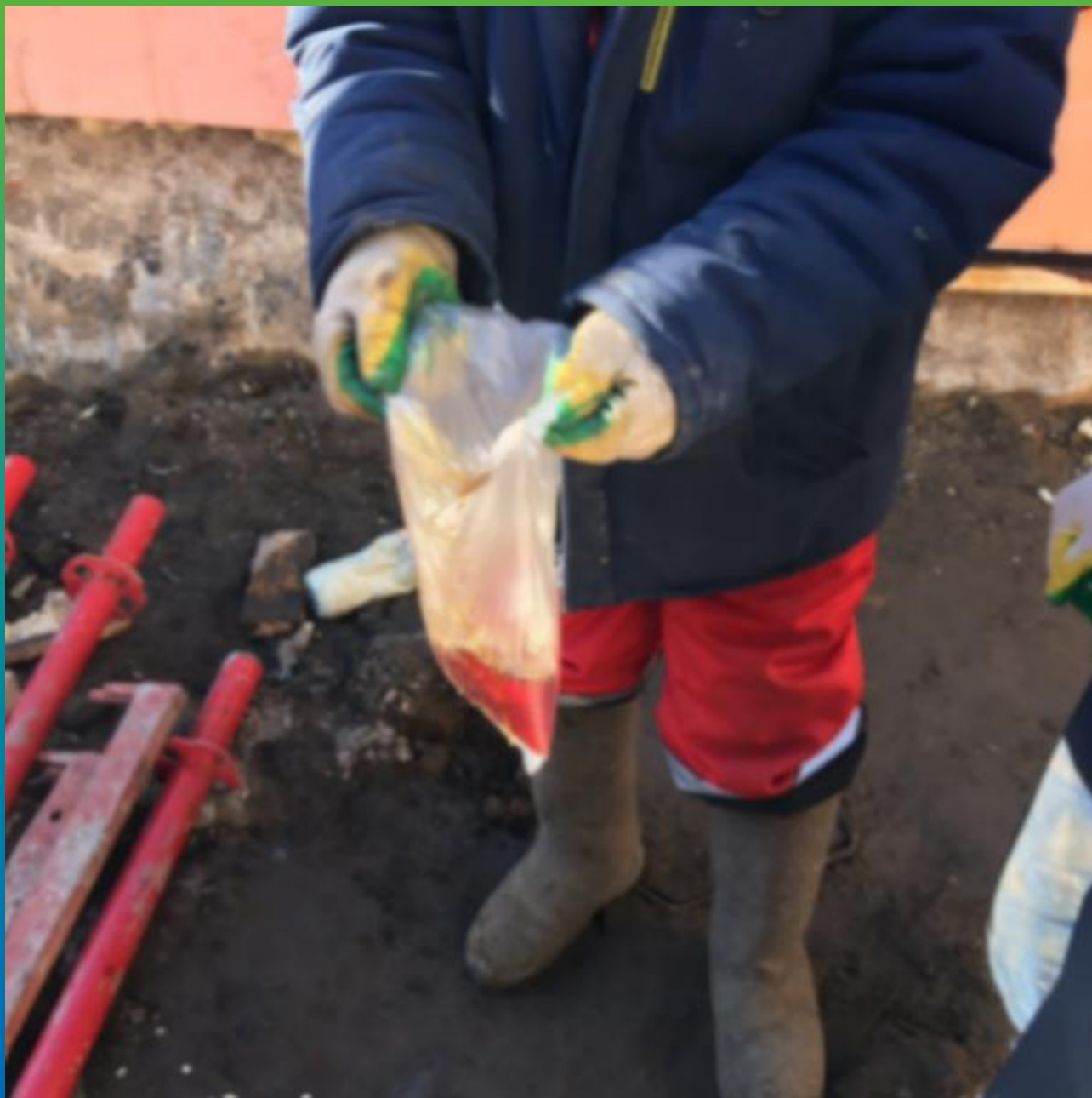
Смешивание смолы Манопур У Флекс с водой для образования пены