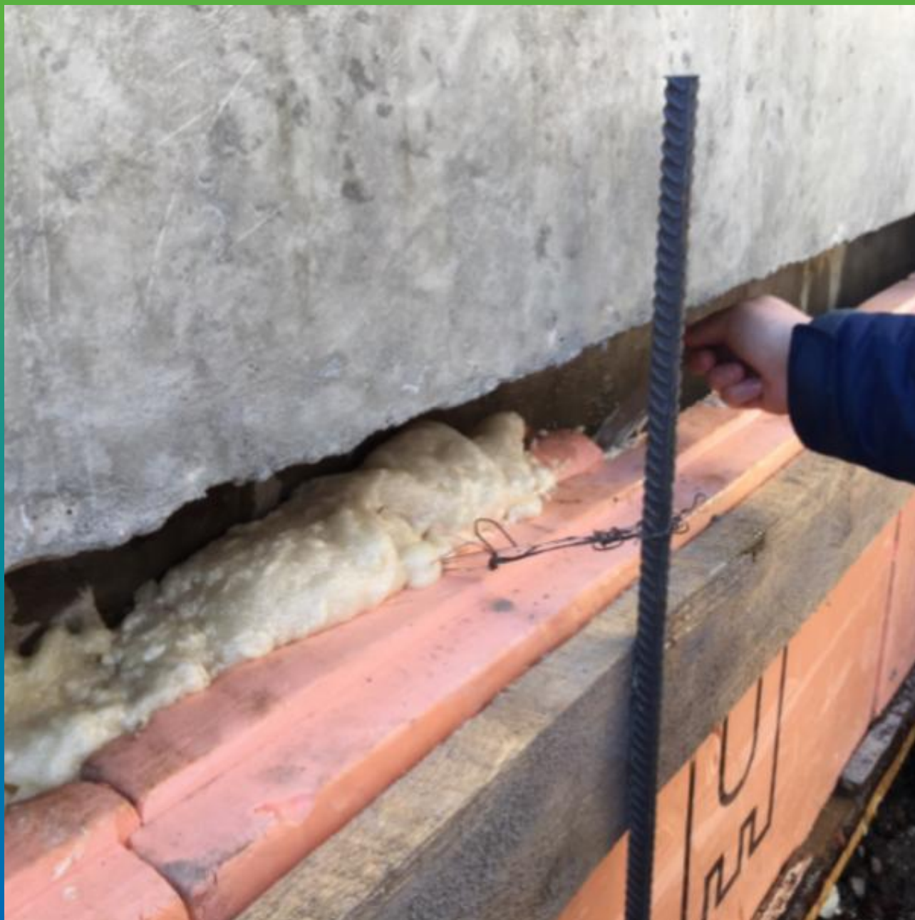
Пена Манопур У Флекс заполнившая шов