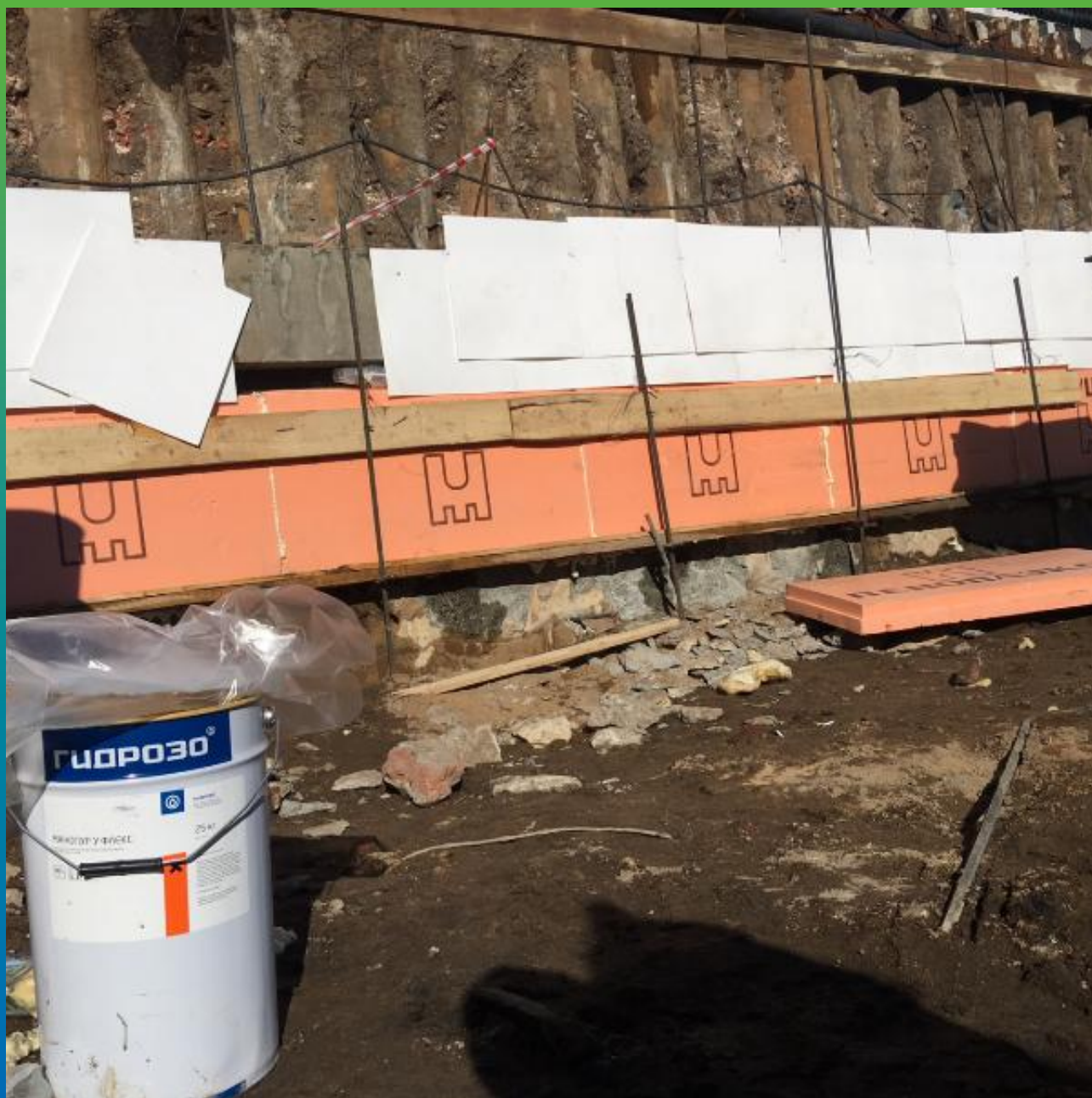
Материал Манопур У Флекс на объекте