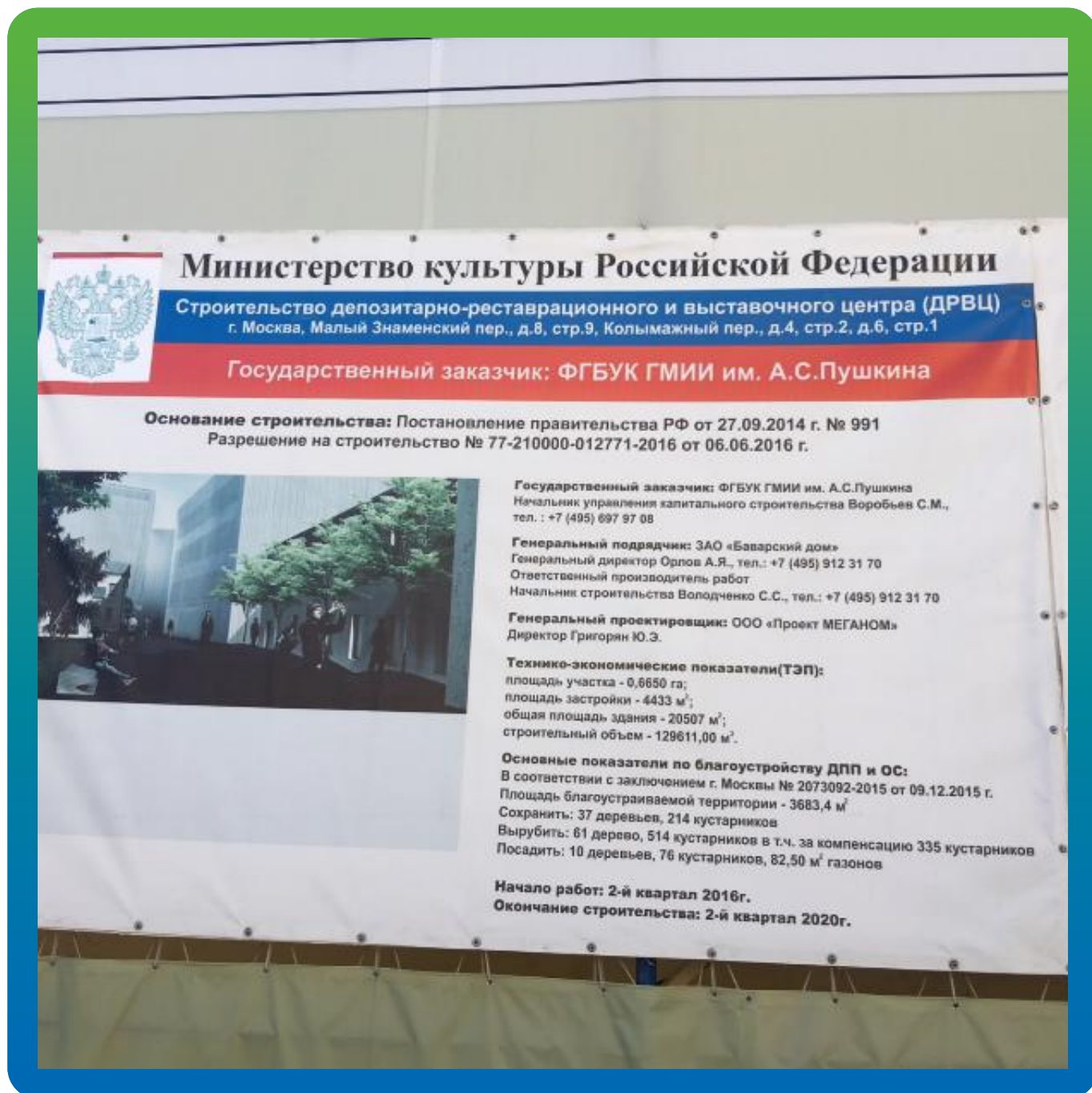
Информационный щит объекта