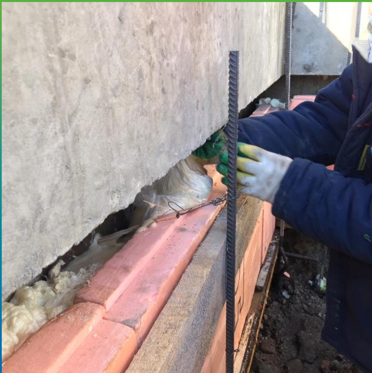
Подача Манопур У флекс между стеной в грунте и утеплителем