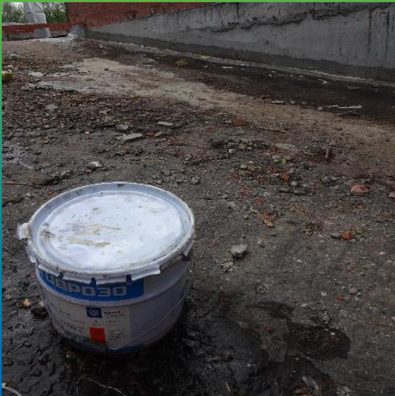
Вид объекта после проведения всех работ