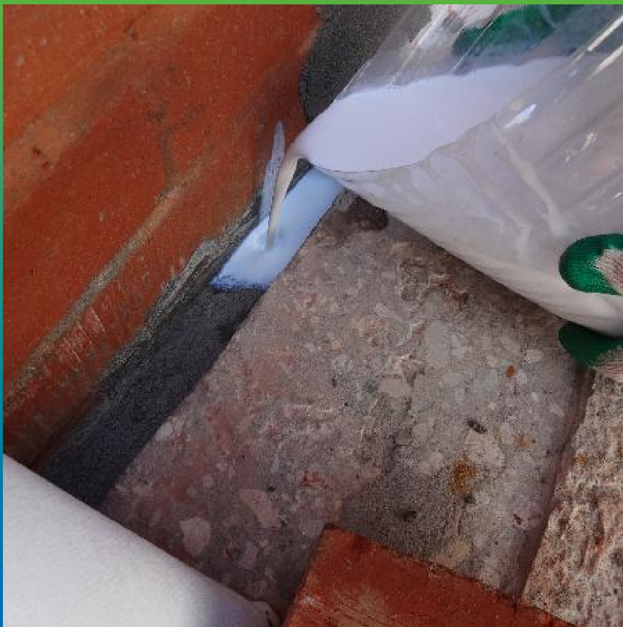
Гидроизоляция деформационного шва