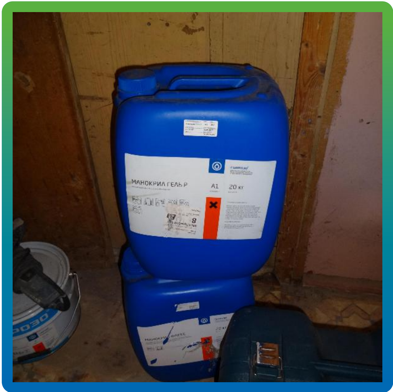
Материалы Гидрозо на объекте