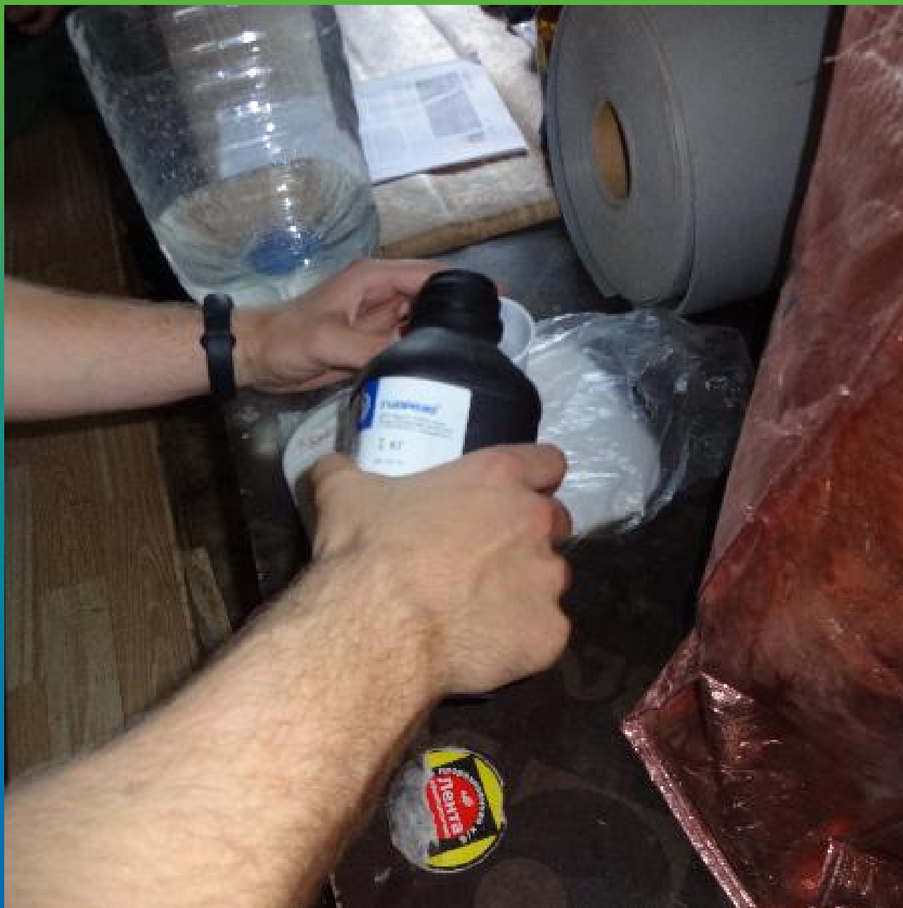
Затворение компонентов гидроактивного эластичного состава Манокрил Гель Р