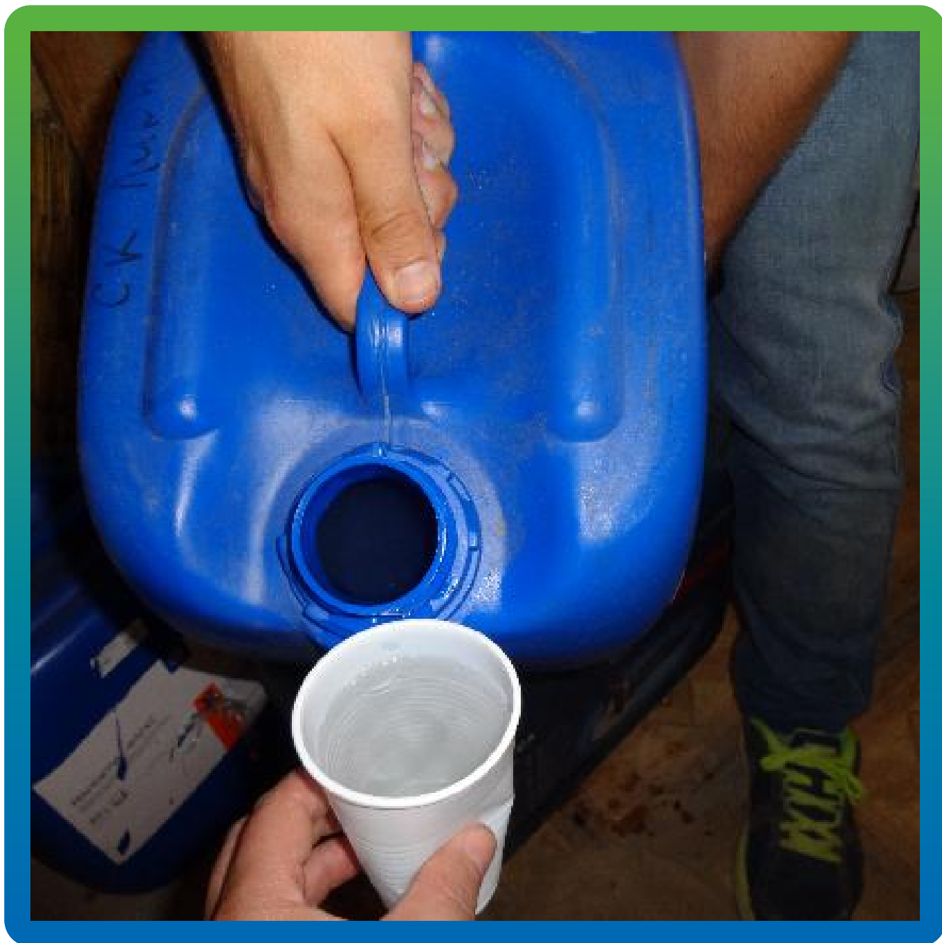
Затворение компонентов гидроактивного эластичного состава Манокрил Гель Р