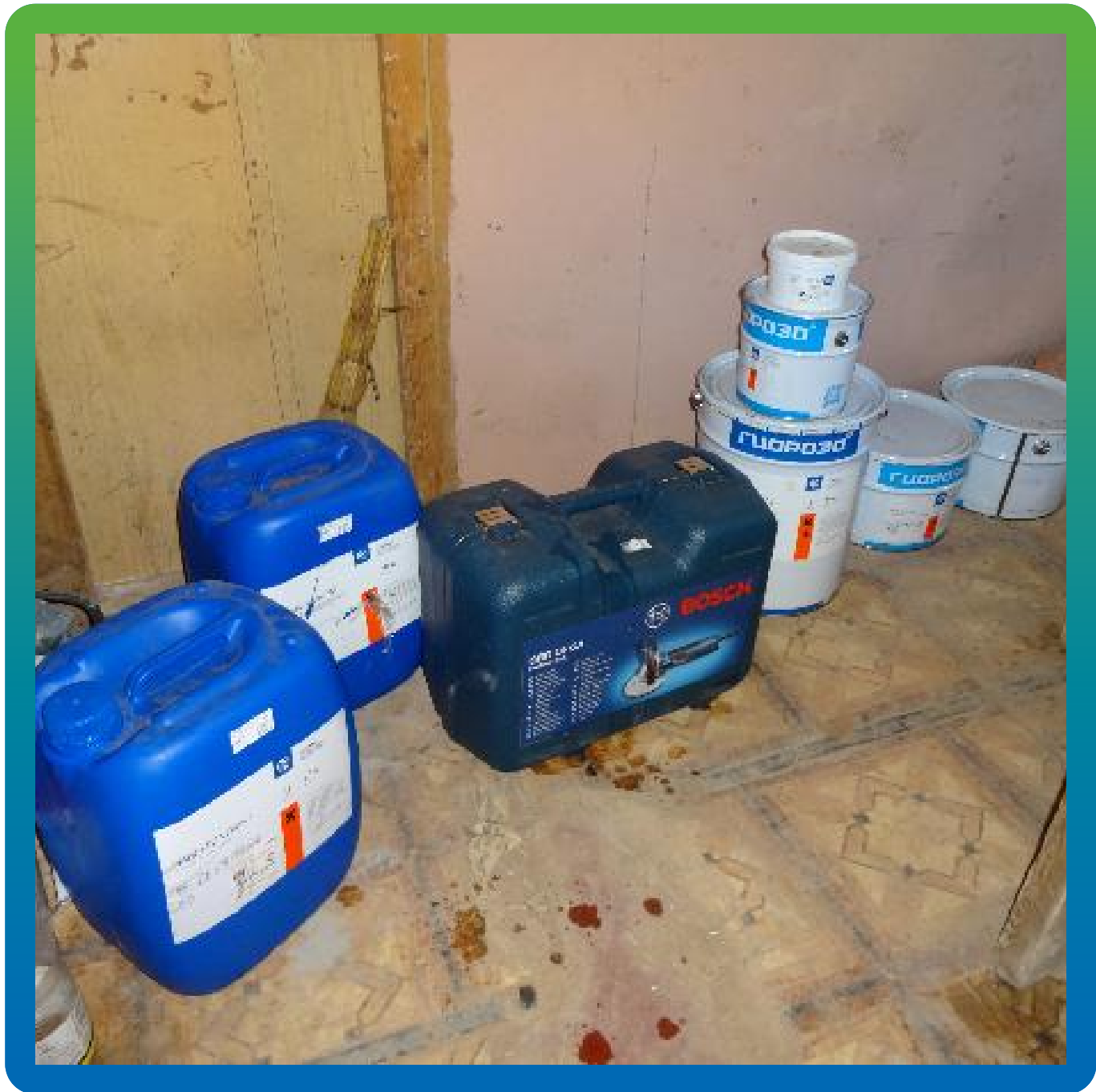
Материалы Гидрозо на объекте