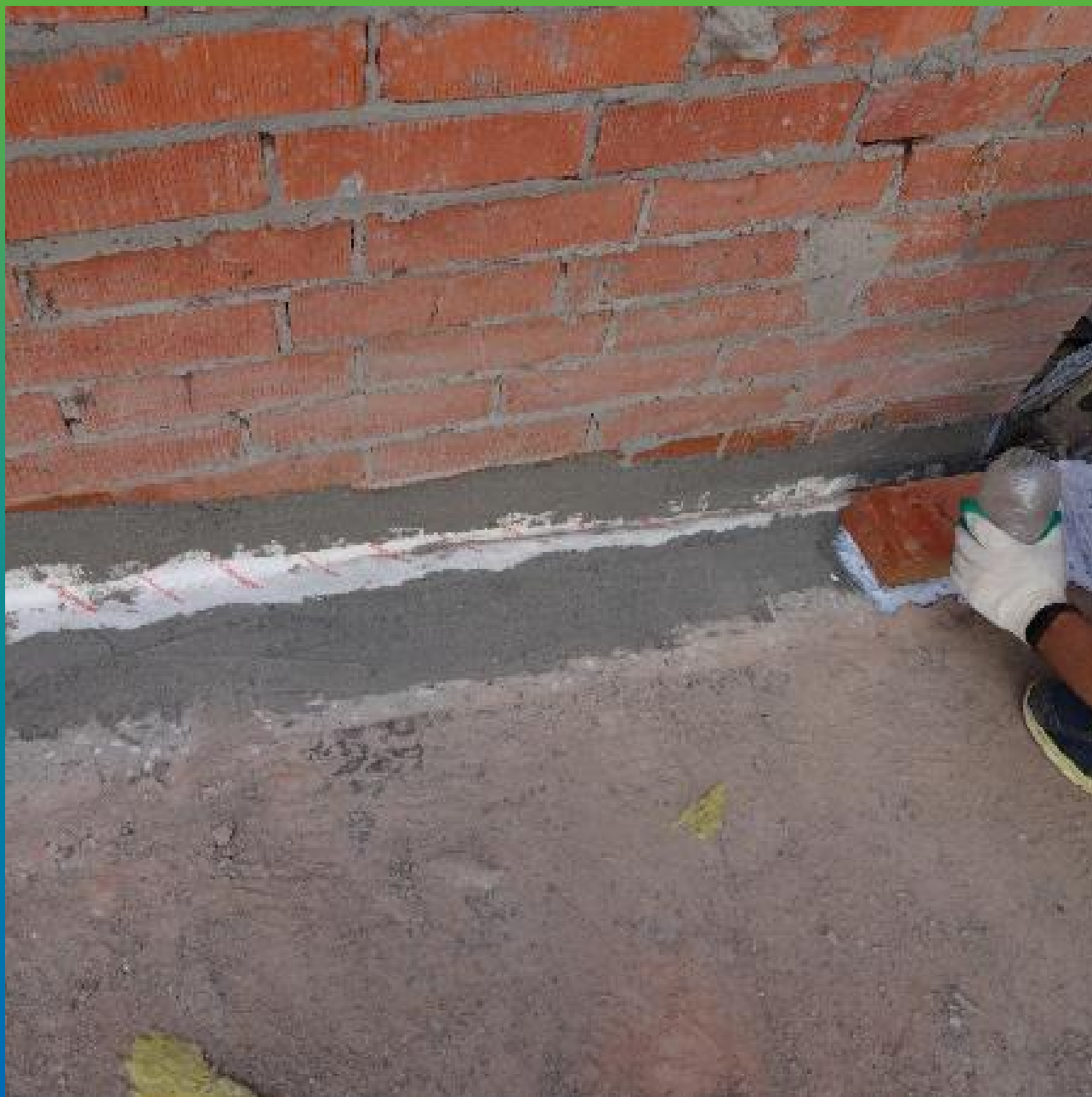
Монтаж эластичной ленты на клей Манопокс 331