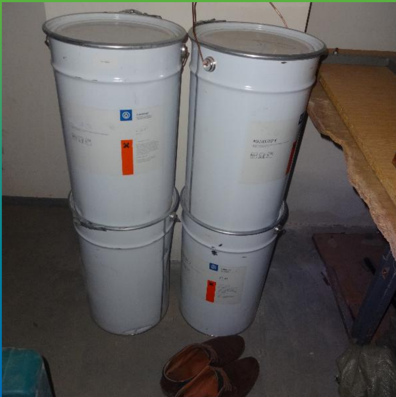
Материалы Гидрозо на объекте