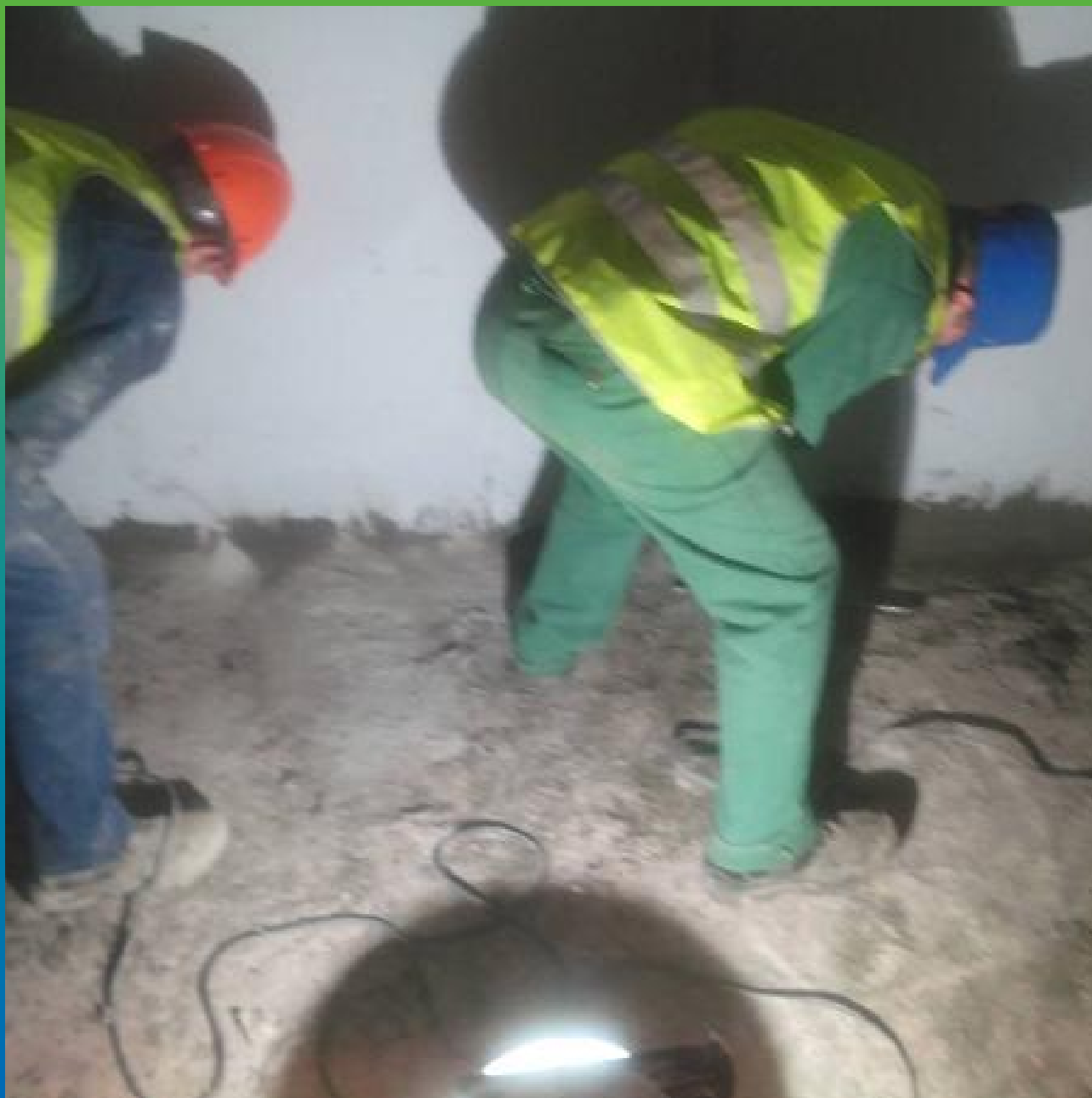
Установка пакеров в пробуренные шпуры