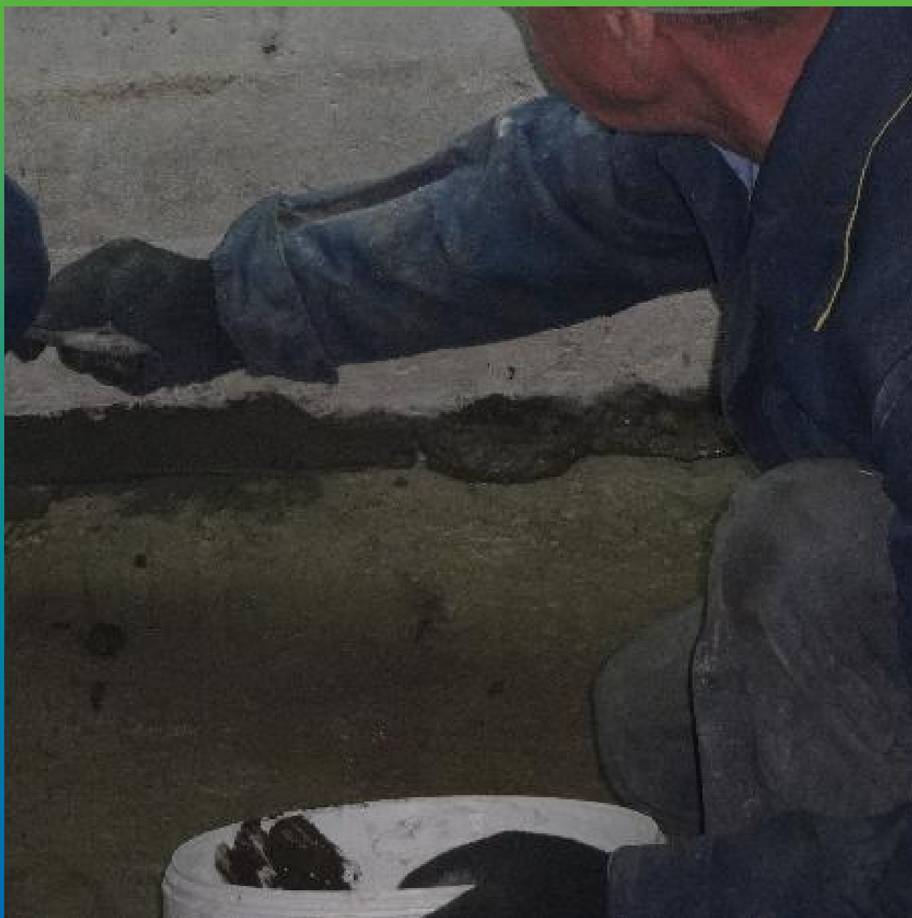
Формирование галтели по примыканиям гидравлическим составом Стармекс Плаг