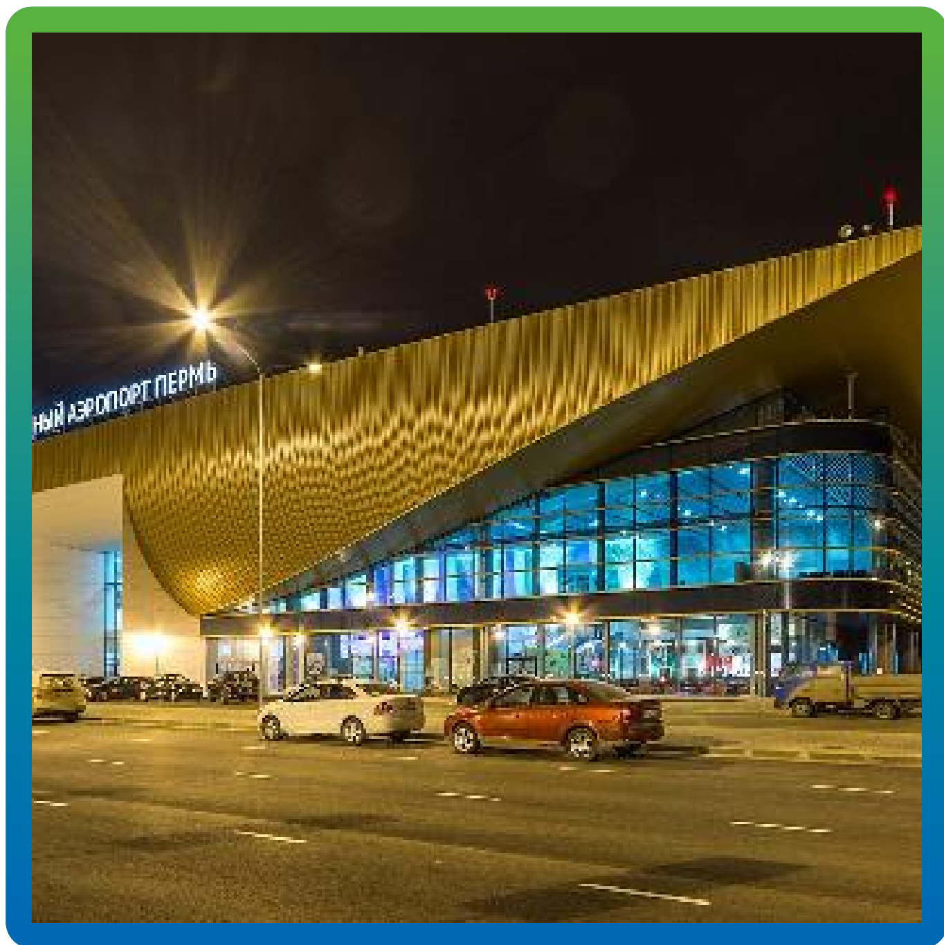
Вид объекта после ввода в эксплуатацию