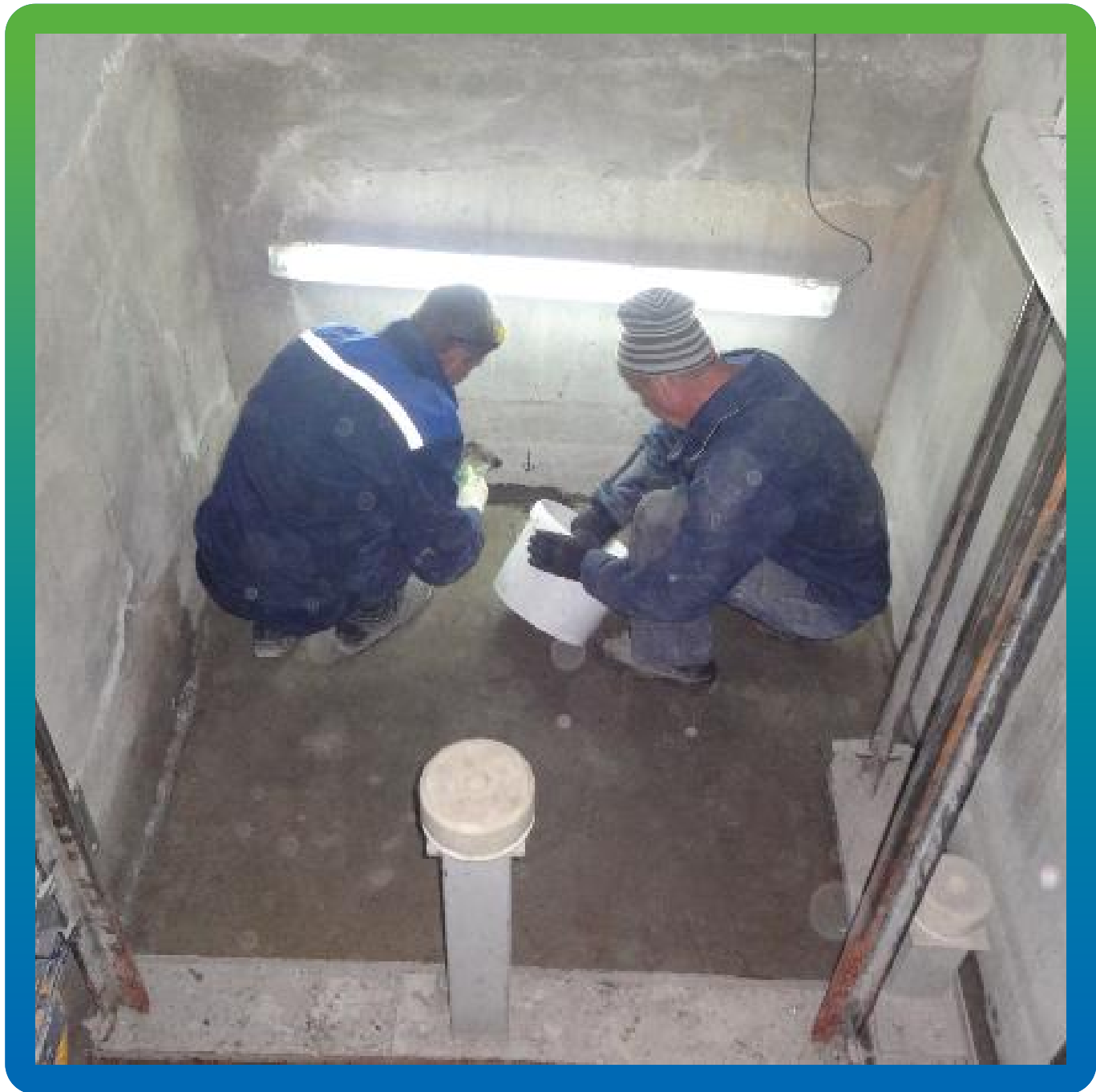
Устранение протечек гидропломбой Стармекс Плаг