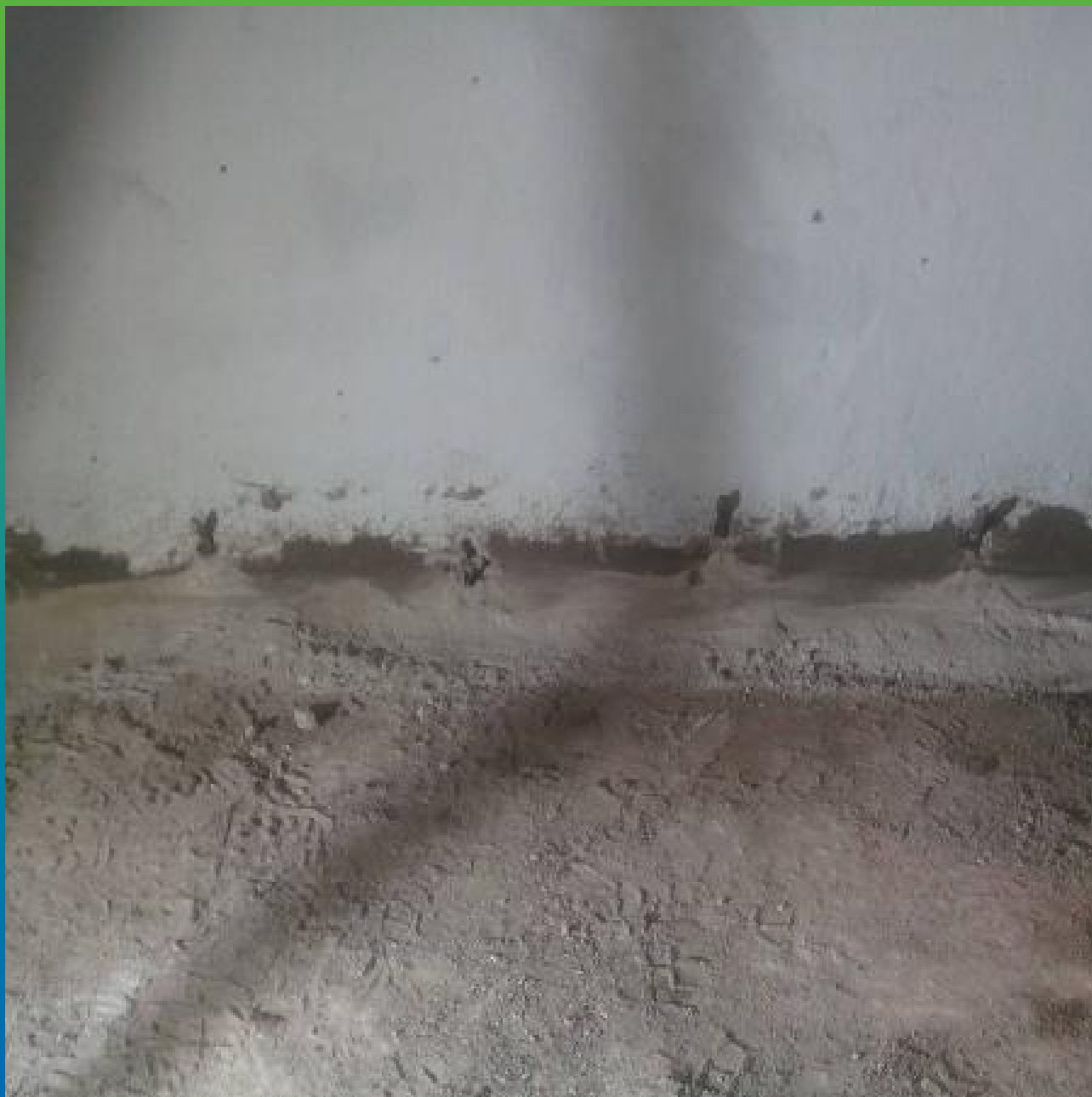
Установка пакеров в пробуренные шпур