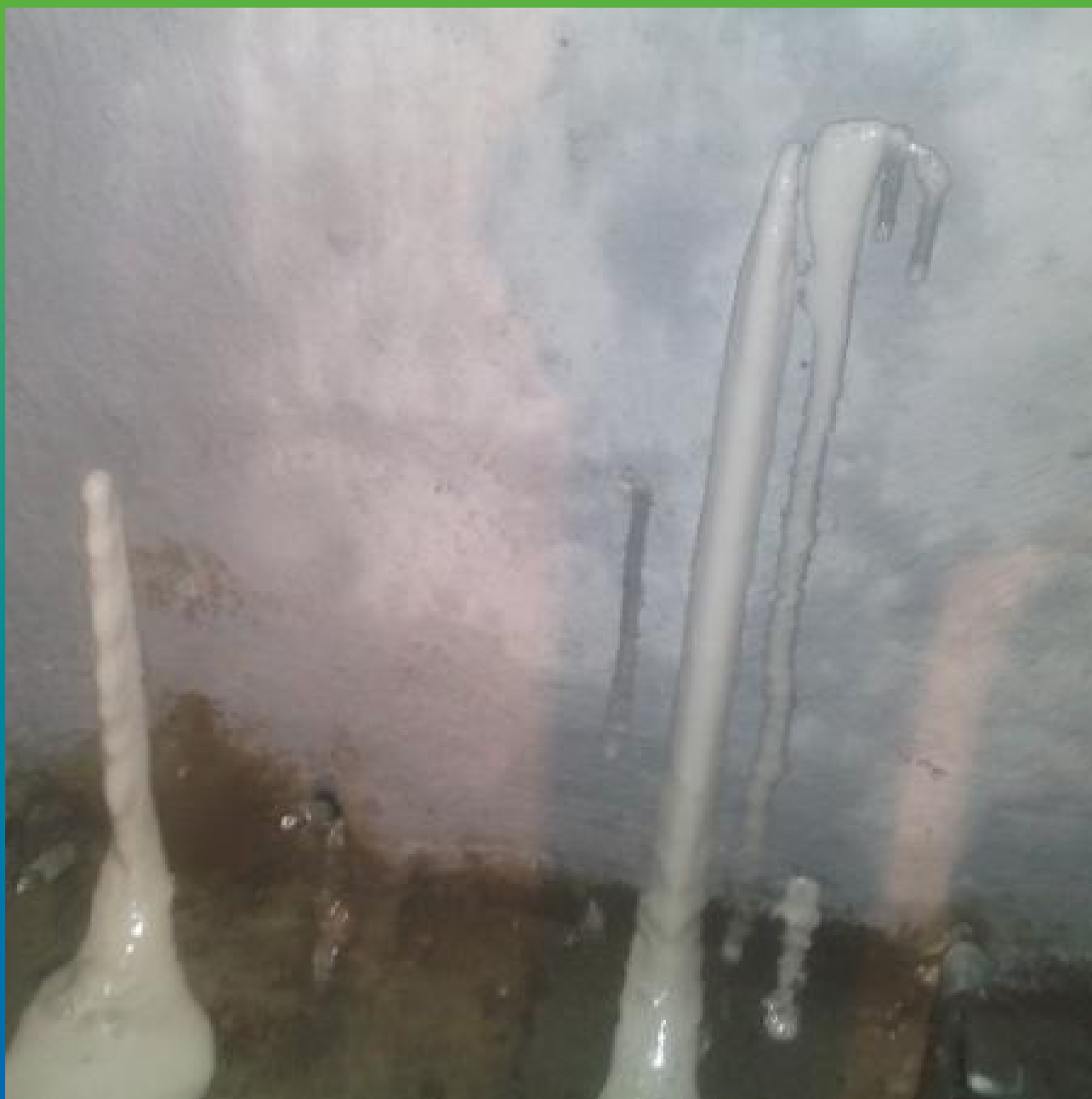
Инъектирование 1К гидроактивной полиуретановой смолой Манопур У