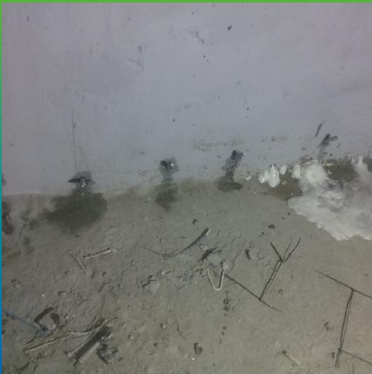
Инъектирование 1К гидроактивной полиуретановой смолой Манопур У