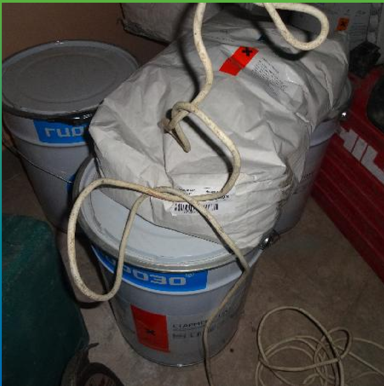
Материалы Гидрозо на объекте