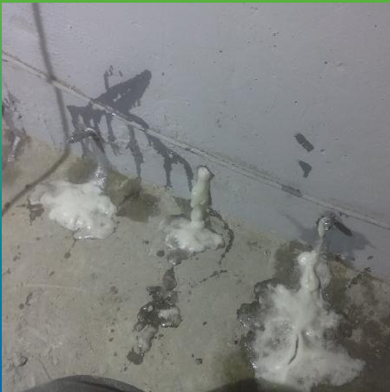
Инъектирование 1К гидроактивной полиуретановой смолой Манопур У