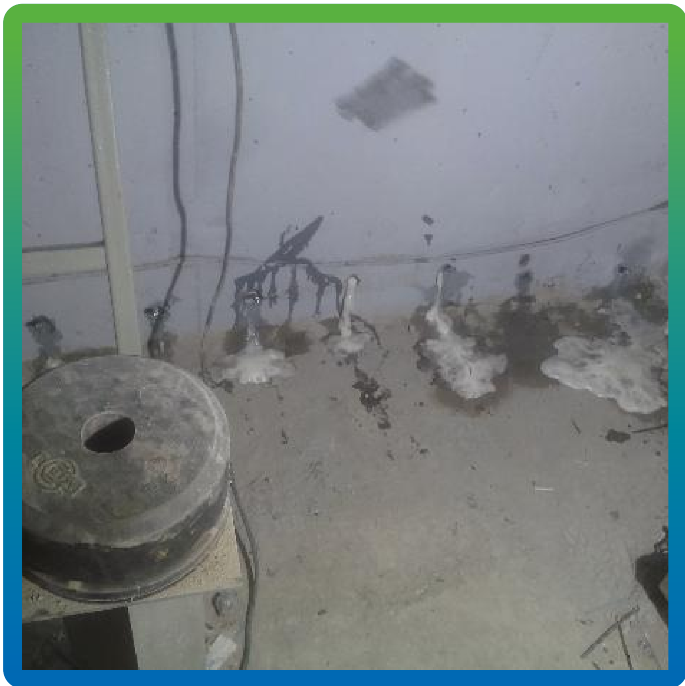
Инъектирование 1К гидроактивной полиуретановой смолой Манопур У