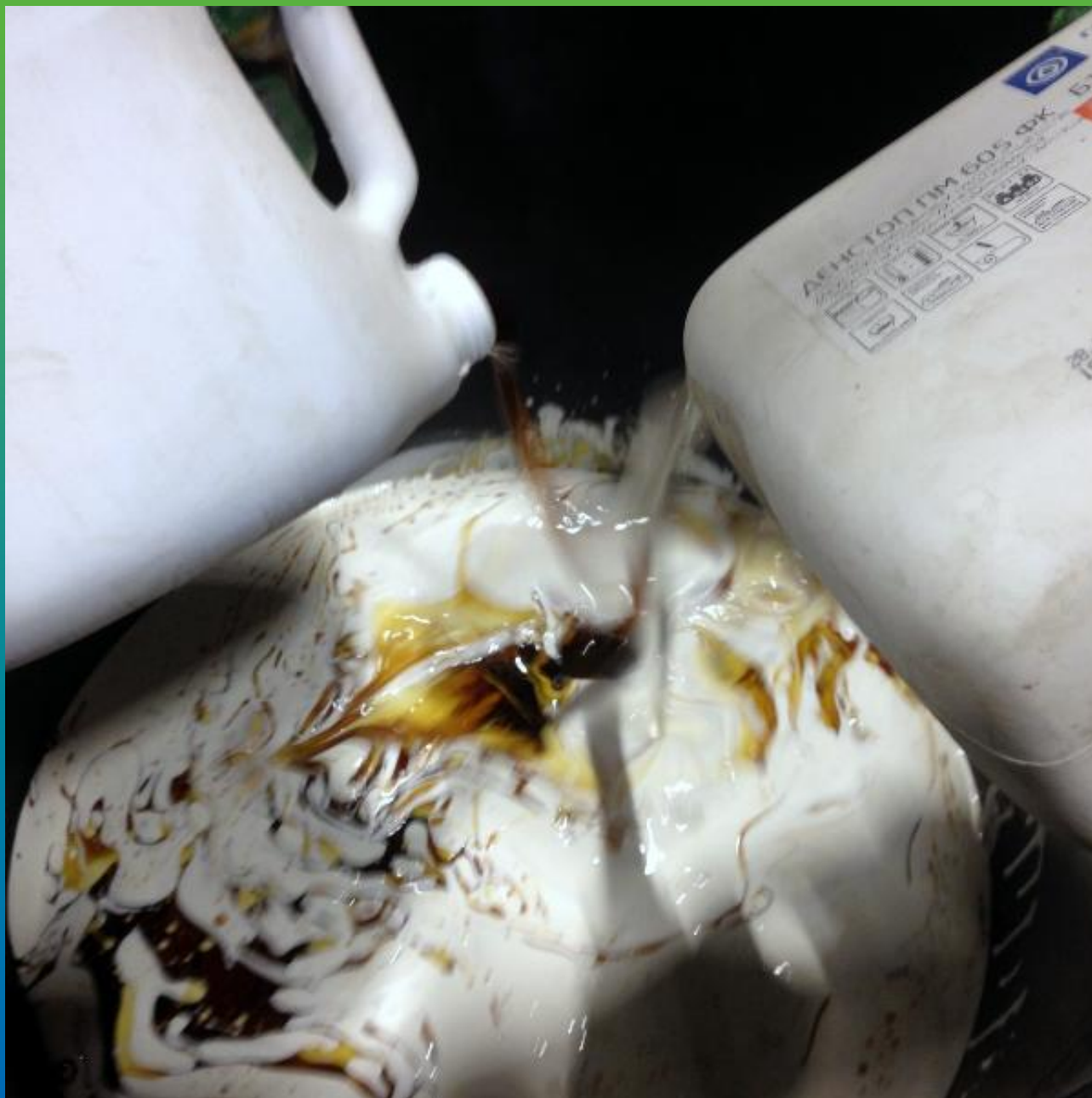
Смешение жидких компонентов Б1+Б2 Денстоп ПМ 605ФК - тиксотропной версии ЦПУ