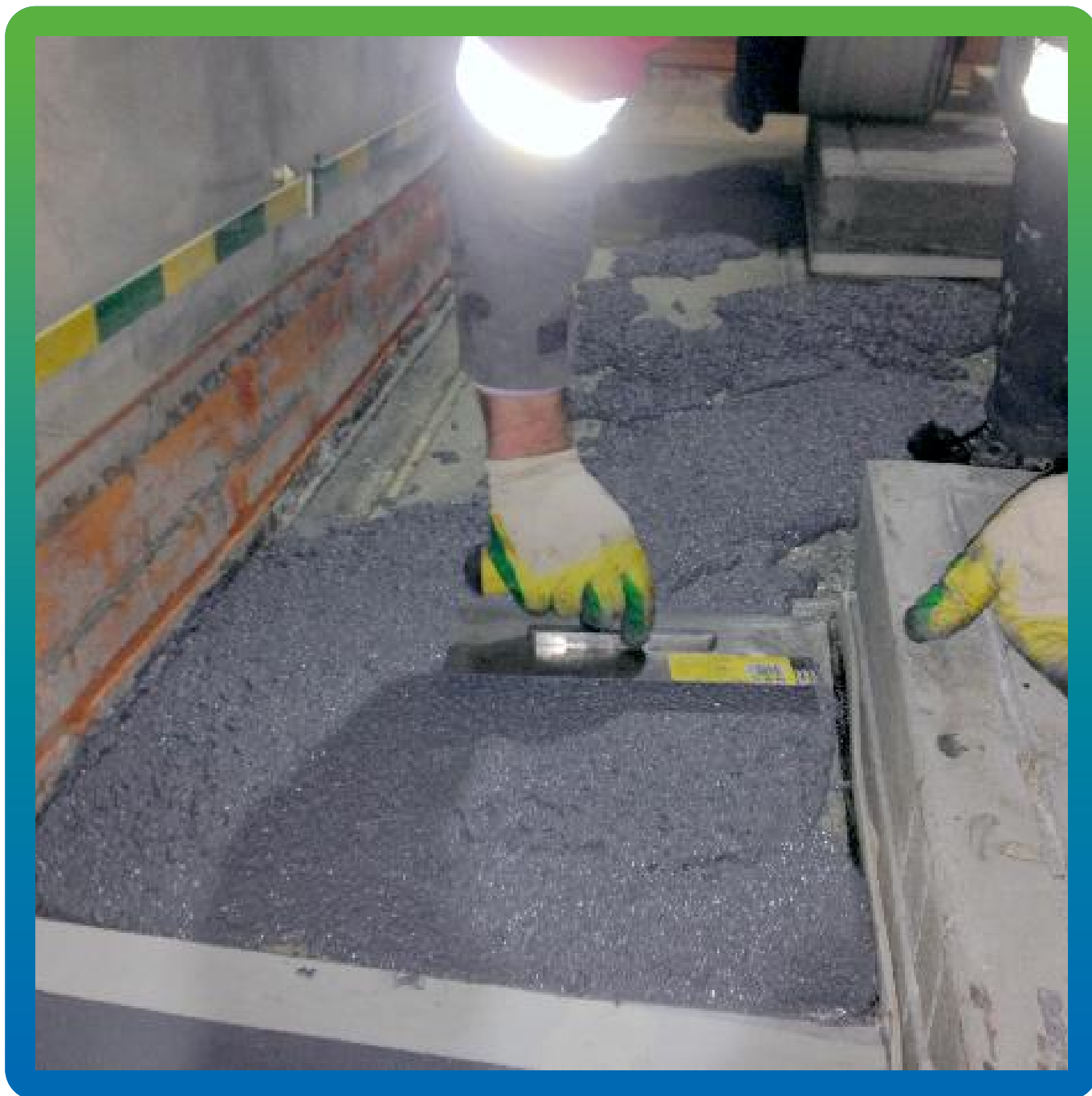
Распределение смеси Денстоп ПМ 605 Тровел по участку.