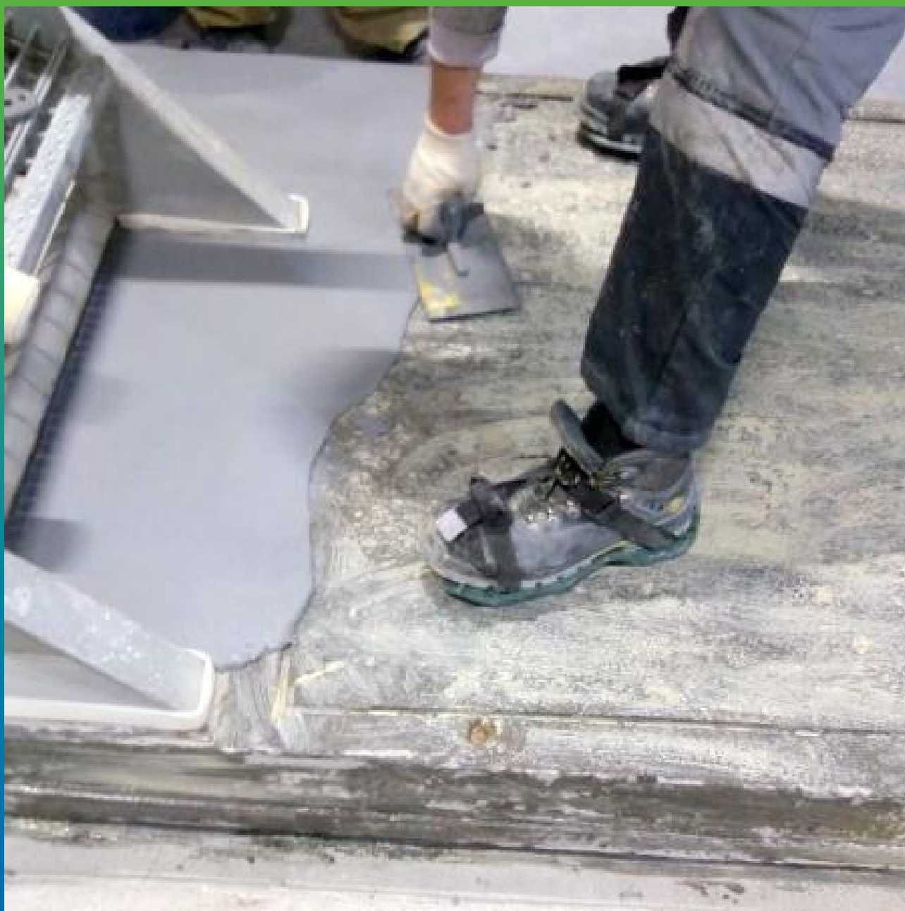
Нанесение смеси Денстоп ПМ 605ФК на сложные горизонтальные участки