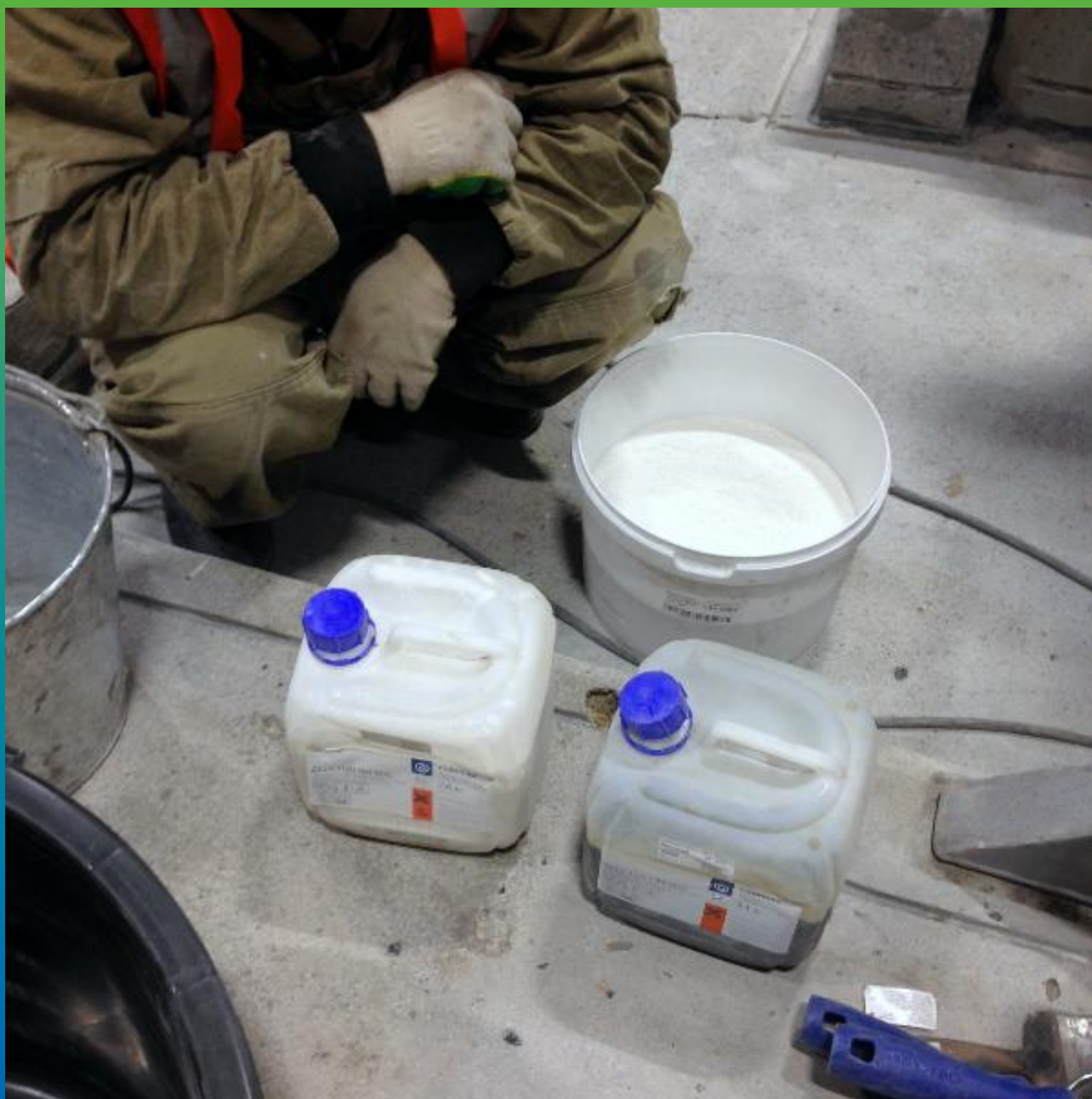
Подготовка компонентов А+Б1+Б2 грунтовки ДенТоп ПМ 600