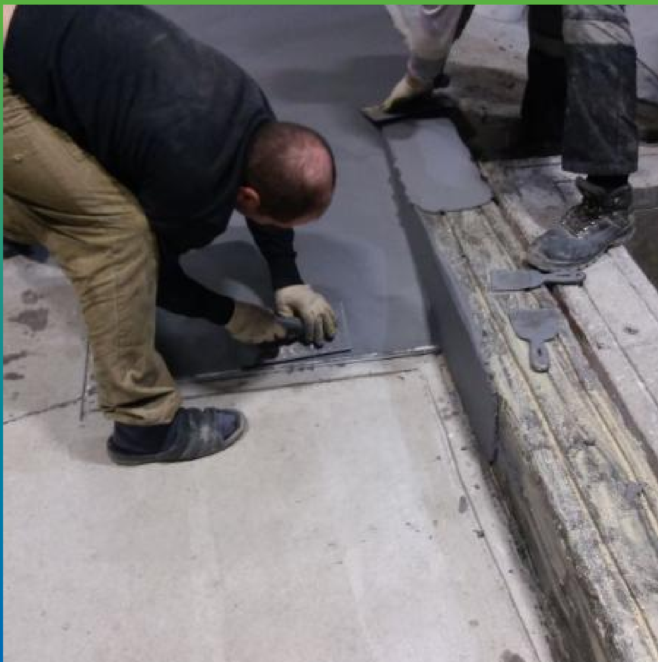
Нанесение смеси Денстоп ПМ 605ФК на пандусы и бортики