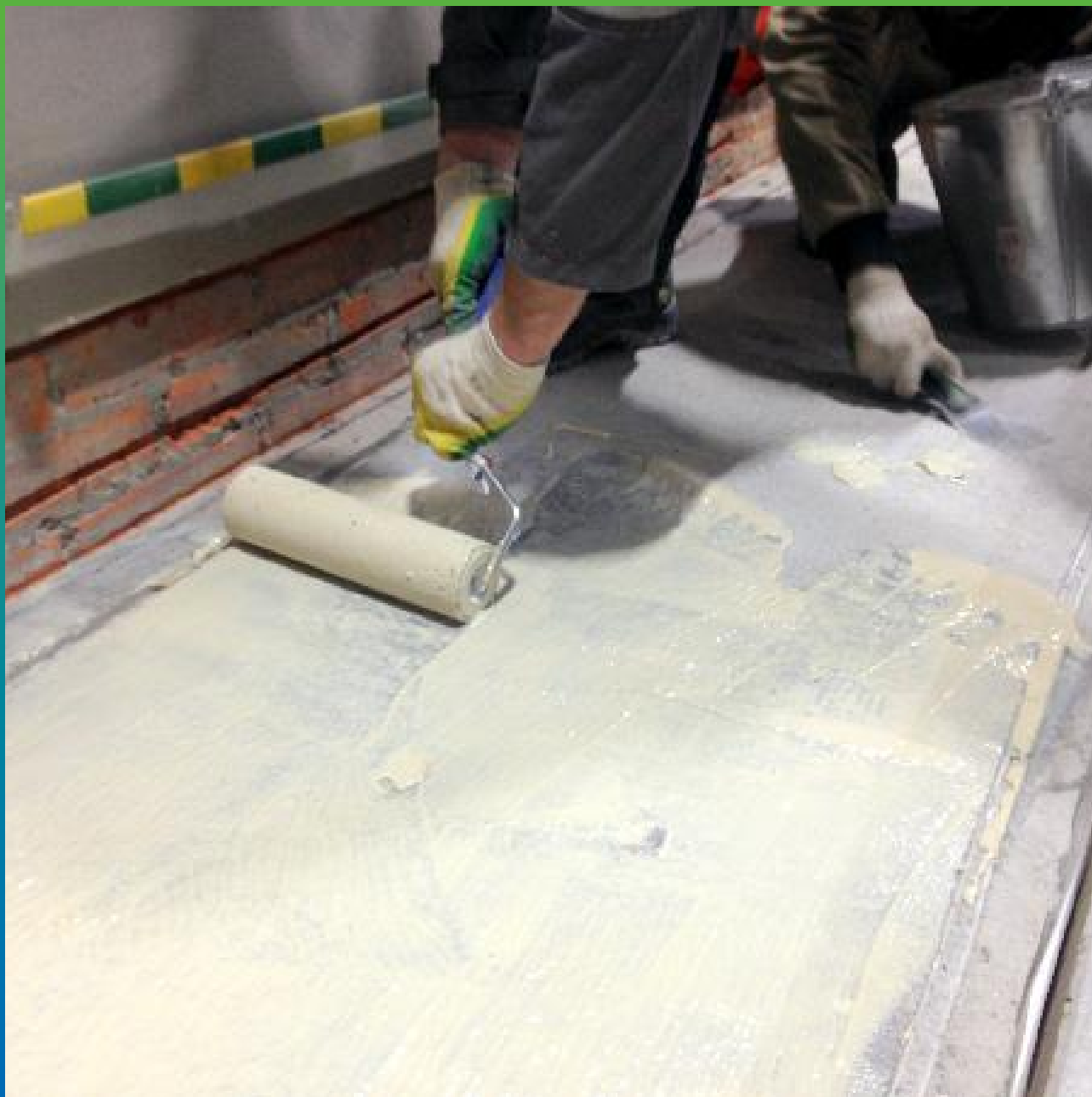
Нанесение грунта ДенТоп ПМ 600 на вертикальные и горизонтальные поверхности