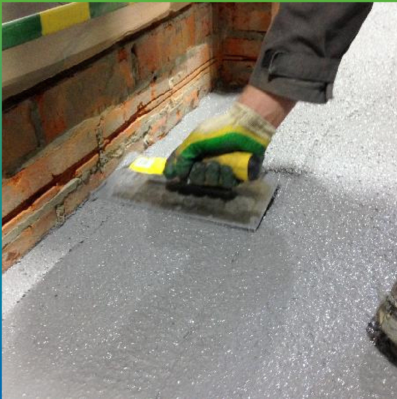
Заглаживание смеси Денстоп ПМ 605Тровел с помощью кельм