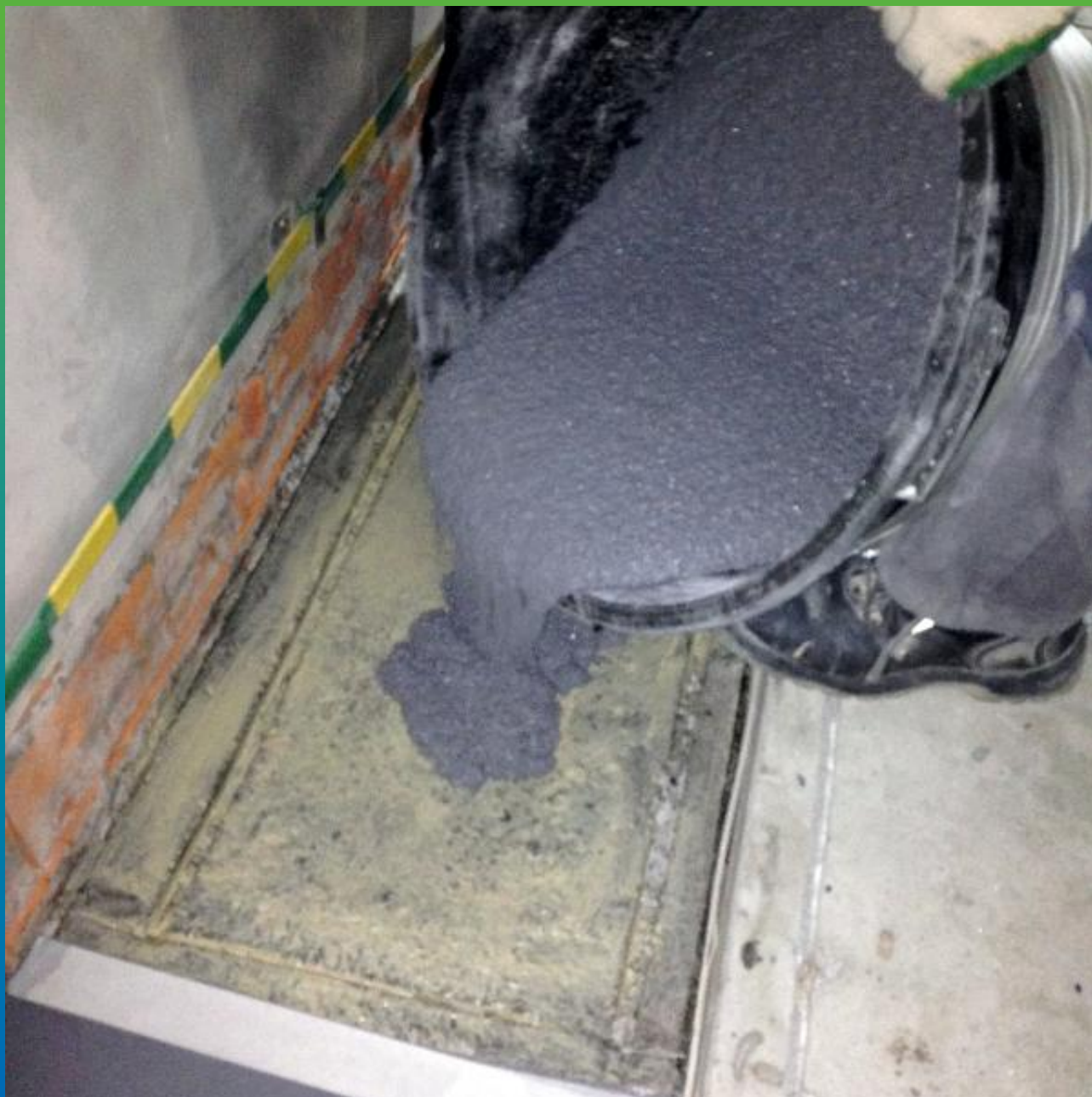
Выливание смеси Денстоп ПМ 605Тровел на основание