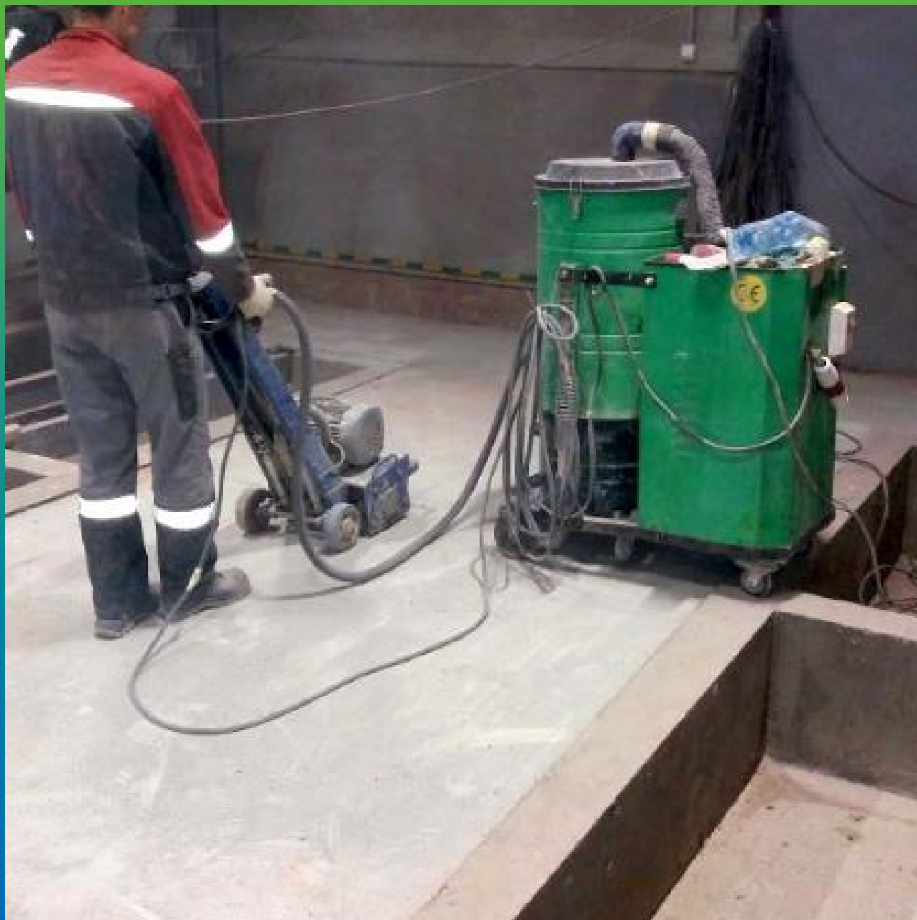
Подготовительные работы. Фрезеровка горизонтальной поверхности