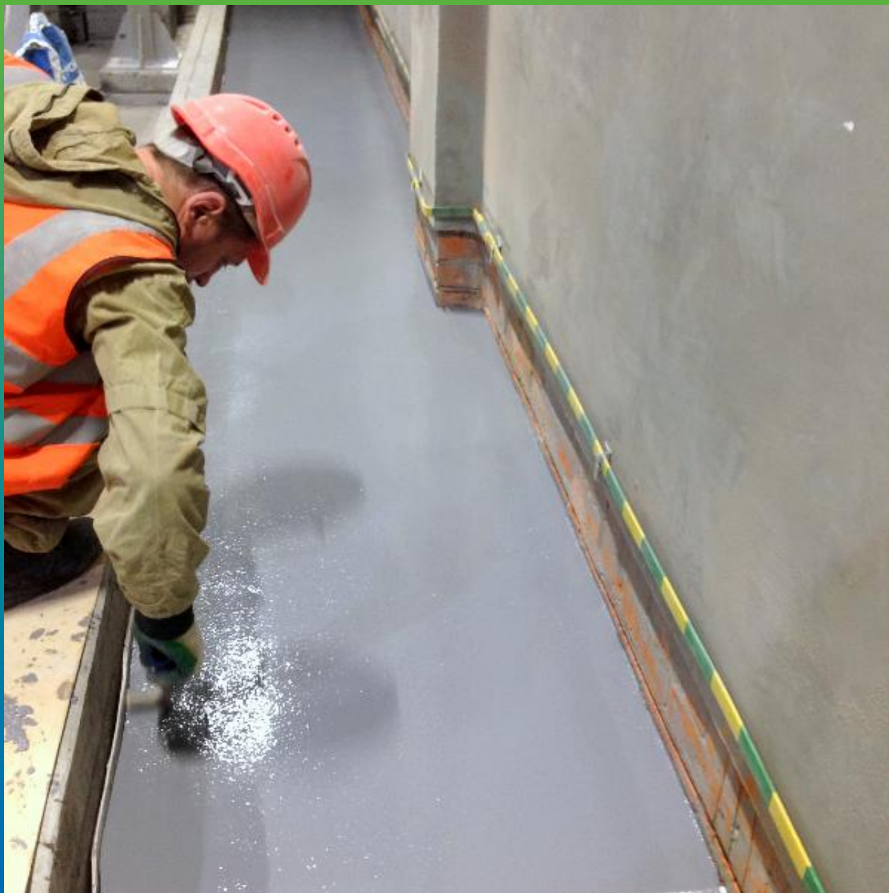
Готовая обработанная поверхность. Общий вид