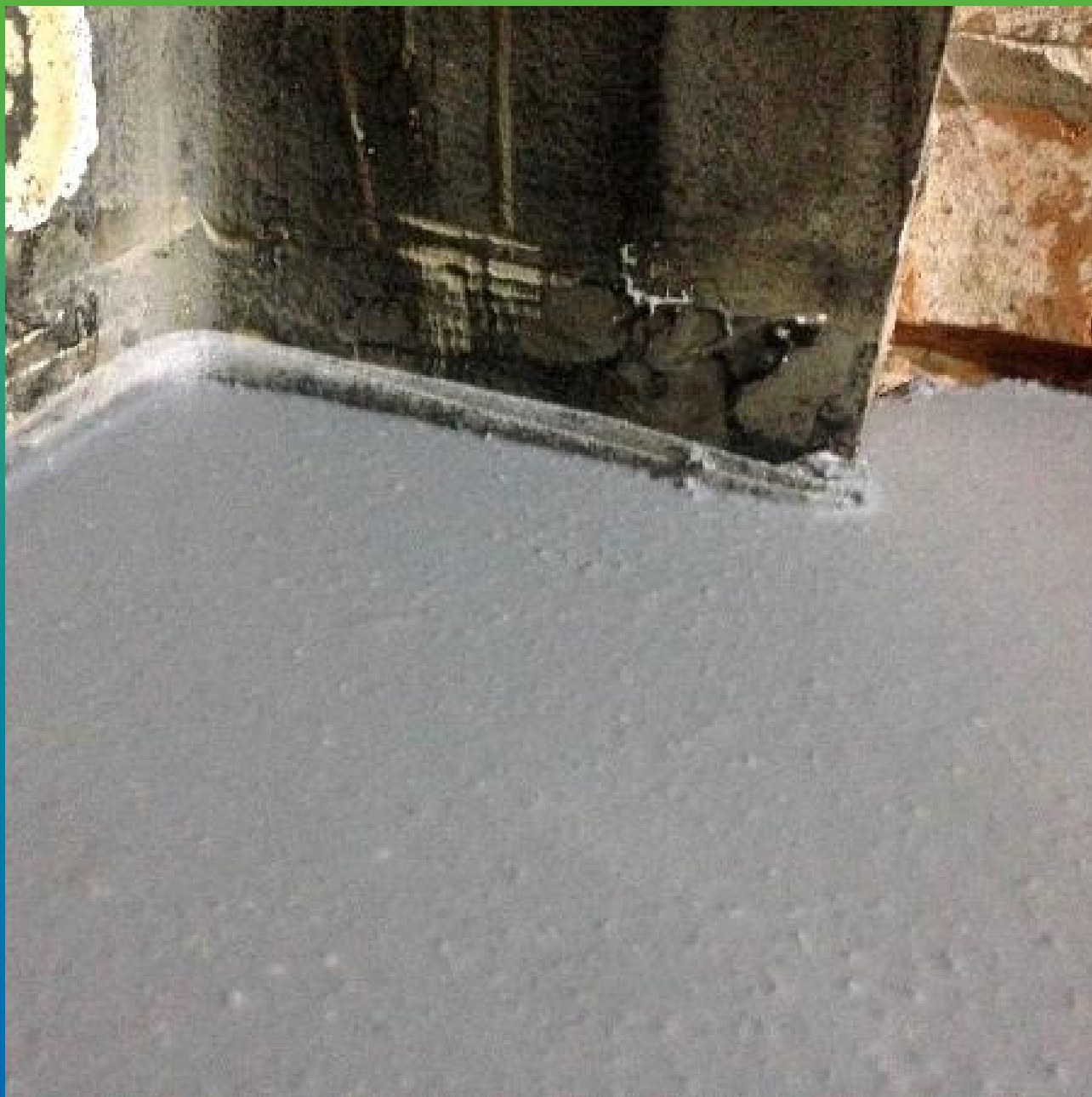
Полимеризовавшееся шероховатое покрытие пола Денстоп ПМ 605Тровел. Частный вид