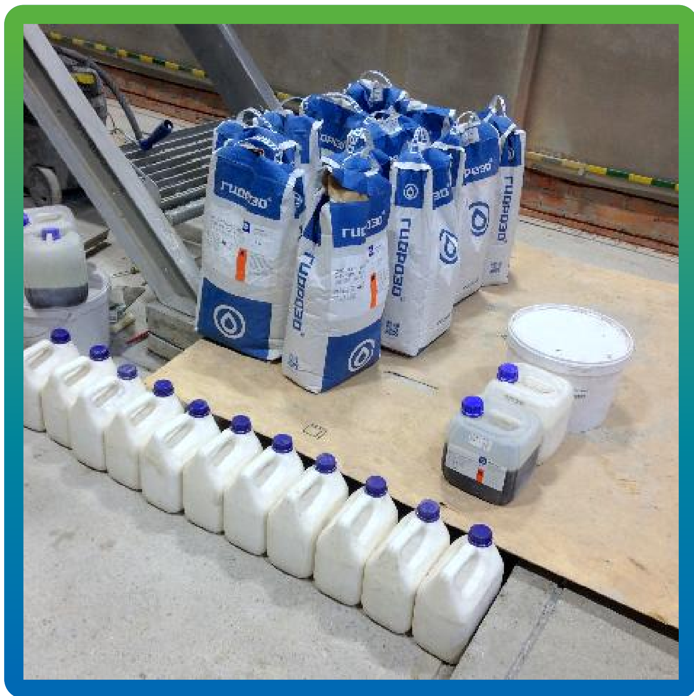
Материалы ГИДРОЗО на объекте. Общий вид