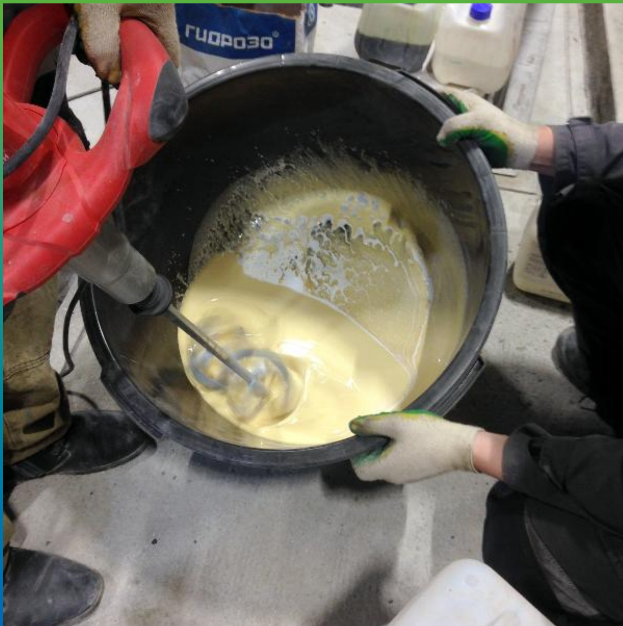
Смешение и перемешивание жидких компонентов Б1+Б2 Денстоп ПМ 605 Тровел - наливания шероховатая версия ЦПУ