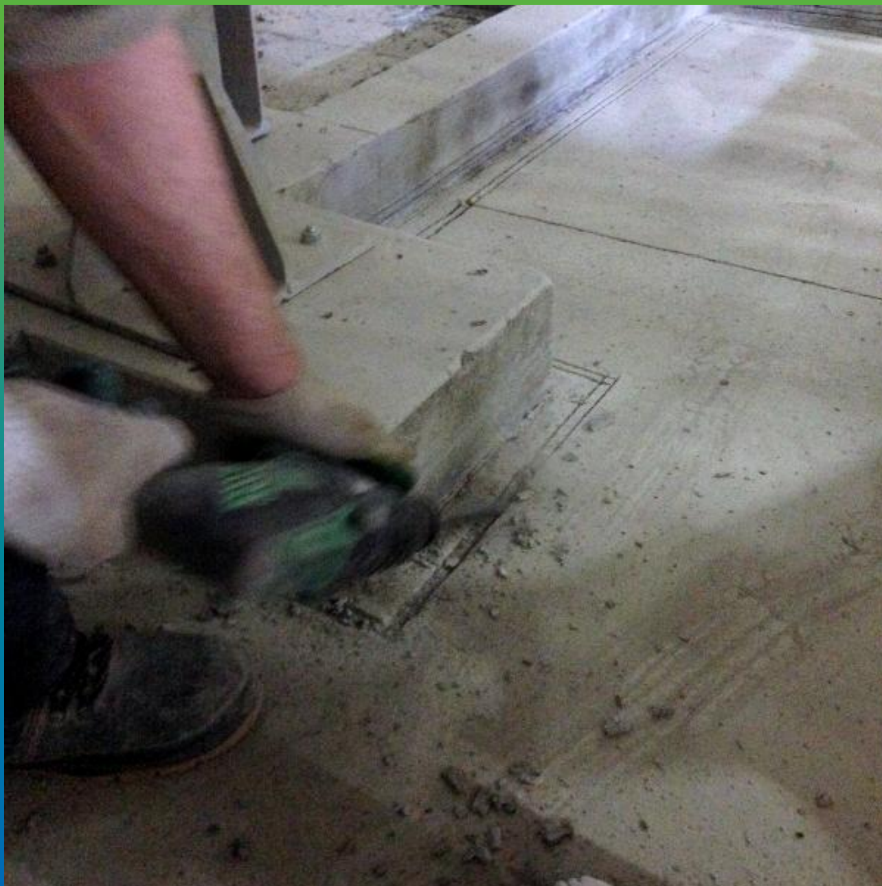
Подготовительные работы. Устройство двойного анкерного пропила под "замок".