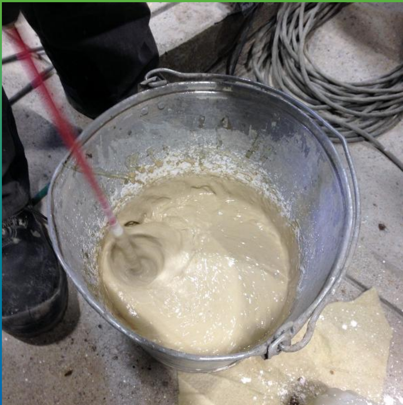
Смешение компонентов А+Б1+Б2 грунта Денстоп ПМ 600 миксером на малой скорости