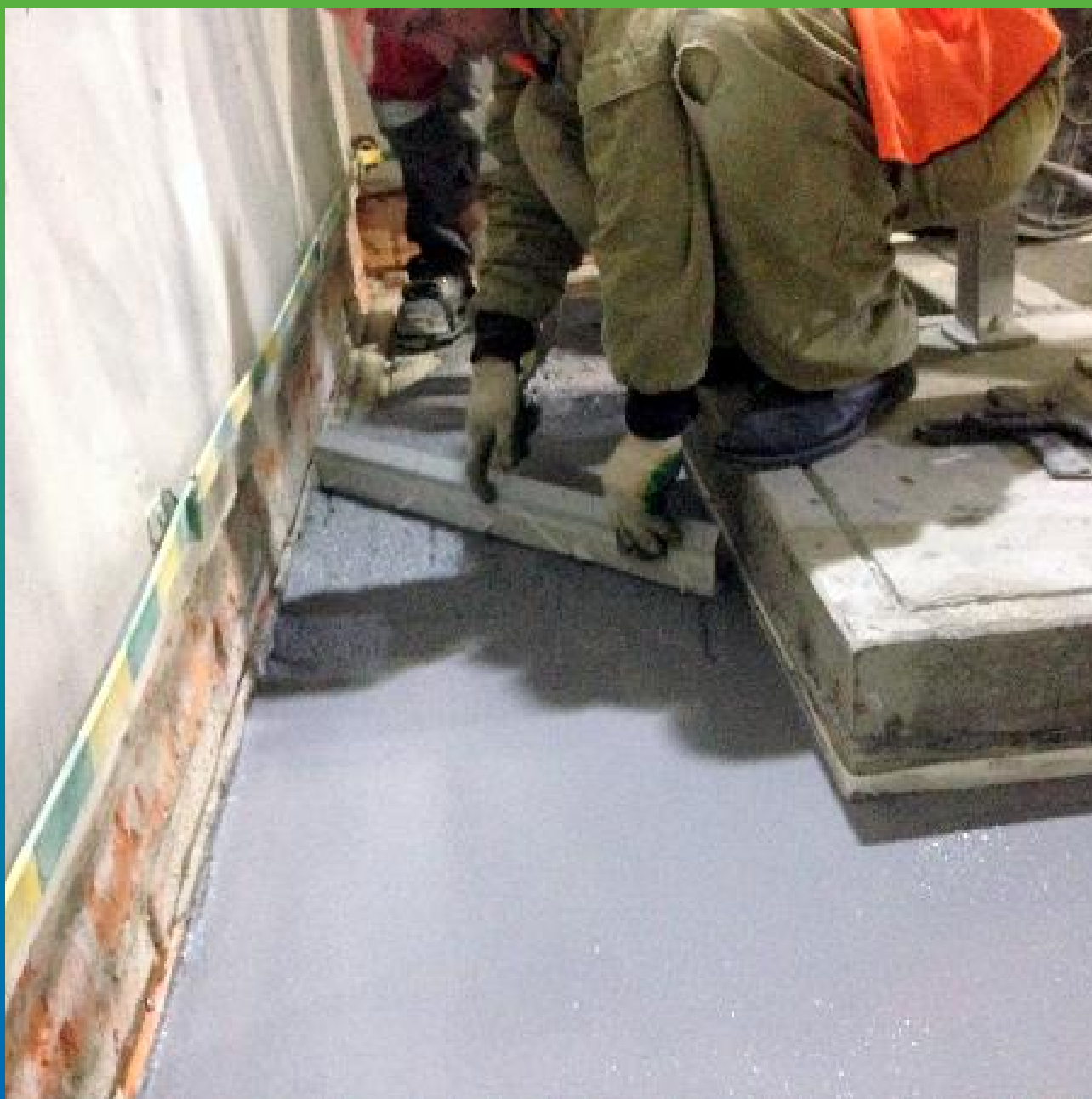
Распределение смеси Денстоп ПМ 605Тровел с помощью настроенной на необходимую толщину ракелем