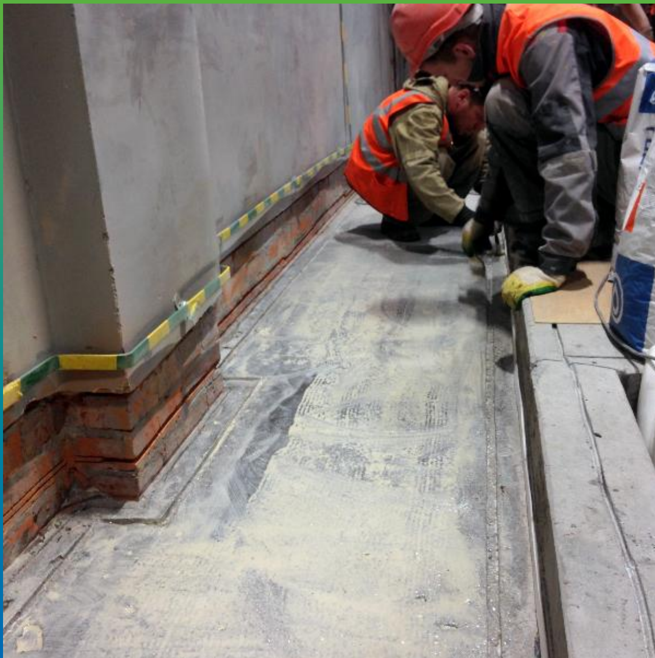
Прогрунтованный участок. Общий вид