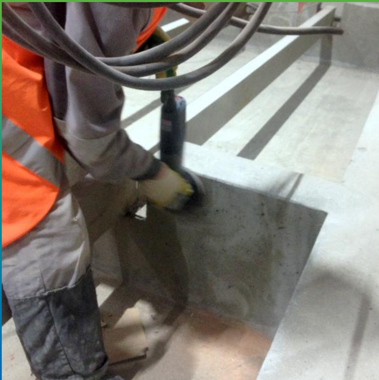
Подготовительные работы. Шлифовка вертикальных поверхностей