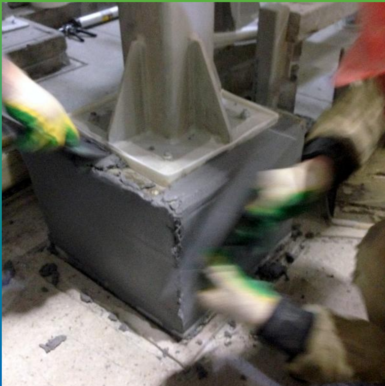
Нанесение кальмами и шпателями смеси Денстоп ПМ 605ФК на вертикальные участки