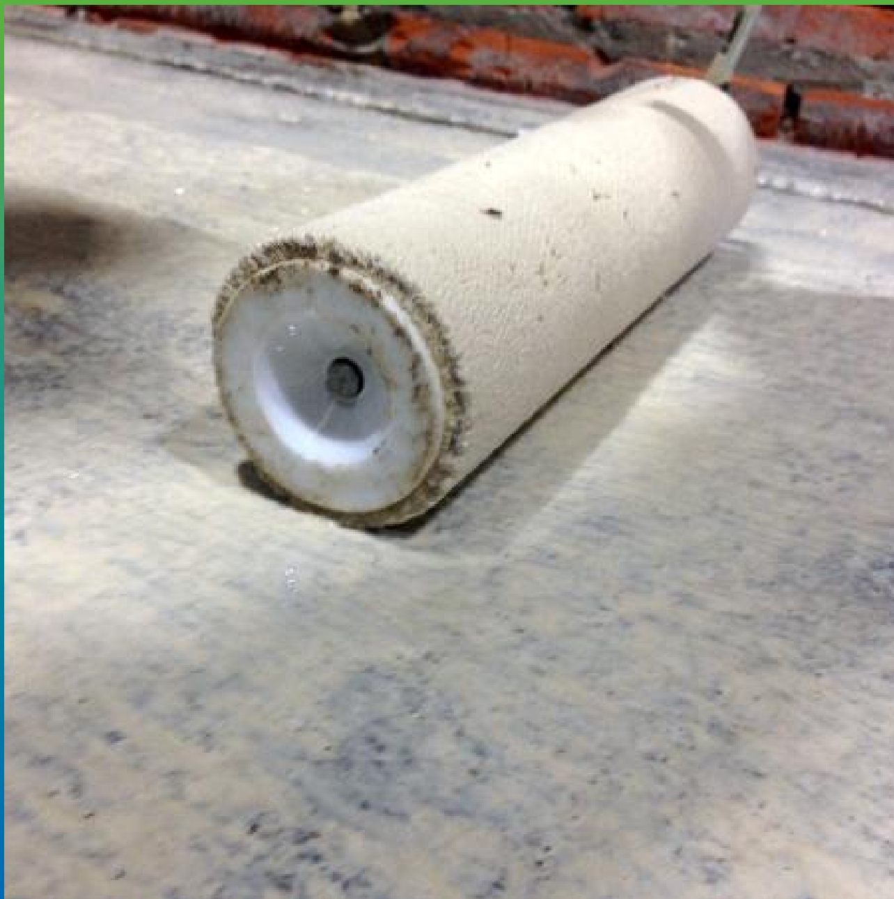
Нанесение грунта ДенСтоп ПМ 600 коротковорсовым велюровым валиком.