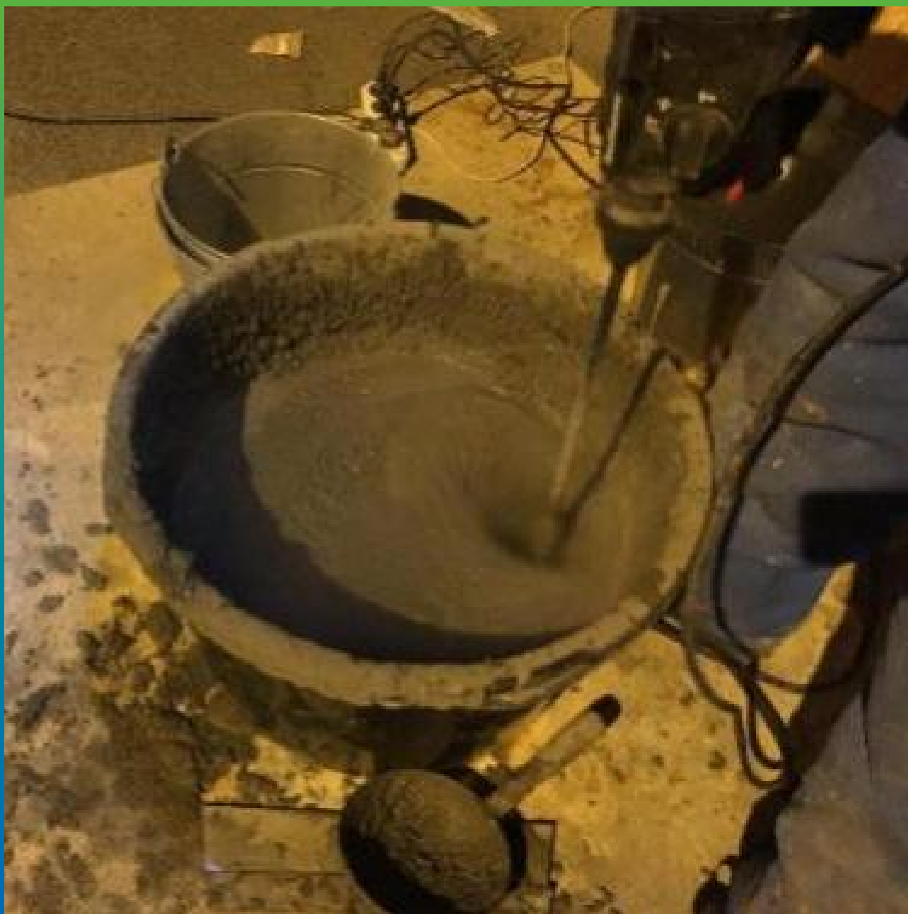
Затворение Стармеекс ФМ7 Зима с теплой водой