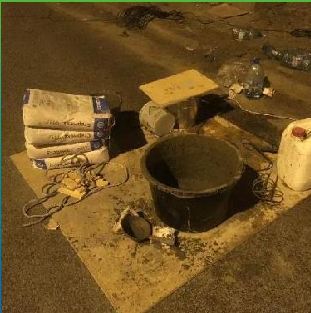
Вид материалов на объекте