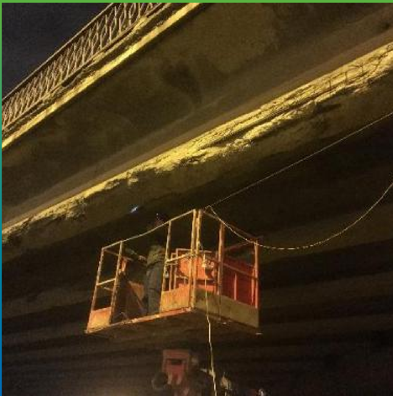
Удаление слабых участков бетона